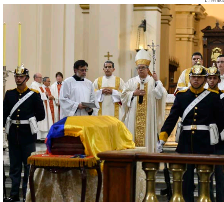
La despedida del artista en el Museo Botero.

Los familiares que intervinieron en el acto, que finalizó con una actuación del Coro Nacional de Colombia y la Sinfónica Nacional, destacaron por encima de todo el amor que tenía Botero por Colombia y su “amabilidad” como persona • (EFE en Bogotá)