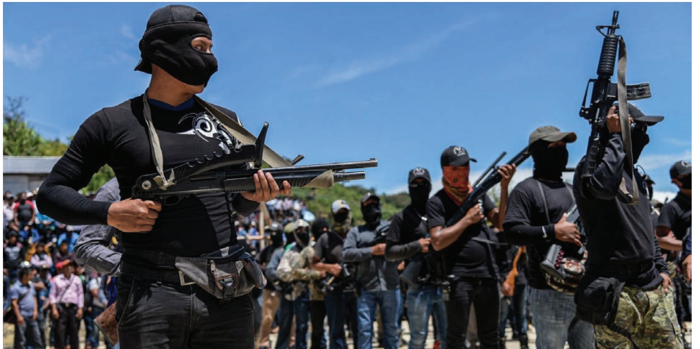
Cada año es mayor el número de personas que reciben alguna contraprestación a cambio de formar parte de las bandas.

Lo que sí logra explicar el paper , es que estos grupos criminales han ido cre-