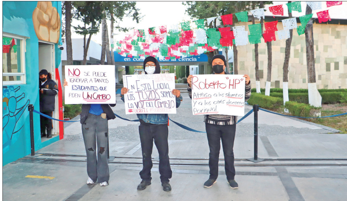
RAÍZ. Manifiesta alumnado que el directivo tiene comportamientos alejados de los lineamientos adecuados que rigen a la institución, por lo que "debe ser destituido, junto con su equipo, quienes violentan de manera reiterada el reglamento a raíz de que ha protegido a docentes y personal administrativo, señalados de acoso por jóvenes estudiantes".