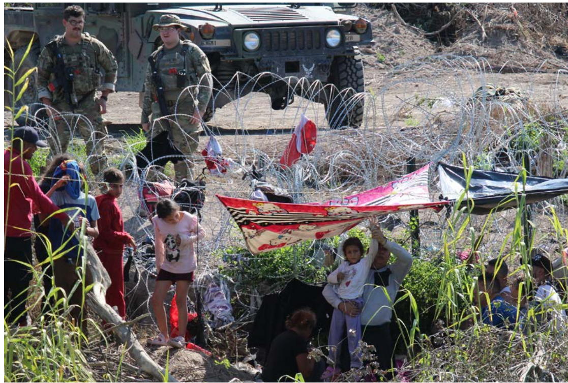
Migrantes venezolanos retenidos en la intemperie por agentes de la Guardia Nacional.

Las familias llegaron a Estados Unidos, pasando el caudal del río Bravo el domingo a las 19:00 horas local.