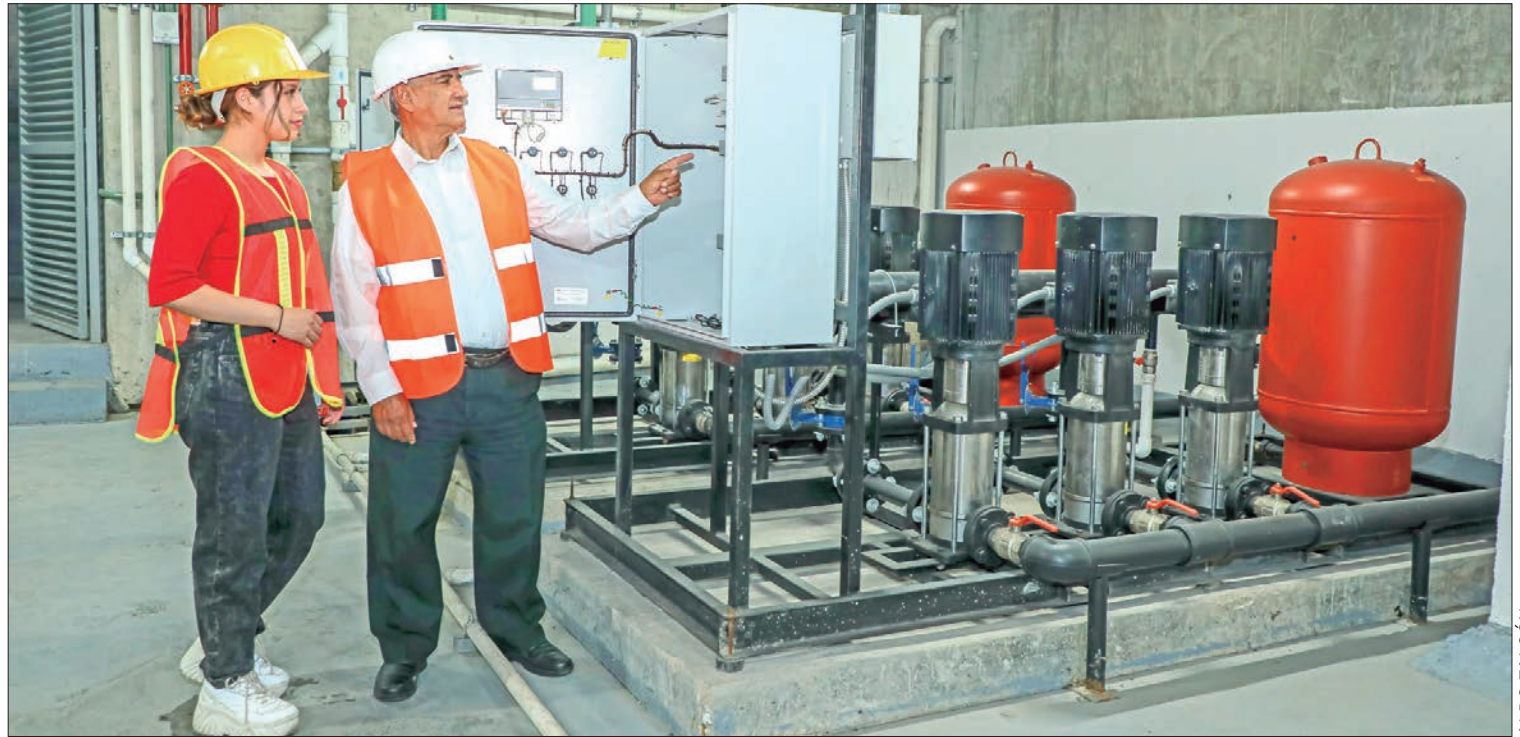
HORACIO RÍOS. Subsecretario de Fomento Económico recordó que este programa también busca apoyar a la juventud egresada a obtener experiencia, práctica, aplicar sus conocimientos académicos e iniciar su desarrollo profesional.

"Aunado a las capacitaciones mencionadas, también accedieron a la bolsa de trabajo, obra de teatro, asesorías jurídicas, talleres y certificaciones, registro de nuevas marcas, consultas médicas generales, además de orientación por parte del SA-RE", concluyó el funcionario. (Staff Crónica Hidalgo)