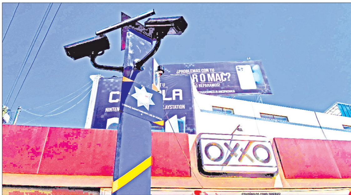
SSPTYV. Trabajo conjunto entre autoridades e iniciativa privada.

► Instalación de torres de videovigilancia para inhibir la creciente ola de asaltos a estos establecimientos