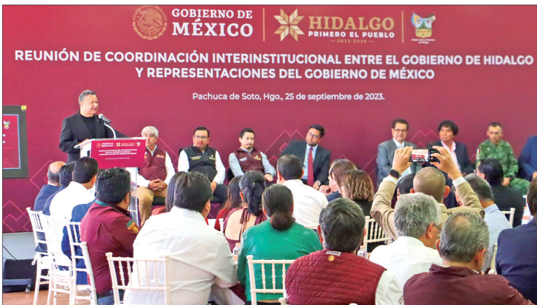
Julio Menchaca Salazar, presidió, en la Sala del Pueblo, una reunión entre su gabinete y las distintas representaciones del Gobierno de México en la entidad.