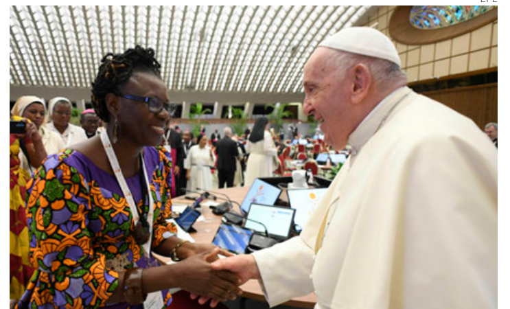
El papa saluda a una mujer que participará por primera vez en el Sínodo de Obispos.

“Nadie puede ignorar que en los últimos años hemos sido testigos de fenómenos extremos, períodos frecuentes de calor inusual, sequía y otros quejidos de la tierra que son sólo algunas expresiones palpables de una enfermedad silenciosa que nos afecta a todos”, agregó. (EFE en Ciudad del Vaticano)