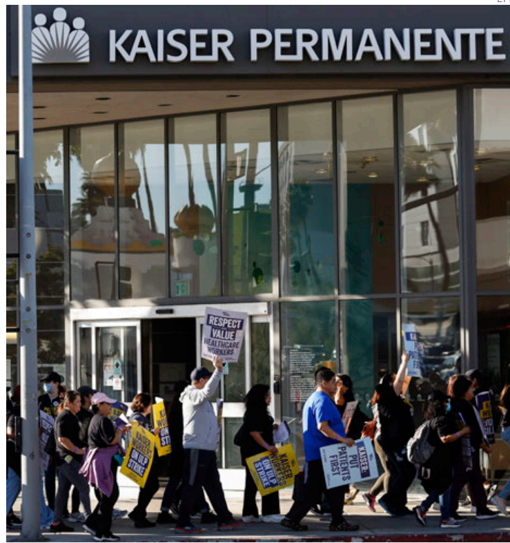
EU vive la mayor huelga de trabajadores de la salud en su historia.

Los estados más afectados por esta histórica huelga son California, Colorado, Washin-