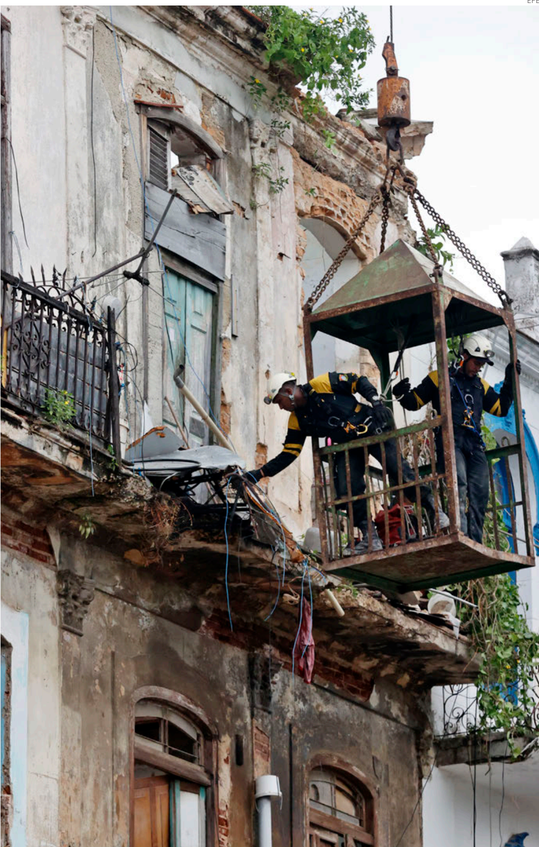
Dos bomberos inspeccionan el evidente deterioro del edificio de viviendas colapsado en La Habana Vieja.

requieren mucho tiempo para cargarse y son propensas a que acaben estallando. Esto fue lo que ocurrió mientras el dueño de una moto cargaba la batería con la ayuda de otra moto: explotó y las chispas declararon un incendio en la madera reseca del edificio que acabó derrumbándose, pasto de las llamas, matando a siete de sus residentes.