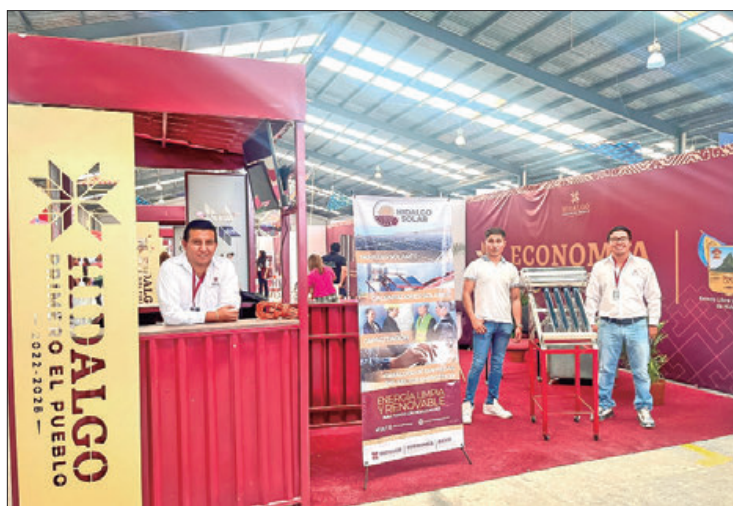
LABOR. Los negocios son el resultado del acompañamiento que realiza la Sedeco.

Las unidades productivas identificadas con la razón social Joyería OTAMIA, Huevo orgánico Natu-xa y Pantalones bordados AI, fueron ubicadas en la