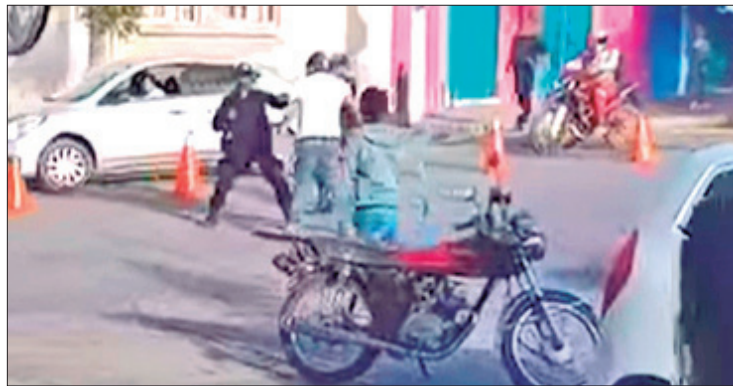
HECHOS. Una vez que los ánimos subieron de tono, un policía municipal retó a golpes a un automovilista.

Se desconoce con precisión cuál fue el proceso que se siguió para dar salida a este percance, pues conforme avanzaban los diálogos "los ánimos subieron de tono" y en cierto momento un elemento de Seguridad Pública terminó retando a