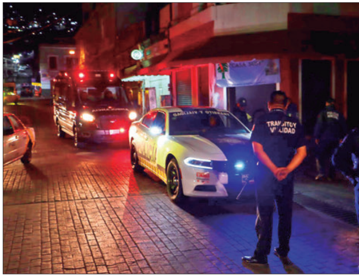
NEGOCIACIÓN. Uno de los acuerdos fue incrementar los rondines de vigilancia por medio de la Policía Municipal.

El Comité Fraccionamientos del Sur difundió que, en los recientes días, personal del área de Vinculación de la Secretaría de Seguridad Pública, Tránsito y Vialidad (SSPTYV) de Pachuca se reunieron con representantes de distintos fraccionamientos y privadas para dar respuesta a los