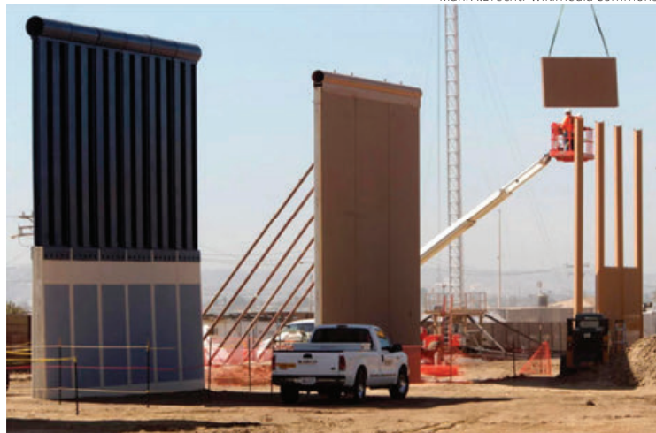
Prototipo de muro fronterizo en el condado de Starr.

En parte del valle del Río Bravo habrá barreras físicas y vías para “prevenir la entrada” irregular