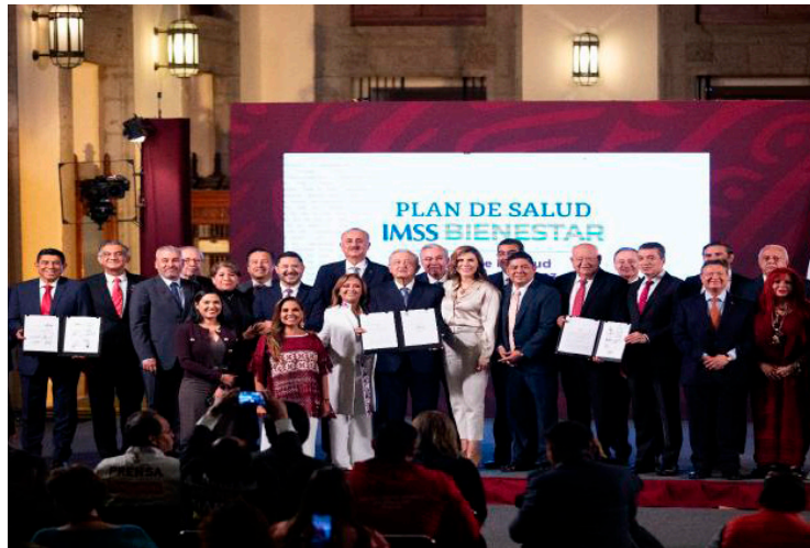
El presidente López Obrador y mandatarios de Morena suscribieron el acuerdo.

de 66.4 millones de personas sin seguridad social, el IMSS-Bienestar atenderá a 53.2 millones de personas, equivalente a 80.2 por ciento.