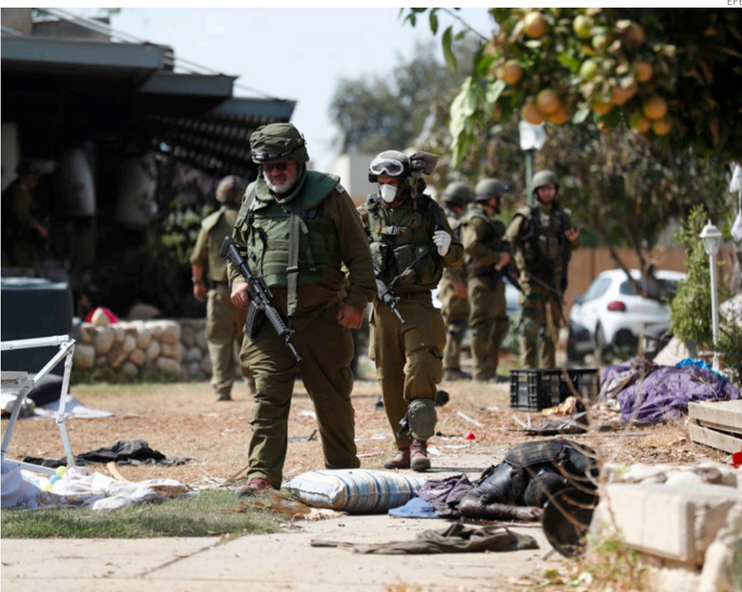
Soldados israelíes en el masacrado kibutz de Kfar Aza, cerca de la frontera israelí con Gaza.