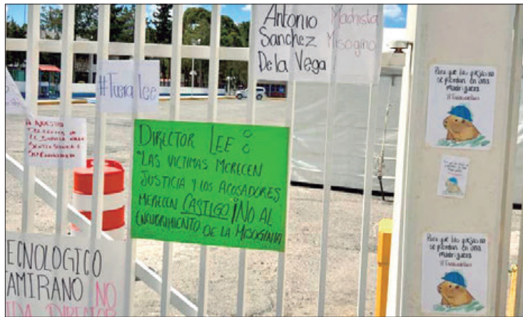
ESO SÍ. Rechazaron que estén de acuerdo en que este grupo de alumnos que busca recabar firmas electrónicas para la apertura de la escuela, así como que soliciten información personal de los estudiantes e incluso acceso al correo electrónico institucional.

El día de ayer los estudiantes sostuvieron una reunión con padres de familia, personal docente