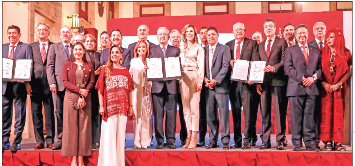
BONDADES. Acceso y la cobertura universal de salud sin discriminación.

Por su parte el director general del IMSS, Zoé Robledo Aburto, explicó que con este convenio se consolidará el sis-