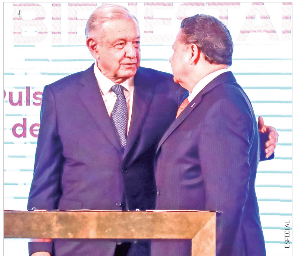
Atendiendo nuestro compromiso para brindar servicios de salud como los merece el pueblo de México e Hidalgo, oficialmente somos parte de IMSS-Bienestar: destacó el gobernador, junto a otros mandatarios estatales y el presidente.

Junto al presidente Andrés Manuel López Obrador y de 22 gobernadoras y gobernadores del país, el mandatario hidalguense, Julio Menchaca Salazar, firmó el Acuerdo Nacional IMSS-Bienestar con el objetivo de garantizar el acceso y la cobertura universal de salud sin discriminación, a lo largo de todo el territorio nacional. Desde la conferencia matutina, este 10 de octubre, el titular del Ejecutivo federal destacó este acto de voluntad política que marca un parteaguas a escala internacional, al acercar servicios integrales de salud a todos los sectores de la sociedad, sobre todo de aquellos grupos históricamente marginados. .3