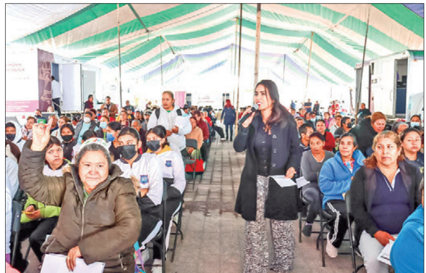
RECORRIDOS. A menos de un año del comienzo de estas acciones, ya se han visitado 42 municipios.