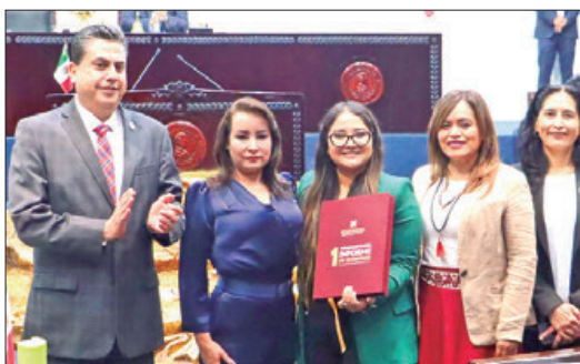
Comparecencias de los secretarios en Congreso de Hidalgo.

■ Julio Menchaca respalda estrategia para garantizar el acceso y la cobertura universal de salud sin discriminación, para todo México; acompañamientos