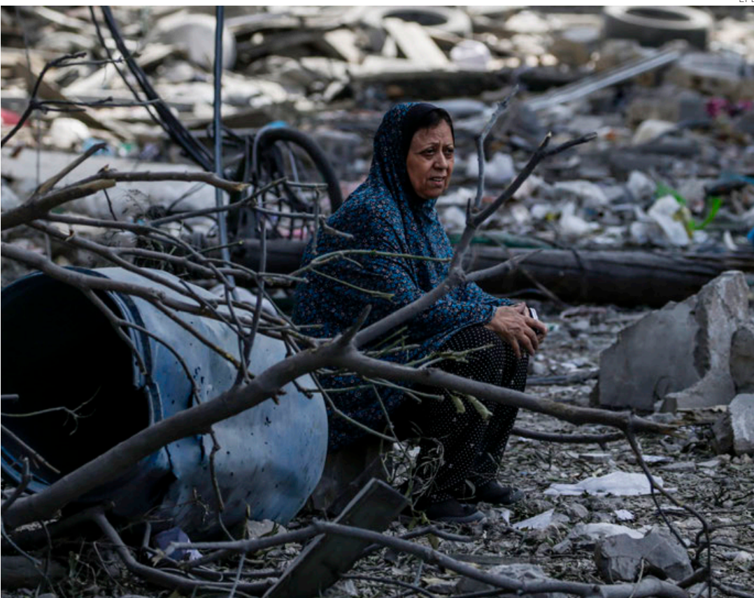
Una mujer palestina frente a las ruinas de su vivienda en Gaza, bombardeada por los israelíes.

tes sus ataques sobre Gaza y en las últimas 24 horas atacaron más de 250 objetivos y mataron a dos altos cargos de Hamás, entre ellos el ministro de Economía de Gaza.