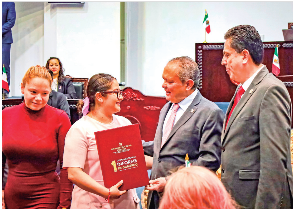
DIRECCIÓN. Del presupuesto recibido, el cual asciende a 4 mil 600 millones de pesos, 2 mil 257 se destinaron a caminos dignos.

En el marco de la glosa del Primer Informe que guarda la administración del gobernador, Julio Menchaca Salazar, el secretario detalló que, del presupuesto recibido, el cual asciende a 4 mil 600 millones de pesos (mdp), 2 mil 257 se destinaron a caminos dignos, mil 73 para sistemas de agua y drenaje, 879 a espacios públicos, 291 a calles y vialidades, mientras que 114 se encauzaron a