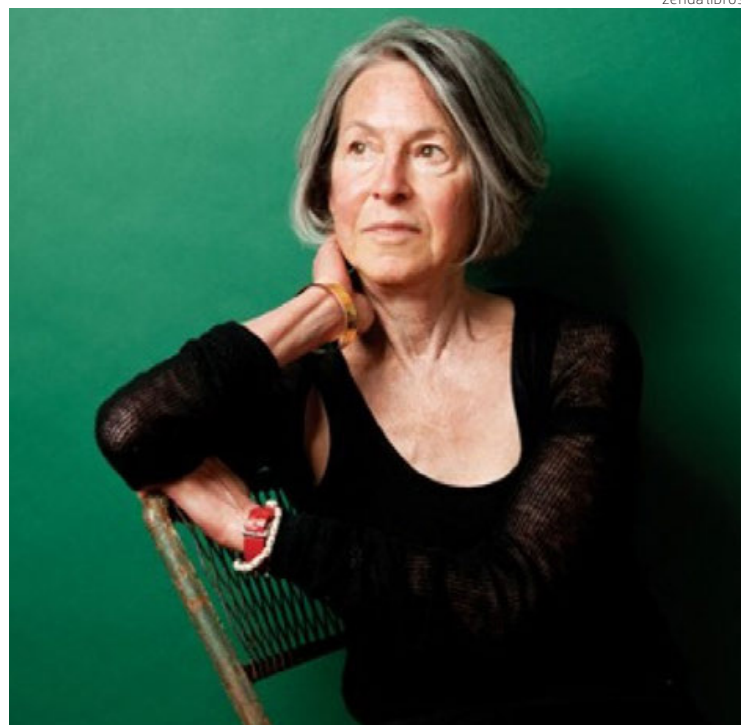
La poeta Louise Glück.

«Para mí es tan obvio que escribir poesía es lo más milagroso que se puede hacer que tengo que recordarme a mí misma que no todo el mundo en el mundo quiere ser poeta. Mucha gente