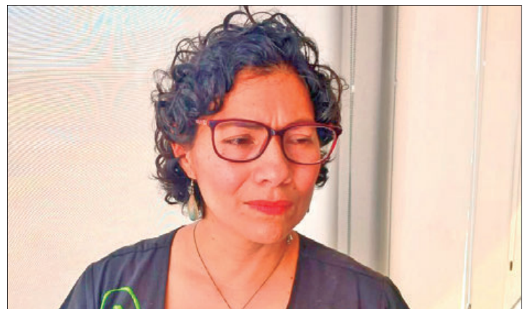
REGLAS. Los partidos y coaliciones están obligados a postular a candidatas en al menos 25 ayuntamientos donde nunca gobernaron mujeres.

Mientras algunos partidos políticos en Hidalgo respaldan di-