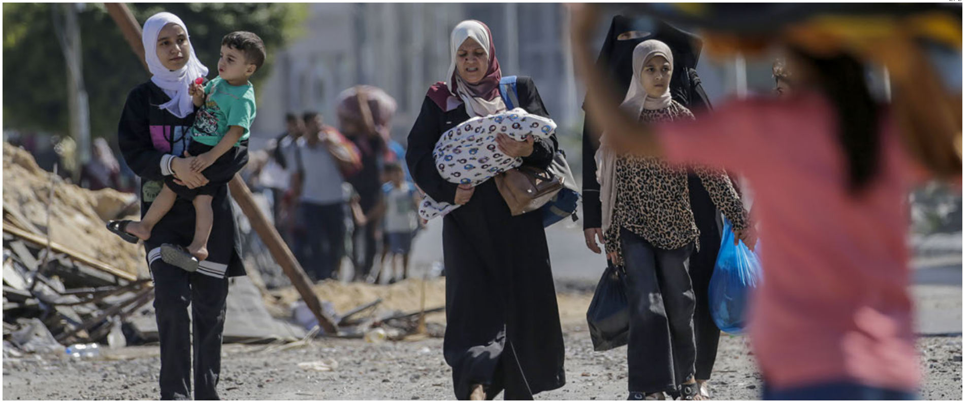
Residentes evacúan el norte de Gaza tras la orden del Ejército israelí.