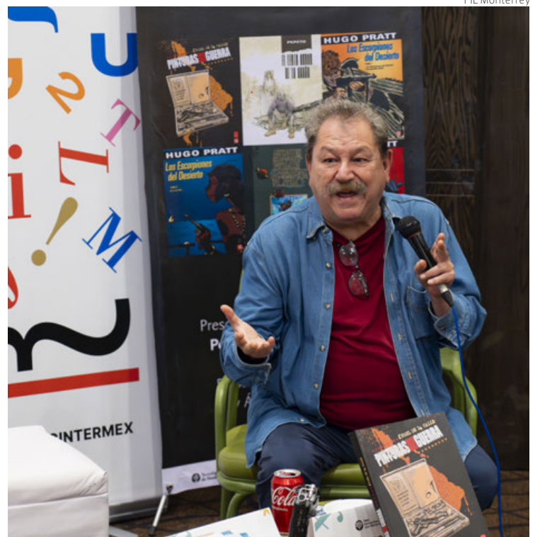
Paco Ignacio Taibo II.