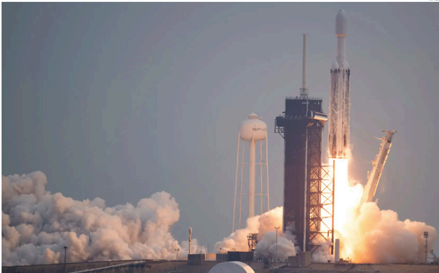
El despegue de la misión Psyche de la NASA.

Tras un viaje de seis años, llegará al objeto estelar que daría pistas sobre el origen del centro de la Tierra y de otros cuerpos celestes