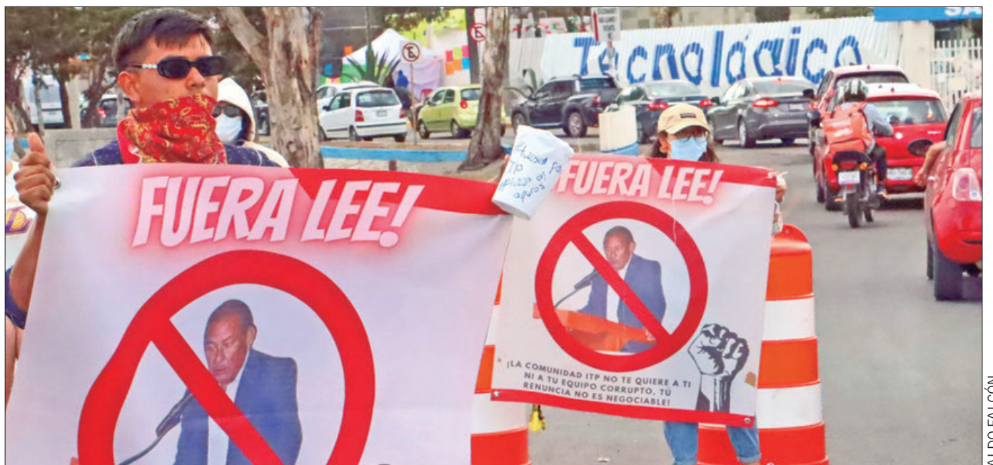
Por cerca de dos horas, un grupo de aproximadamente 20 estudiantes en paro pertenecientes al Tecnológico Nacional de México, Campus Pachuca, cerraron los carriles centrales y lateral de la carretera México-Pachuca, a la altura de su plantel, en dirección a la Ciudad de México.

Recientemente, en el Diario Oficial de la Federación (DOF) publicaron el acuerdo nacional para la federalización del sistema de salud para el bienestar que consolidará la operación de un régimen integral a fin de que las 23 entidades federativas firmantes concurren con el gobierno federal, mediante el mencionado organismo descentralizado creado apenas el 31 de agosto del 2022. .3