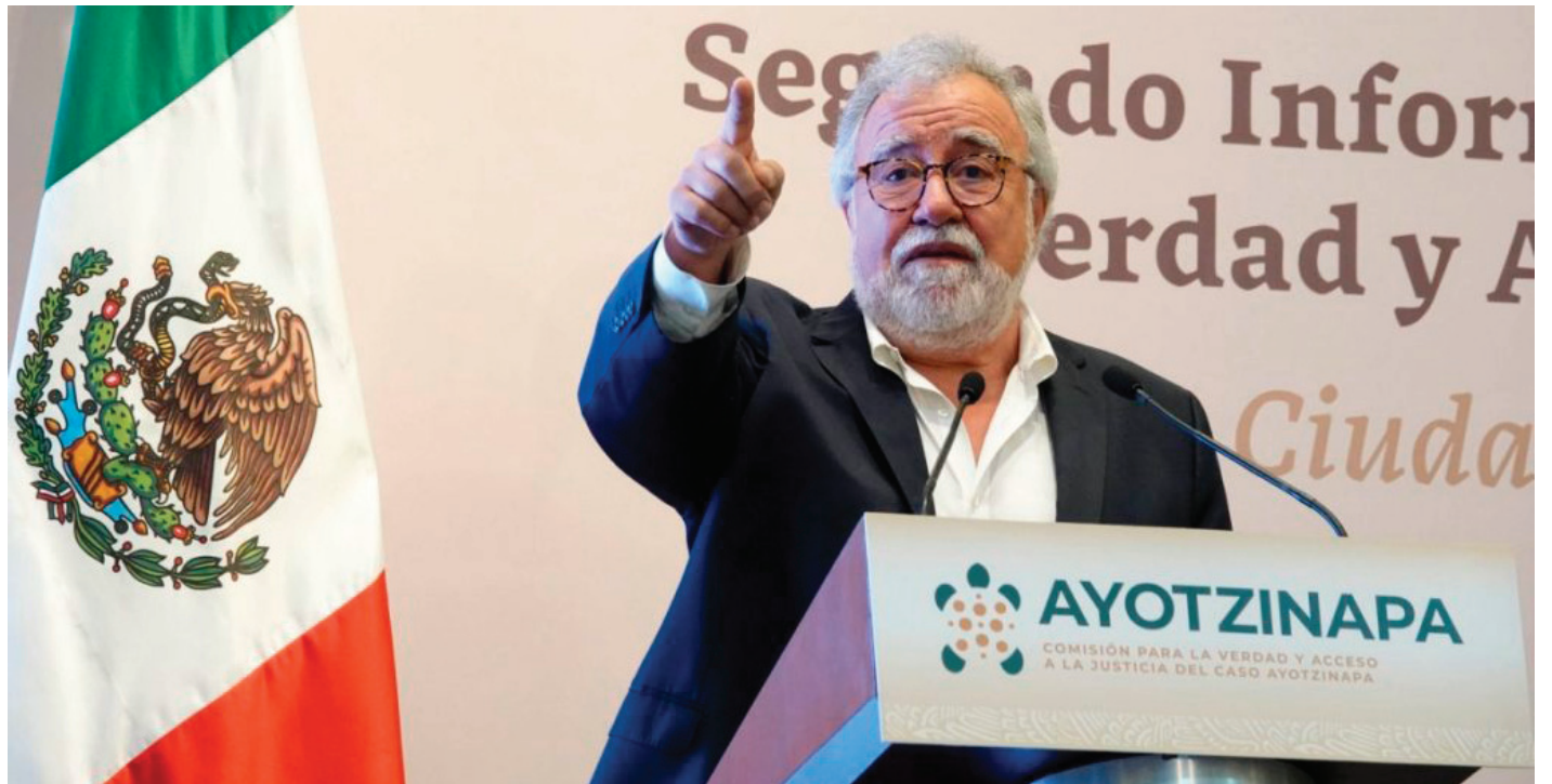
Alejandro Encinas renuncia a la Comisión de la Verdad; Arturo Medina es su sustituto.

«Se esgrime que se solicitó o se usó como argumento lo del protocolo de Estambul que nunca se realizó (falso; luego cómo