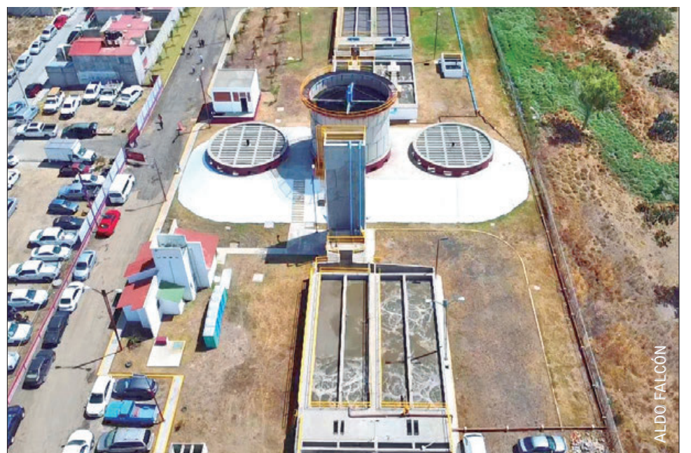
CONTRARRESTAN DESABASTO DE AGUA. Arrancaron los trabajos de perforación del Pozo 4, en la colonia La Providencia, en el municipio de Mineral de la Reforma.