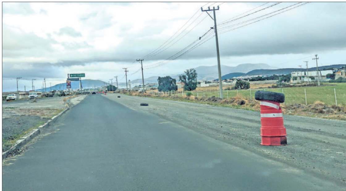
OPINAN. Posiblemente la falta de presupuesto fue lo que mantuvo ausentes a las brigadas de trabajadores.