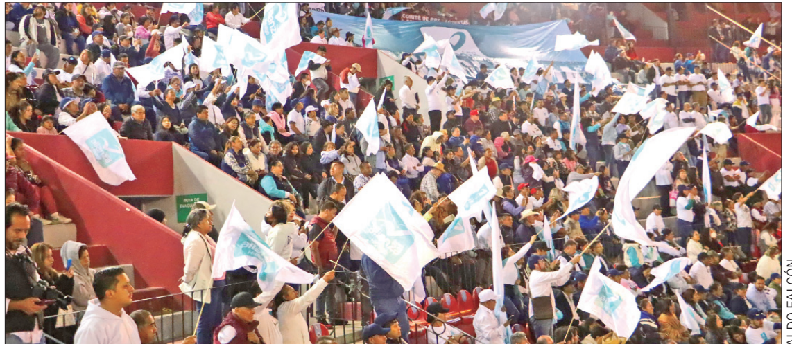
TIEMPO. Del 20 de noviembre al 18 de enero corresponde la precampaña.

Por su parte, el Partido Revolucionario Institucional (PRI) estableció el método de selección