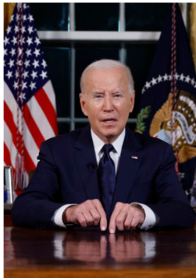
Mensaje a la nación del presidente Biden desde el Despacho Oval.

estadounidense el apoyo a Israel es casi unánime, en los últimos días en las calles de Estados Unidos se han sucedido las protestas en favor de Palestina y contra la participación de Estados Unidos en el conflicto.