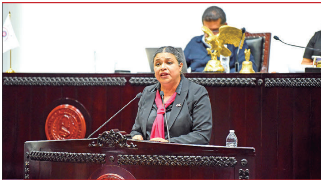
SSH. En este primer año de gestión se han sentado las bases para consolidar un sistema único, público y gratuito.

En ese sentido indicó que, pese a que actualmente se cuenta