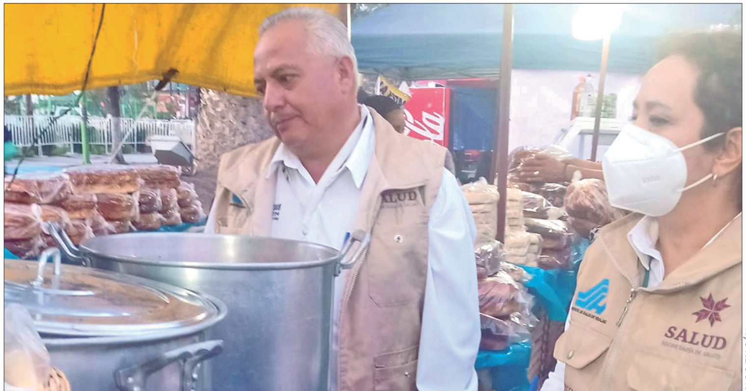
RAZONES. Han retirado de los negocios agua preparada, leche, brochetas, salsas, frituras y aceite, ya que presentaban algún tipo de contaminación y no podían ser consumidos por estar expuestos al aire y fauna nociva.

El comisionado del organismo destacó que las supervisiones se mantendrán hasta el próximo domingo cuando concluyan las festividades en el recinto ferial de Pachuca.