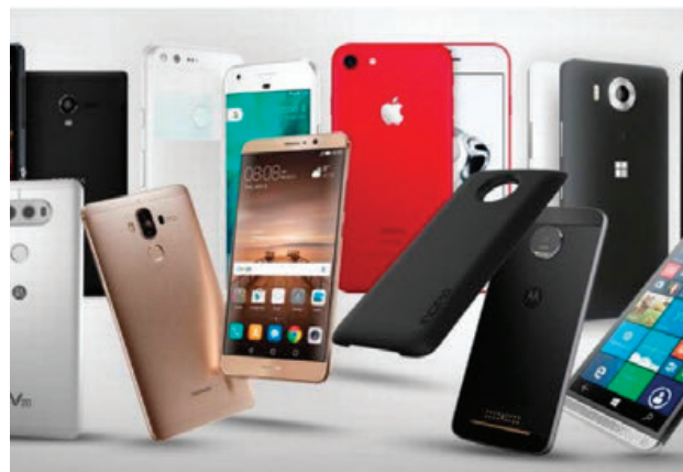
Miles de celulares llegana a México de manera irregular.

Redacción / Agencias negocios@cronica.com.mx