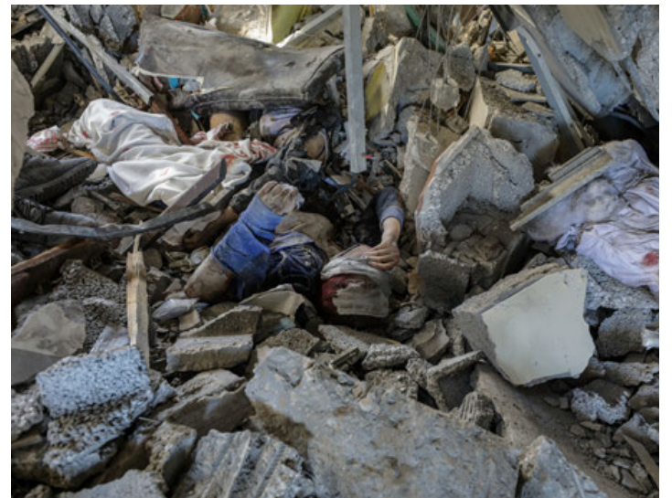
Cuerpos sin vida de dos de las 30 personas de una misma familia que murieron por un bombardeo israelí en Gaza.

Biden usó el discurso como una oportunidad para intentar convencer al pueblo estadounidense de que EU debe desem-