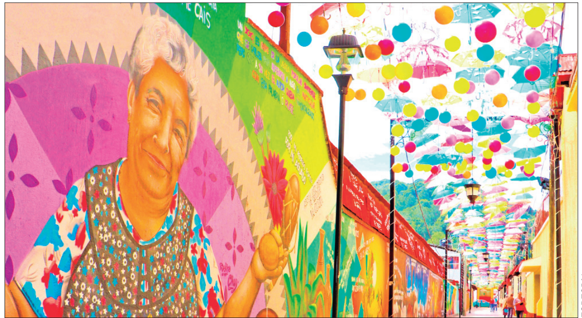
PESOS. La región destacó por sus atractivos naturales, sitios para hospedaje y gastronomía.