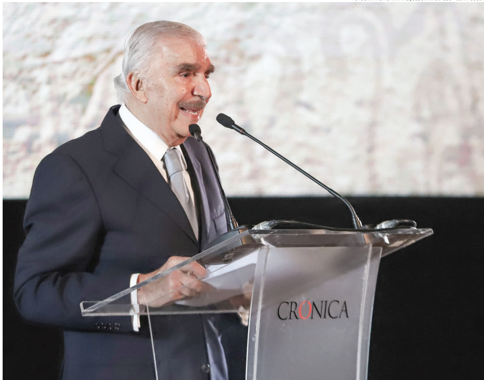
Jorge Kahwagi Gastine inaugura la ceremonia protocolaria del Premio Crónica 2023, en el Museo Nacional de Antropología.