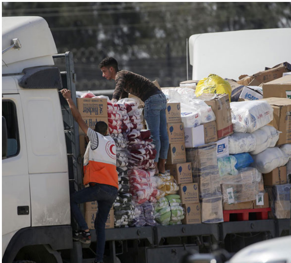
Personal de la Media Luna Roja descarga la ayuda humanitaria de un camión en Gaza.