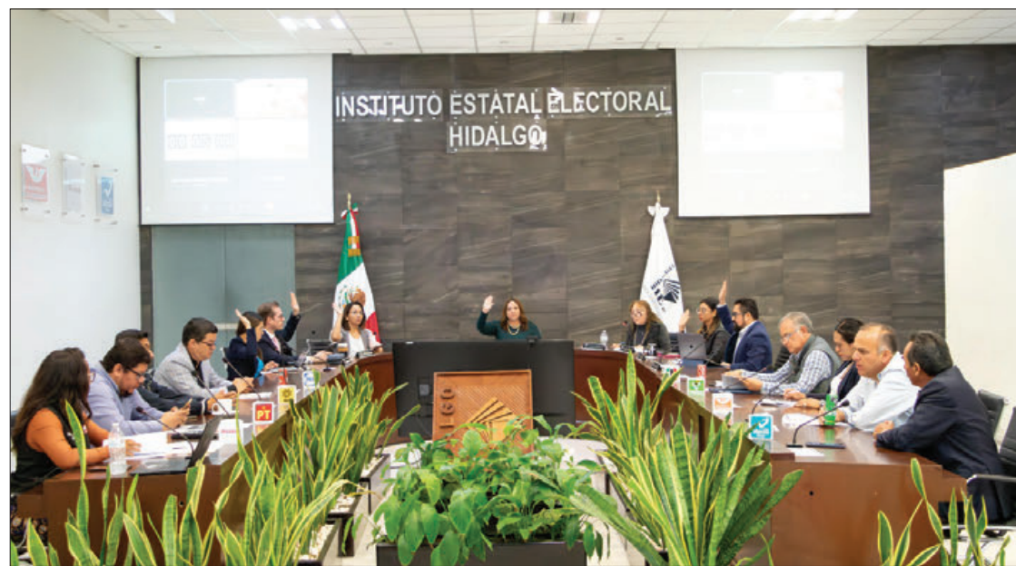
PLAZO. El 27 de octubre del presente año la fecha límite para el registro de las personas aspirantes.

men parte de los siguientes grupos de atención prioritaria, distribuidos de la siguiente manera: • 18 cargos para personas jóvenes • 3 cargos para personas adultas mayores • 2 cargos personas con discapacidad • 3 cargos para personas de la diversidad sexual y de género • 30 cargos para personas indígenas