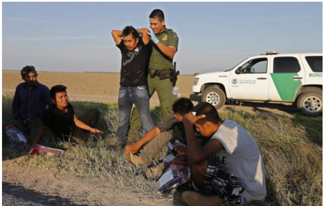
Agentes de la patrulla fronteriza de EU arrestan a inmigrantes.

frontera se dan a conocer poco más de dos semanas después de que EU anunciará la reanudación de los vuelos de deportación de migrantes hacia Venezuela, tras años de haber congelado esta práctica, como una medida para disuadir la migración.