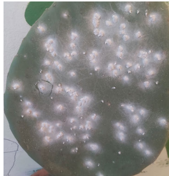
Nopal infestado con cochinilla.

Es un espacio en Santa Lucía del Camino, Oaxaca, de iniciativa ciudadana y muestra las bondades de este insecto