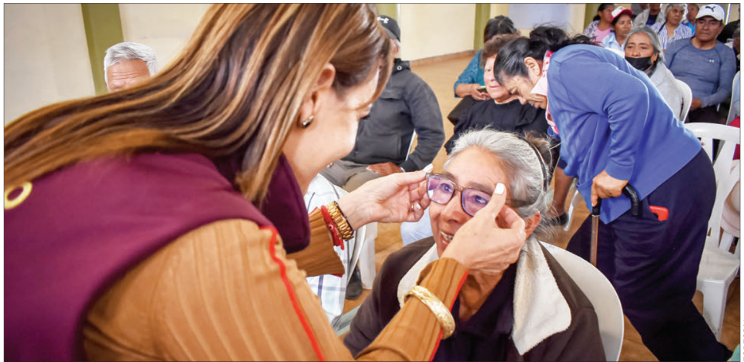
BALANCE. Se entregaron 25 prótesis dentales y 112 lentes, en beneficio de 125 personas.

Con estas actividades se da continuidad a las indicaciones de la secretaria de Salud, Zorayda Robles, de fortalecer actividades que mejoren la salud no solo de la población, sino también de los profesionales que integran la SSH. (Staff Crónica Hidalgo)