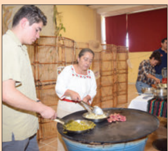
La Feria San Francisco Pachuca Hidalgo, en su edición 2023, brinda a todas y todos los visitantes, la esencia de la alegría, diversión, cultura, costumbres y las tradiciones del estado. De igual forma, continuó su celebración del Día de Muertos con el evento "Disfrázate y Participa," que generó entusiasmo entre los asistentes.