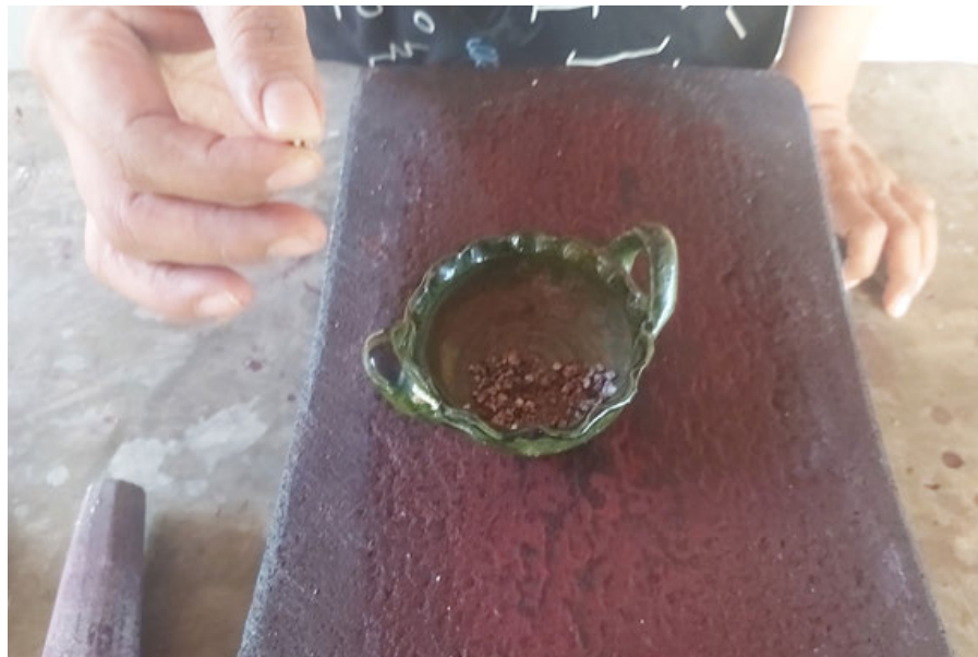
En el museo se aprecian los diferentes productos que se pueden teñir con grana cochinilla.