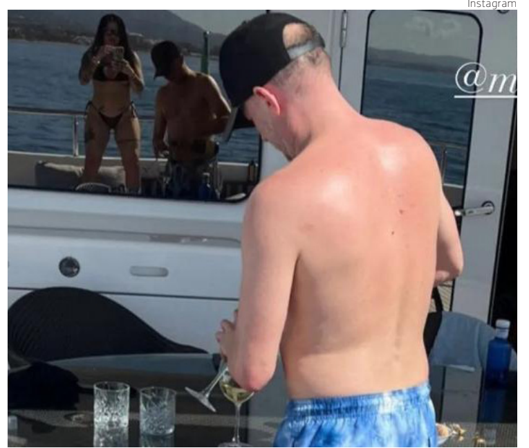
La novia de Insaurralde le hace una foto mientras llena una copa de champán en un yate en Marbella.

"Como no quiero que se me utilice para afectar al espacio político en el proceso electoral, presenté hoy (sábado) mi renuncia al cargo de jefe de Gabinete de la Provincia", indicó Insaurralde en su breve texto de dimisión, con el que tratará de evitar que el escándalo no dañe la imagen del candidato oficialista, Sergio Massa.