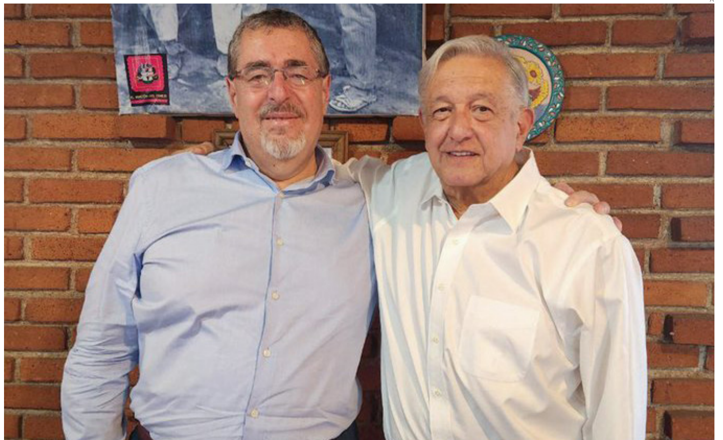
El presidente electo de Guatemala se reunió el sábado en México con Andrés Manuel López Obrador.

El sábado, el presidente Andrés Manuel López Obrador colgó en su cuenta