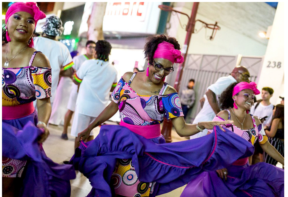
En Veracruz, la población afromexicana representa el 8.4 por ciento de la población nacional.

En la edición 27 del Festival Afrocaribeño se entregará la Medalla Gonzalo Aguirre Bel-