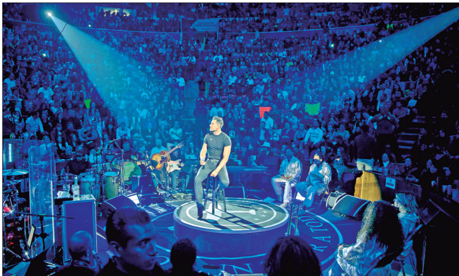
BALANCE. Más de 24 mil personas asistieron al tercer día de actividades de la feria más grande del estado.