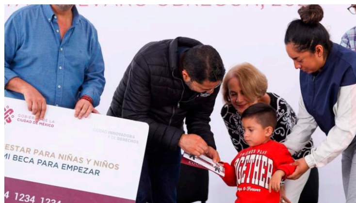
El jefe de Gobierno, Martí Batres encabezó la entrega de los apoyos.

El jefe de Gobierno, Martí Batres, destacó que dichos programas son universales, lo que significa que todos los estudiantes inscritos en la escuela recibirán estos