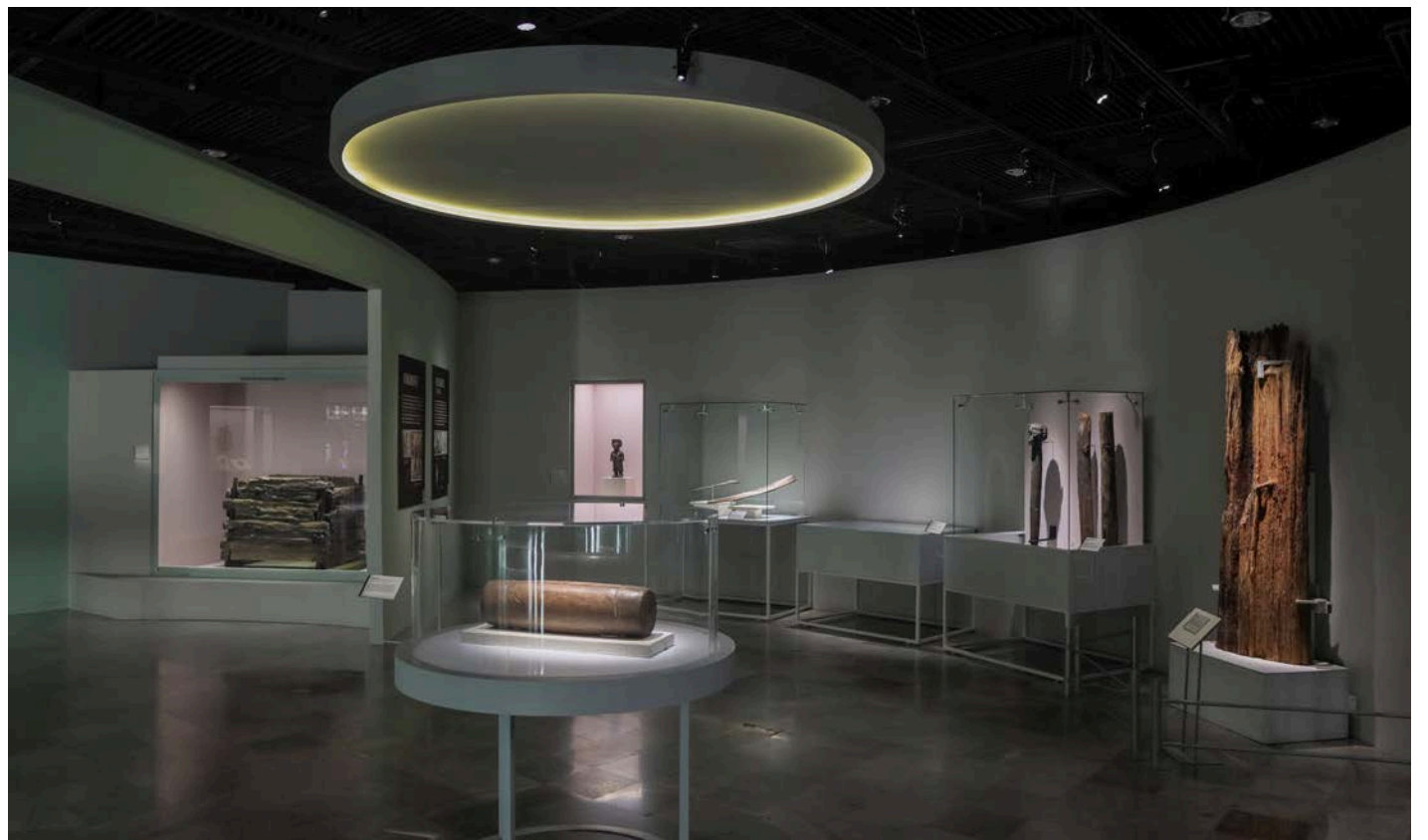
La muestra se compone por 136 objetos recuperados del recinto.

Sobre el aspecto mágico-religioso de la madera, la exposición muestra objetos rituales hallados en ofrendas que deposi-