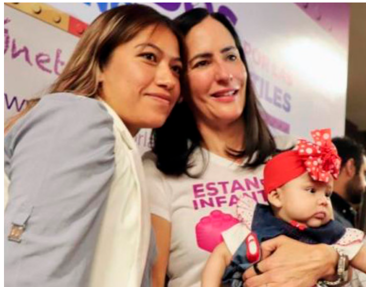
El cierre de estancias afectó a más de 18 mil niñas y niños de la CDMX.

La novedad y accesibilidad de esta plataforma destacan, ya que permite a cualquier persona, sin importar su nivel de experiencia tecnológica, firmar en apoyo al retorno de las estancias en menos de un minuto. Tan solo se necesita un teléfono inteligente, sin importar su antigüedad o marca. Limón señaló con determinación que la tecnología no será una barrera para lograr su objetivo.