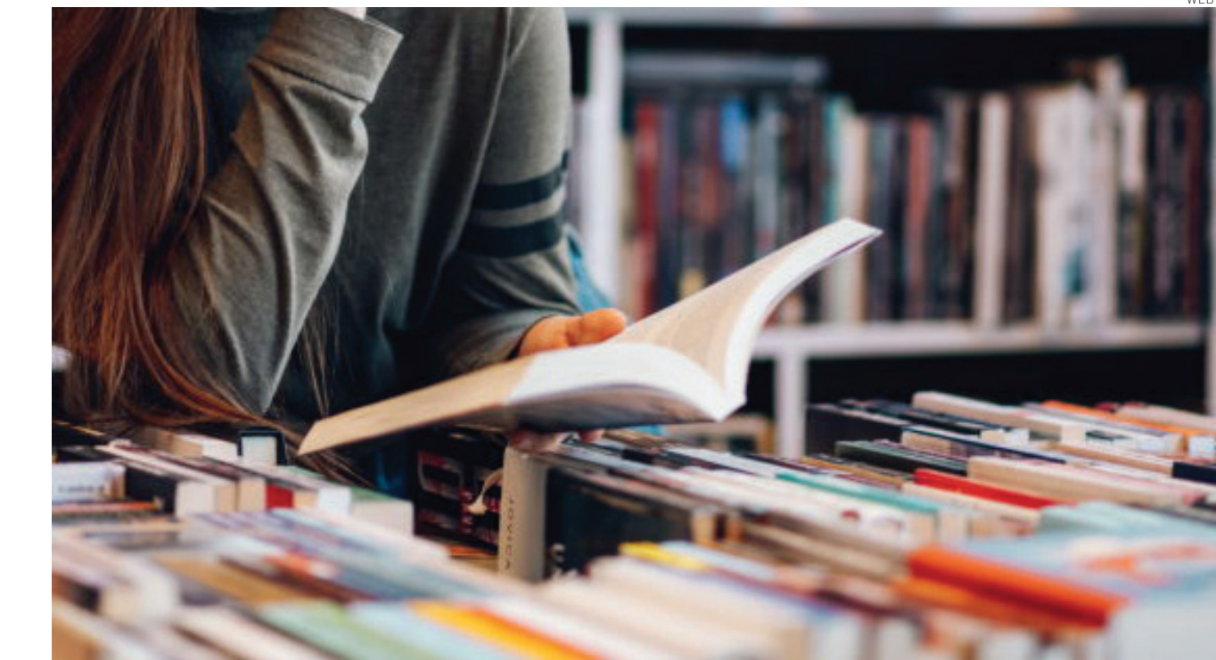
En internet abundan las versiones piratas de libros.