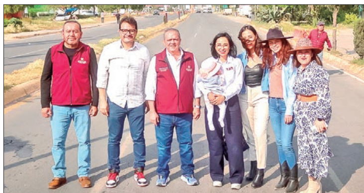
CONCEPTO. Las acciones se realizarán desde el bulevar Las Torres hacia el entronque carretero Libramiento Club Rotario.