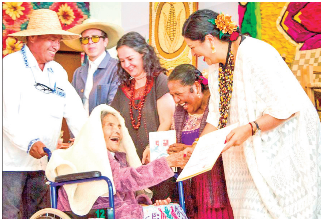
RESULTADOS. A pesar de no haber quedado en el pódium, la maestra cocinera y artesana puso en alto la cocina tradicional del municipio.

Se precisa que por parte del municipio trabajaran para conservar esta tradición culinaria que poseen "Continuaremos promoviendo y motivando a nuestras cocineras tradicionales, que