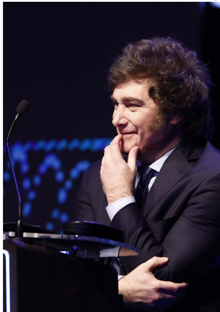
El candidato de extrema derecha argentino, Javier Milei, durante el primer debate presidencial.

El debate de este domingo en Santiago del Estero es el primero de los dos obligatorios establecidos por la Cámara Nacional Electoral (CNE) —el segun-