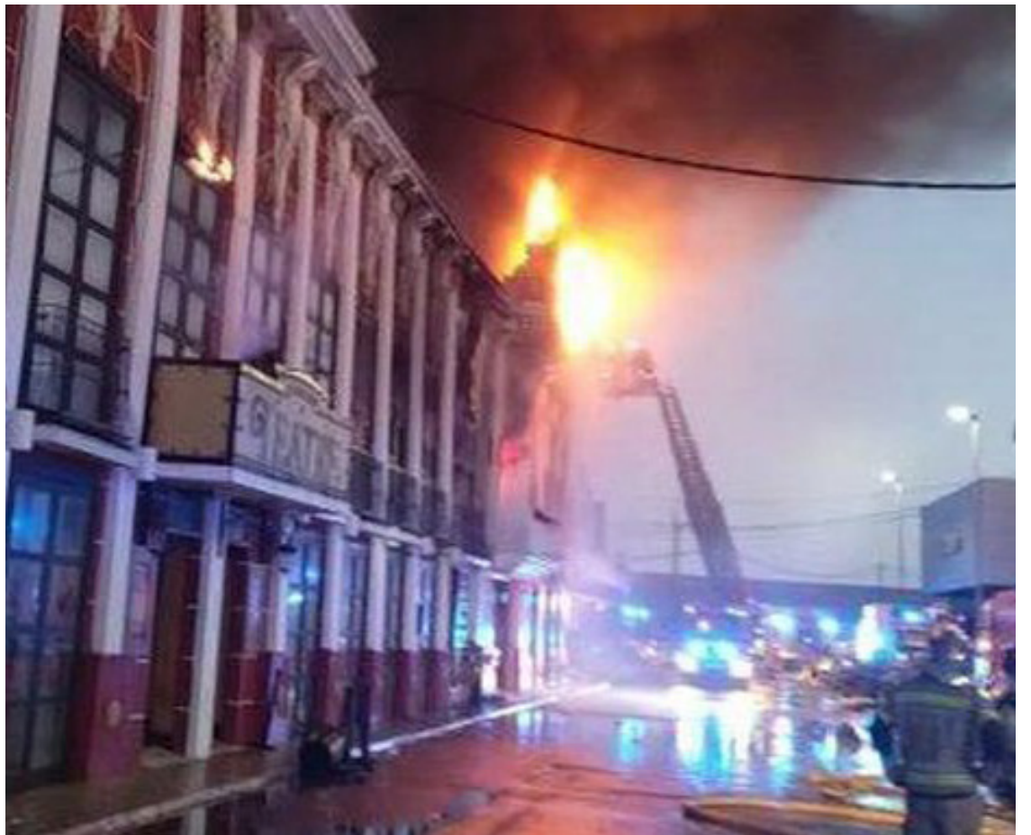
Captura de video de la discoteca siniestrada en Murcia, España.

Este último formaba parte del numeroso grupo de amigos que celebraba un cumpleaños en La Fonda Milagros, el primero de los locales de ocio incen-