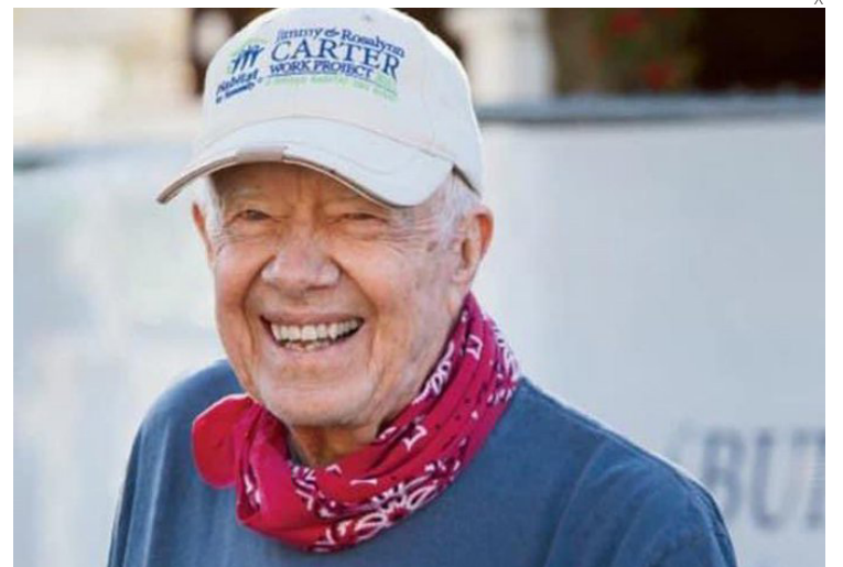
El expresidente de EU, Jimmy Carter.

Por su parte, el cofundador de Microsoft y filántropo Bill Gates escribió en X (antes Twitter) que Carter es sinónimo de “inspiración” y que su trabajo “para salvar vidas ha cambiado el mundo para siempre” ●