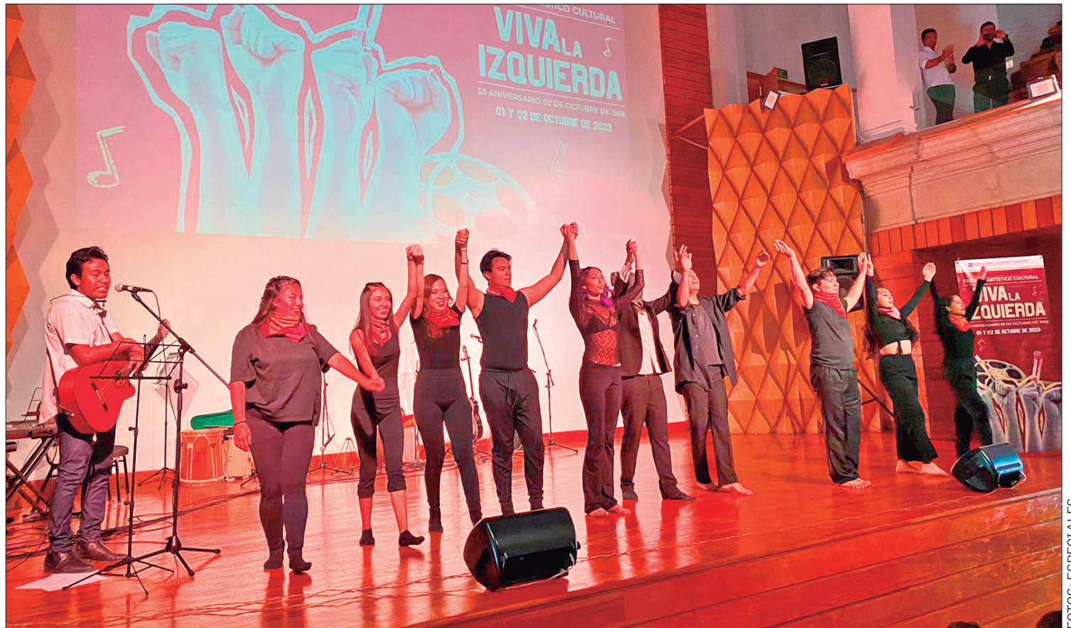
AGENDA. Las actividades continuarán hoy lunes 2 de octubre con la inauguración de la exposición gráfica Más tarde brotarán las flores.