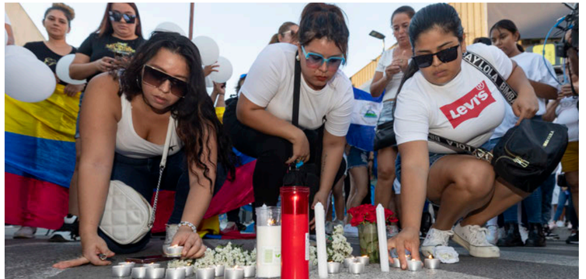
Familiares de las víctimas, en su mayoría de la comunidad latinoamericana de Murcia.

Con el paso de las horas, se van conociendo también los nombres y las historias de fami-