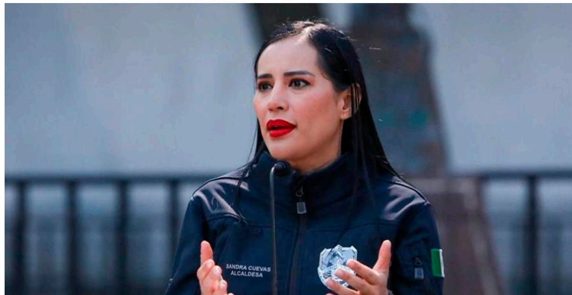
Cuevas amenazó con romper la alianza que tiene con el Frente Amplio por México.

De acuerdo con la edil, la alianza de oposición eligió solamente a dos contendientes por partido que disputen en la encuesta que escogerá al coordinador que derrote al candidato de Morena en las próximas elecciones del 2024, sin embargo, fue excluida de la competencia por no estar afiliada a