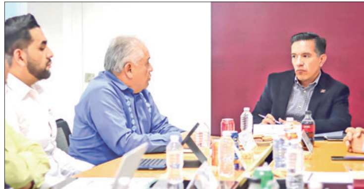
BALANCE. En total se recibieron 735 solicitudes de registro de marca, lo que significó un ahorro de 2 millones 068 mil 120 pesos.

citudes de registro de marca, lo que significó un ahorro de 2 millones 068 mil 120 pesos, resultado de que estas campañas ofrecen el 90% de descuento en el trámite.