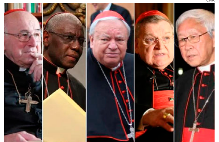
De izquierda a derecha, los cardenales ultras: Walter Brandmüller (Alemania), Robert Sarah (Guinea), Juan Sandoval Íñiguez (México), Raymond Burke (Estados Unidos) y Joseph Zen (China).

Francisco, que ha permitido votar a mujeres y laicos, ha pedido un Sínodo "sin murmuraciones, ideologías y polarizaciones".