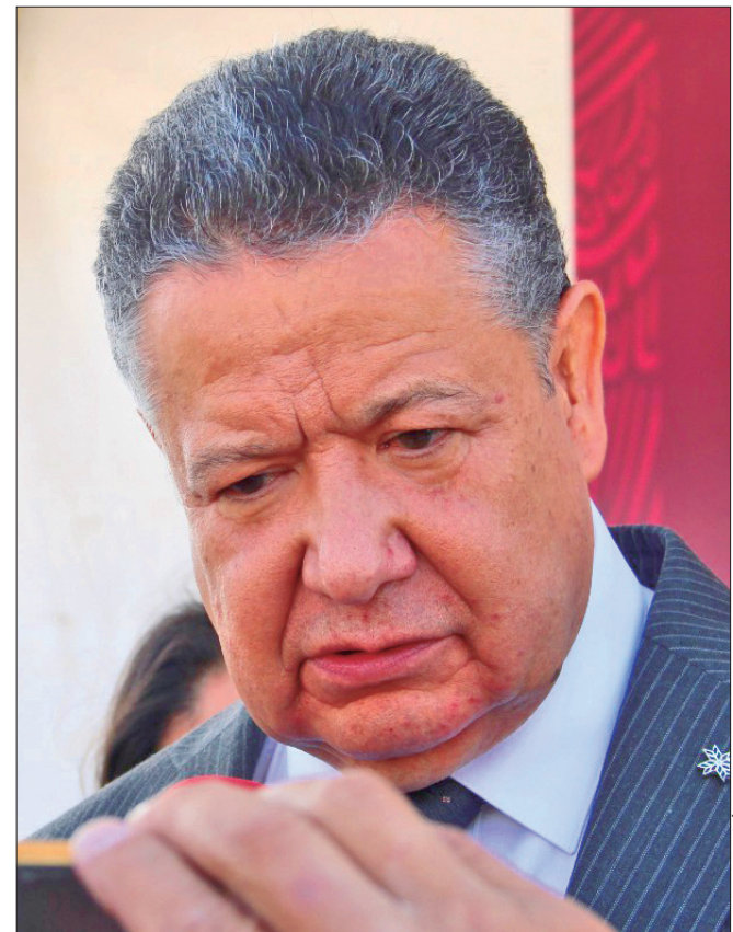
ACTIVIDADES. El gobernador Julio Menchaca Salazar atestiguó el relevo militar en la 18ª. Zona Militar de Pachuca.

"El compromiso de este gobierno es alejarlo de estos lugares que deshonran al estado de Hidalgo, durante estos meses se han recuperado más de dos millones 500 mil litros de combustible", finalizó.