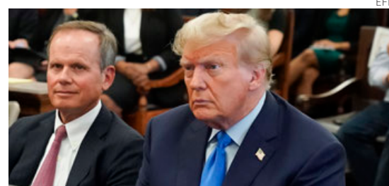
El expresidente Donald Trump junto a su abogado en el tribunal de Nueva York.

La fiscal Letitia James acusa al expresidente y sus hijos de inflar el valor de los activos de sus empresas en Nueva York para obtener de manera ilegal beneficios fiscales, por lo que pide