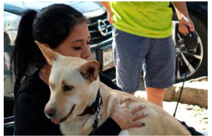
La rabia es una zoonosis peligrosa que se transmite principalmente a través de la saliva infectada, generalmente por mordeduras, rasguños o lamidas en la piel o mucosas.

El PAN también señaló que la Ciudad de México enfrenta varios desafíos significativos, como problemas en el sistema de transporte público, especialmente en las Líneas 1 y 12 del Metro, problemas de inseguridad y el desabasto de agua, entre otros.