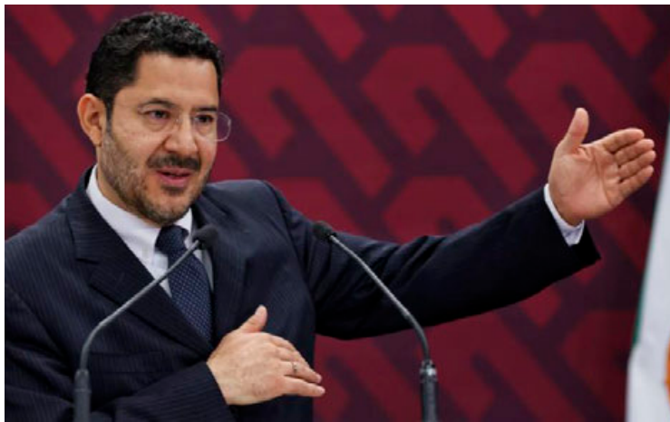
Martí Batres, jefe de Gobierno de la CDMX.

“Hay muchas transformaciones que presumir”, dijo luego de que el PAN dijera que no había mucho que exhibir en su informe