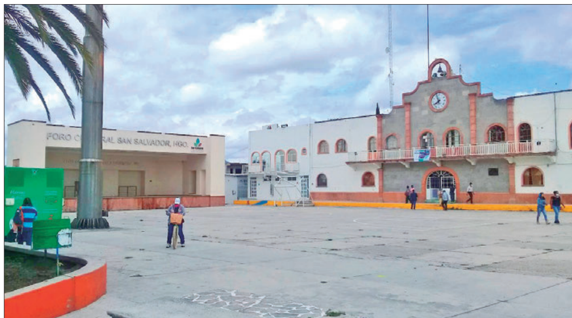
EN MARZO. Líderes eligieron al Comité Municipal, bajo usos y costumbres, lo cual generó cierta controversia, ya que es un organismo que cuenta con sus propios estatutos.

Explicó que la postura que han asumido los morenistas de San