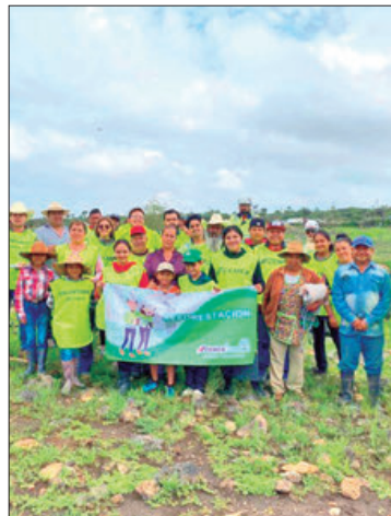
MÉTODO. Autoridades y voluntarios ejidales plantaron especies como maguey, xamini, garambullo, huizache y mezquite.

varon a cabo la plantación, y las especies sembradas son monitoreadas por promotores ambientales de la empresa de mate-