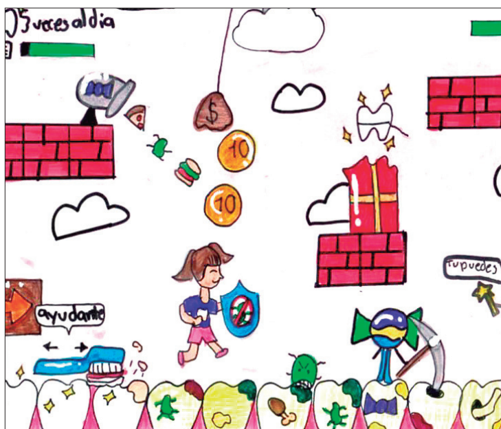
RECORDATORIO. Concurso surgió en 2011, pero fue suspendido tras la emergencia sanitaria en los años pasados.

en Zempoala, fue el finalista estatal con su dibujo: Mi sonrisa en el mundo.