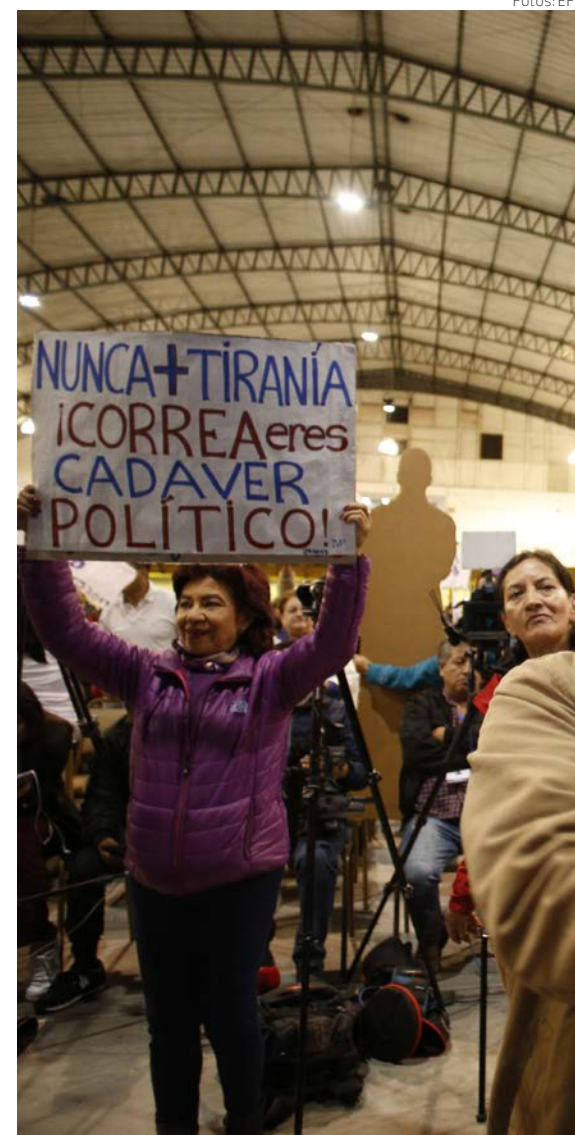
Seguidores de Noboa celebran la derrota del correísmo.

La candidata correísta reconoció el triunfo de Noboa sin que en las filas de su formación se hayan anunciado conjeturas de un eventual fraude, pues aseguró que su país "necesita seriedad": "Basta de odio, basta de polarización"