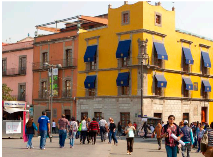
Calles del centro de la Ciudad de México.

El jefe del Ejecutivo local también subrayó que no se llevará a cabo una votación electrónica o física. La intención es recoger opiniones y propuestas para entender cómo la ciudadanía