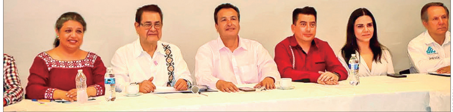
TONO. Para el secretario de la Contraloría es de suma importancia como servidor público, mantener la cercanía con la población para conocer y atender las necesidades, más sentidas de la gente.

Huejutla de Reyes, Hgo., 12 de octubre de 2023.