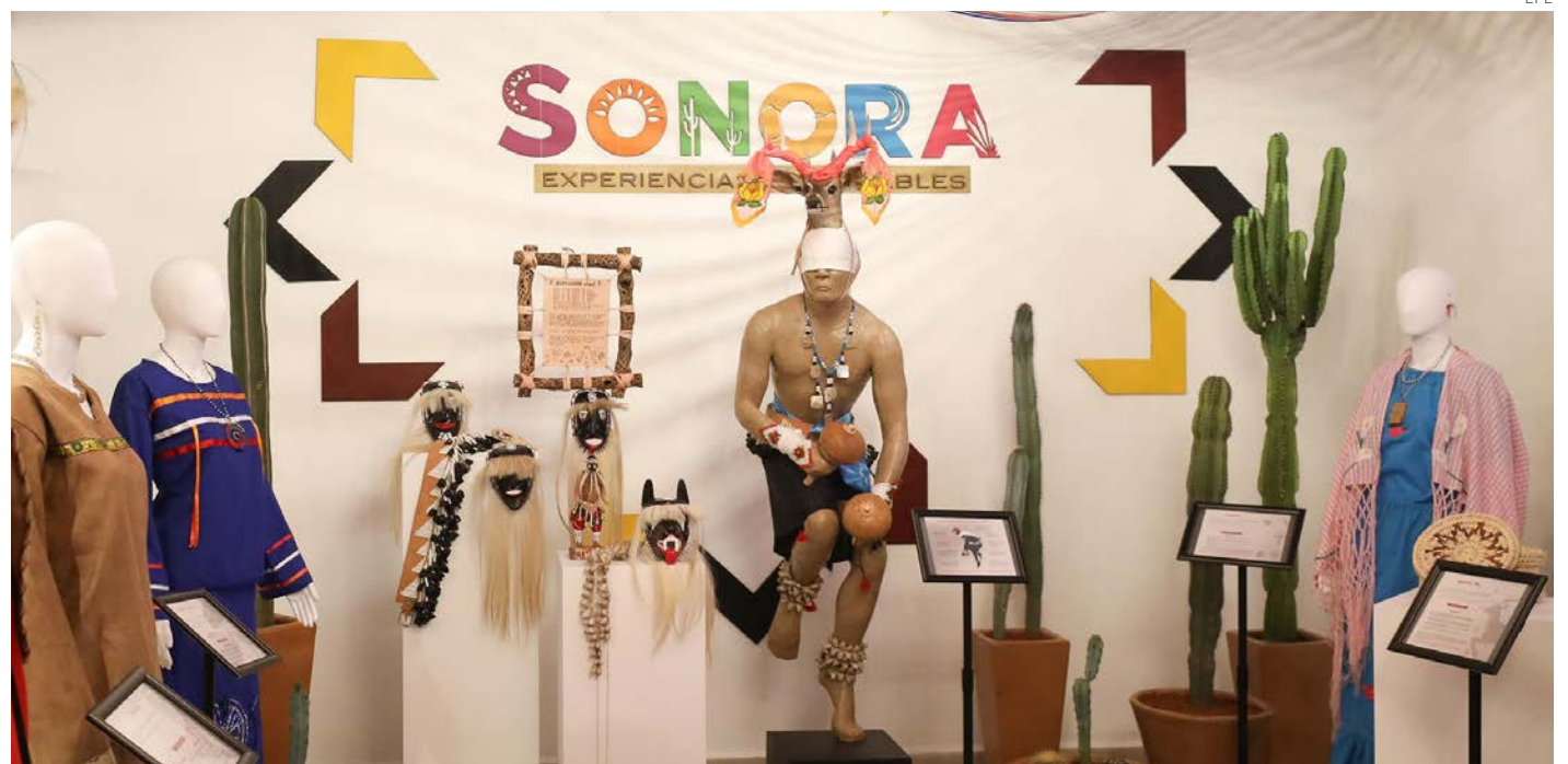
Vista general del stand de la casa de Sonora, en el marco Cervantino.

La muestra presenta un conjunto de 118 obras de 40 autores diferentes, explora la temática de las calaveras, una parte fundamental de la cultura mexicana que