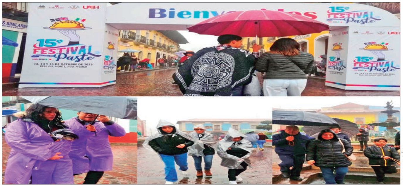
Pese a las bajas temperaturas, cientos de personas se dieron cita en Real del Monte, donde se desarrolló el tradicional Festival del Paste. Los asistentes pudieron observar y degustar del paste gigante: elaborado por gente del lugar, pesando 200 kilos y midiendo 4 metros de largo.

Además, en este acuerdo sugirieron a los Organismos Públicos Locales Electorales (OPLE), con respecto a su autonomía, para que contemplan las propuestas de TGM y cuenten en tiempo y forma... 3