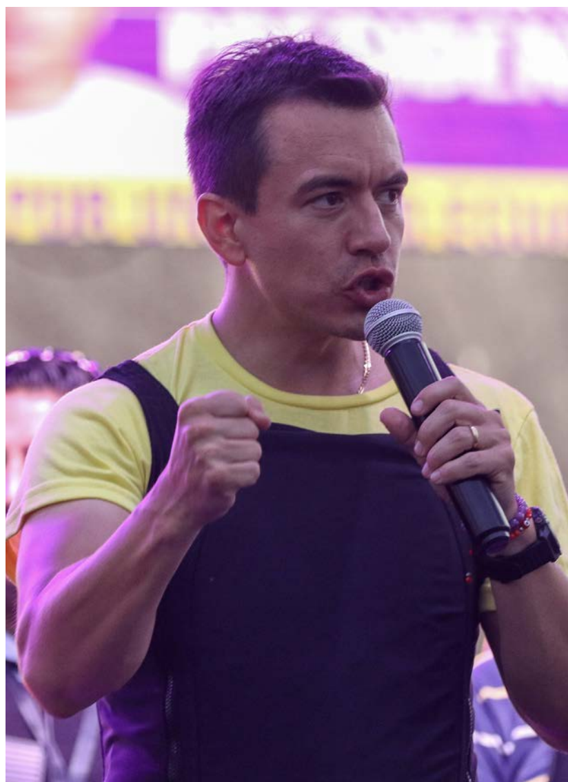
Daniel Noboa, presidente electo de Ecuador.

El joven empresario y exasambleísta, he-