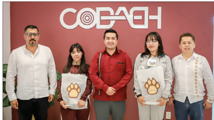
PASO. La acreditación para participar en este certamen fue otorgada por la Universidad Autónoma del San Luis Potosí.

Las alumnas realizaron, en forma virtual, la exposición del proyecto "KERATEX", el cual con-