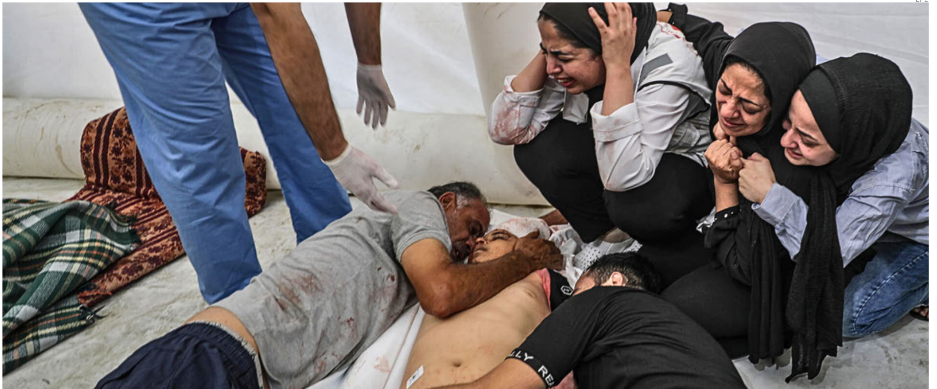
Una familia palestina llora ante el cadáver de un familiar tras el ataque sobre el hospital Al Ahli, el 17 de octubre.