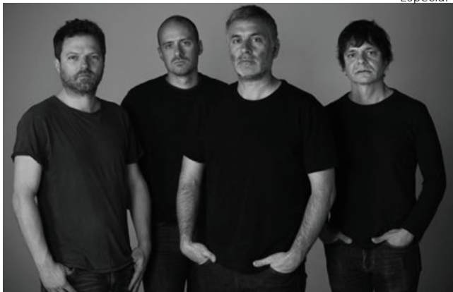
La Habitación Roja.