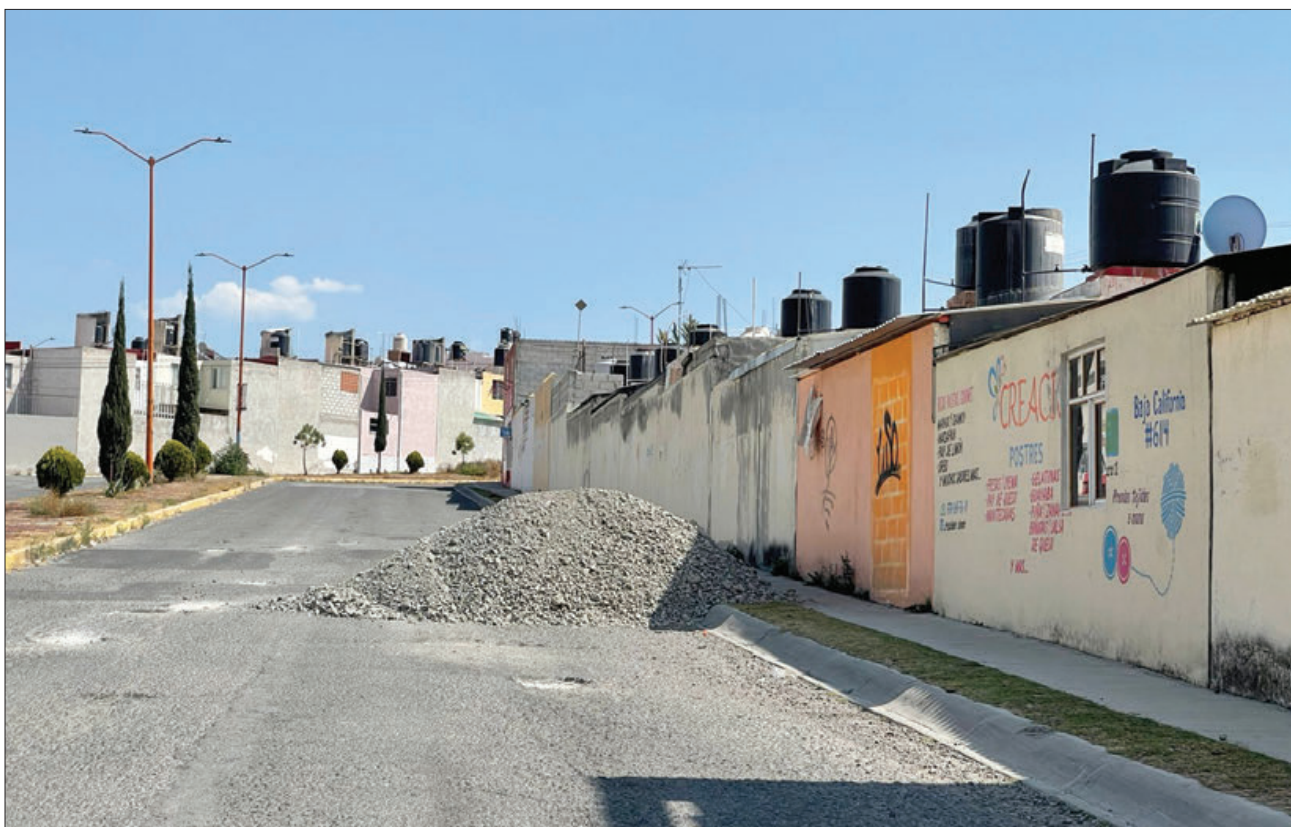
Obstaculizando la banqueta, así como parcialmente una parte del circuito Javier Rojo Gómez del fraccionamiento La Providencia, se encuentra un montículo de grava que fue dejado desde hace varios días y las autoridades de Mineral de la Reforma hacen caso omiso a las quejas por este bloqueo.

■ La reclusa cursó la carrera en administración de empresas para posteriormente fijar el objetivo de posgrado en Tecnología Educativa avalada por la Universidad Autónoma de Hidalgo