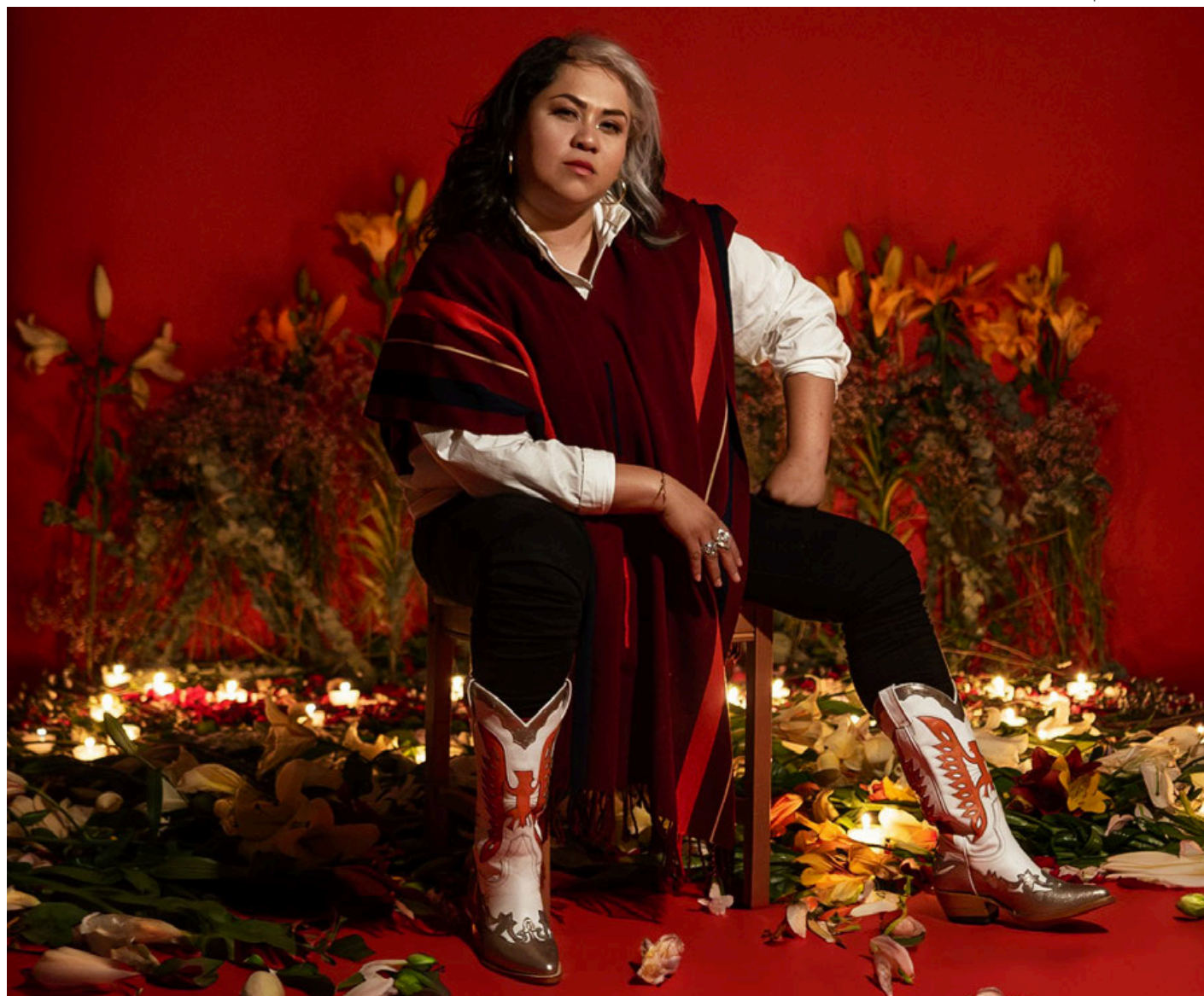
El 16 de febrero del próximo año Vivir Quintana se presentará en el Lunario del Auditorio Nacional.

Está claro que este álbum refleja la sensibilidad artística y la pasión de Vivir Quintana. Por otra parte, las canciones de este trabajo abordan temas tan profundos como el amor, la familia, el