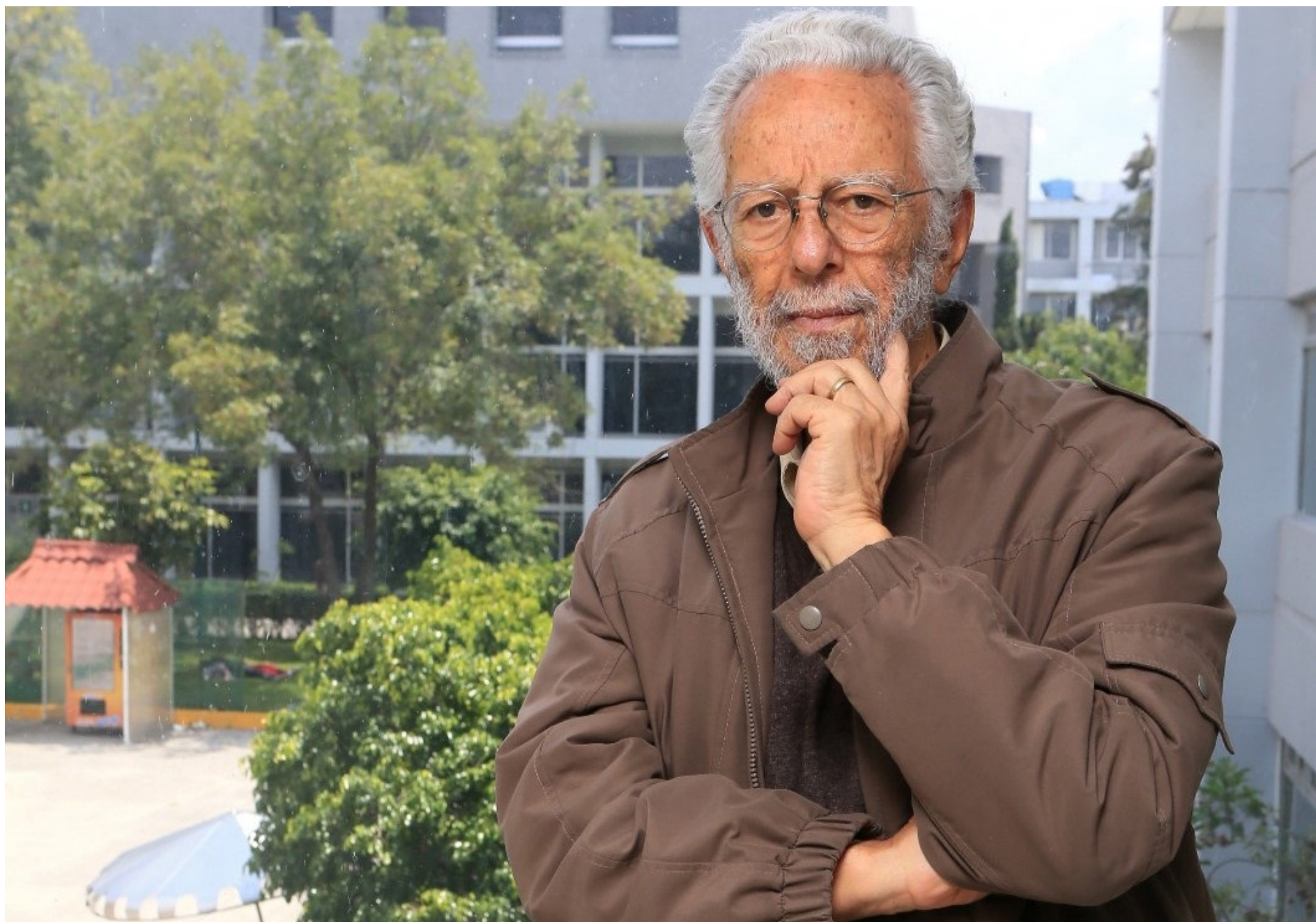
En Octubre de 2019 Dussel fue homenajeado en Cambridge, Massachusetts, como el primer filósofo Latinoamericano en ingresar a la Academia Americana de Ciencias y Artes.

remonia el 11 de octubre de 2019 en la ciudad de Cambridge, Massachusetts, Estados Unidos, donde está la sede de la Academia.