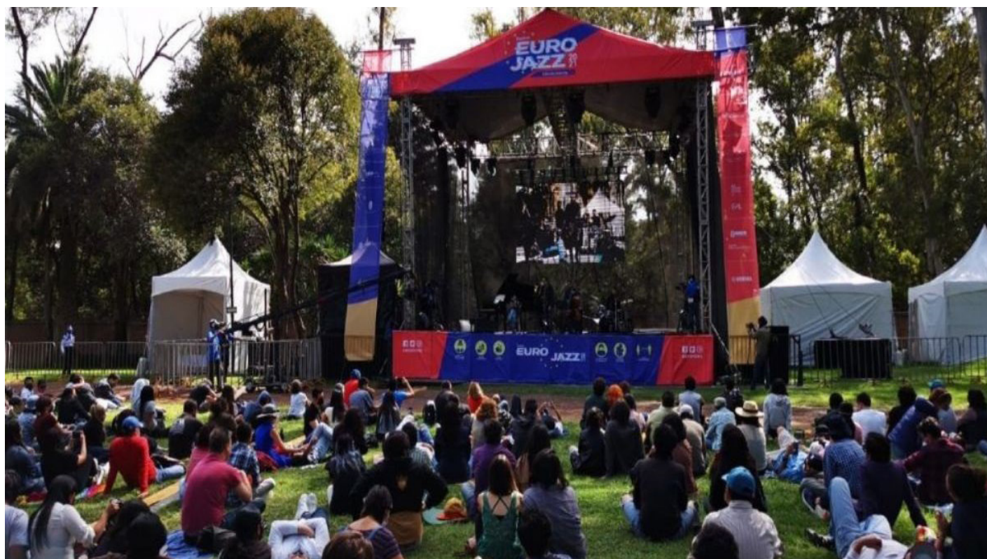
Imagen de una de las ediciones anteriores del Eurojazz.