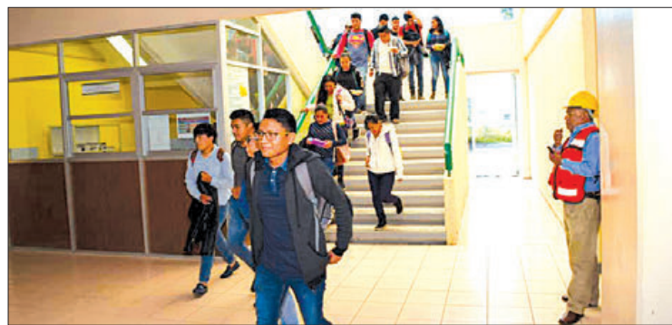
LABOR. La actividad se denominó Los retos de la Gestión de Negocios.

Explicó que, desde el inicio de esta carrera, hasta la fecha, han egresado un total de dos mil 138 estudiantes en 34 generaciones en nivel TSU y desde que se abrió la continuidad de estudios de nivel ingeniería y licenciatura en esta misma área, han egresado 16 generaciones con mil 081 universitarios respectivamente.