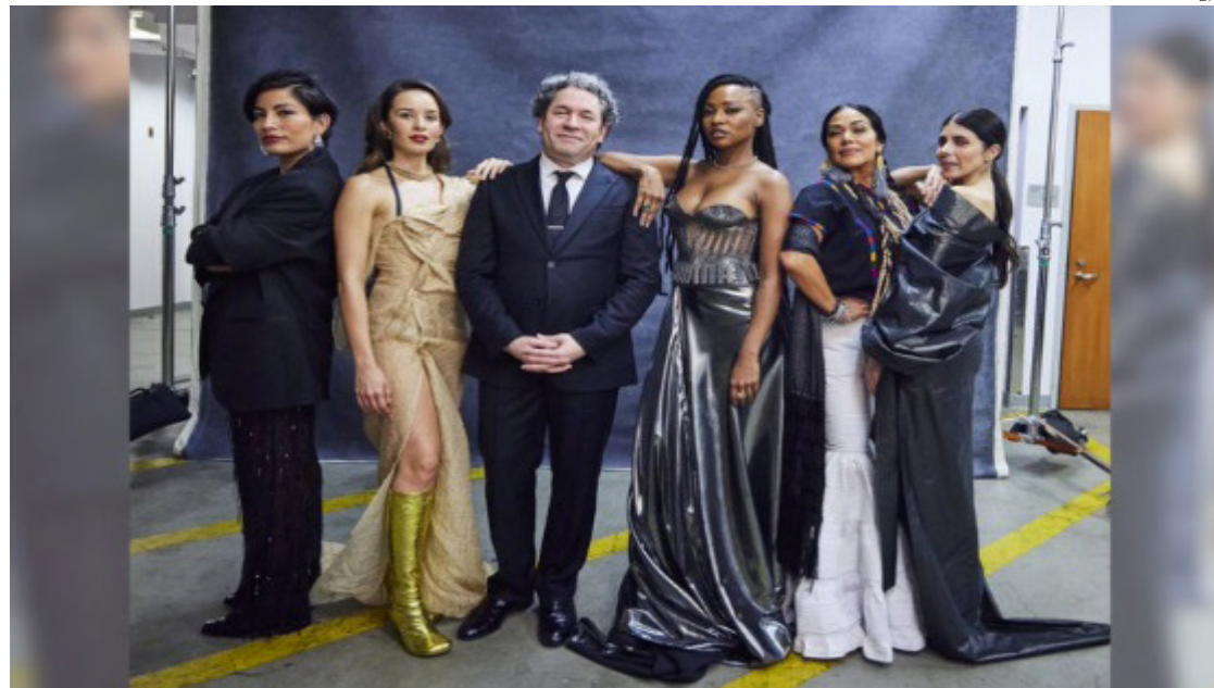
El director de orquesta Gustavo Dudamel y las cantantes, desde la izquierda, Ana Tijoux, Catalina García, Goyo, Lila Downs, y Ely Guerra.

ricanas defensoras de los derechos sociales, desde Violeta Parra a Susan B. Anthony, protagonizada por artistas que a menudo han alzado su voz contra las injusticias, como Lila Downs, Catalina García, Ely Guerra, Goyo, Ana Tijoux o Silvana Estrada.