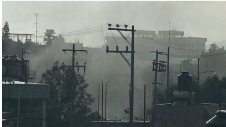
Planta de Asfalto en Coyoacán.

"Es cierto que desde que construyeron el parque en una sección del terreno ya no se percibe humo tan seguido en la madrugada, pe-