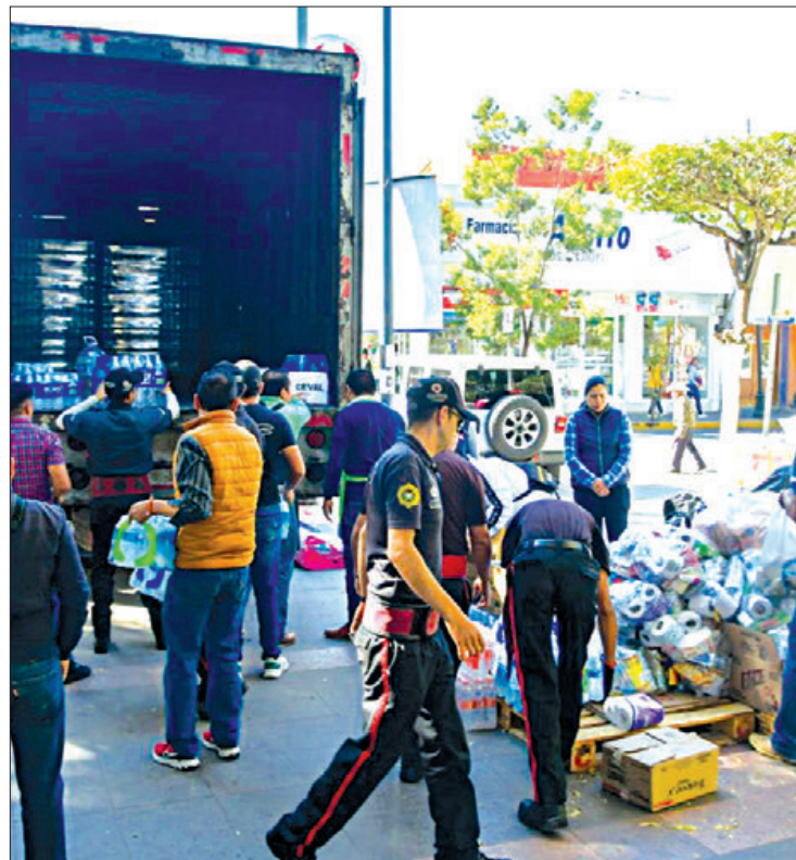
ATENCIÓN. Para poder ayudar, se solicita a la población interesada, lo haga con alimentos no perecederos, así como aquellos que cuenten con abre fácil, entre otros.

Para poder ayudar, se solicita a la población interesada, lo haga con alimentos no perecederos, así como aquellos que cuenten con abre fácil, además de agua embotellada, pañales, aceite, atún, sardina, leche en polvo, artículos de limpieza, así