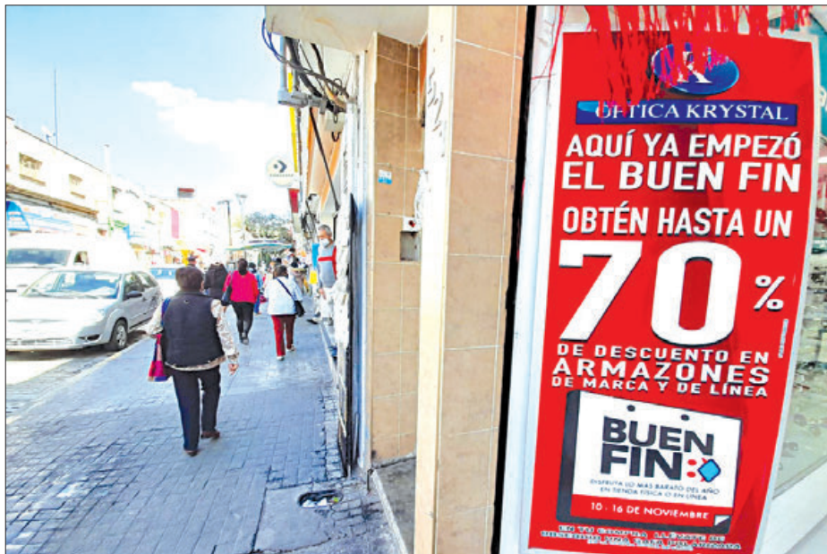
DIALOGO. Se abre la posibilidad a que "El Buen Fin" también beneficie a los comerciantes informales.

Señalaron que estos acuerdos se están dando poco a poco luego de varios años en los que el distanciamiento entre el municipio y las agrupaciones de ambulantes eran muy marcadas; sin embargo, resaltaron que a base de voluntad y negociación es posible trabajar a base de acuerdos, lo que abre la posibilidad a que El Buen Fin también benefi-