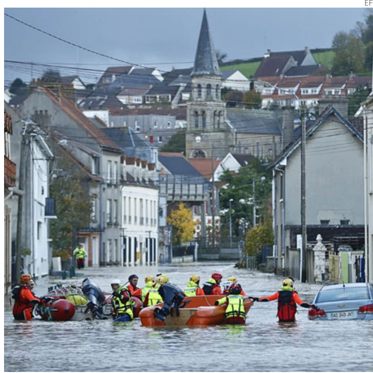
Más de 100 localidades se encuentran en alerta roja por los niveles de agua.

La mañana del sábado no llovía en esa región, pero la Prefectura (delegación del Gobierno)