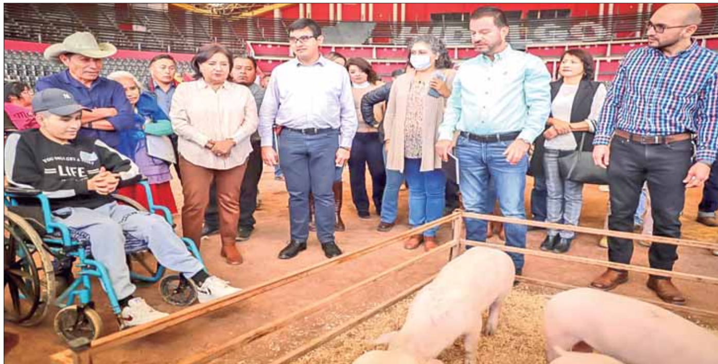
APOYO. Se beneficiaron a hidalguenses pertenecientes a 17 municipios con altos índices de marginación.

"Estaremos en contacto con ustedes y yo sé que no me van a defraudar porque yo sé que si queremos el Hidalgo que nos merecemos debemos hacerlo en equipo. Mu-