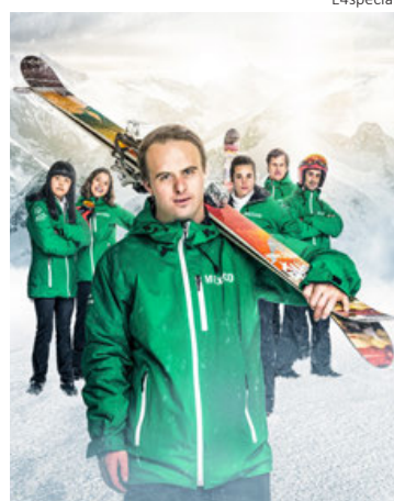
Imagen del filme '30 días para ganar'.

“Para mí este año el eje central del festival es la discapacidad, los derechos y la justicia. Por eso puse esta película para preguntarnos qué tanto el sistema de justicia de