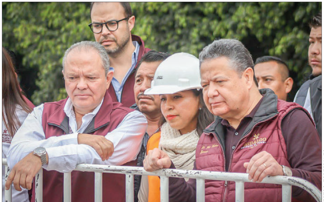
PROYECTO. Esto, para garantizar infraestructura carretera, educativa y de salud, sostiene Julio Menchaca.

También realizó la entrega de la pavimentación asfáltica en el Libramiento Oriente La Loma de la Cruz - UTVM, Circuito Paredes y en la calle 15 de Septiembre de la localidad de Remedios, obras que requirieron de 6 millones 602 mil pesos. Igualmente se informó que, para la rehabilitación de pavimento asfáltico en la Av. Felipe Ángeles, el Gobierno de Hidalgo invirtió 7 millones 556 mil 379 pesos.