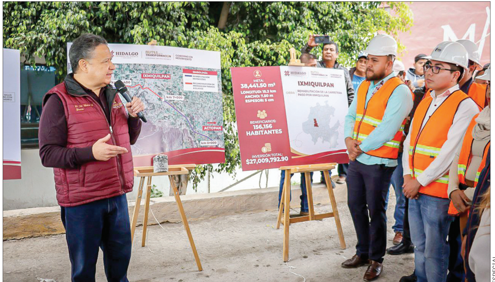
El gobernador Julio Ramón Menchaca Salazar encabezó las Rutas de la Transformación - Gobierno en Movimiento en los municipios de Ixmiquilpan y Alfajayucan.

Al encabezar las Rutas de la Transformación - Gobierno en Movimiento en los municipios de Ixmiquilpan y Alfajayucan, el titular del Ejecutivo estatal aseguró que la estructura gubernamental continuará impulsando... 3