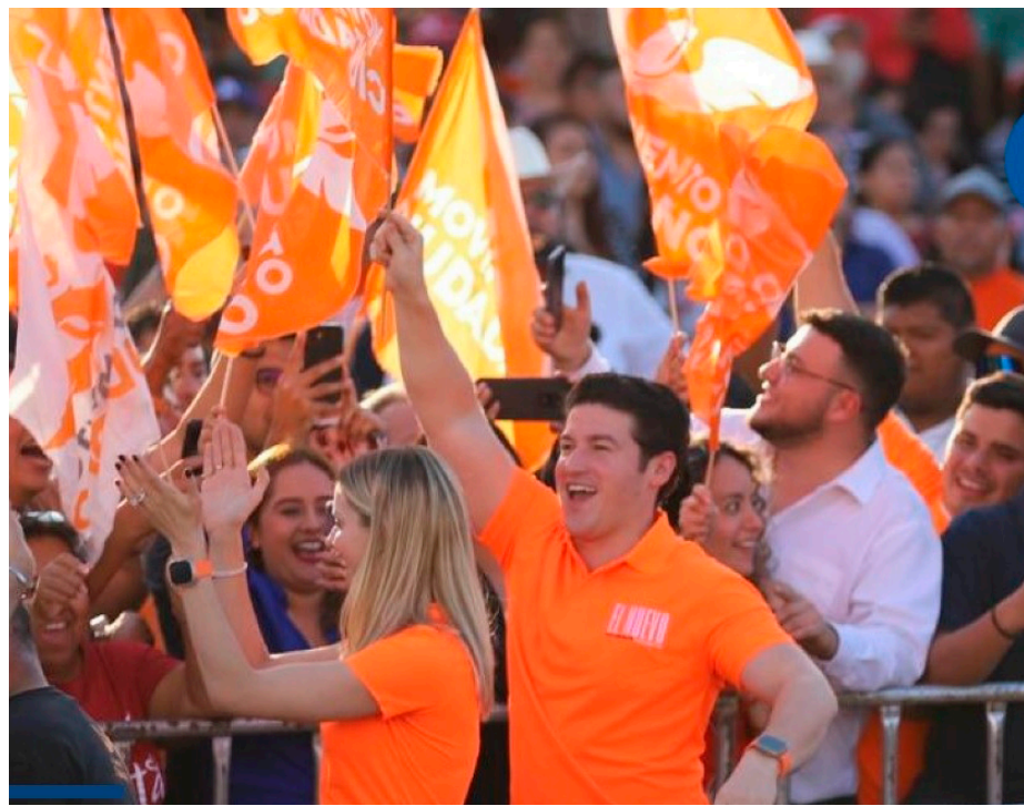
Fueron 11 días lo que duró la precampaña presidencial de Samuel García rumbo al 2024.

“He reasumido funciones como Gobernador Constitucional del Estado, y siendo mi derecho constitucional, no haré efectivo el uso de la Licencia para au-