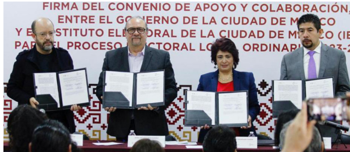
La SSC se hará cargo de la custodia de las oficinas centrales y de los órganos desconcentrados del IECM.