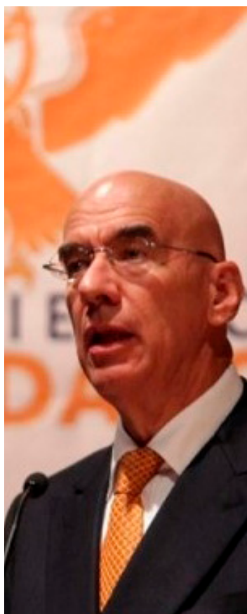
Dante Delgado, líder de MC.

El caso ha generado controversia pues se desconoce en quién recae el poder político en la entidad luego de la designación de un gobernador interino (Redacción) •