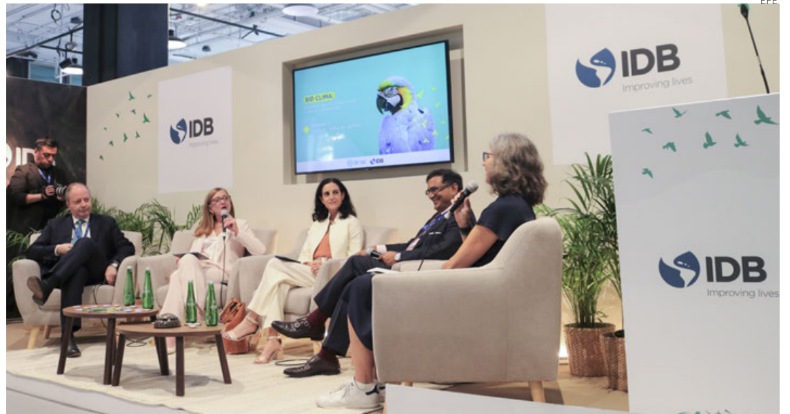
El BID lanzó el programa BID CLIMA en el marco de la COP28.

La COP28 activó una batería de compromisos para acelerar la descarbonización centrados en triplicar la capacidad instalada renovable y a duplicar la tasa de mejora de la eficiencia energética, reducir casi a cero