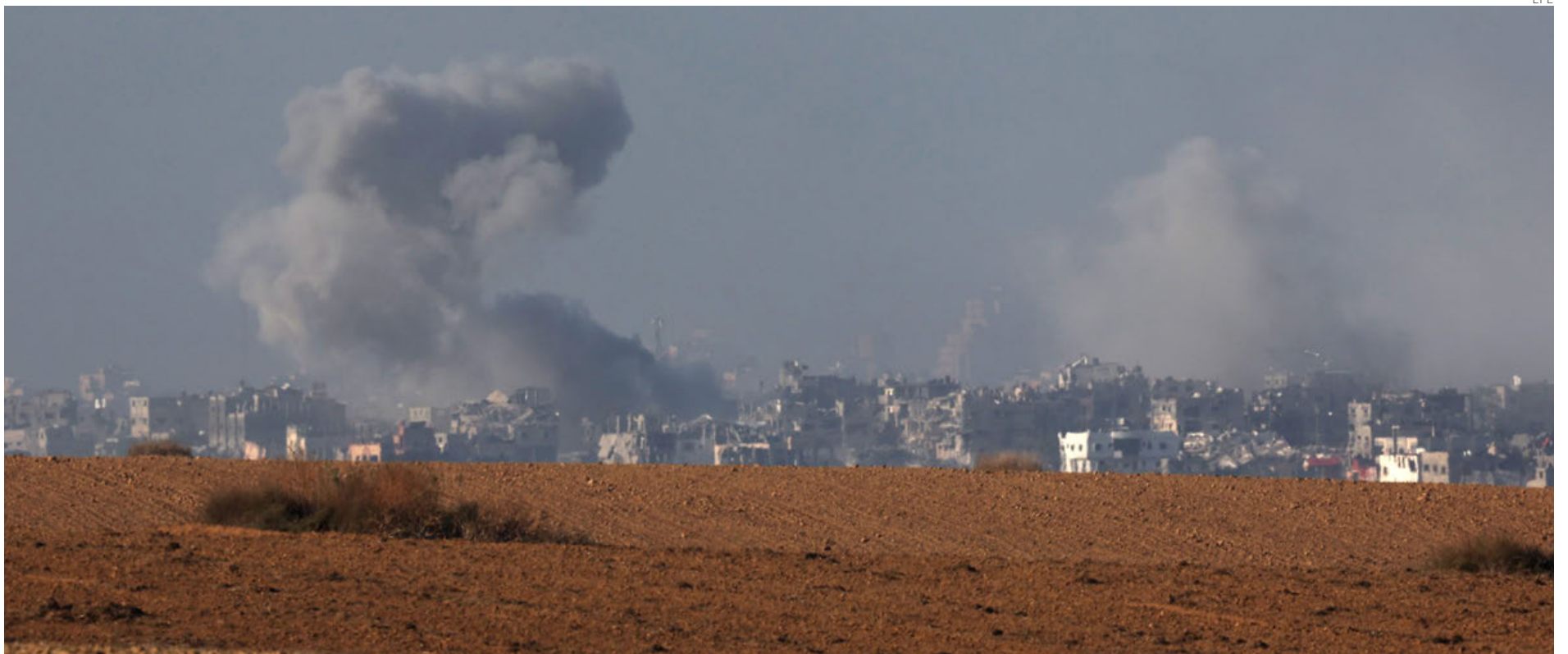
El humo se eleva en el norte de la Franja, en el segundo día de bombardeos israelíes tras el fin de la tregua.