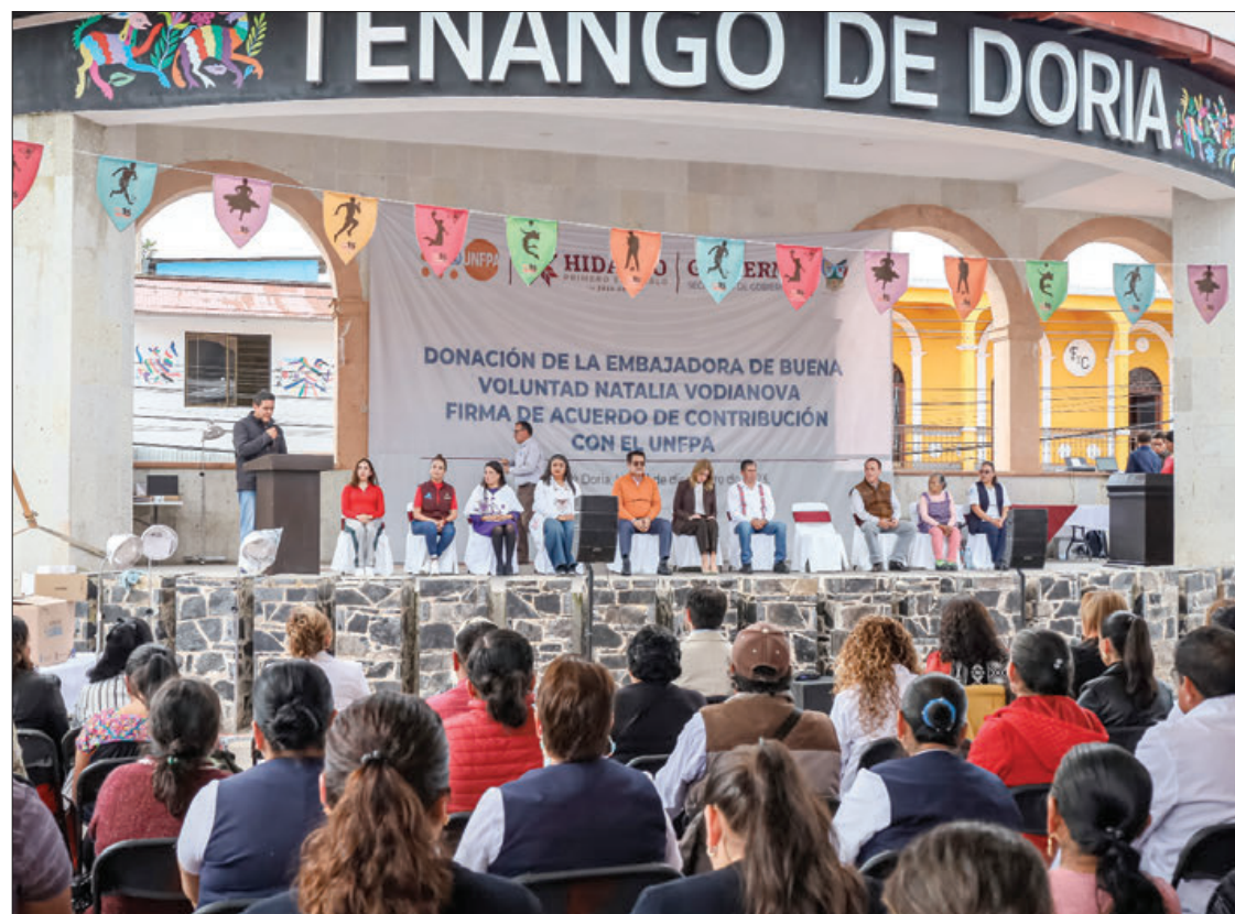
OBJETIVO. La donación permitirá que los habitantes de la región Otomí-Tepehua cuenten con mejores servicios.

Destacó las acciones que emprende el gobierno de Julio Menchaca Salazar, como el derecho universal de acceso a la salud, por