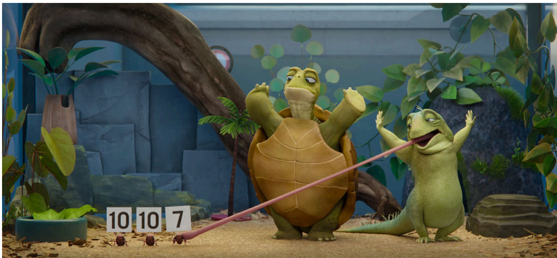
Fotograma del filme.

Con Adam Sandler como protagonista, la nueva cinta animada de Netflix estrenó para complacer el humor de chicos y grandes