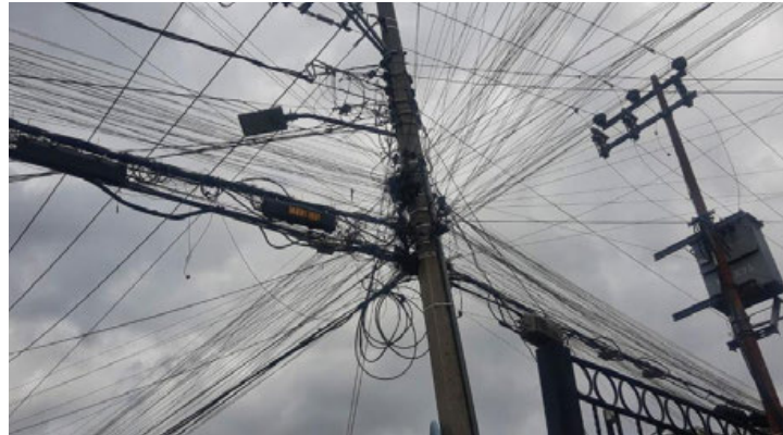
Como una red de telarañas los postes de la ciudad resisten el peso de cables de luz, telefonía y fibra óptica.

Al informar sobre los avances en el retiro de cables, el jefe de Gobierno, Martí Batres destacó que este es uno de los acuerdos alcanzados con las cámaras de industrias de televisión, televisión por cable y telefónicas. El convenio esta-