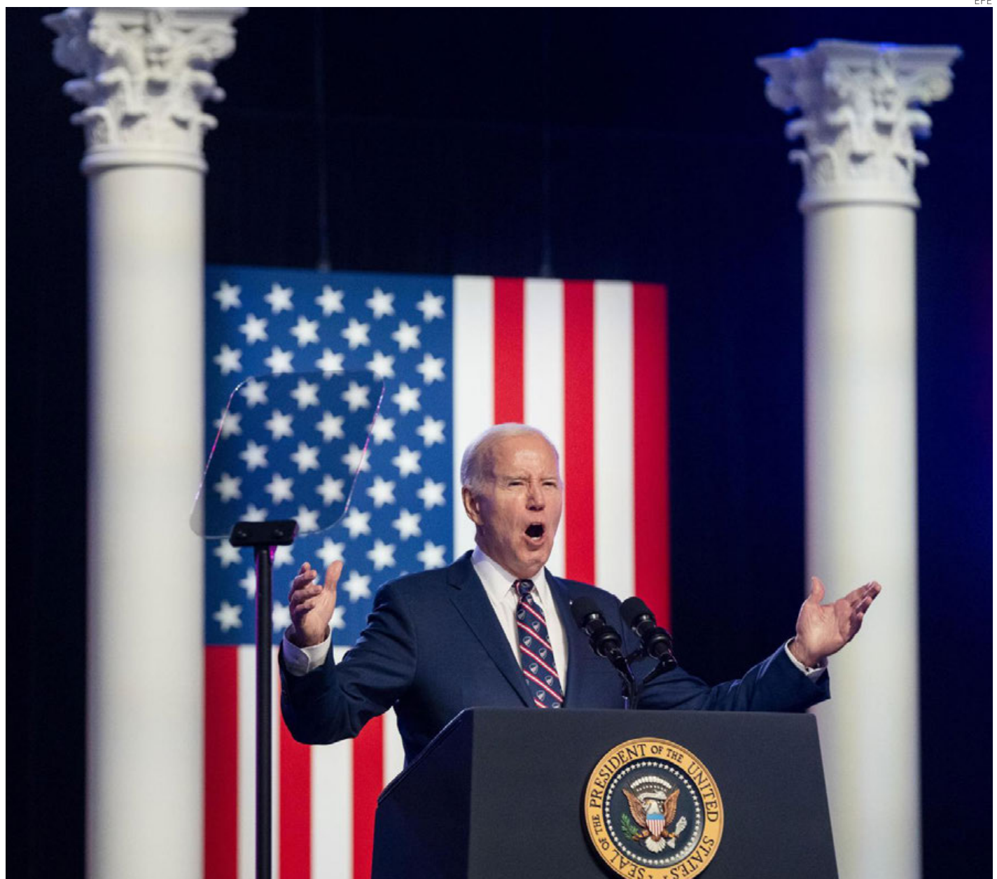
Discurso del presidente Biden en el histórico Valle de Forge, donde Washington montó un campamento en la guerra de Independencia.

El foco de su discurso, según advirtió al principio, fue "tremendamente serio" y giró en torno al ataque del 6 de enero de