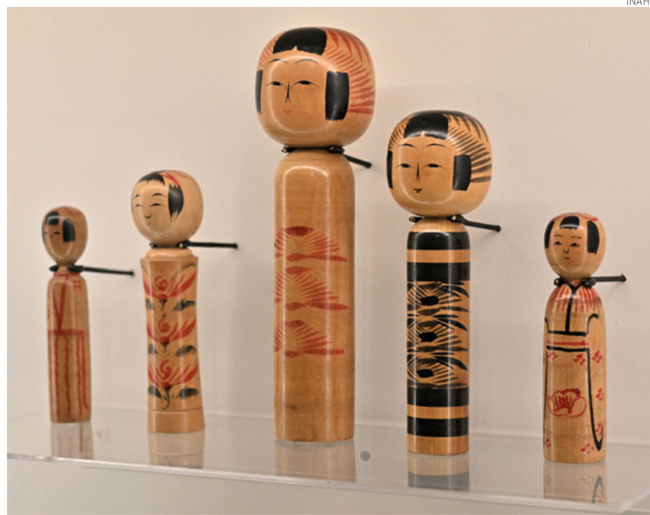
Algunas de las piezas en exhibición y que provienen del acervo del Museo Nacional de las Culturas del Mundo.