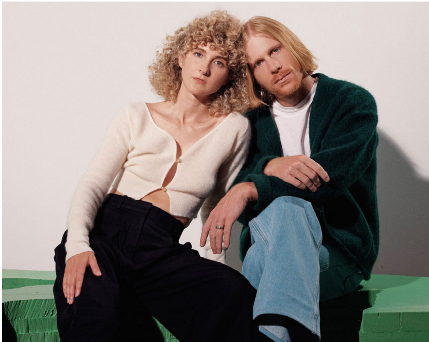
Imagen de Tennis.