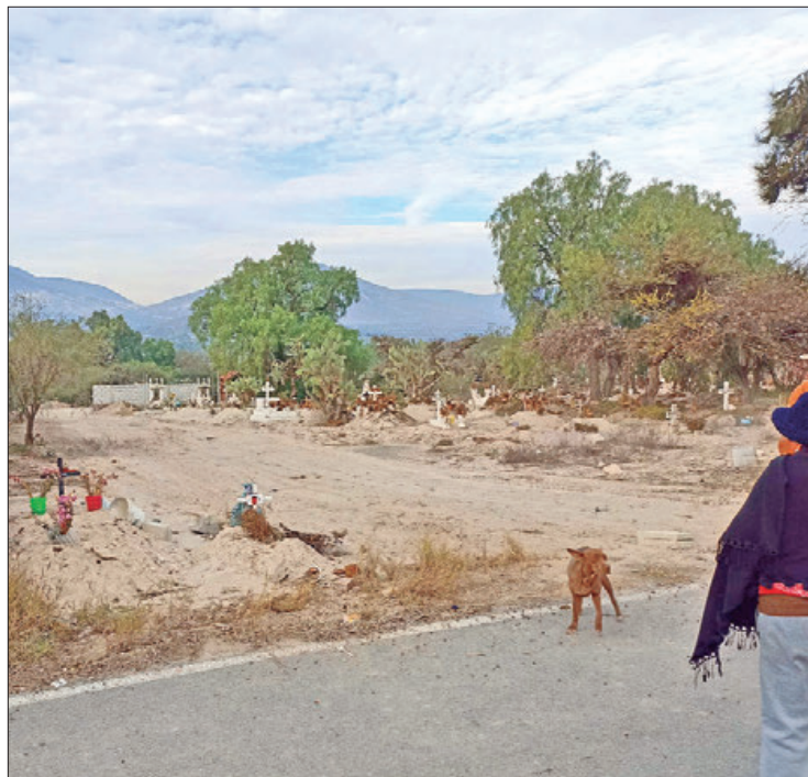
TÓPICOS. Los lugareños convocaron a una reunión urgente para tratar el tema y solicitar la intervención de las autoridades, pues de no poner un alto a esta acción, corren riesgos las tumbas donde descansan nuestros familiares.

Algunos de los regidores ya acudieron directamente a la comunidad para estudiar el caso y resolver este tema considerado como un problema de delimitación entre el particular y la misma localidad. La proyección es que, en breve, quede asentado o definido cuál es el uso del predio en disputa.