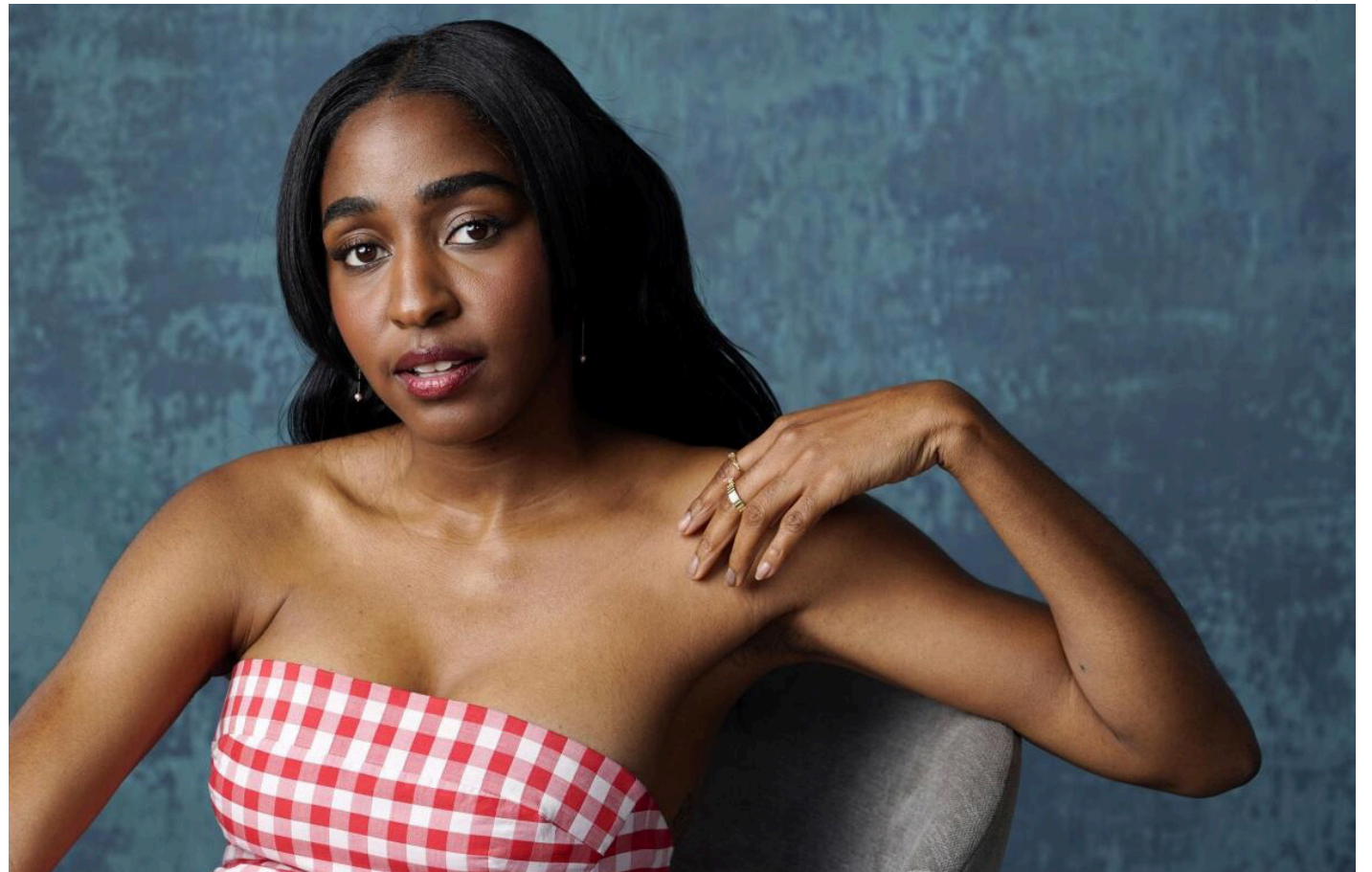
Imagen de la actriz Ayo Edebiri.

Y aunque su carrera ha despegado más como actriz o en labores de doblaje, cabe destacar que Ayo también es guionista, por lo que no omitió mencionar los pros y contras de la huelga que terminó hace unas semanas en Hollywood. “Era frustrante, antes de este hecho, que siempre pusieron mi labor como escritora hasta el final siendo que ése es mi primer amor y algo a lo que constantemente trato de volver. Sin embargo, he aprendido a balancear la actuación con mi escritura, dándome el espacio necesario para trabajar en ello. Estoy desarrollando varias ideas y guiones propios así como creando colaboraciones y espe-