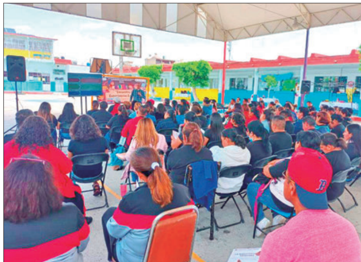
RUTA. Para 2024, el compromiso es continuar con la tarea de ahondar en el conocimiento del Plan de Estudios 2022.

Asimismo, ha brindado orientación sobre el currículo de la NEM a 50 integrantes de la propia área, así como a 612 docentes del nivel medio superior de todo el estado, 40 del Consejo Nacional de Fomen-