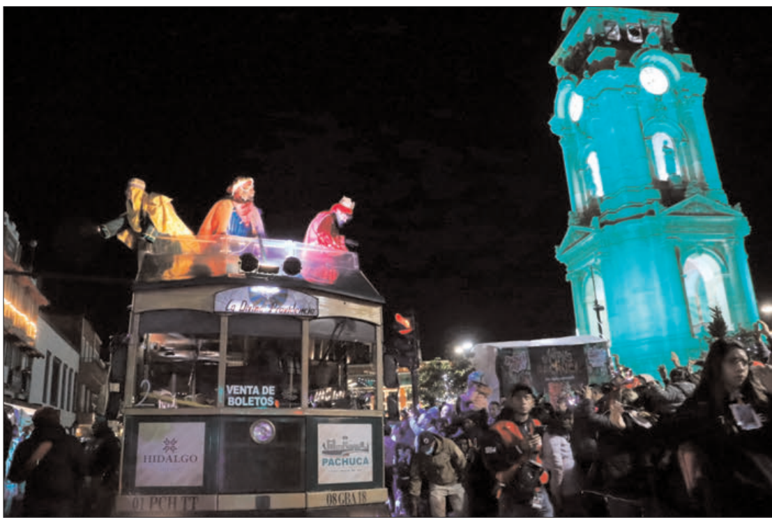
Cientos de asistentes al desfile, por Día de Reyes, desarrollado la noche de este 5 de enero y que recorrió las principales calles de la Bella Airosa.