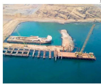
Construcción del megapuerto de Chancay en Perú.

En el caso de Brasil, se prevé que el crecimiento se desacelerará