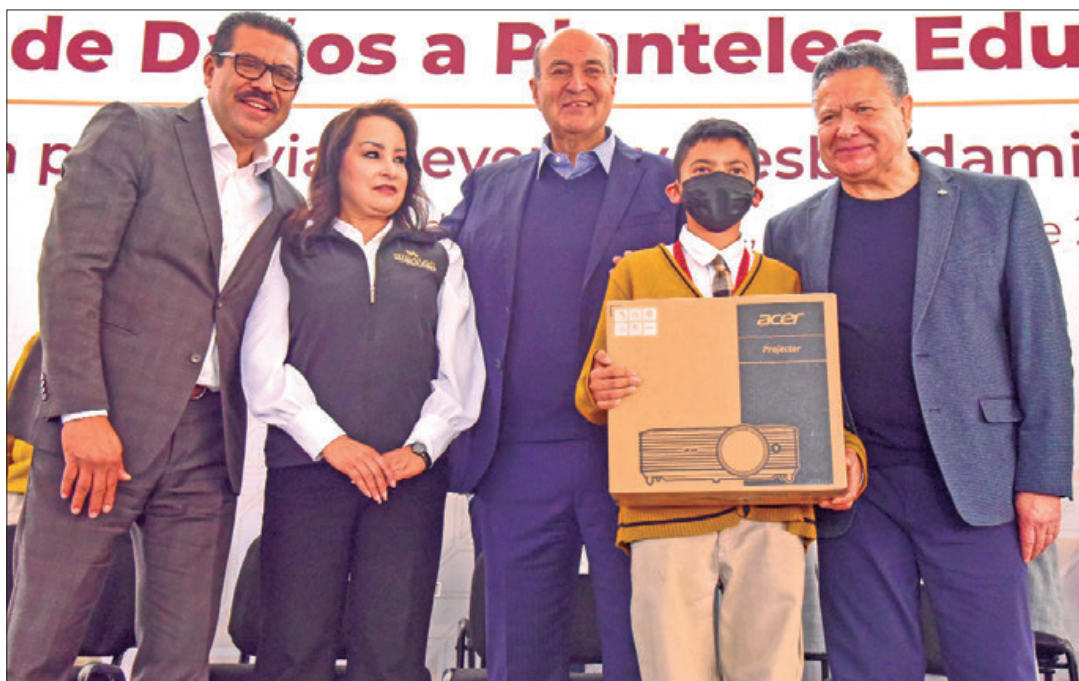
Una acción para revertir escenario que dejó el desbordamiento del Río Tula en septiembre, del 2021.

Fue este 9 de enero, ante cientos de estudiantes, personal académico y administrativo, que el mandatario afirmó que "estas aulas están llenas de recuerdos, de historias y de posibilidad de realización personal", por lo que dicho encuentro permitió reiterar el compromiso de trabajo y esfuerzo para poder sacar al estado de un largo letargo y así poder potencializar la riqueza que se tiene en la entidad.