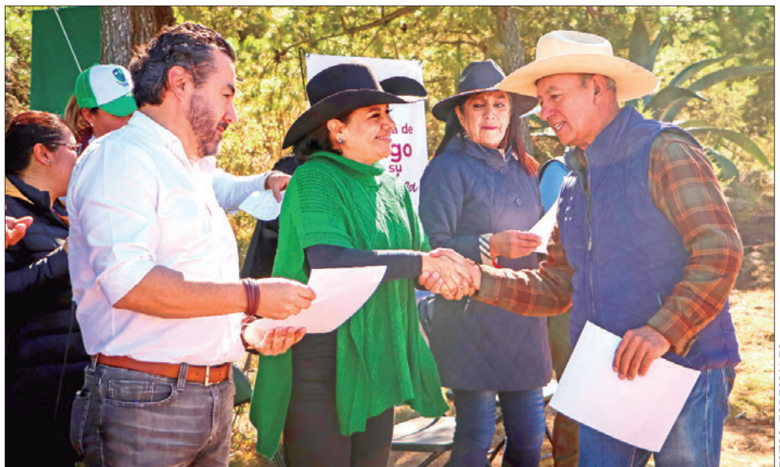
ACTIVIDADES. Se realizó la entrega de reconocimientos a 31 vecinas y vecinos de la colonia Cocinillas que participaron en el curso Manejo adecuado de serpientes y primeros auxilios.