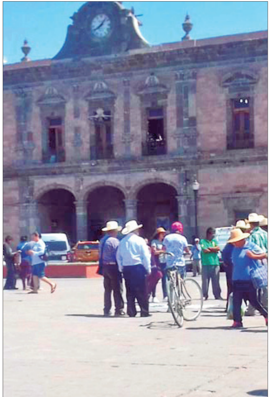
DIÁLOGO. Pese a señalar en un comunicado que los abogados del Valle del Mezquital no tienen sustento en sus dichos, la alcaldía afirma estar dispuesta a escucharlos.

También se menciona que el gobierno municipal procedió a regularizar los trámites y requisitos que se deben cumplir para el registro de bienes inmuebles del catastro municipal, toda vez que en gobiernos anteriores se realizaban prácticas indebidas, por lo que hoy en día se realiza con estricto apego a la legalidad.