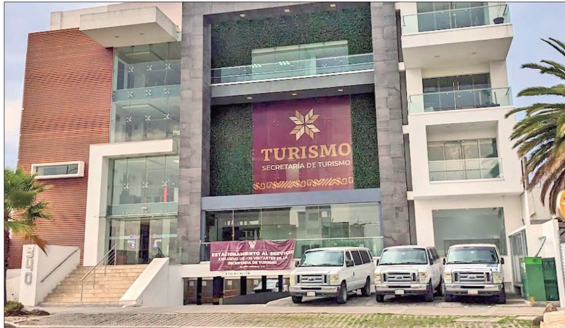
LICITACIÓN. Para el Tianguis Nacional de Pueblos Mágicos 2023 contrataron a la empresa Estrategias inteligentes de Marketing y TI, S.A. de C.V., por 493 mil 828.24 pesos.

Identificar acciones específicas que realice la titular de la Se-