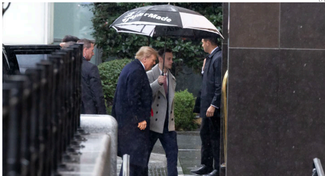
Trump acude a la audiencia del tribunal de Washington.

Con esta defensa, los abogados de Trump buscan que se archive la causa penal en su contra por conspiración para obstruir un procedimiento oficial