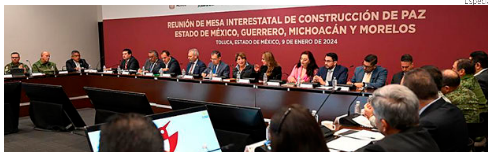
En Toluca, los mandatarios instalaron la Mesa Interestatal de Paz.

De acuerdo con datos de la Encuesta Nacional de Salud y Nutrición, la prevalencia de sobrepeso y obesidad en niños, niñas y adolescentes de 5 a 19 años en México es de 35.6 por ciento, lo que significa que uno de cada tres en este rango de edad tiene sobrepeso u obesidad • (Alejandro Páez)