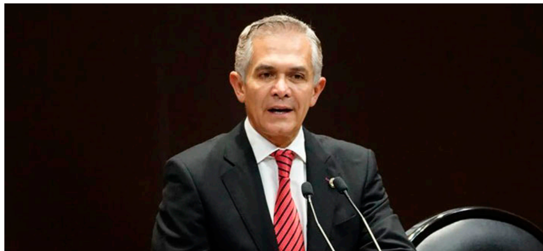
Mancera se ha desempeñado como jefe de Gobierno de la Ciudad de México y actualmente es coordinador de la bancada del Partido de la Revolución Democrática en la Cámara Alta.

no de la Ciudad de México y actualmente es coordinador de la bancada del Partido de la Revolución Democrática en la Cámara Alta, por lo que podría resultar un rival fuerte para arre-