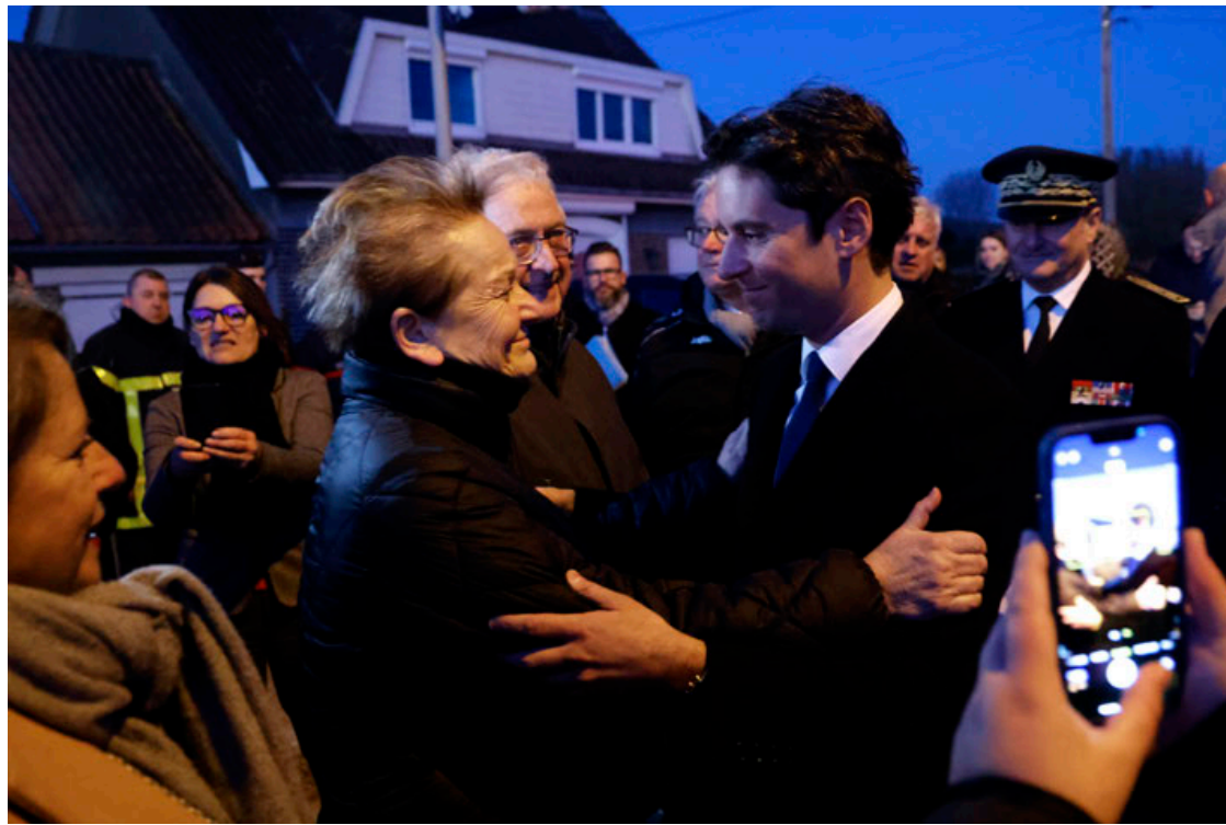
El nuevo primer ministro francés, Gabriel Attal, con las víctimas de inundaciones en Pas-de-Calais.

Y lo pone en manos de un joven político de carrera meteórica, que, a sus 34 años, se convierte en el más joven en dirigir el Gobierno, tan solo ocho después de haber comenzado su andadura política.