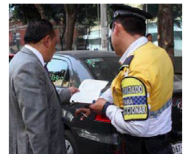
Las multas vehiculares se calculan con base en la UMA. •

Detalló que los valores de la UMA, que entrarán en vigor a partir del 1 de febrero de 2024, serán: diario, 108.57 pesos; mensual, 3 mil 300.53 pesos, y anual, 39 mil 606.36 pesos •