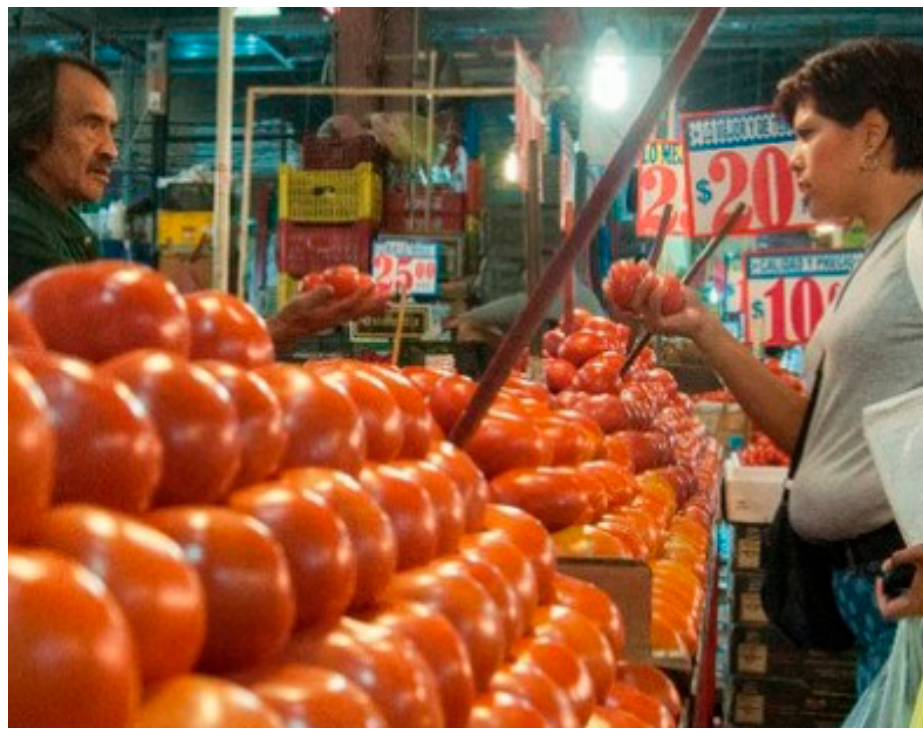
El jitomate, de lo que más se ha encarecido; venden el kilo hasta en 47 pesos el kilo.

En tanto que los productos que más aumentaron en el último mes fueron el