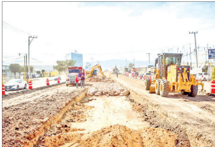
OPCIONES. Beneficiará a un aproximado de 102 mil 406 habitantes de la región, y mejorará el traslado comercial y turístico en el Valle de Tulancingo.

Con una inversión contratada por 161 millones 171 mil 588.59 pesos se programaron trabajos de terracería en 29 mil 373.79 metros cúbicos (m 3 ), obras de drenaje pluvial en mil 449.24 metros lineales (m), sub base de 3 mil 914.09 m 3 , base hidráulica de 3 mil 844.65 m 3 , riego de impregnación de 33 mil 450 litros (l)