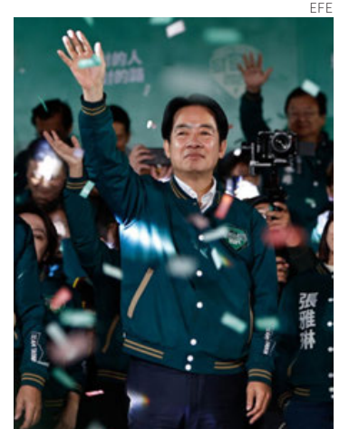
William Lai, candidato electo.

Lai se presentó como un “pragmático trabajador por la independencia de Taiwán”. Durante su campaña, prometió continuar las políticas de la actual presidenta, Tsai Ing-wen, enfocadas en mantener la paz en el estrecho de Formosa. Estos compromisos incluyen el fortalecimiento de las capacidades militares, la consolidación de la indepen-