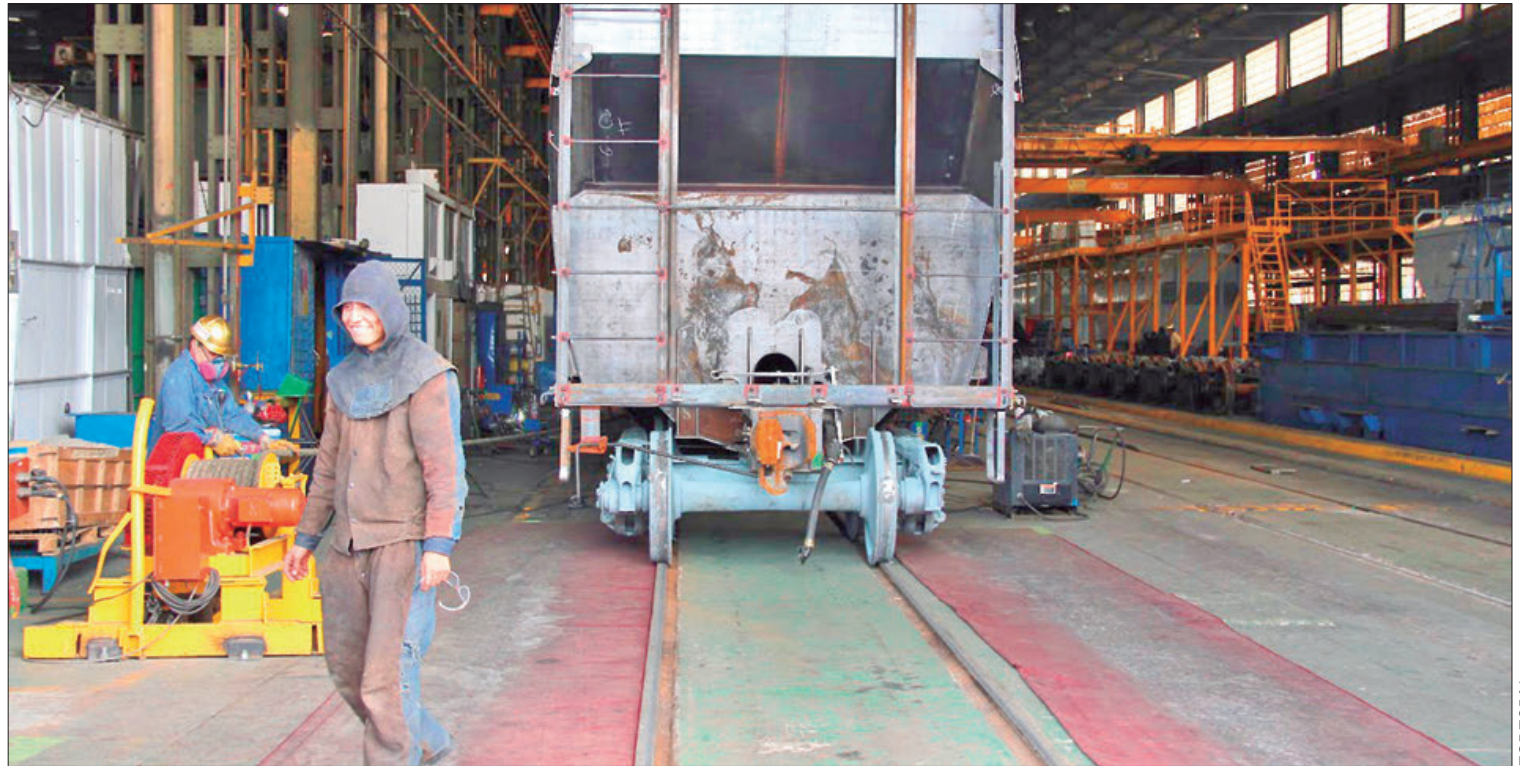
ALTERNATIVAS. Esto se debe a la constante tarea de producción que han logrado y que las ha llevado a establecer nuevos puentes de desarrollo.

Añadieron que para el presente año se espera que esta sinergia involucre a mayor cantidad de comerciantes y que la incidencia delictiva también se mantenga baja a partir de este mes de enero. (Milton Cortés Gutiérrez)