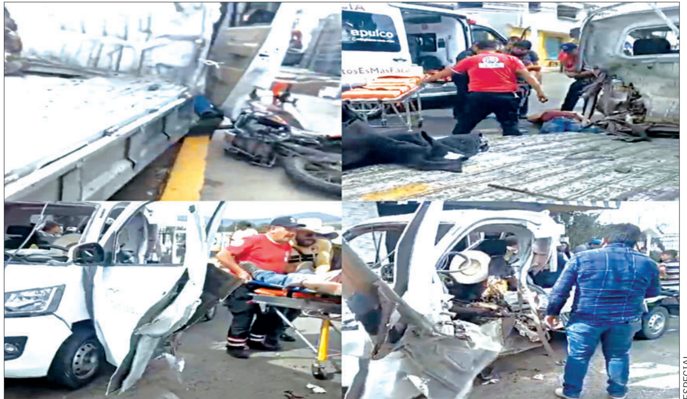
Al menos cuatro personas resultaron lesionadas en una explosión de pirotecnia que se presentó en el municipio de Tepeapulco. De acuerdo con la policía municipal, dicho percance se presentó en la avenida Felipe Ángeles, donde una camioneta propiedad del ayuntamiento que transportaba pirotecnia explotó. Por dicho hecho cuatro personas resultaron lesionadas de las cuales dos de ellas se reportan como graves. Debido al hecho al lugar arribaron paramédicos de diferentes dependencias para atender el incidente.