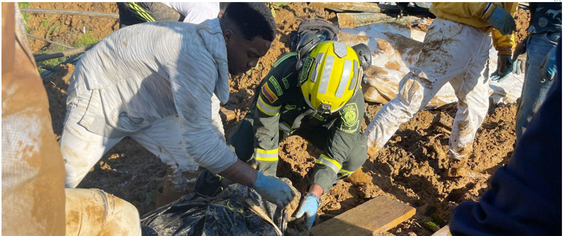
Rescatistas y policías trabajando en la recuperación de cuerpos.