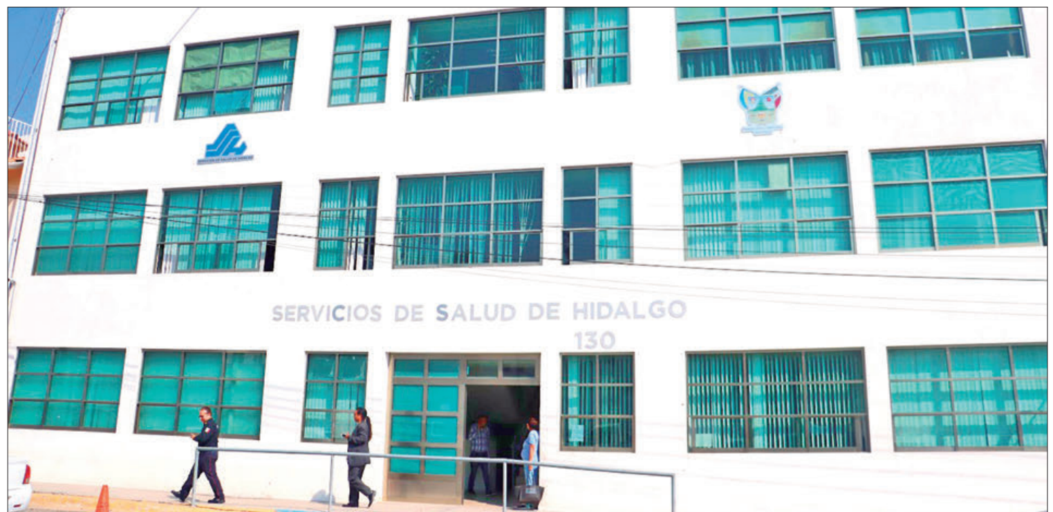
CONTEXTO. Lidia Herrera explicó que la denuncia se presentó desde más de un año ante la PGJEH y en la que se involucran a más de 400 personas afectadas.

pero las financieras siguen cobrando a los empleados que aún no se les resuelve este asunto.