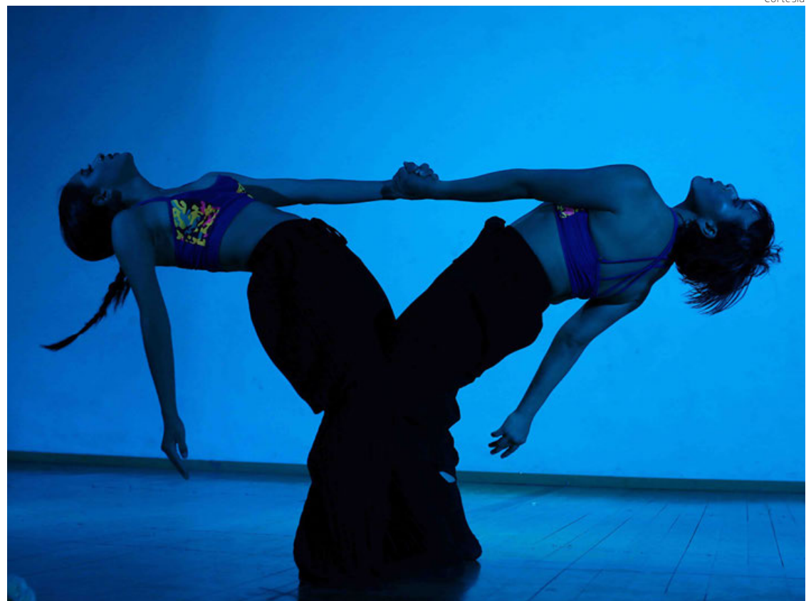
Las escenas del montaje están divididas en 3 momentos de la celebración del Día de muertos.

LA MUERTE ENAMORADA DE LA VIDA “En todas las escenas están pre-