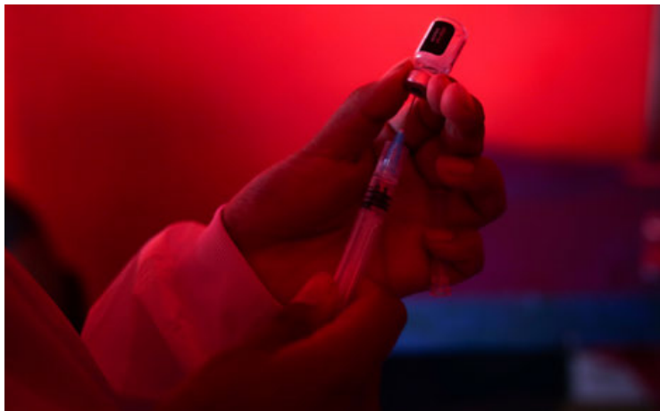
Buena parte de AL registra un repunte de los casos de la COVID 19.

La presencia de la variante JN.1., altamente transmisible, aumenta la preocupación