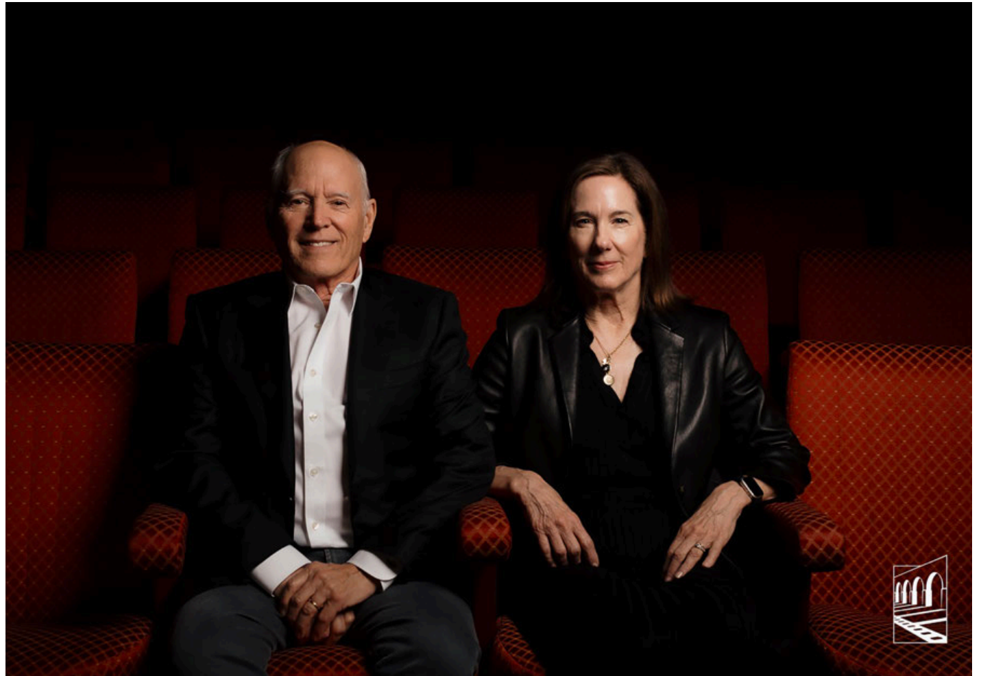
Imagen de los cineastas en Morelia.