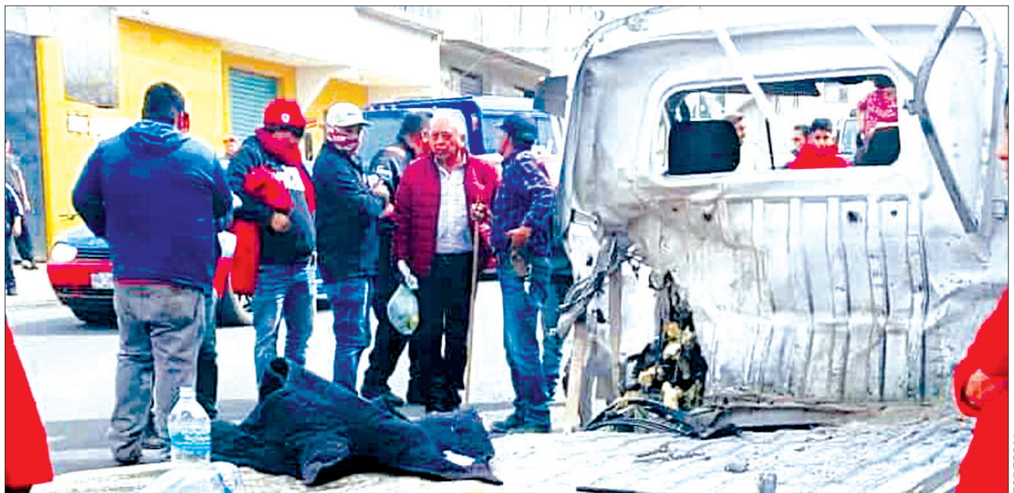
PARTE MÉDICO. Hasta el cierre de la presente edición se reportó que solamente una persona había sido dada de alta luego de la revisión médica.

El ayuntamiento de Tepeapulco dio a conocer que se mantendrán atentos del estado de salud de quienes se encuentran internados y darán seguimiento puntual a la situación registrada la tarde de este sábado para el deslinde de responsabilidades.