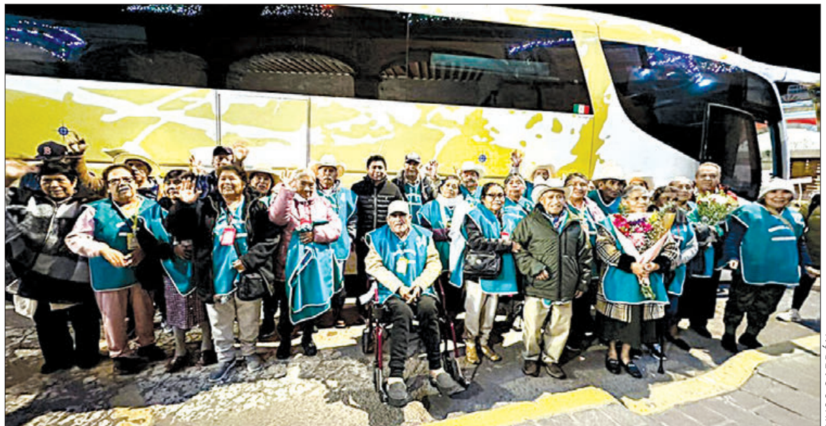
APOYO. Durante el recibimiento de los adultos mayores, la alcaldesa reconoció el trabajo coordinado que existe con el gobierno estatal.

En este mismo sentido, resaltó que el actual gobierno municipal, ha logrado otorgar dos mil asesorías especializadas en trámites migratorios, como citas para pasaportes mexicanos, así como americanos, trámites para visas, formatos SAM, repatriación de cuerpos y visa de trabajo.