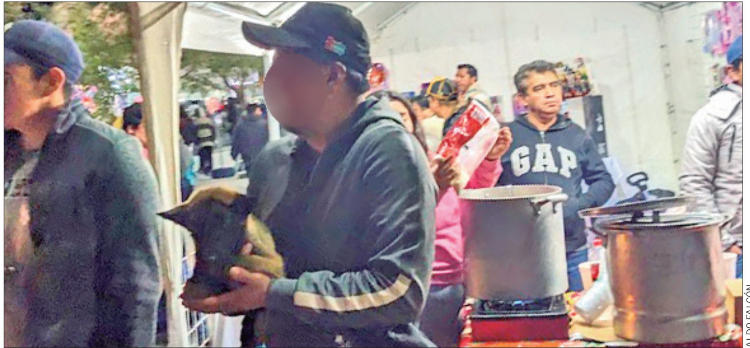
LLAMADO. Solicitaron a la población a que con motivo de las fechas significativas se evite recurrir a la compra y venta de mascotas domésticas para utilizarlas como regalo.

De igual forma dieron a conocer que el operativo "Cajero Seguro" aplicado en las instituciones bancarias, también surtió efectos positivos sin afectación alguna a los cuentahabientes. (Milton Cortés Gutiérrez)