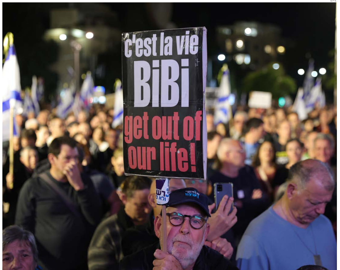
Manifestantes en Tel Aviv piden nuevas elecciones y echar del poder a “Bibi” Netanyahu.

Se trató de la primera manifestación antigubernamental masiva desde que estalló la guerra entre Israel y Hamás el 7 de octubre. Los manifestantes conside-