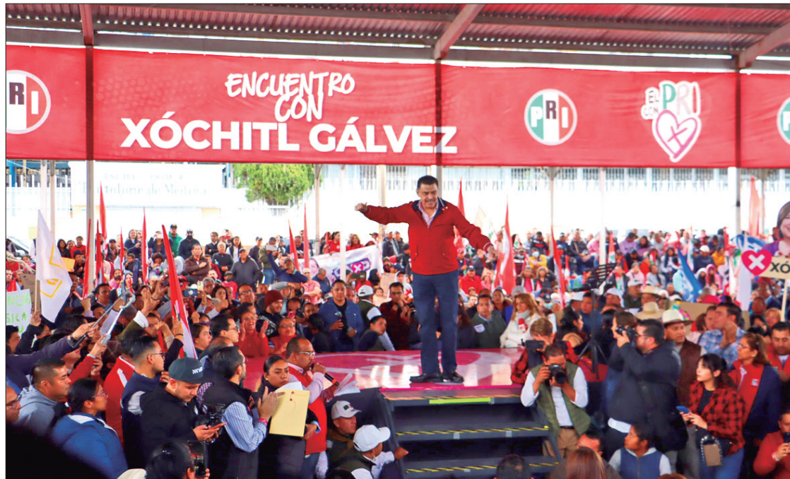
OPINIÓN. El exmandatario subrayó la importancia de formar parte de un partido político y comportarse de manera institucional, en contraste hay otros perfiles que buscan únicamente su beneficio e interés personal.

"Porque ahora tiene que ser del pecunio personal y no es fácil hacer una campaña estatal, pero aun y cuando sea coordinar,