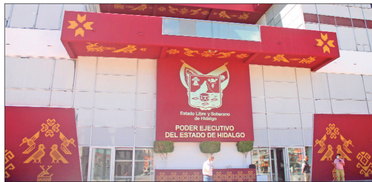
LIMITACIONES. La remodelación de oficinas será limitada a lograr una ocupación más eficiente de los espacios en los inmuebles que generen economías en el mediano plazo.

Aprovecharán las tecnologías de la información y la comuni-