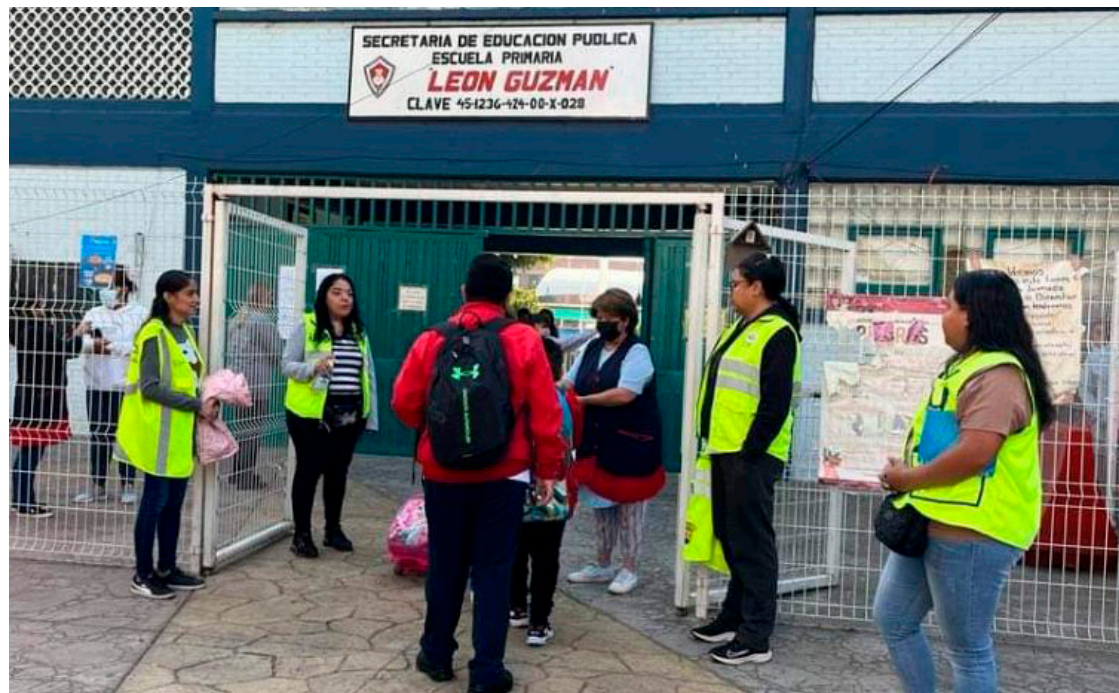
La alcaldía Venustiano Carranza implementa un dispositivo de seguridad en sus más de 190 escuelas públicas de educación básica y bachillerato.

Así, niñas y niños de las primarias Fernando Casas Ale-