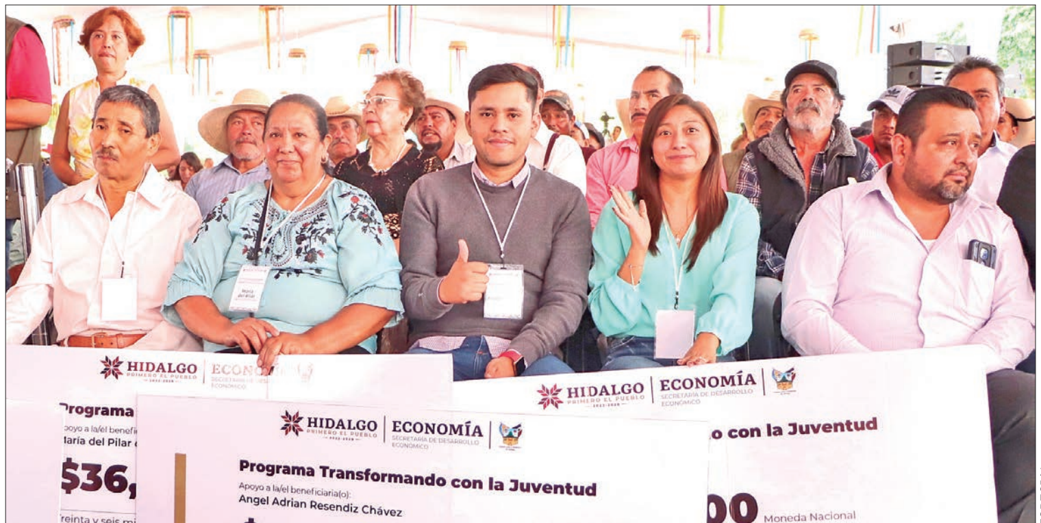
OBJETIVO. Esta inversión busca fomentar oportunidades para que las juventudes hidalguenses permanezcan en el estado y contribuyan al desarrollo local.

Este programa ha tenido cobertura en varios municipios, incluyendo Tula, Tulancingo, Pachuca, Huejutla, Mineral de la Reforma, Tizayuca, Actopan, Ixmiquilpan, Zacualtipán, Apan, Huichapan y Jacala.