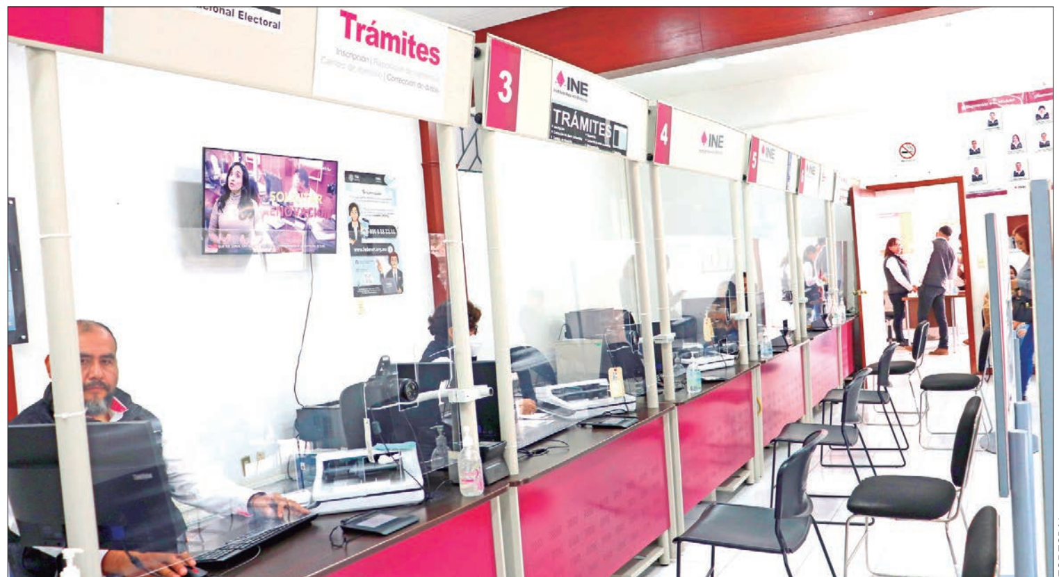
AVAL. Se aprobó la modificación del Directorio de Módulos de Atención Ciudadana para la Campaña Anual Intensa 2023-2024 que opera en esta entidad.

Para más información: consultar las redes sociales del INE Hidalgo, X, Facebook, o llamar al: 8004332000.