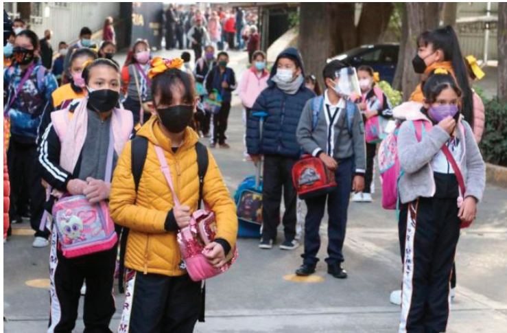
Hoy regresan a clases más de un millón setecientos mil alumnos en la CDMX.

El operativo abarcará las 16 alcaldías de la CDMX, con el objetivo de resguardar la integridad física y patrimonial de estudiantes, personal docente y padres de familia