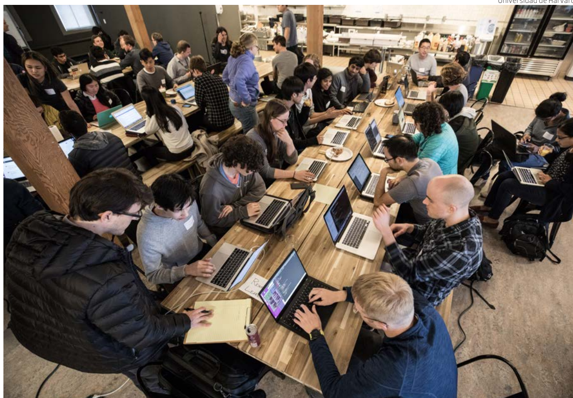
Universidad de Harvard

Debido a que el desarrollo de software se realiza en equipos cada vez más grandes e interculturales, es una ventaja dominar totalmente un idioma común.