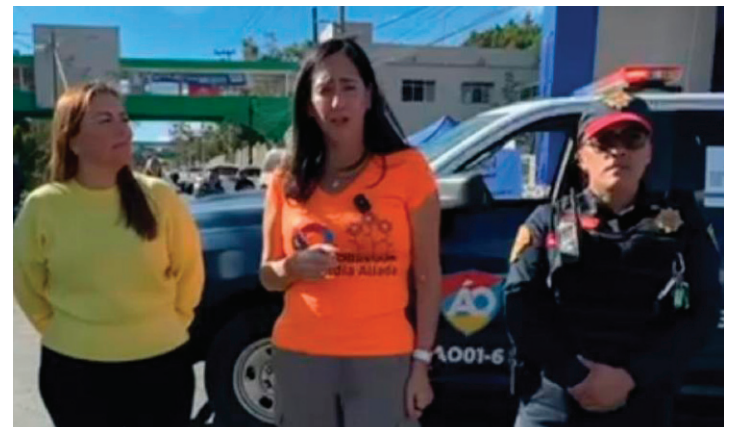
La alcaldesa Limón destacó acciones adicionales implementadas durante el ciclo escolar, que incluyen patrullajes itinerantes en escuelas.

Estas iniciativas buscan fomentar la sana convivencia escolar y prevenir el consumo de sustancias prohibidas en los alrededores. La alcaldesa Limón desea un feliz regreso a clases para los poco más de 180 mil estudiantes de los niveles preescolar, primaria, secundaria y bachillerato. (Redacción / Crónica)