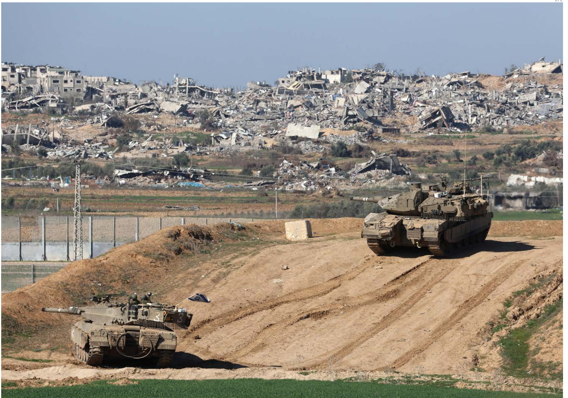
Tanques israelíes patrullan el norte de la Franja, donde la destrucción es total.