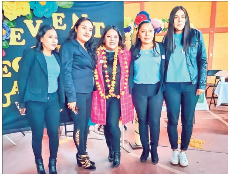
OPERACIÓN. Estas unidades forman parte del Programa para el Adelanto, Bienestar e Igualdad de las Mujeres del Instituto Nacional de las Mujeres.

En dichas acciones, las mujeres exhibieron sus productos y compartieron experiencias, convencidas de que la apropiación de sus derechos es un primer paso para su autonomía y desarro-