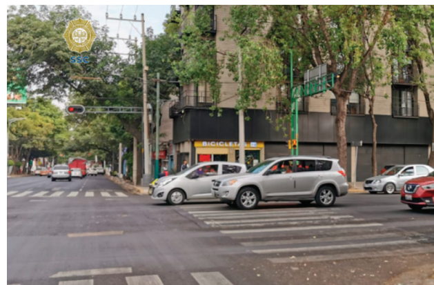
El tramo será reversible de lunes a viernes, en el horario de 18:00 a 21:00 horas

A partir del lunes, el Eje 5 Sur experimentará un cambio significativo en su circulación. Desde Eje 4 Oriente Canal del Río Churubusco hasta Eje 2 Poniente Gabriel Mancera, el tramo será reversible de lunes a viernes, en el horario de 18:00 a 21:00 horas.