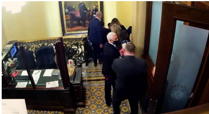
Cámara capta el momento en que el vicepresidente, Mike Pence, quien presidía la votación de ratificación de la victoria de Biden, era desalojado tras el asalto de los seguidores de Trump, el 6 de enero de 2021.

agradecido" por los esfuerzos del FBI para detener a quienes "saquearon nuestro Capitolio y cometieron actos violentos contra agentes de policía ese día", y exigió que quienes participaron en el ataque sean juzgados "con todo el peso de la ley".