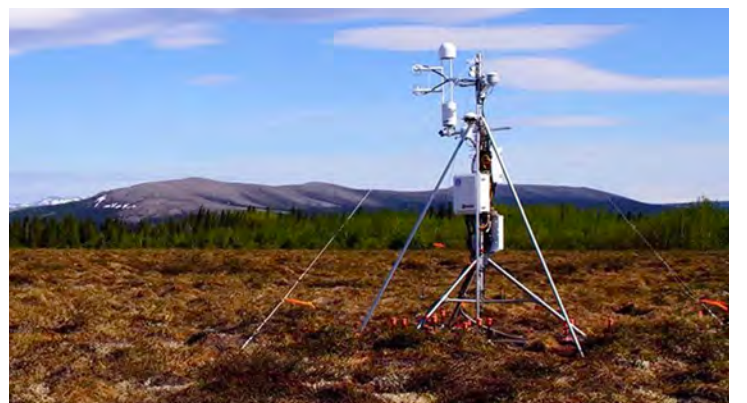
Una torre de covarianza de remolinos que mide gases de efecto invernadero, en Alaska.

Las emisiones de metano de los humedales en toda la región Boreal-Ártica y descubrió han aumentado aproximadamente un nueve por ciento desde 2002, revela un nuevo estudio del Berkeley Lab.