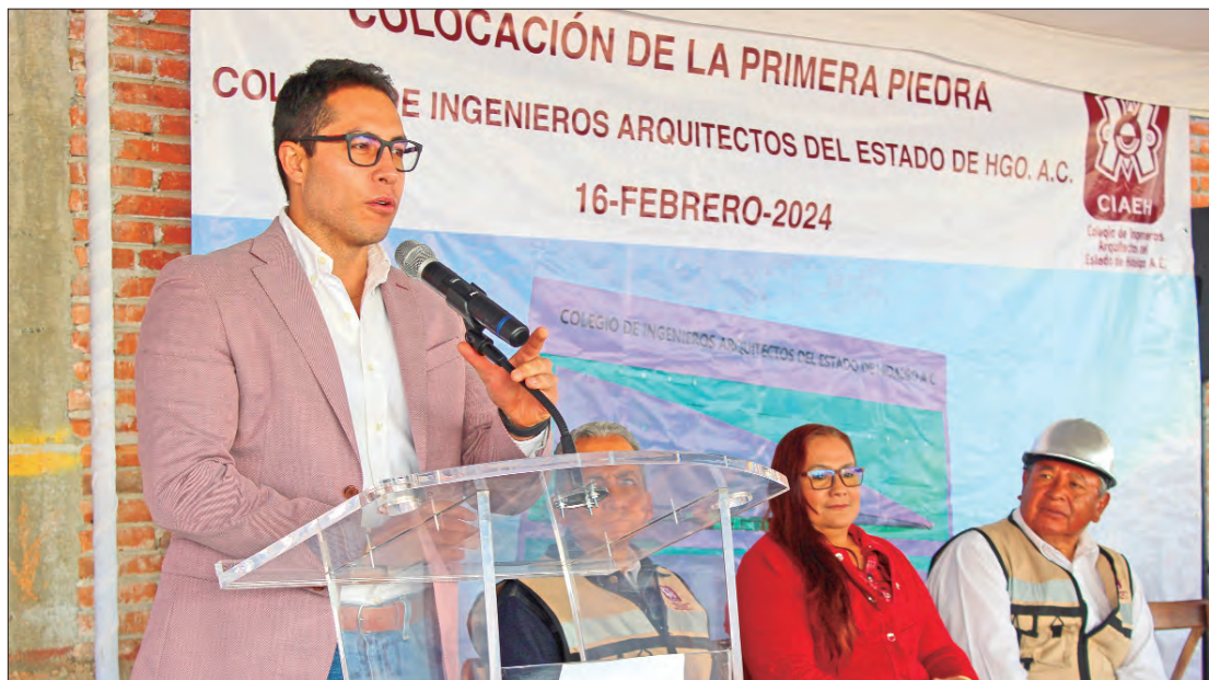
MENSAJE. Secretaria de Infraestructura Pública de la entidad, cuenta con un presupuesto histórico.