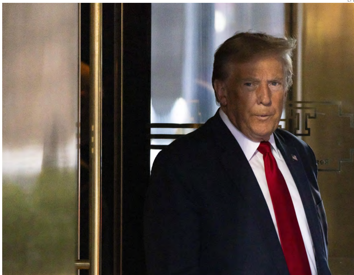
Trump "ya ha causado un daño sin precedentes al derecho al aborto": Planned Parenthood Action Fund.