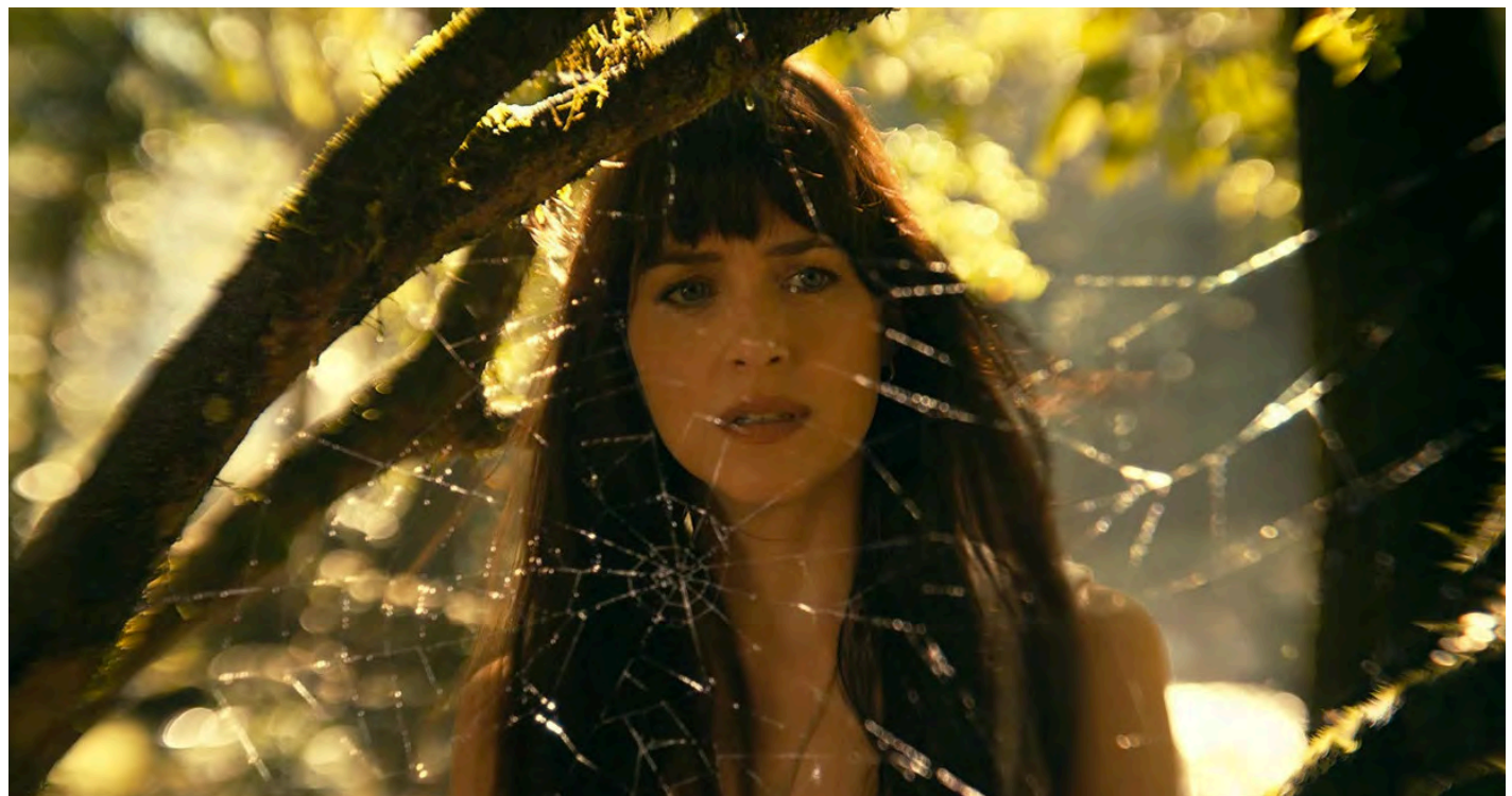
Fotograma del filme.

Entre los varios problemas de este mundo de ficción que rayan en lo ridículo está el constante uso de un taxi robado que nadie denuncia o que, al parecer, Perú es prácticamente