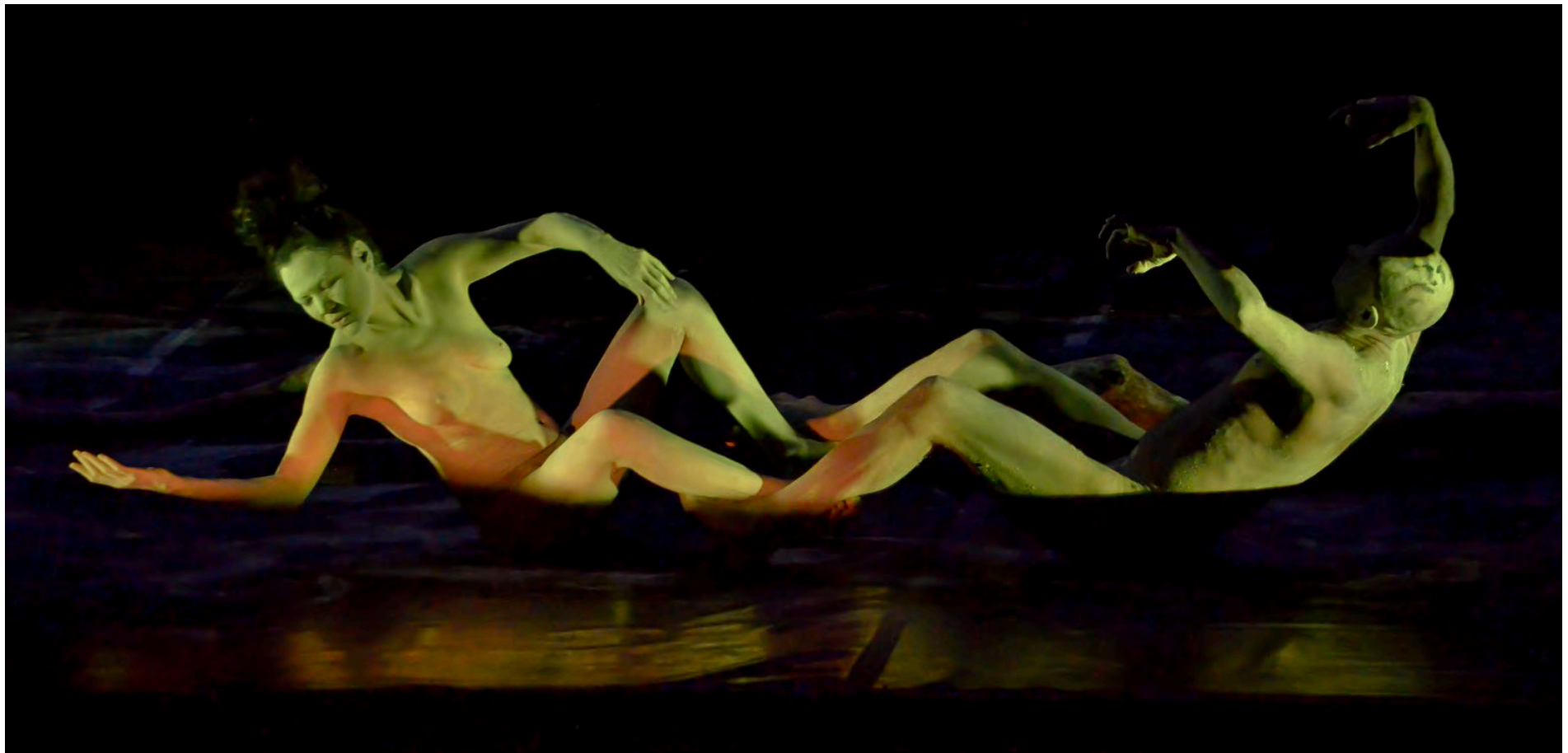
“El Concreto es eterno” se presenta en el Teatro de la Danza Guillermina Bravo.

La obra ganadora del Premio Nacional de Danza Guillermo Arriaga ofrece este domingo última función a las 18:00 horas