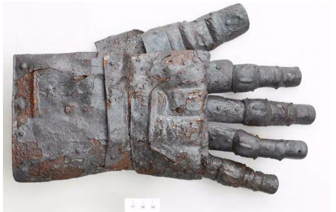
Foto del guante del siglo XIV encontrado cerca del castillo de Kyburg, en Suiza.

El guante fue localizado en un sótano que se descubrió en los terrenos en los que se ubica esta casa cercana al castillo de Kyburg. El Departamento de Infraestruc-