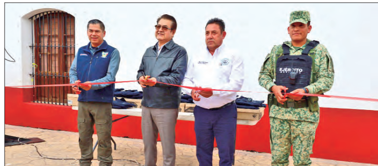
CARENCIAS. Falta de elementos, bajos salarios de los policías, falta de equipamiento, capacitaciones y certificaciones.