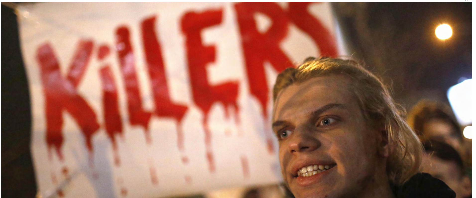
Manifesteros protestan tras la muerte de Navalni, en la embajada rusa en Georgia.