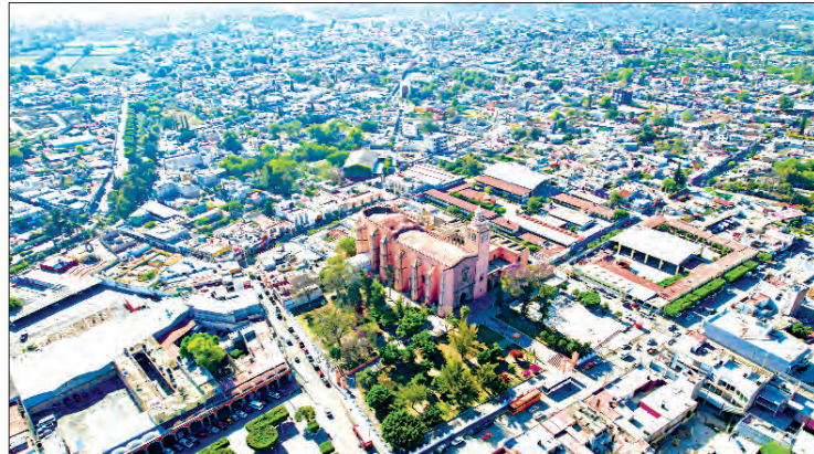
IXMIQUILPAN. Trabajarán ante la demanda ciudadana de mejorar dicho parque.