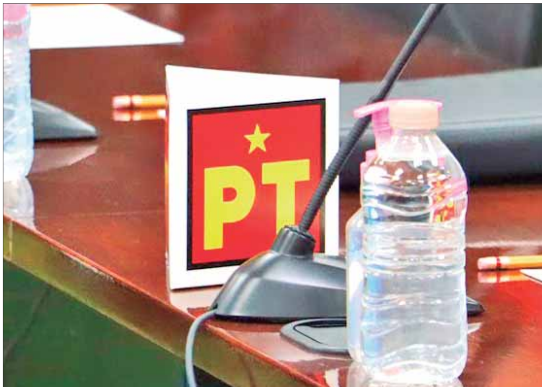
QUEJA. La cúpula guinda promovió el procedimiento especial sancionador 050 para denunciar al partido de la estrella.

"En el caso de la frase relativa a 'Que siga la 4T' o cualquiera otra análoga en donde se emplee la frase relativa a la 4T o CUARTA TRANSFORMACIÓN son frases