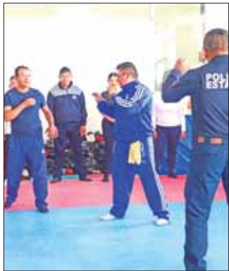
PROFESIONALIZACIÓN. Instruyen a policías en sus tareas.

► Los cursos fueron dirigidos a 243 elementos de corporaciones de diversas alcaldías