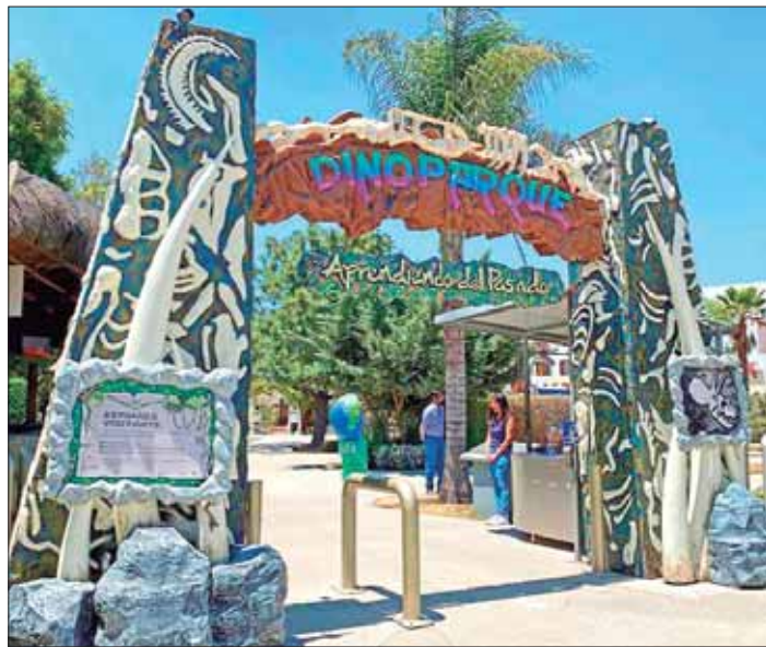
RECORRIDO. El Dinoparque se divide en diferentes zonas que representan los periodos que marcaron la existencia de los dinosaurios.

Y para destacar la riqueza paleontológica de Hidalgo, el museo ha dedicado un cartel especial a los hallazgos de fósiles que