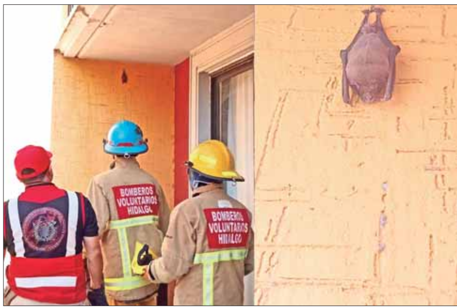
Elementos de bomberos voluntarios del estado capturaron y resguardaron un murciélago que ingresó a un domicilio del fraccionamiento la Joya en Epazoyucan. Una llamada de emergencia alertó sobre el mamífero en una casa, al arribar al lugar los cuerpos de emergencia localizaron el animal que fue resguardado y liberado en una zona despoblada.

La autoridad electoral local habilitó el sistema "Candidatos y candidatas conóceles", el cual detalla nombres y apellidos de aspirantes, grado académico, trayectoria política y participación social, un espacio entre 280 a 5 mil caracteres en donde exponen sus propuestas, medios de contacto, dirección de sus casas de campaña, además del cuestionario de identidad a fin de reconocer si es una persona perteneciente a un grupo vulnerable. .3