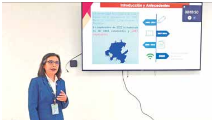
MECÁNICA. Las bases y términos a que se someterán los candidatos, están disponibles en la convocatoria publicada en la página oficial citnova.hidalgo.gob.mx .

y nuevos procesos encaminados a resolver las problemáticas y oportunidades de desarrollo de la entidad.