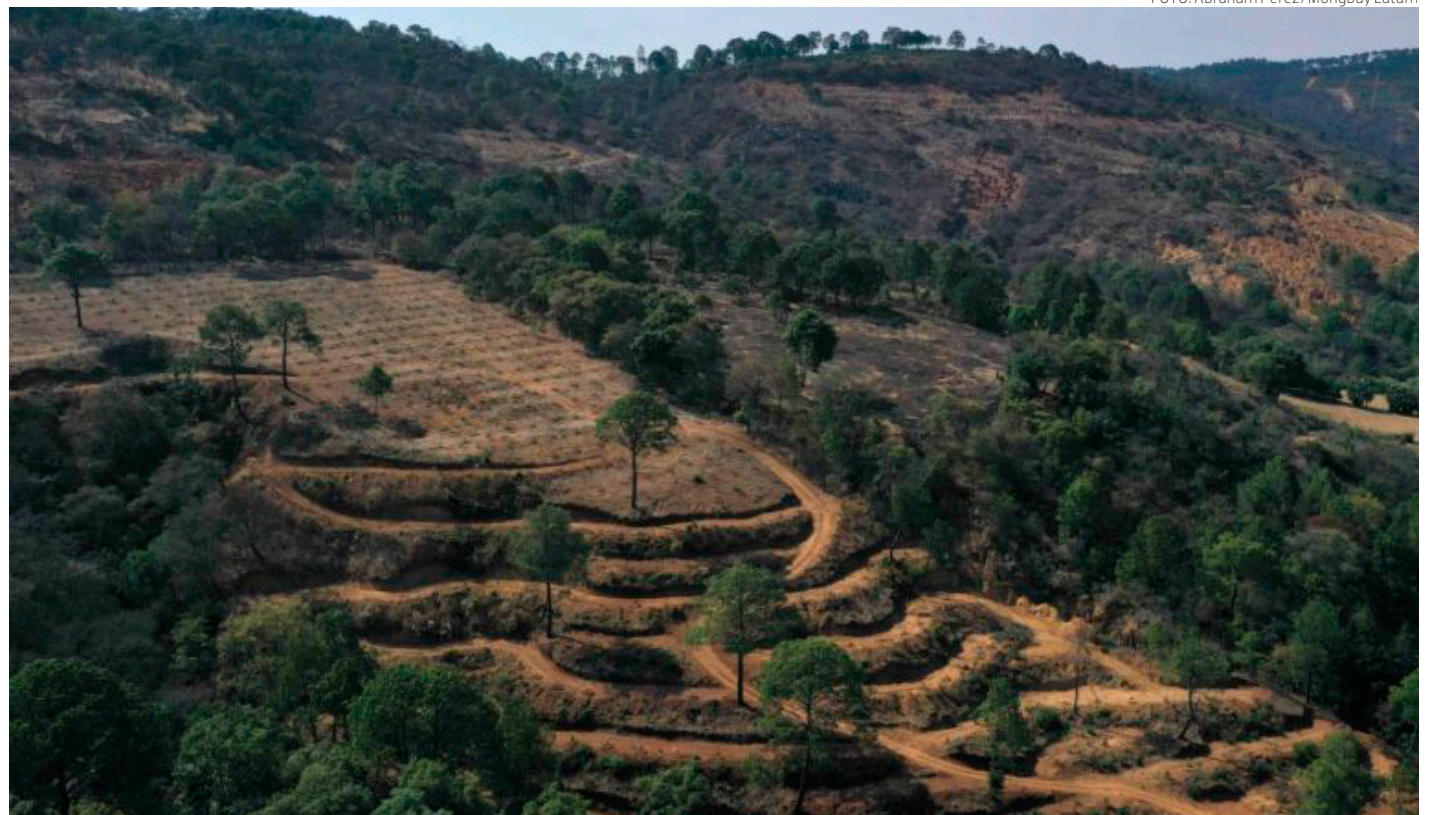
Huerta de aguacate plantada de manera irregular en Jalisco.

La académica y ambientalista, miembro de El Colegio Nacional, señala que abunda la evidencia científica para comprender que no todos los ecosistemas naturales pueden ser intervenidos por la acción humana sin