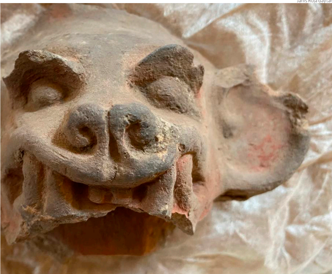
Fragmento de escultura en barro que representa un murciélago de la región oaxaqueña y recuperada en Xico.