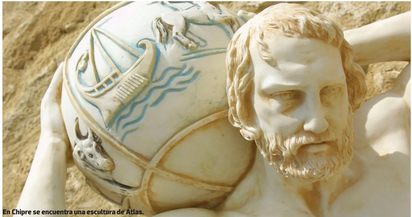
En Chipre se encuentra una escultura de Atlas.

colocado por algunos en doce y otros afirman que fueron catorce, o más. Se solían asociar en parejas y, en este caso, había un Titán junto a una Titánide. Se afirma que cuando los dioses crearon los siete planetas conocidos en esa época —incluían al Sol y a la Luna— pusieron a una pareja de ellos bajo su control y custodia. Fue así que la pareja de Titanes, Tía e Hiperión, se hicieron cargo del Sol; Febe y Atlas, de la Luna; Dione y Crío, de Marte; Metis y Ceo, de Mercurio; Thémis y Eurimedonte, de Júpiter; Tetis y Océano, de Venus; y, Rea y Crono, de Saturno. (R. Graves).