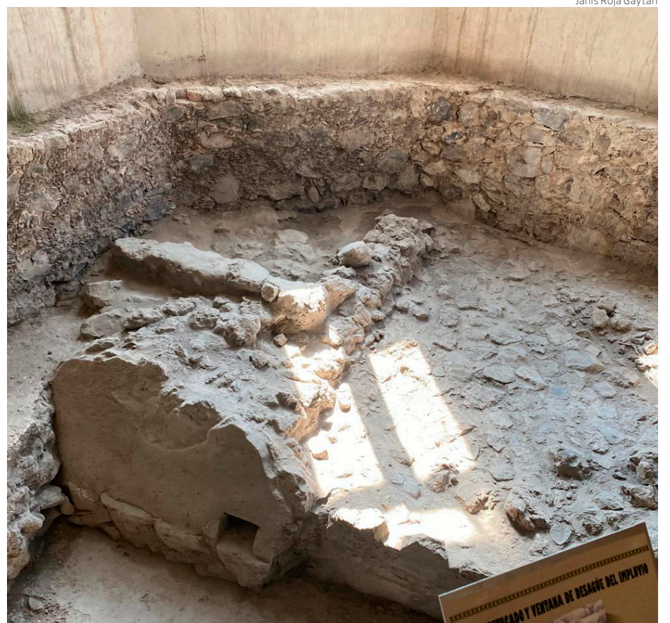
Estructura teotihuacana en el interior de la ex Hacienda de Xico.

El Volcán Xico lleva varios años de investigación por parte de la Dirección de Salvamento Arqueológico del INAH y del Centro INAH Estado de México.