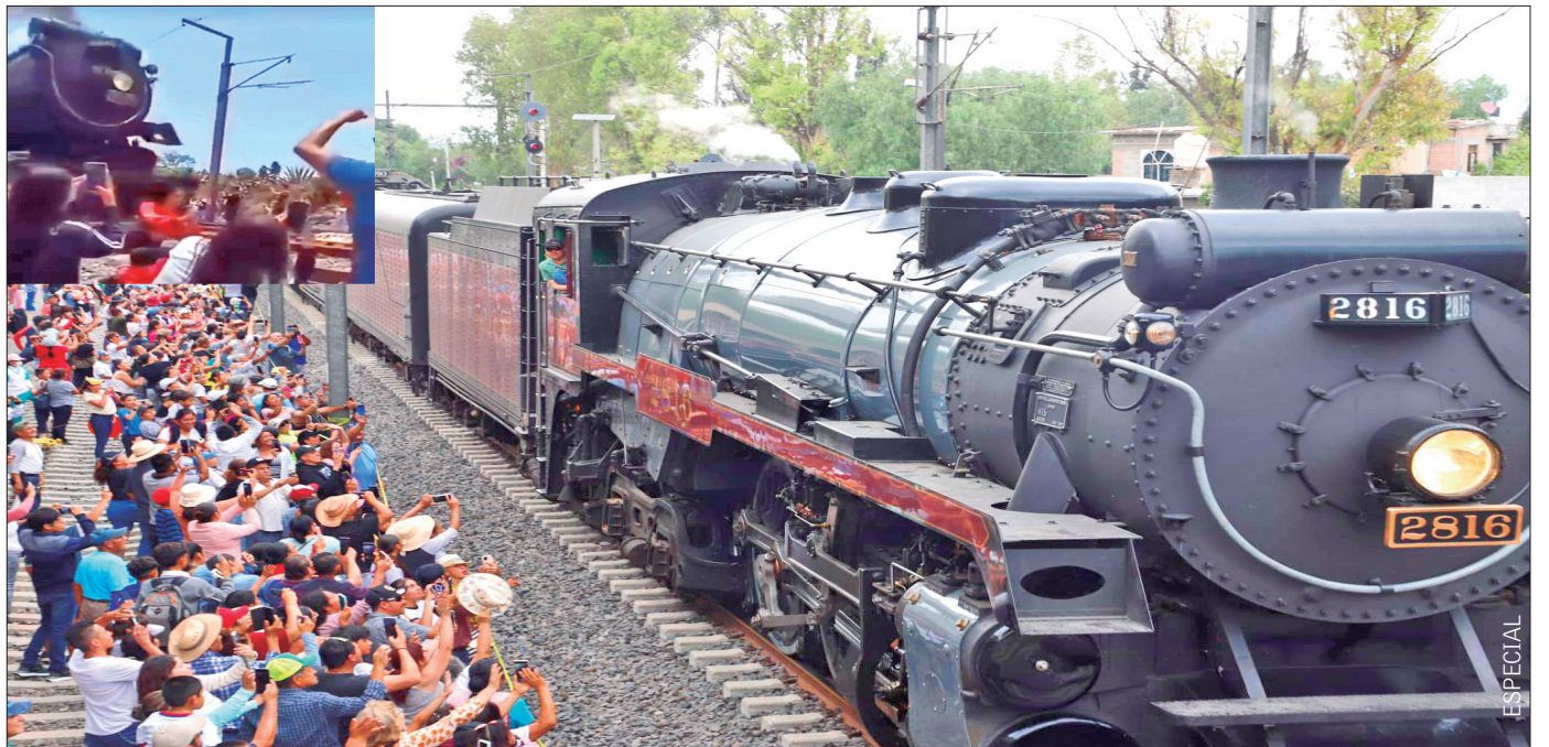
EXPECTATIVA VS REALIDAD. Quedó empañado el arribo de la famosa locomotora Empress , cuyo último recorrido empezó en Canadá, por la muerte instantánea de una joven, quien al intentar tomar una selfie recibió un fuerte golpe en la cabeza.

De acuerdo con el Programa de Resultados Electorales Preliminares (PREP), Morena y Nueva Alianza Hidalgo (PNAH) ganaron en 53 alcaldías con más de 559 mil votos consolidados, demarcaciones con alta población como Pachuca, Tizayuca, Tulancingo, Tula de Allende, Huejutla de Reyes, Ixmiquilpan, Actopan, entre otros. 3