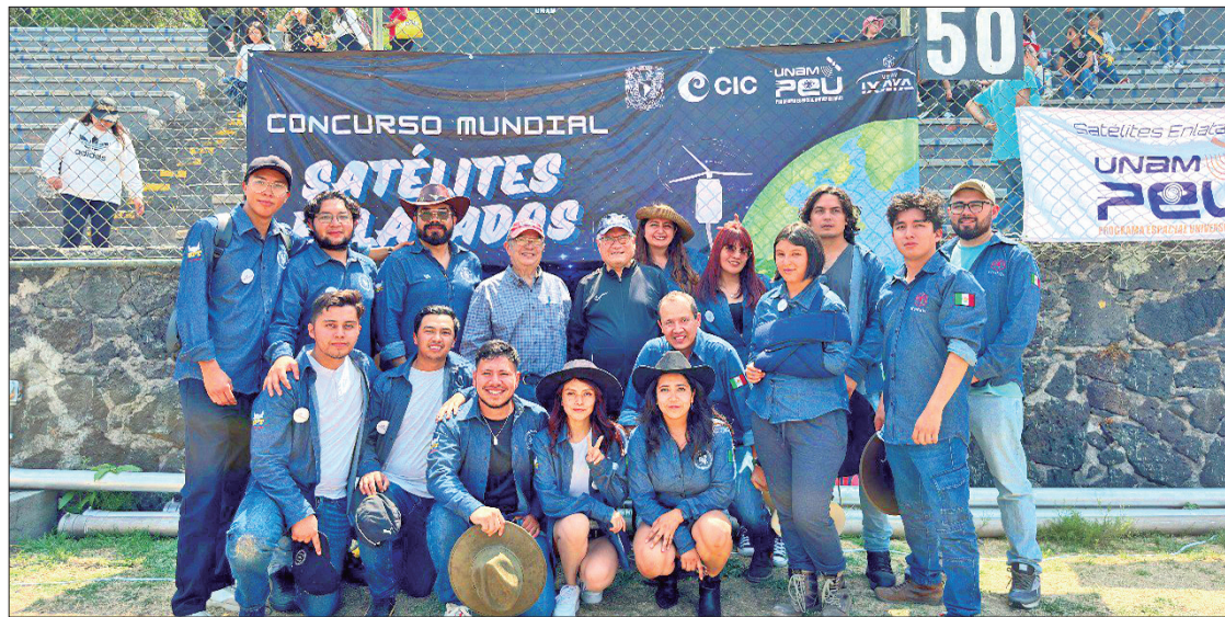
AVANCE. En la competencia participaron 37 equipos en la etapa 6 de aceptación: el equipo "Scorpion" obtuvo el 4º lugar.

En la UTP, se impulsa de manera constante que las y los integrantes de la comunidad educativa apliquen los conocimientos adquiridos en situaciones reales; dando como resultado, egresados con las herramientas necesarias que les permitirán insertarse de manera inmediata en el campo laboral, gracias a la experiencia obtenida durante su formación profesional.