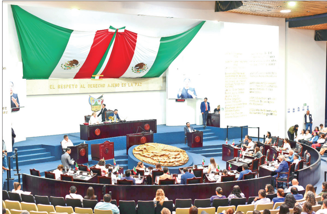
OBJETIVO. El propósito es generar entornos favorables para quienes se encuentran en condición de autistas, contar con señalética con matices de inclusión.

El diputado Fortunato González Islas expuso que el Plan Estatal de Desarrollo 2022-2028, señala en su acuerdo transversal titulado "Acuerdo por la Transparencia y Rendición de Cuentas" que es Derecho de la ciudadanía acceder a la información gubernamental y es compromiso