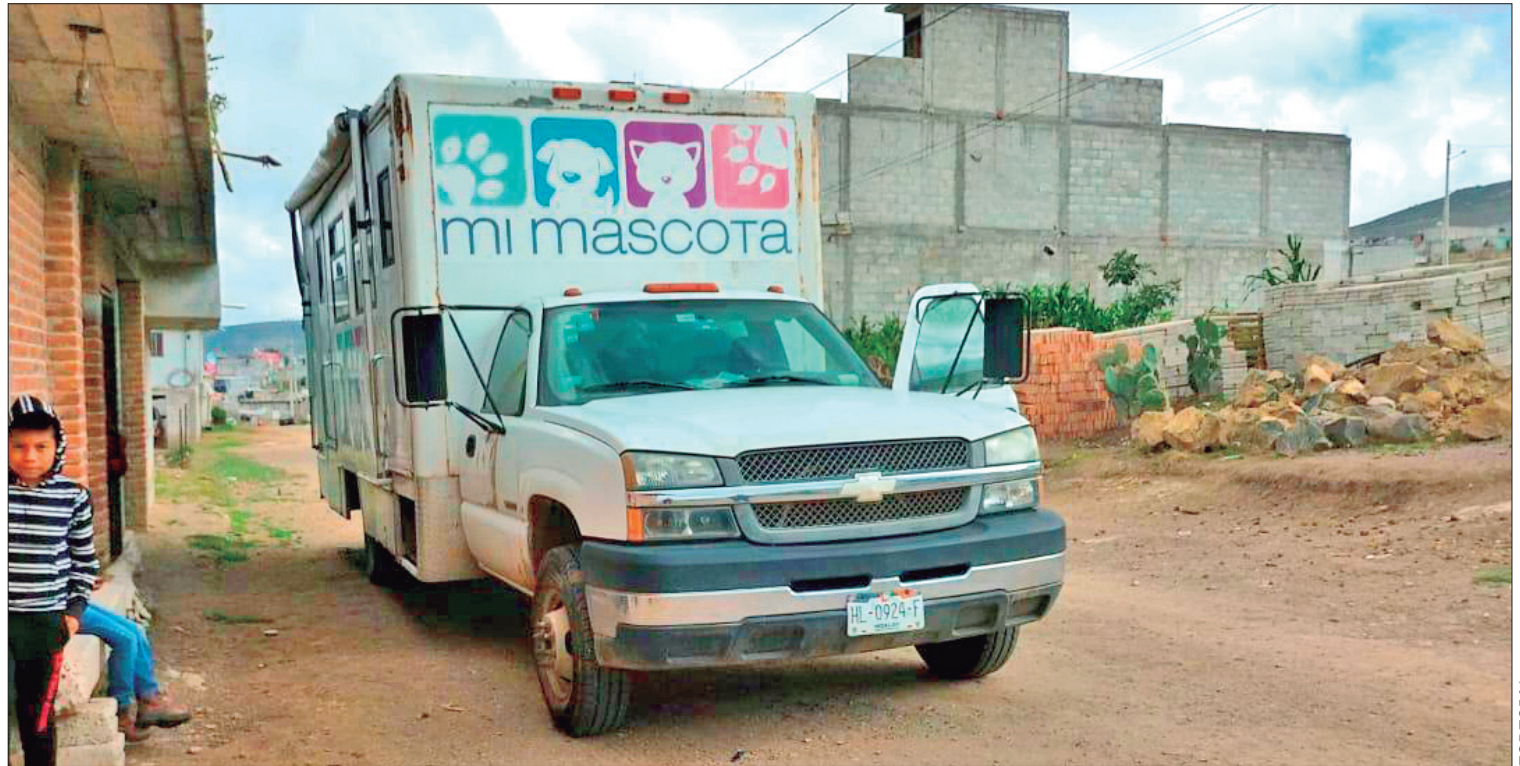
ACCIONES. El objetivo de controlar la reproducción indiscriminada de animales, tanto caninos como felinos.

Mientras tanto, el día 14 la unidad de recaudación estará acudiendo a la colonia Estrella, estableciendo el centro de recaudación, a un costado de la iglesia de dicho perímetro, y el día 18 estará en el ejido Mimila, situando la caja de recaudación frente al Centro de Salud, de dicha área en el horario de 9 a 15:30 horas. (Staff Crónica Hidalgo)