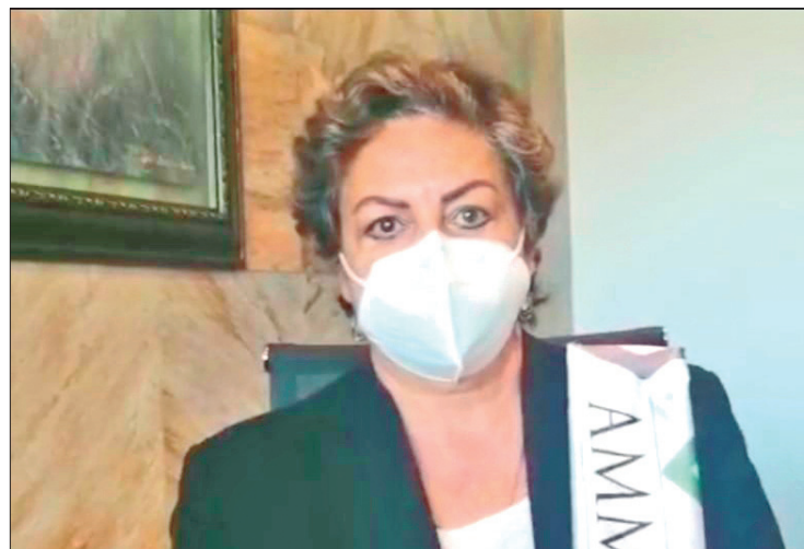
RITMO. Al programa que se inscribió la AMMJE es Apoyo Económico y Competitividad del Estado de Hidalgo, por medio del cual otorgarán el 70 por ciento de los recursos para la infraestructura.

mo 14 de junio en el salón Benévolo, el costo del boleto es de mil pesos.