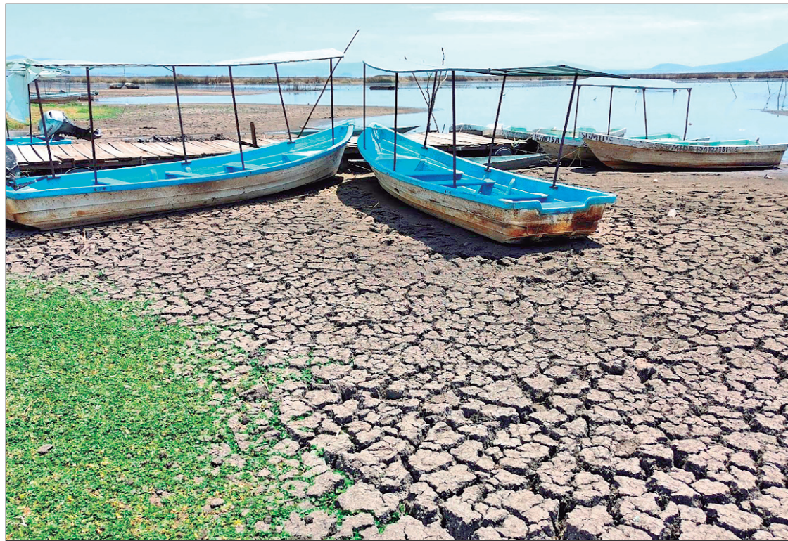
OBJETIVO. Día Mundial del Medio Ambiente, es la plataforma más grande para la divulgación de temas relevantes en ese sentido.

Las Áreas naturales de competencia estatal son el Parque Ecológico Cubitos y el bosque El Hiloche; el cerro El Tecajete, una reserva privada llamada Finca Tongolome (en el municipio de Tlanchinol), el zoológico y los cerros La Paila-El Xihuingo. Las Zonas de Conservación Ecológica Municipales: Mixquiapan, La Lagunilla, El Campanario, Cascada de Cuatenahualt, Cerro El Aguacatillo, Cerro La Paila-El Susto, Cerro La Paila-Matías Rodríguez, Nopala, Dandhó, Dohí, la Cañada Huixcazdhá, La Laguna, Mamithí, Rancho Huixcazdhá, Rancho Ñathu, Zóthe, Arroyo Nogales, Cruz de Plata, Plan Grande, entre otras