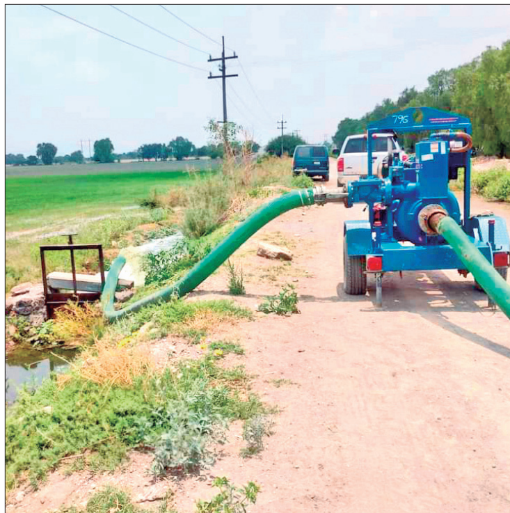
RESPALDO. Desde el inicio del estiaje, la Dirección Local Hidalgo Conagua tomó acciones para auxiliar en el bombeo de agua para riego agrícola.

Aunado a lo anterior, se ha informado que personal de la Guardia Nacional y la brigada de Protección a la Infraestructura y Atención de Emergencias (PIAE) de la Conagua, realizan recorridos por los canales de riego de los Distritos de 003 Tula, 100 Alfajayucan y 112 Ajacuba, a fin de vigilar que se cumplan los programas de compuertas autorizadas.