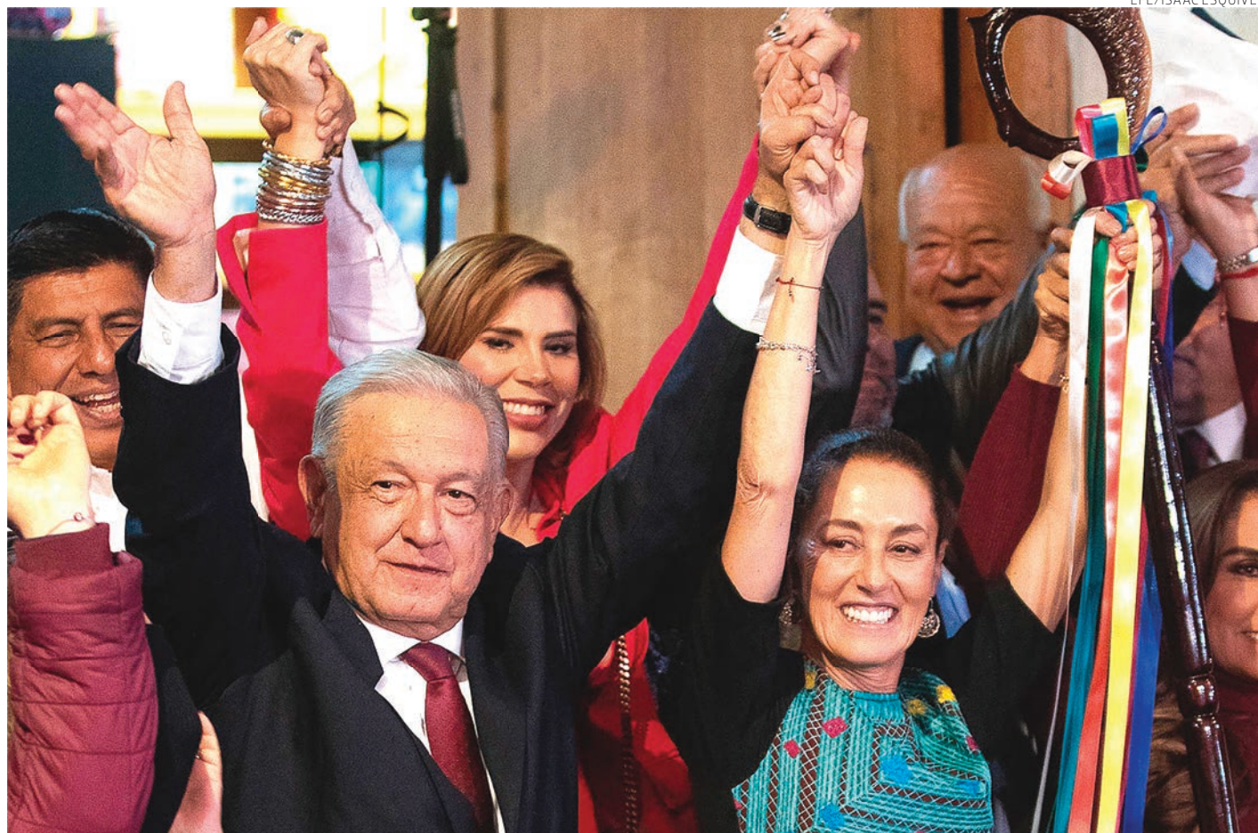
Andrés Manuel López Obrador y su heredera política, Claudia Sheinbaum.

Aunque The Washington Post señala que Sheinbaum creció en el seno de una familia de la izquierda progresista —“Su madre, profesora de biología, fue