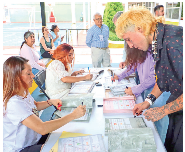
AGENTES. En 29 demarcaciones exhiben diferencias menores al 5 % entre el primero y segundo lugar, por lo que partidos políticos auguran cambios de números con base en los cómputos donde contabilizarán los votos válidos, nulos y sobrantes.

El Código Electoral hidalguense menciona que si de la sumatoria de resultados que conste en las actas de cómputo distrital de todos los distritos establece que la diferencia entre el candidato aparentemente ga-