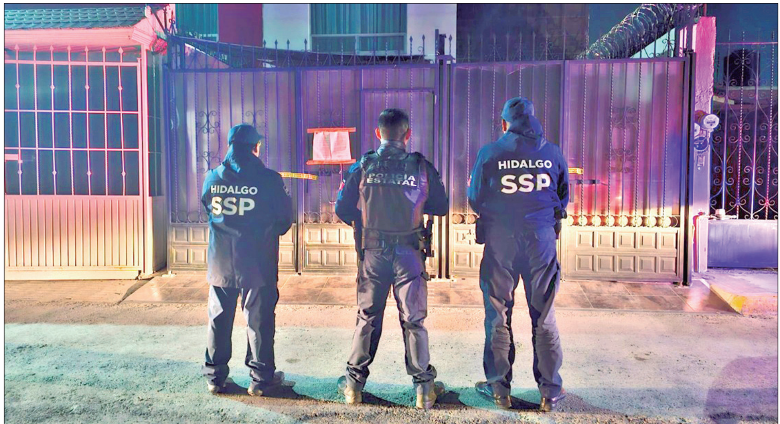
AUTORIDAD. Las personas detenidas, así como lo decomisado quedaron a disposición del agente del Ministerio Público.

La SSPH reitera su compromiso con la población hidalguense para llevar a cabo acciones preventivas, que fortalezcan la confianza entre autoridades y ciudadanos, sumando al proyecto de reconstrucción de la paz en el estado. (Staff Crónica Hidalgo)