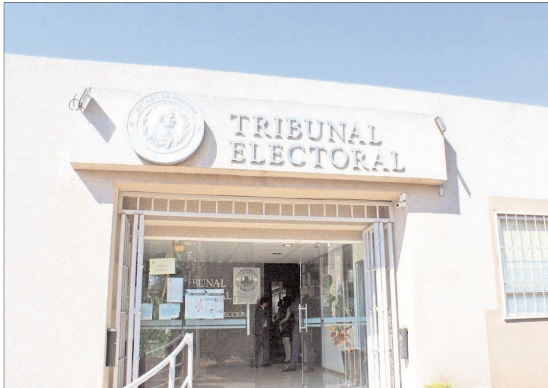
RAZONES. Algunas de las causales que denuncian son la presunta inelegibilidad de los candidatos electos, conductas que constituyeron presunta violencia política por razón de género.

Algunas de las causales que denuncian son la presunta inelegibilidad de los candidatos electos, conductas que consti-