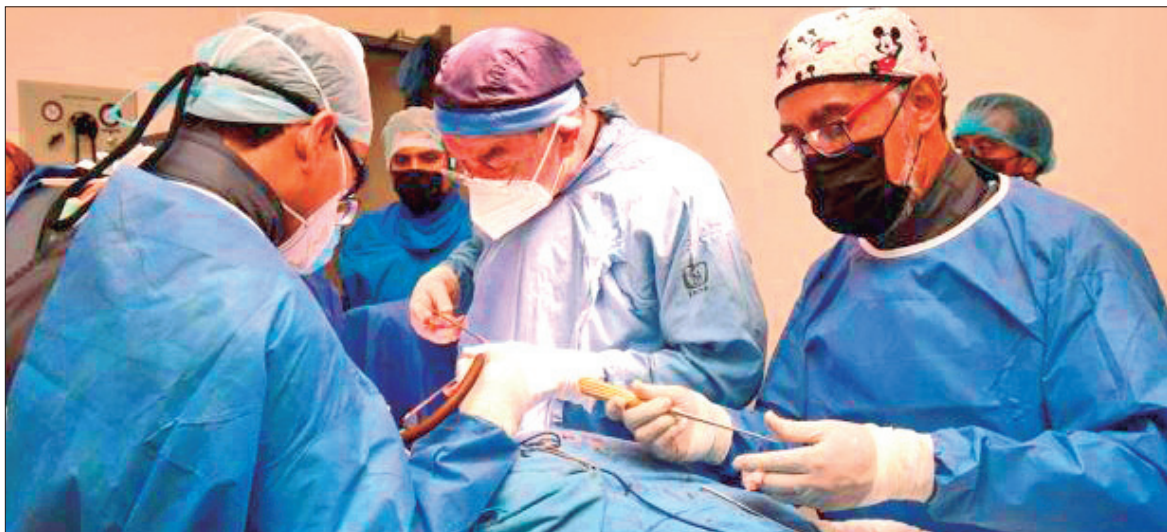
LLAMADO. Se recomienda que féminas mantengan un diálogo abierto con su médico para discutir su historial clínico.

Antes de someterse a este procedimiento, se recomienda que las pacientes mantengan un diálogo abierto con su médico para discutir su historial clínico y asegurarse de que no hay contradicciones; es fundamental seguir las indicaciones médicas, así como contar con una acompañante que brinde apoyo durante el proceso.