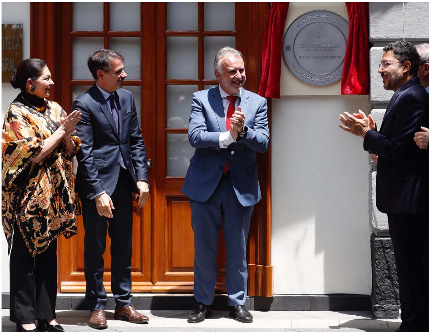
Develan placa que recuerda la llegada al país de españoles exilados gracias a la política del expresidente Lázaro Cárdenas.

Su valor es incalculable como garante de la difusión en América de la memoria del exilio español: Víctor Torres