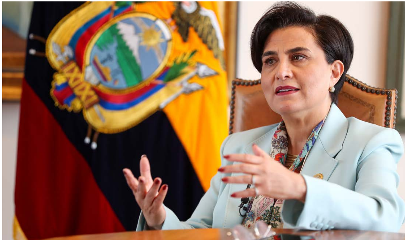
La canciller de Ecuador, Gabriela Sommerfeld, este miércoles en Quito.

Sin embargo, mencionó que, en sus declaraciones públicas, el Gobierno mexicano ha dicho hasta ahora que “no van a abrir este diálogo, sino que se va a resolver todo en la Corte de La Haya”.