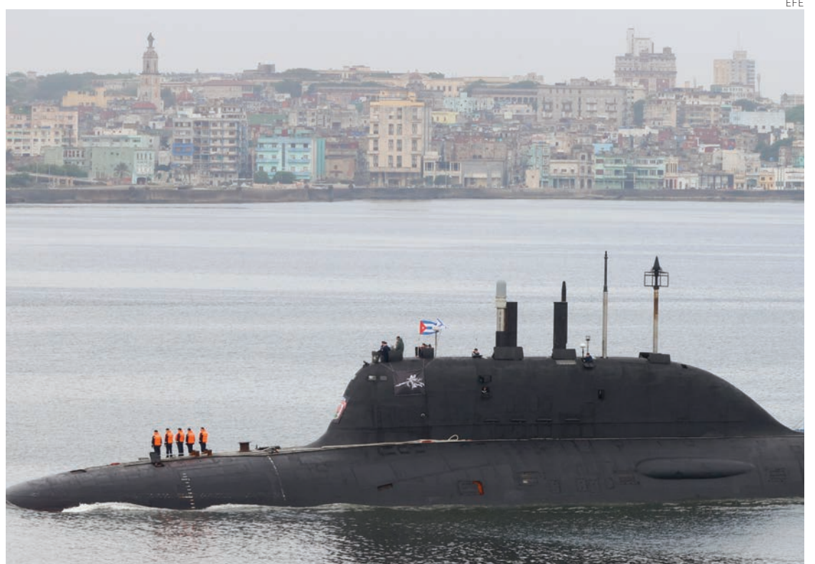
El submarino nuclear ruso Kazán en la bahía de La Habana.

Cuba y Rusia han profundizado en los últimos años sus históricas relaciones en los ámbitos político, militar y económico. Los cubanos acuciados principalmente por la grave crisis que padecen; los rusos por consolidar su magra red de aliados y el valor geoestratégico de la isla.