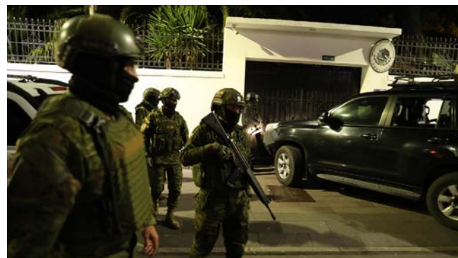
En abril pasado, la policía de Ecuador irrumpió en la Embajada de México en Quito para detener al exvicepresidente Jorge Glas.