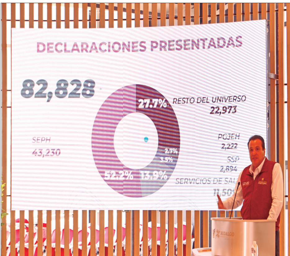
RUMBO. Destaca secretario de Contraloría que Hidalgo trabaja en su transformación en materia de rendición de cuentas, de transparentar la información.