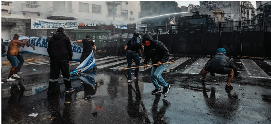
Policia dispersa a manifestantes frente al Congreso de Buenos Aires.

Enfrentamientos entre policías y manifestantes dejan decenas de heridos, mientras se votaba la ley en el Senado