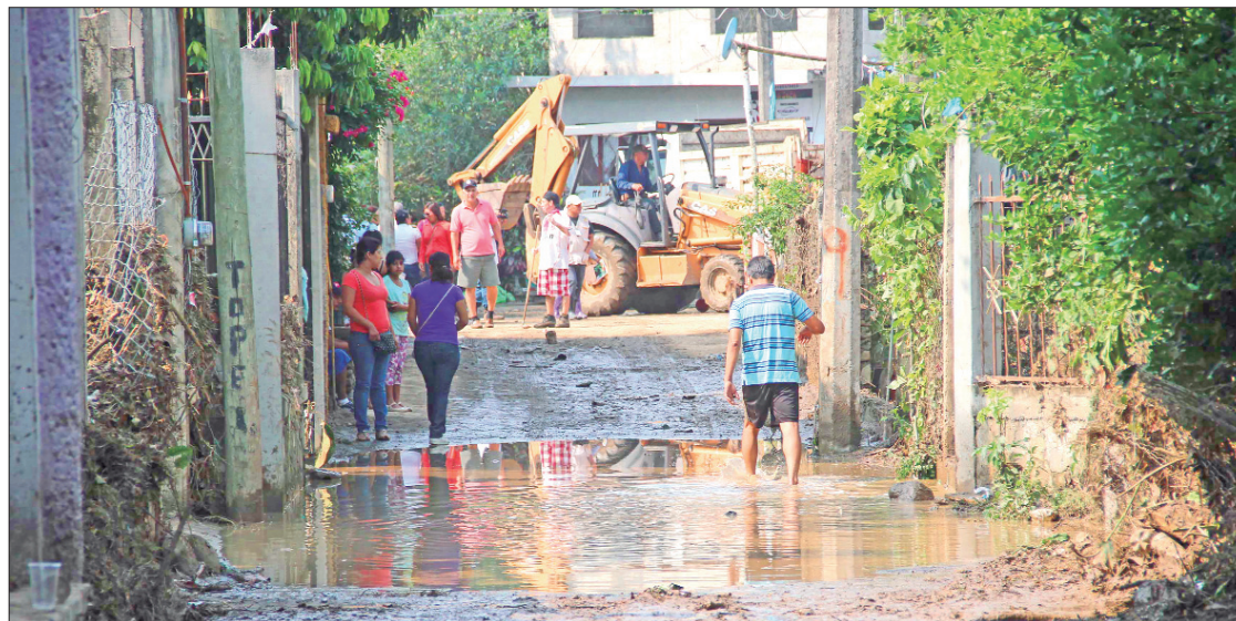
PREVENCIÓN. Esta herramienta permite estar mejor preparados ante algún desastre o situación de emergencia.

Agregó que, bajo la dirección del gobernador Julio Menchaca Salazar, y con el esfuerzo de todo el magisterio hidalguense: "en Hidalgo se está logrando la transformación, y esto asegura que se camina con rumbo claro y definido para que niñas, niños, adolescentes y jóvenes reciban una educación acorde a los retos y desafíos de nuestro desarrollo", añadió. (Staff Crónica Hidalgo)