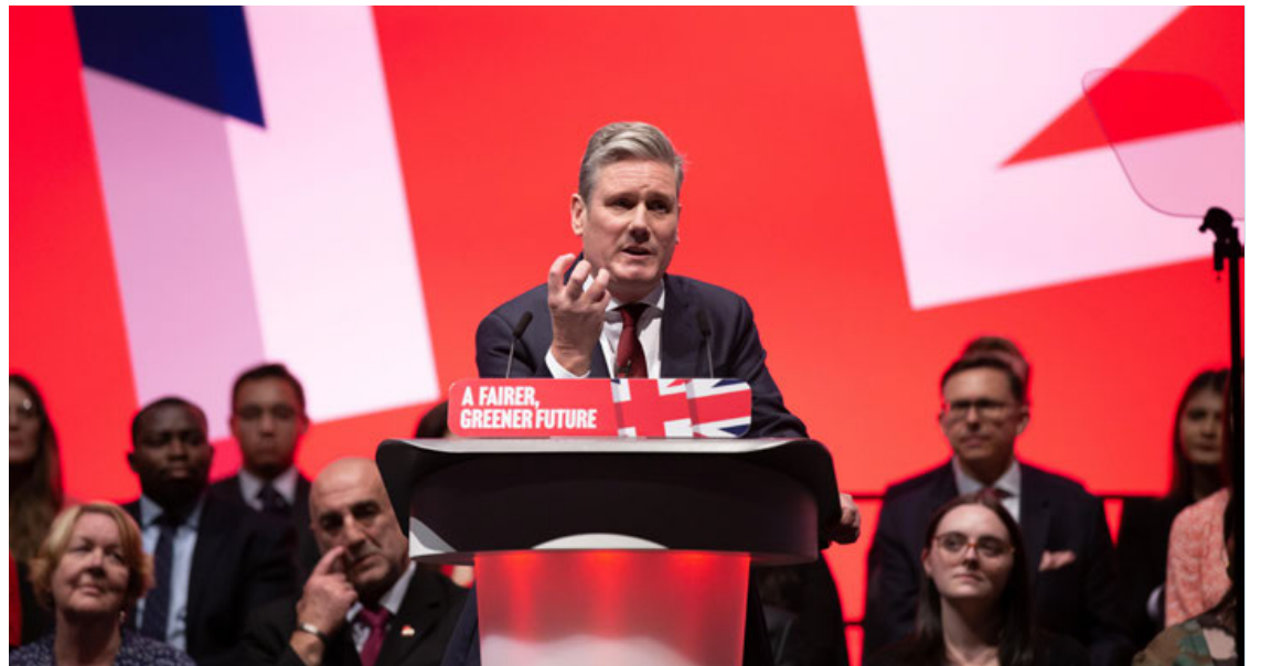
El líder del Partido Laborista, Sir Keir Starmer, pronuncia su discurso inaugural en la Conferencia del Partido Laborista en Liverpool, Gran Bretaña.

En su mensaje, Starmer recordó que la política puede ser