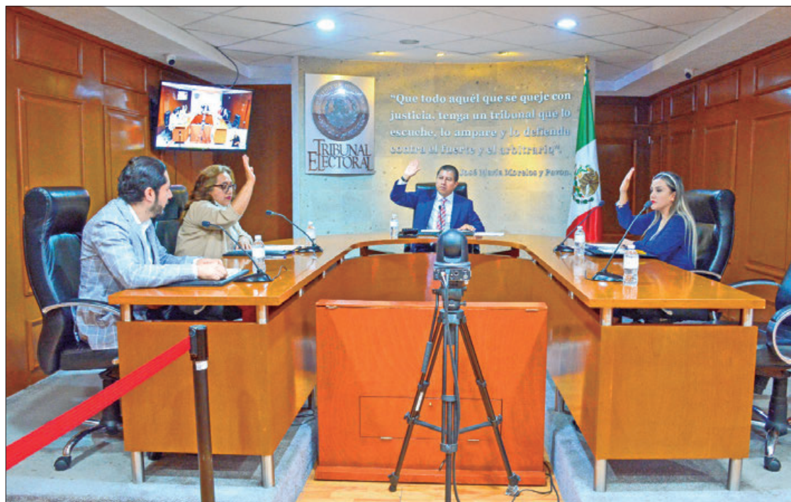
SESIÓN. El TEEH ratificó el otorgamiento de la constancia de mayoría a la planilla de Morena y Nueva Alianza Hidalgo.

que invalidaron esas casillas y tras modificar los resultados del cómputo municipal, no impactó en las posiciones obtenidas, es decir prevalece la mayoría para Morena y PNAH.