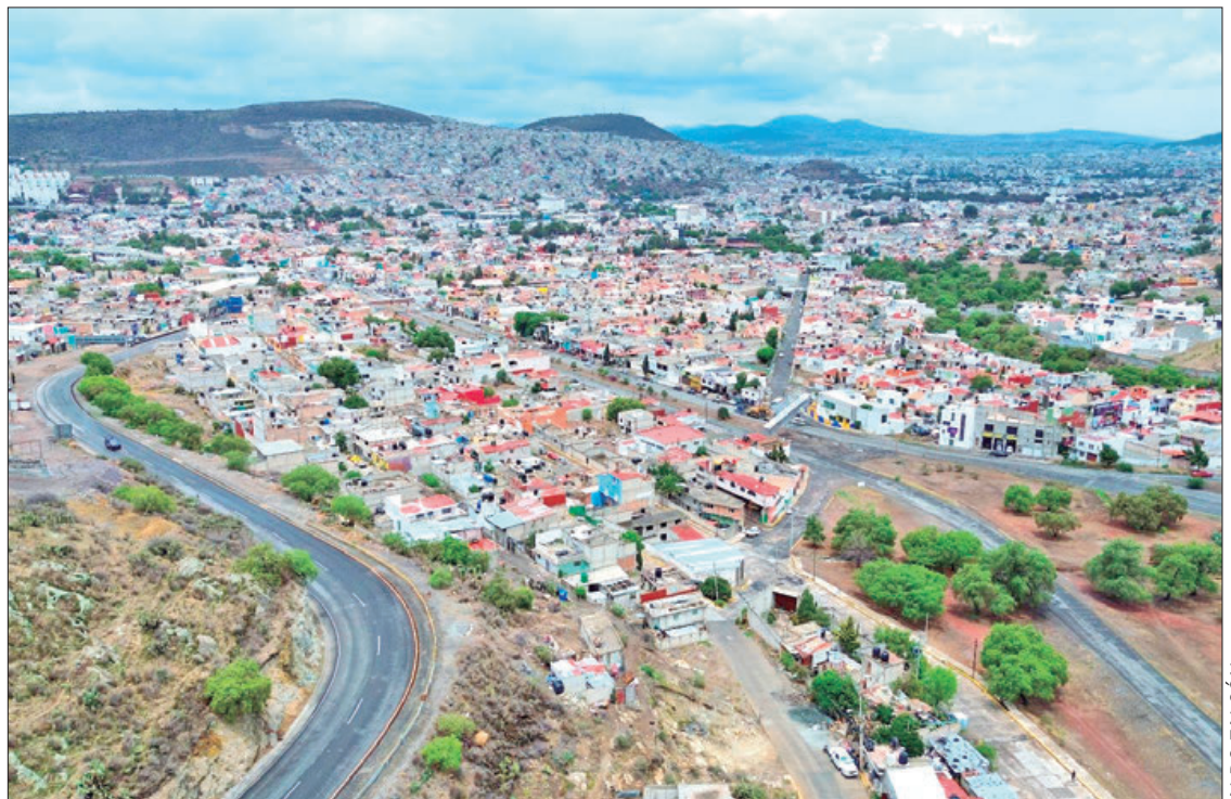
SOLICITUD. Es importante que se atiendan los temas y las necesidades en cada uno de las zonas de Pachuca.

"Estas son solamente dos de las tareas que se tienen en las que es necesario trabajar con urgencia, porque son las más necesarias y eso es lo que le queremos comentar al próximo alcalde, generar una agenda de trabajo que llevemos en conjunto para que tanto la administración tenga resultados como del lado de los habitantes tener beneficios que en los últimos años no se han tenido".