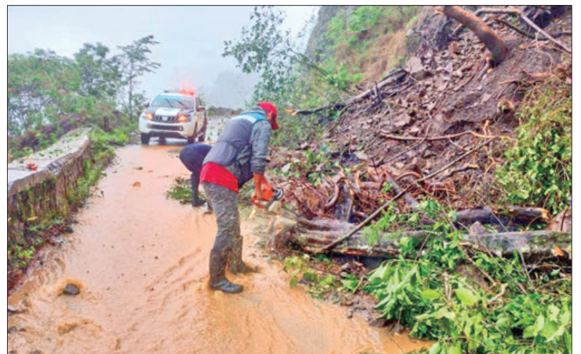
REUNIONES. Focalizan acciones para identificar zonas de riesgo, realizar trabajos de limpieza y rehabilitación de infraestructura pública.