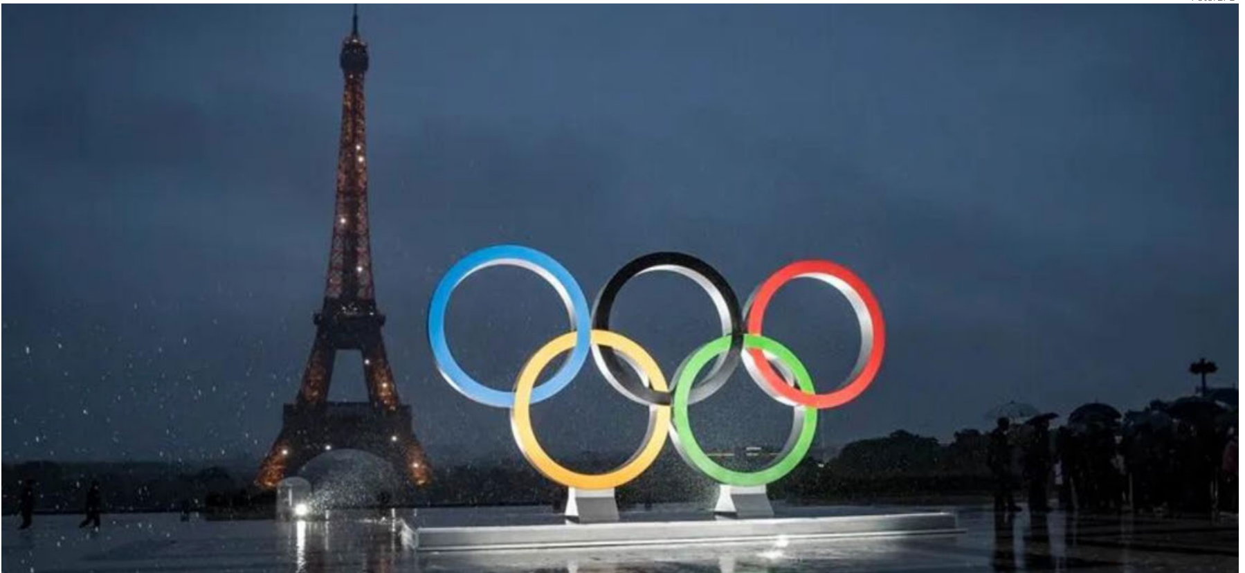
Los Juegos Olímpicos se celebrarán en París del 26 de julio al 11 de agosto.