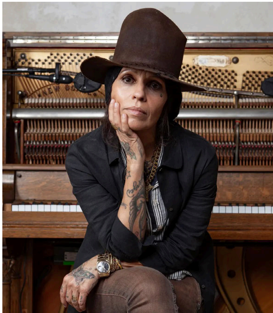
Imagen de la cantante, compositora y productora.

Uno de los temas que abordó Linda fue la presencia de las mujeres en la in-