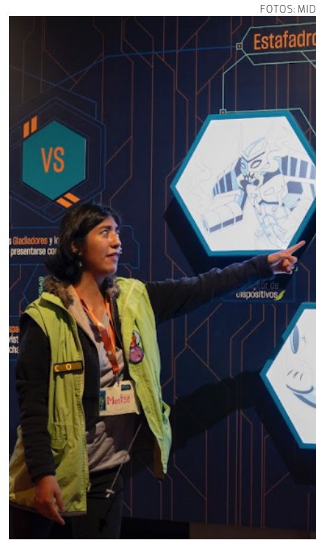
La exposición en cinco secciones.

Para conmemorar este 18º aniversario, el MIDE ofrecerá una promoción especial de 2x1 en la entrada los días sábado 13 y domingo 14 de julio de 10:00 a 17:00 horas. Las personas que cumplan años en julio podrán entrar gratis con un acompañante