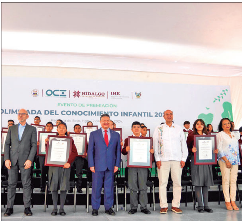
Están viendo ustedes de frente a los líderes del presente y del futuro: jefe del Ejecutivo estatal.

El gobernador de Hidalgo encabezó premiación de la Olimpiada del Conocimiento Infantil 2024 para 32 estudiantes de educación básica que obtuvieron el mayor puntaje en su evaluación a nivel estatal; guías