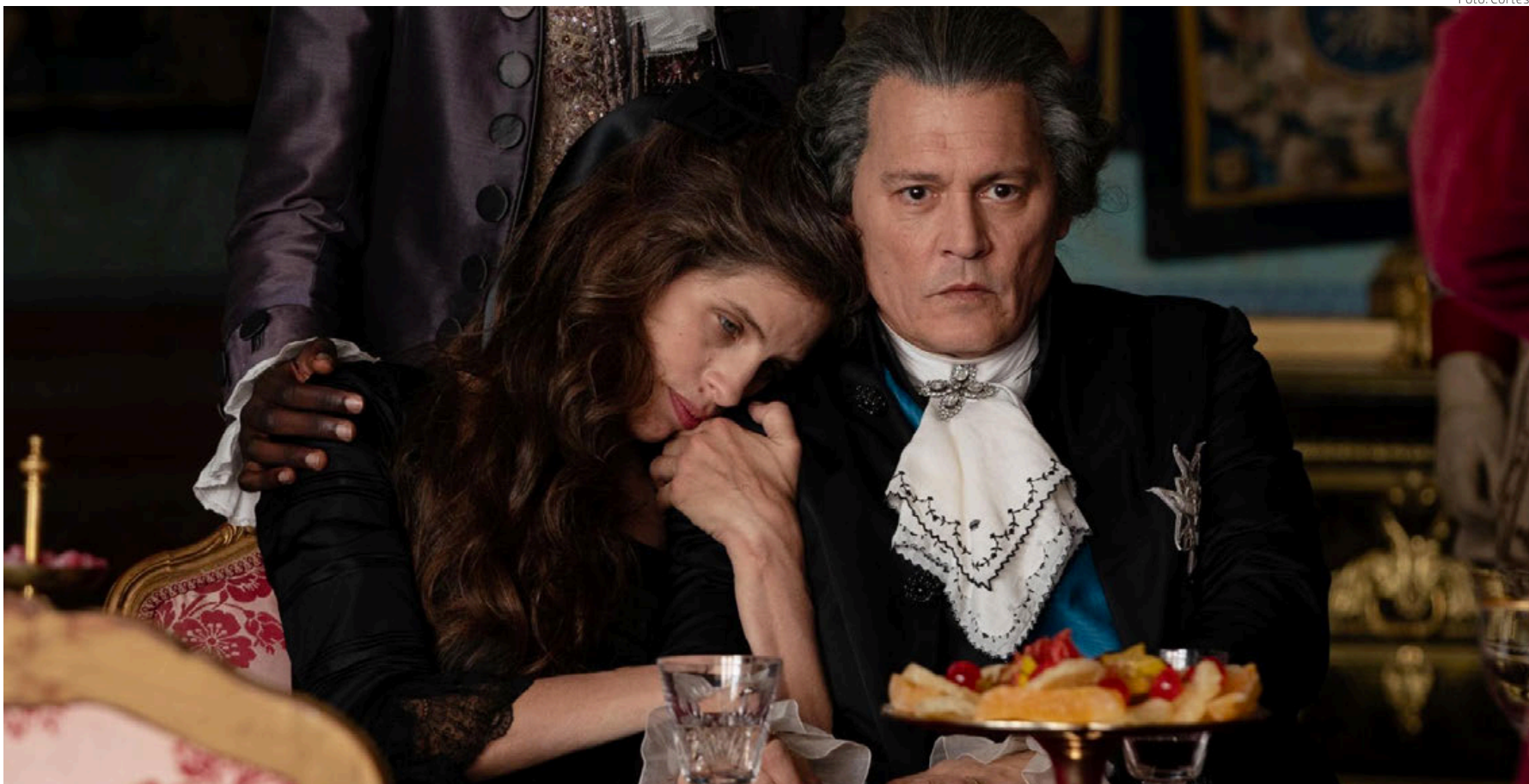
Fotograma del filme.