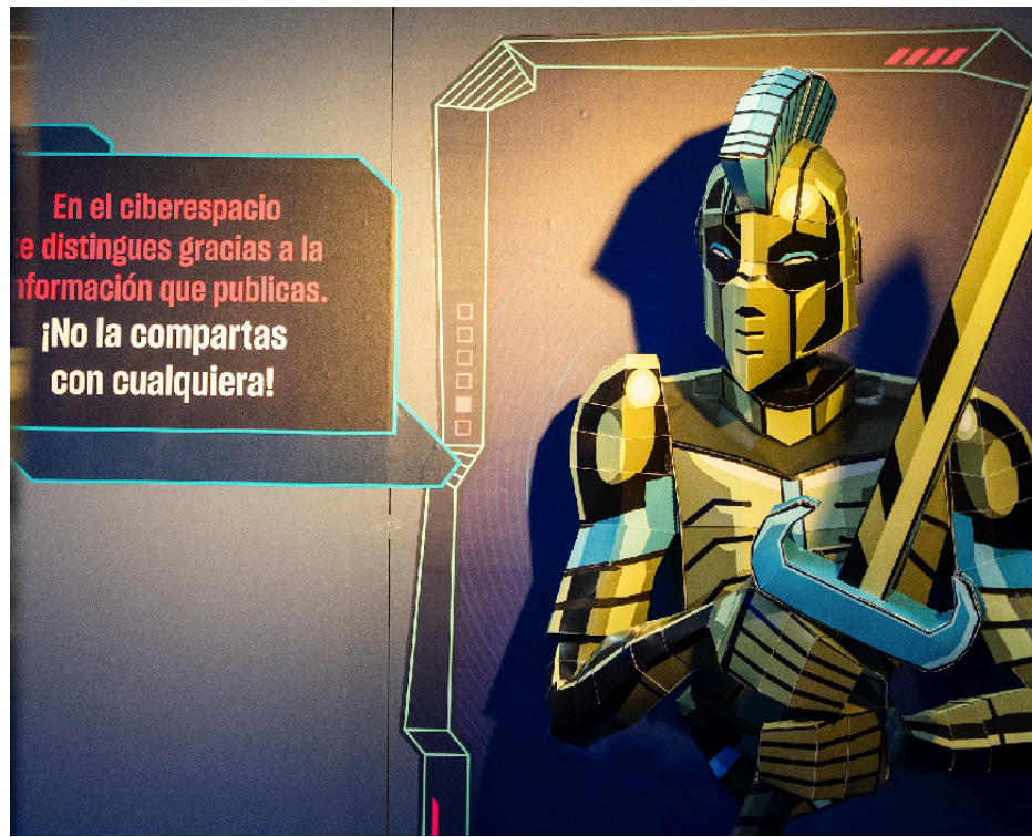
Misión Cyborg ofrece una experiencia única, similar a un videojuego.

Misión Cyborg es una exposición con talleres, narrativas fantásticas y desafíos para aprender, explorar y proteger nuestras finanzas en el mundo digital