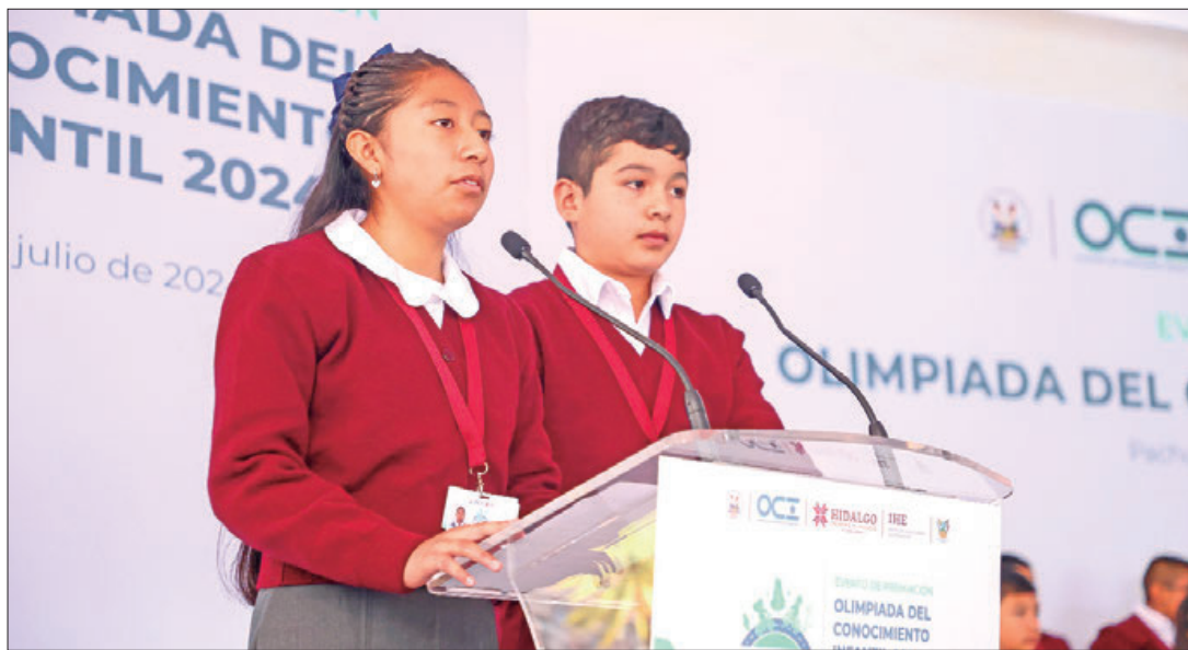
MARCOS. El gobernador de Hidalgo encabezó premiación de la Olimpiada del Conocimiento Infantil (OCI) 2024 para 32 estudiantes de educación básica que obtuvieron el mayor puntaje en su evaluación a nivel estatal.

► Niñas y niños serán las mujeres y hombres que dirigirán, desde distintas responsabilidades, el destino del estado