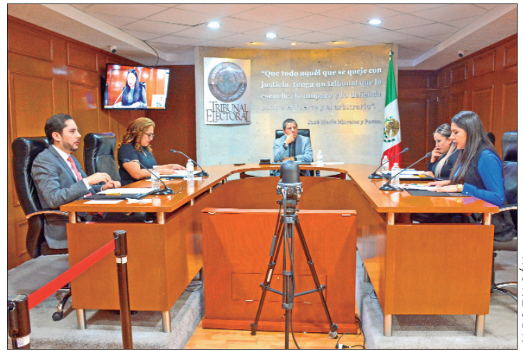
FRANCE. Descartaron agravios para anular los comicios del pasado 2 de junio.