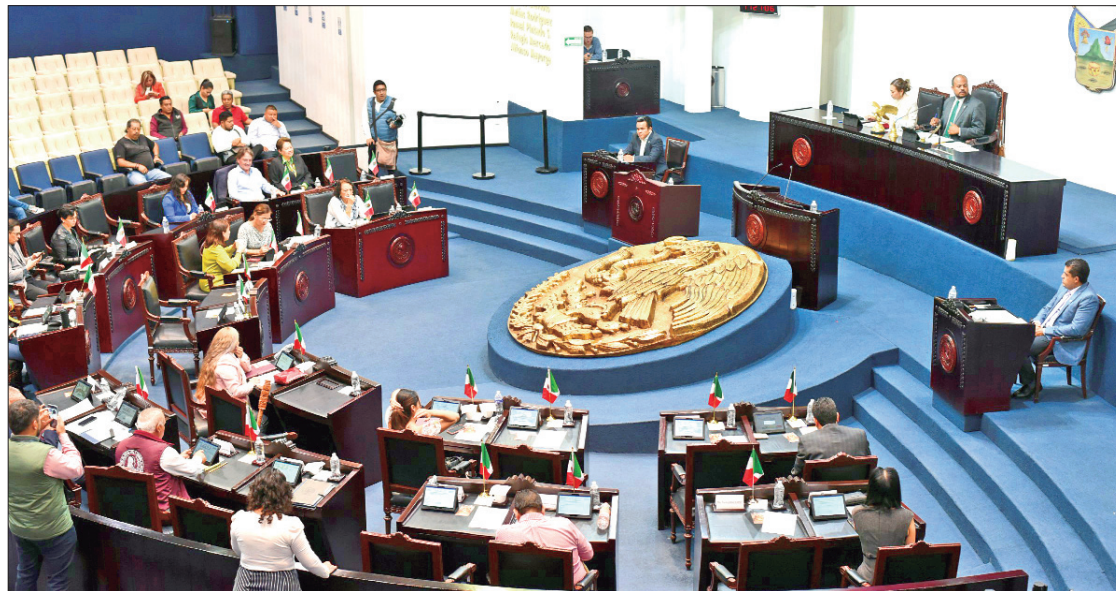
APROBACIÓN. Diputados y diputadas acordaron celebrar cada 13 de junio el Día de la Cabalgata Hidalguense.

Asimismo, se votó a favor del dictamen que modifica la Ley de Archivos para el Estado de Hidalgo, que tiene como objetivo armonizar el ordenamiento local en materia archivística con la Ley General de Archivos, dando cumplimiento a los artículos declarados con invalidez por parte de la Suprema Corte de Justicia de la Nación, mediante resolución en vía de acción de inconstitucionalidad.