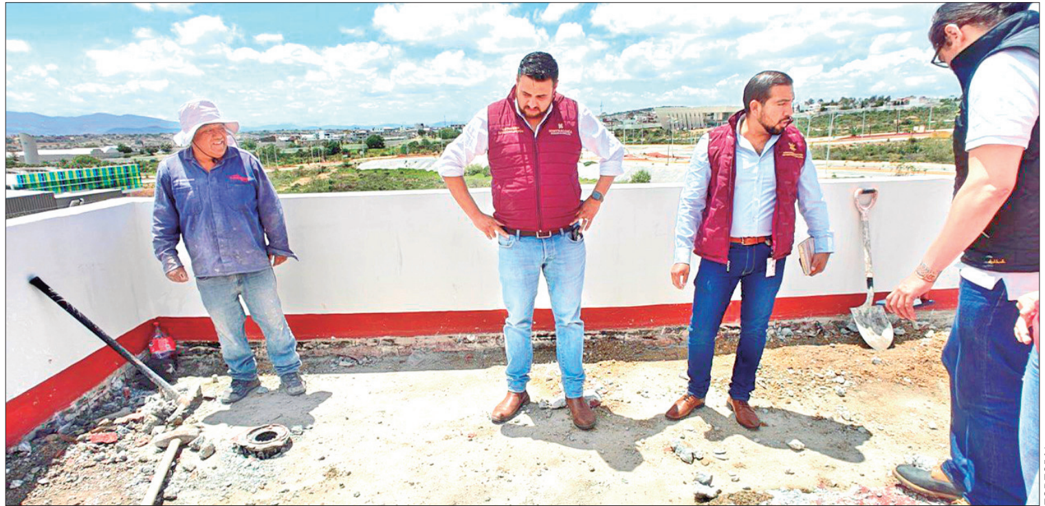
ACCIONES. Entre las estrategias destacadas que la dependencia ha implementado se encuentran las 2 mil 043 visitas aleatorias de inspección y supervisión realizadas.

La entrega de apoyos de ovinos con una cobertura estatal de tres componentes de mejoramiento genético con una inversión de 8 millones 635 mil pesos, beneficiando a 186 productores. (Alberto Quintana Codallos)