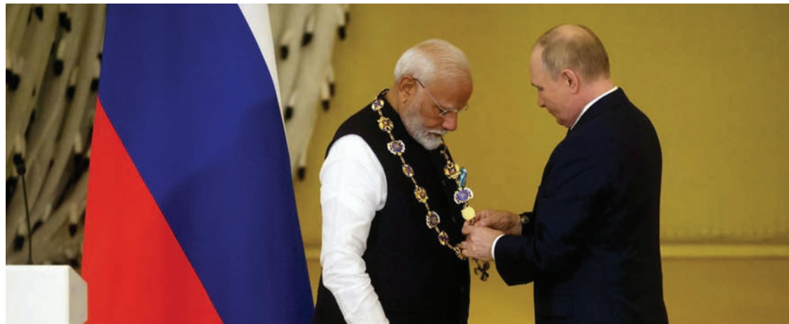
Putin impone la medalla de la Orden de San Andrés a Modi en el Kremlin.

Pese a todo, el repentino pacifismo de quien financia la guerra rusa con la compra masiva de petróleo ruso (India es el primer comprador mundial de crudo siberiano), el tirón de orejas escondido también el malestar del nacionalista hindú por la alianza militar de Rusia con China, país con el que India tiene varios diferendos limítrofes en la frontera del Himalaya.