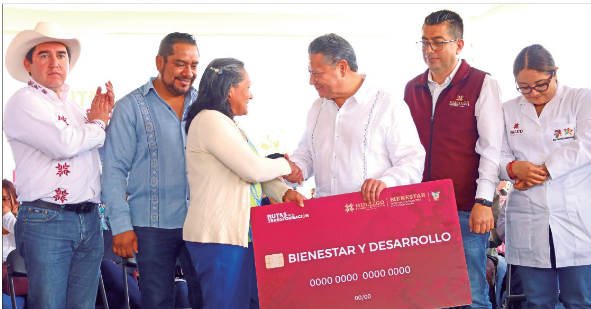
RUTAS DE LA TRANSFORMACIÓN. En Tezontepec de Aldama, el gobernador Julio Menchaca Salazar destacó que, estas giras de trabajo además de fomentar la cercanía con la gente, contribuyen a la detección de padecimientos importantes como el cáncer de mama. 2

■ La representante del Fondo de Población de las Naciones Unidas (UNFPA) en México, Alanna Armitage, reconoció que en Hidalgo existen avances importantes en la materia