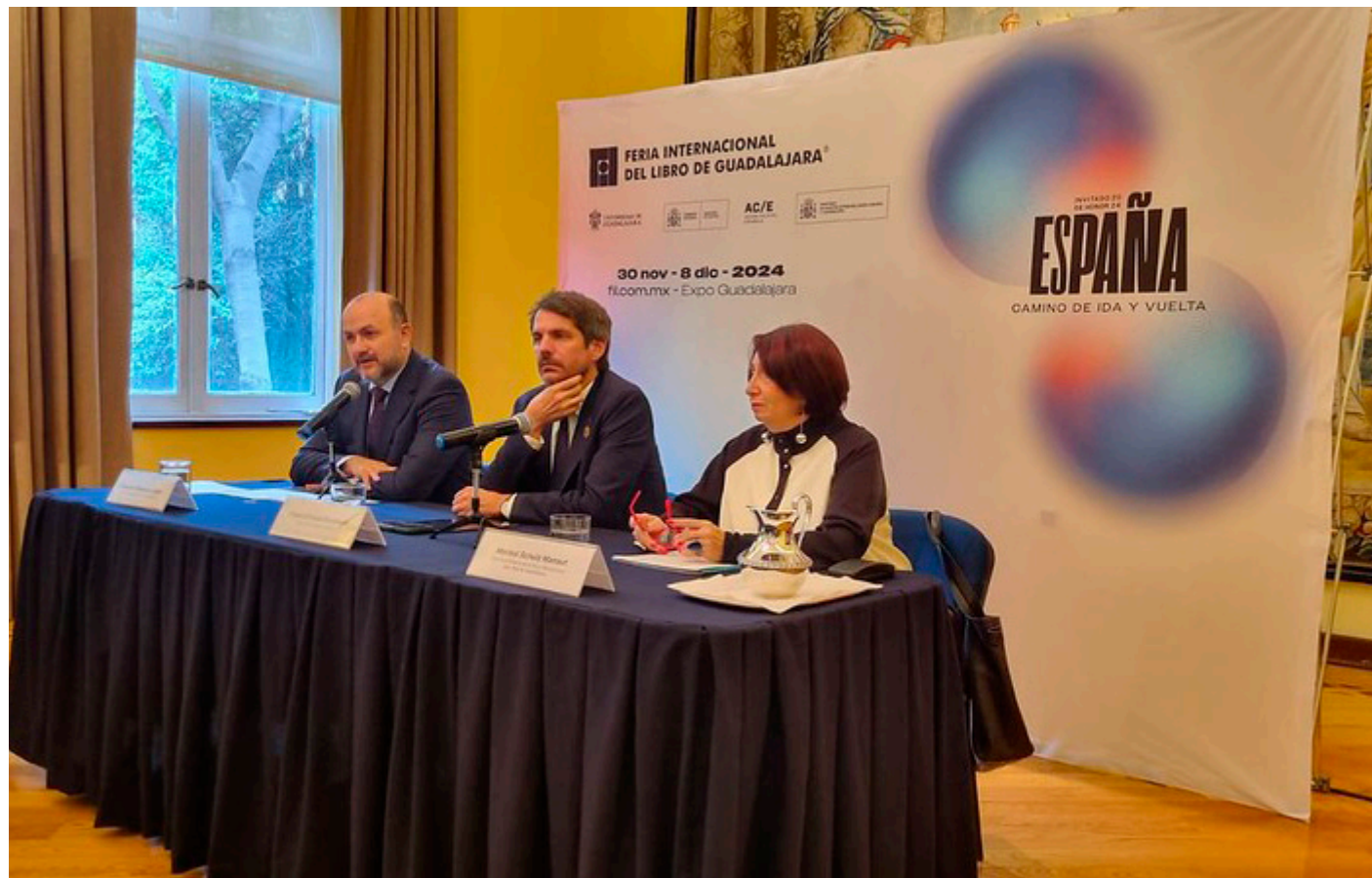
La apertura del Salón Literario, evento que abre la FIL, estará a cargo de Rosa Montero y Fernando Aramburu, anunciaron en la conferencia de prensa.

El ministro español adelanta parte de las actividades de su país para la FIL de Guadalajara