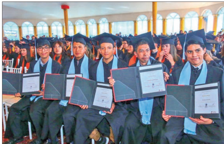
ACTIVIDADES. También se entregó una medalla a docentes por 30 y 40 años de servicio, así como reconocimientos a alumnas y alumnos con el mejor promedio.

Indicó que se seguirá realizando el mayor esfuerzo para que la niñez y juventud hidalguense tengan los apoyos nece-