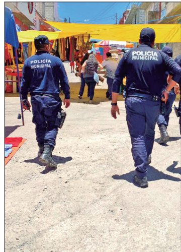
ACERCAMIENTO. Policías Municipales mantienen contacto con habitantes.

► Habitantes de colonias de la capital hidalguense afirman que los robos y asaltos se incrementaron