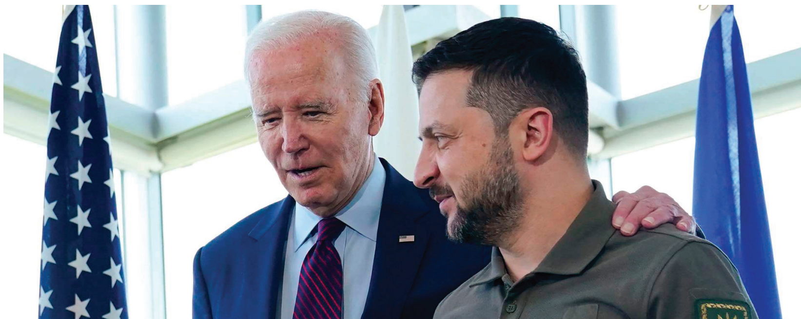
Zelenski junto a su mejor aliado, Biden ¿seguirá la alianza si gana Trump?