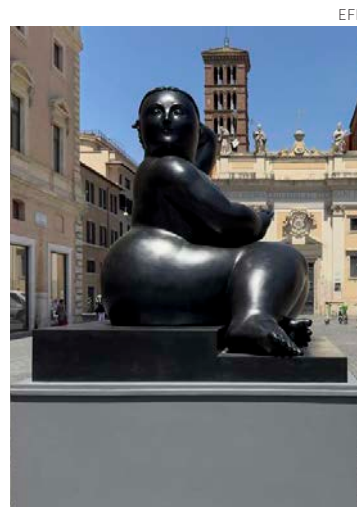
Una de las obras de Botero.