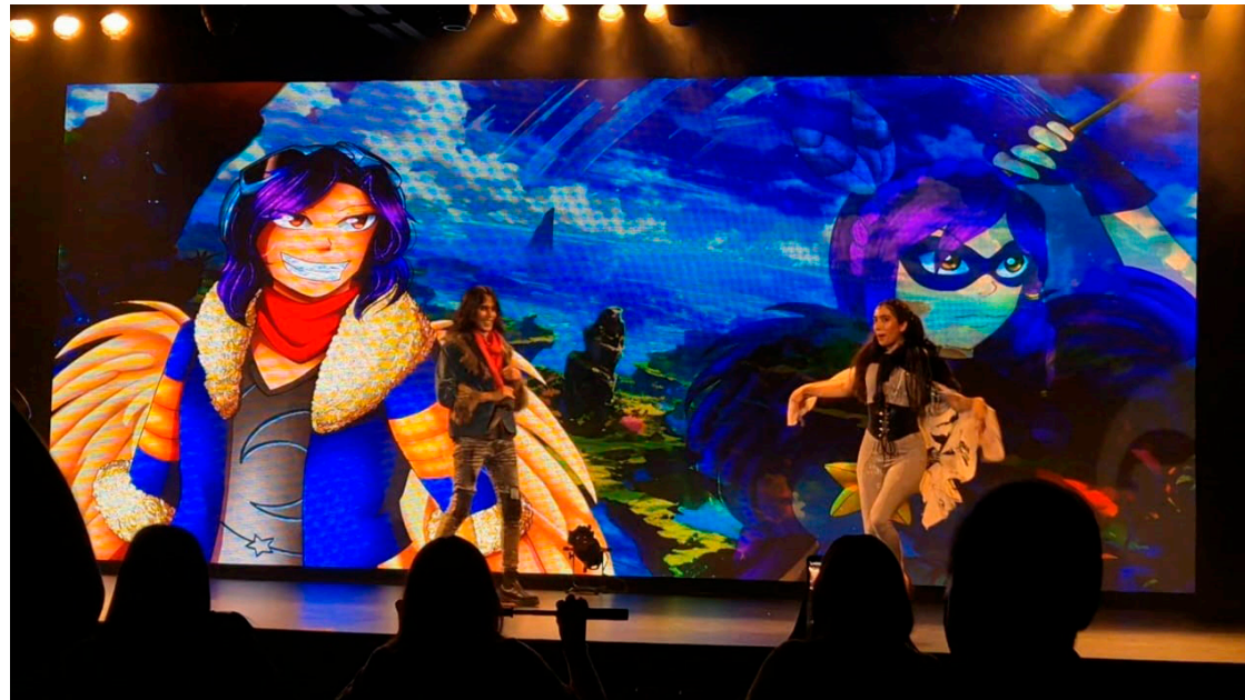
Una escena de “La flauta mágica”.

“En el formato hay la posibilidad de parar, sabemos que de repente los niños son muy estridentes o son muy amorosos por las vivencias. Entonces hay manera de que ellos controlen, por eso también es un equipo que sabe resolver momentos de crisis. Tenemos esa apertura”, indicó.