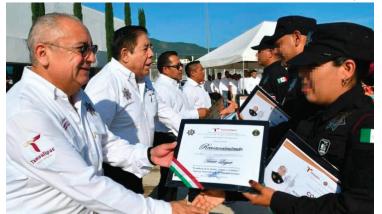
Dan la bienvenida a los nuevos elementos en Tamaulipas.