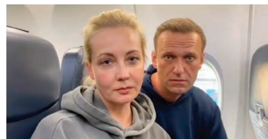
Yulia Navalnaya junto a su marido Alexei Navalni, antes de su regreso a Rusia, su encarcelamiento y su muerte misteriosa.

La viuda de Alexéi Navalni, que ha prometido continuar desde el exilio la causa de su marido, acusa al presidente ruso, Vladímir Putin, de ser el responsable de la muerte de su esposo y afirma que su