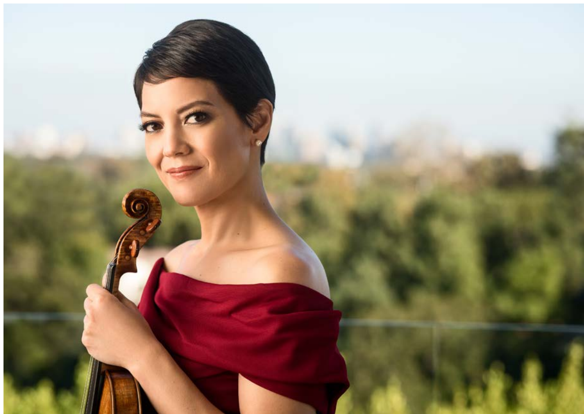
La violinista estadounidense Anne Akiko Meyers.