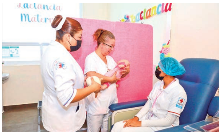
ESTE AÑO. Lema de la SMLM es "Cerrando la brecha: apoyo a la lactancia materna en todas las situaciones".

► Objetivo es fomentar, promover y apoyar esta actividad; etapas