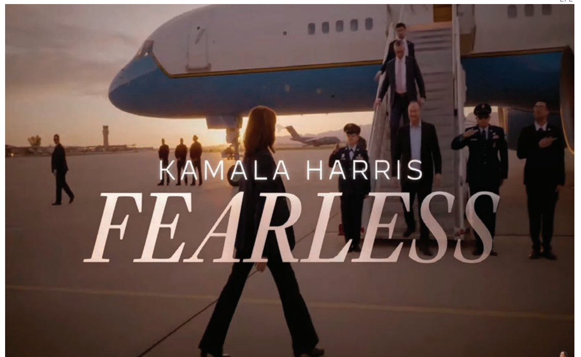
'Fearless' destaca la trayectoria como fiscal de Harris en California.

El expresidente estadounidense y candidato presidencial republicano, Donald Trump, aseguró que está dispuesto a debatir con Kamala Harris, la virtual candidata demócrata, siempre y cuando se haga antes del inicio del voto por anticipado, que