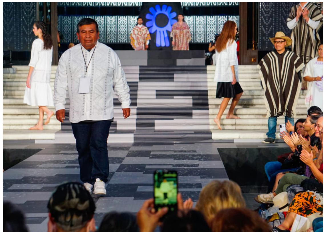
Una pasarela de una de las ediciones de “Original”.

El 74% de los artesanos tiene educación secundaria completa y la artesanía textil es la de mayor representación con