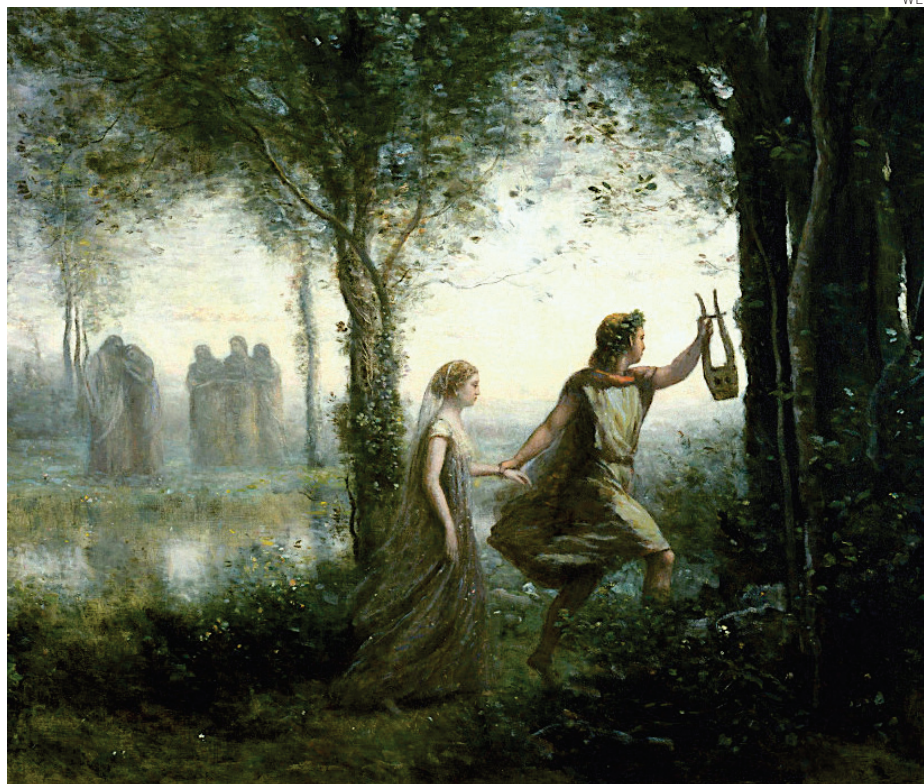
Orfeo y Eurídice. 1861. Camille Corot.

Acompañó a los argonautas en su viaje a la Cólquida, siendo de gran utilidad