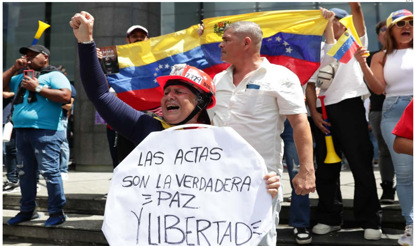
Los manifestantes han salido a las calles para exigir que se transparenten los resultados de las elecciones.

González Urrutia instó este martes a la Fuerza Armada a que detenga "la represión" en las protestas. "A las fuerzas de seguridad y a nuestra Fuerza Armada, los instamos a respetar la voluntad de los venezolanos expresada el 28 de julio y detener la represión de manifestaciones pacíficas. Ustedes saben lo que pasó el domingo (en las elecciones). Cumplan con su juramento", expresó en un video compartido en X.