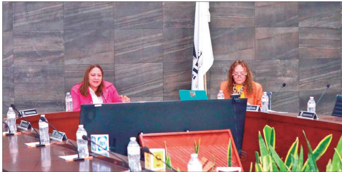
TRANSITAR. El único juicio de inconformidad promovido contra los resultados y cómputos de la elección del distrito de Pachuca 13 lo sobreseyó el TEEH luego de que PVEM se desistió del medio de impugnación, asimismo, en las siguientes instancias del TEPJF no arribaron asuntos relacionados.