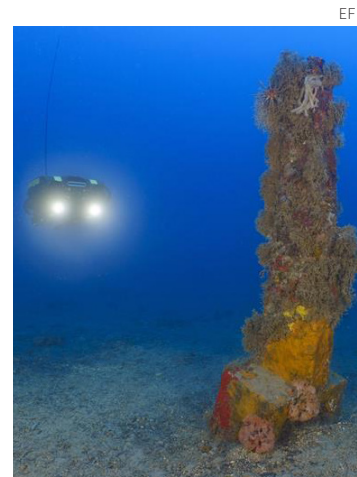
El ancla está a 50 metros de profundidad.

El ancla de plomo se encuentra intacta, clavada a 52 metros de profundidad y probablemente perteneció a una nave romana