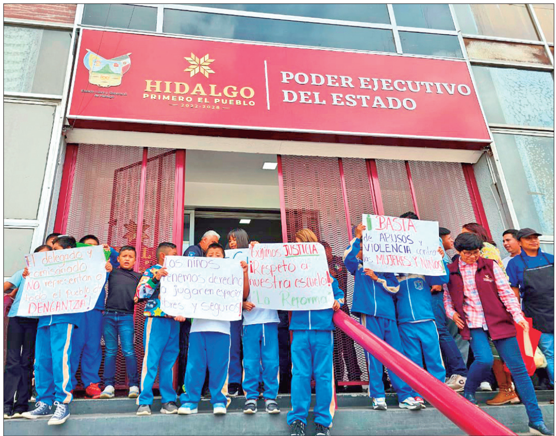
MEDIACIÓN. Padres de familia y estudiantes solicitaron la intervención del gobernador Julio Menchaca para resolver el conflicto.

Durante la refriega trascendió que cuatro personas resultaron con golpes entre ellas mujeres.