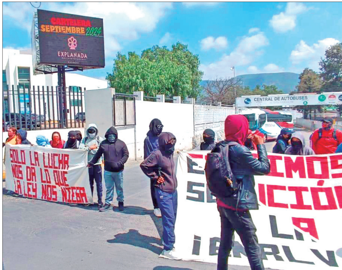
MOTIVOS. La exigencia, refirieron, se debe a la necesidad de trasladarse a la capital del estado para abordar el tema de la supuesta destitución de profesores sin justificación alguna.

Los manifestantes, aunque no impidieron de manera total el paso a la central de autobuses para unidades de algunas lí-