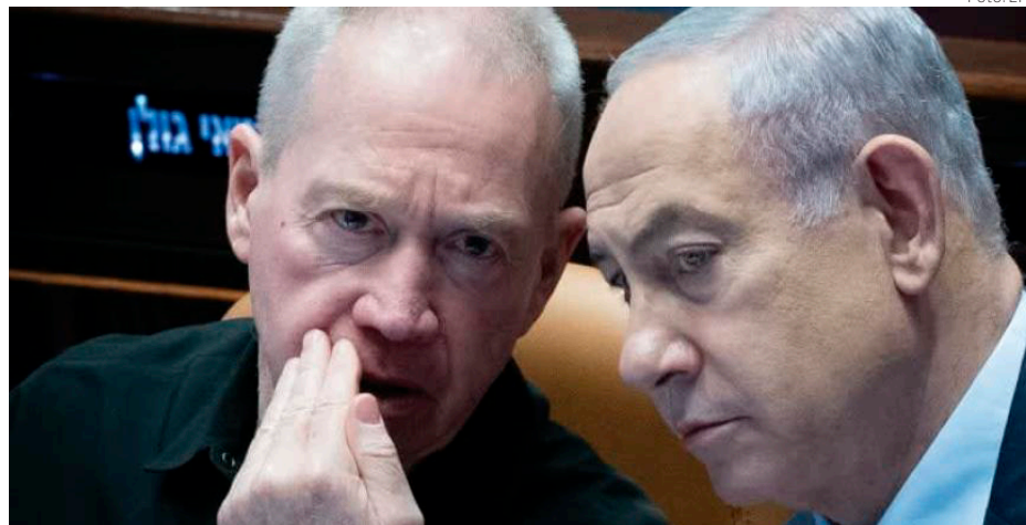
El ministro de Defensa de Israel, Yoav Gallant, junto al premier israelí, Benjamín Netanyahu

ampliar los objetivos de la guerra e incluir el regreso seguro de los residentes. Una vez que formulemos esta propuesta, la plantearé ante el primer ministro y el gabinete", dijo el titular de Defensa tras una reunión estratégica en la que también participó el jefe del Ejército, Herzl Halevi y altos miembros del sistema de defensa.