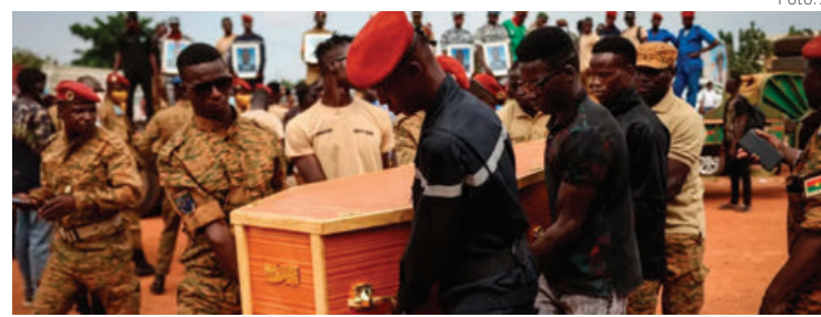
Soldados portan el ataúd de uno de los masacrados por los yihadistas en Barsalogho, Burkina Faso