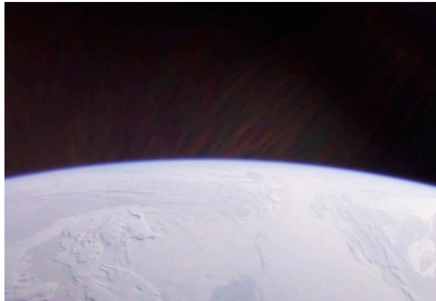
El Polo Norte geográfico visto desde el cohete Endurance a 768 kilómetros de altitud sobre el Ártico.

Hace más de 60 años, los científicos plantearon por primera vez la hipótesis de que este campo eléctrico ambipolar era el responsable de que la atmósfera de nuestro planeta pudiera escapar por encima de los polos norte y sur de la Tierra. Las mediciones realizadas desde el cohete Endurance de la NASA han confirmado la existencia del campo ambipolar y cuantificado su fuerza, revelando su papel en el escape atmos-