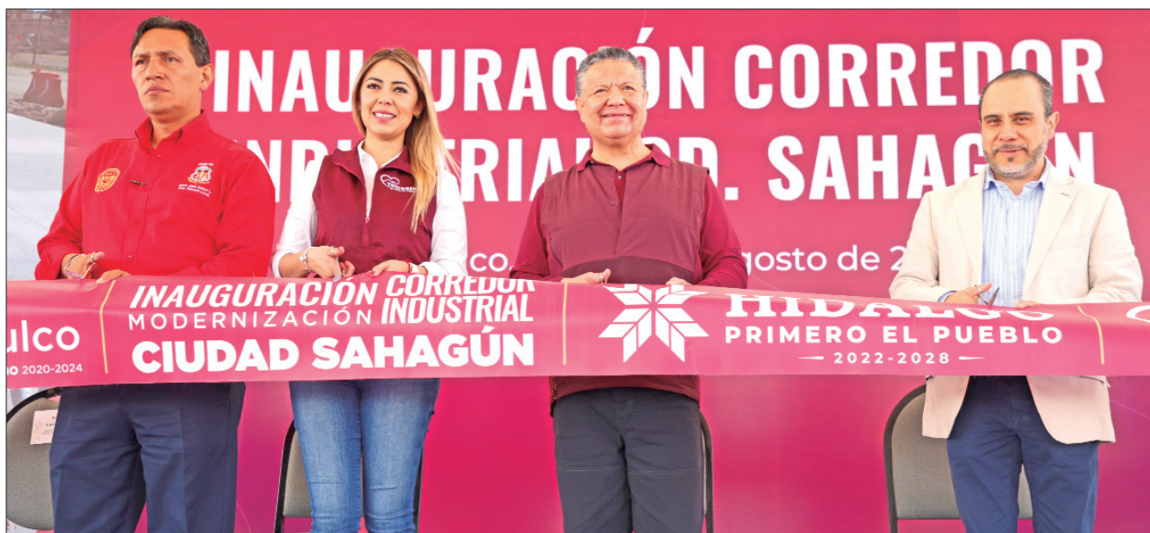
El gobernador reconoció el trabajo del gobierno municipal e insistió en el sentido de pertenencia, solidaridad y bienestar que se generan con estas acciones y que hacen a la gente, sentirse parte de una comunidad.

■ Entender que la transformación no solamente implica un modelo económico y político, sino una concepción de vida en donde estamos involucradas todas y todos: explica Julio Menchaca