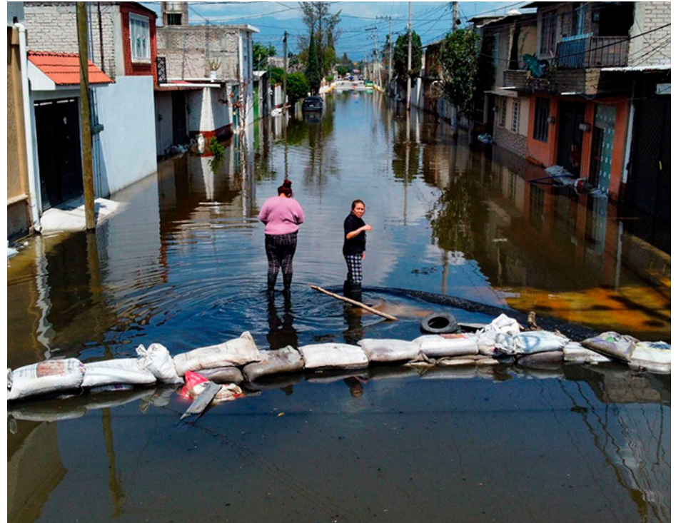
En la primera foto los habitantes de Tláhuac padecen las inundaciones y en la segunda la misma escena viven en calles de Chalco.