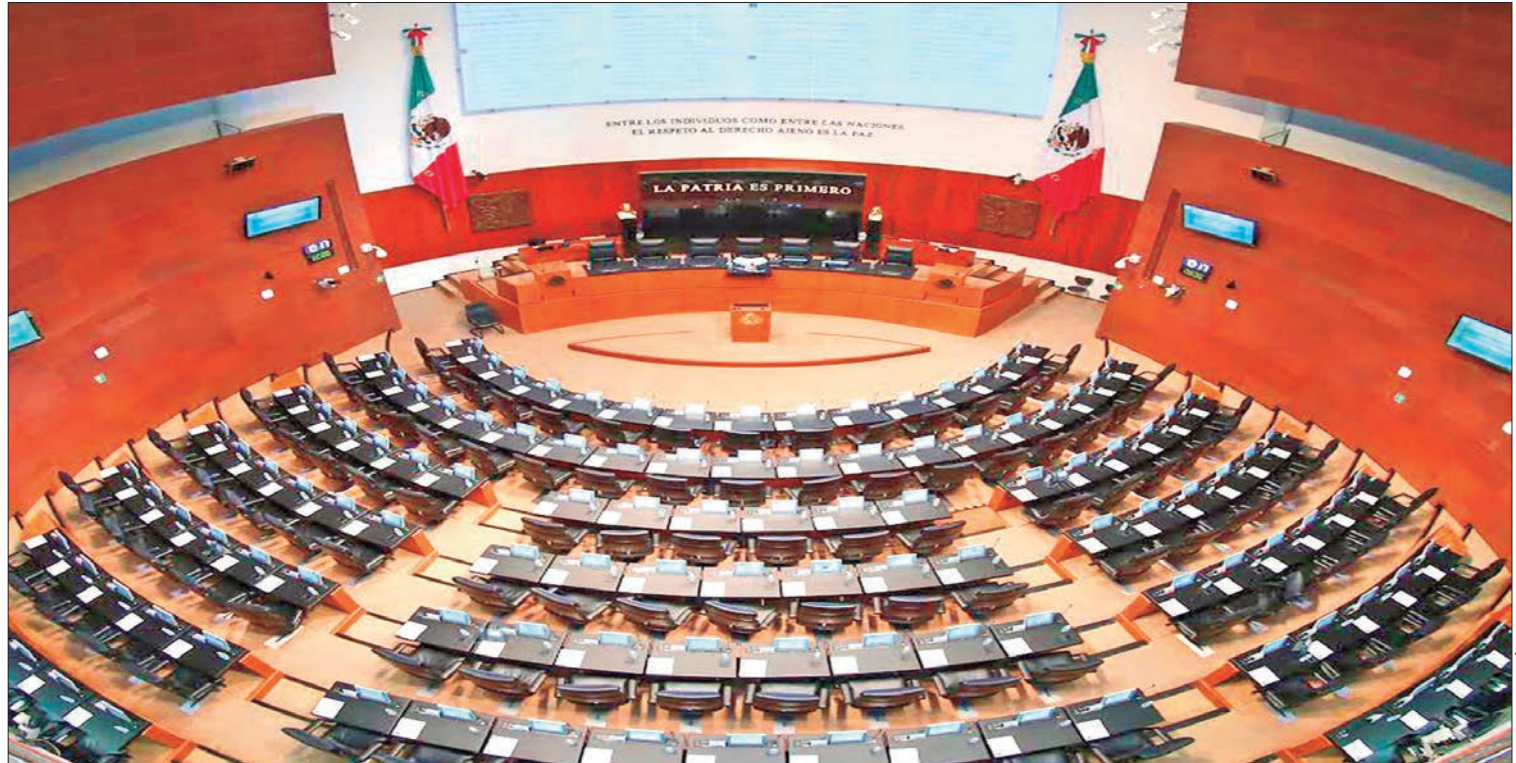
SITIO. Recientemente difundieron el anteproyecto por el cual efectúan el cómputo total y declaración de validez de las elecciones de diputados federales y senadores ambos por el principio de representación proporcional, el cual someterán a consideración del pleno el próximo 23 de agosto.

Luego de la etapa impugnativa ante órganos jurisdiccionales y la nulidad de algunas casillas que derivó en ajustes de la votación, analizaron los respectivos convenios de coalición para establecer la afiliación efectiva en las 300 diputaciones de mayoría