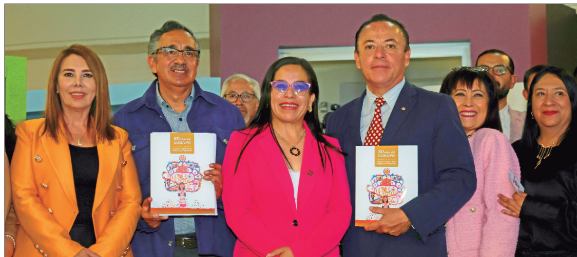
HECHOS. Este libro aborda temas sensibles que implican una visión de los problemas estructurales que existen en México.

► Presentan el libro 50 años del Conapo, transformación de la política de población