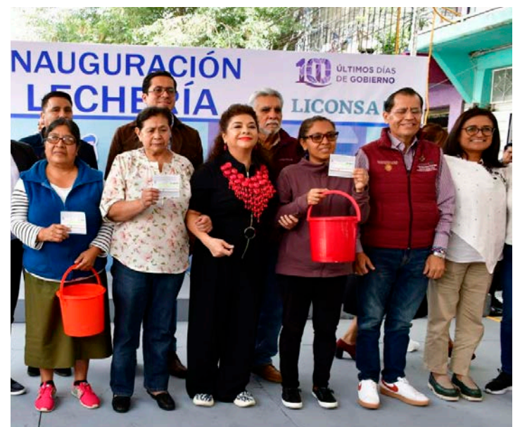
Beneficiarios de la lechería recién inaugurada.

Posterior a la ceremonia, la exalcaldesa de Iztapalapa acudió a las alcaldías Venustiano Carranza e Iztacalco para continuar con su gira de inauguración, una serie de visitas a diversos lugares de la capital llevados a cabo para identificar problemas locales y un así entablar un continuo diálogo con los ciudadanos. ●