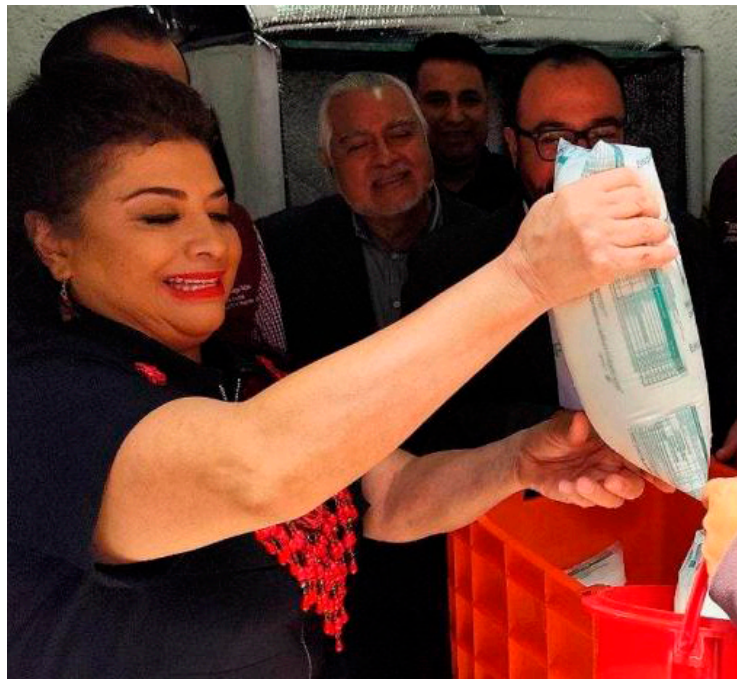
Durante su gestión como diputada federal luchó en defensa de Liconsa.

Con el objetivo de proporcionar leche y productos alimenticios básicos a precios accesibles para la comunidad, la jefa de Gobierno electa de la Ciudad de México, Clara Brugada, inauguró un nuevo punto de venta Liconsa y Diconsa en la colonia San Pablo, ubicada en lo alto de la Sierra de Santa Catarina. Durante su próxima gestión como jefa de Gobierno, se prevé abrir 50 sucursales más en la demarcación.