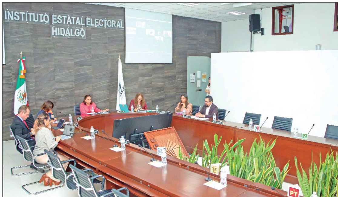
MOTIVOS. Incurrían en la repetición del cargo de manera consecutiva.

El IEEH negó la asignación de regidurías de representación proporcional a personas que, por haber desempeñado ese cargo en el periodo del gobierno municipal actual, implicarían una reelección en el cargo; además de reiterar lo establecido en el artículo 125 de la Constitución Política