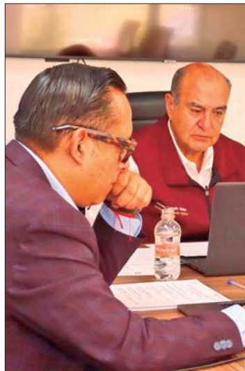
LABOR. El objetivo es dar cumplimiento a los procesos del Sistema para la Carrera de Maestras y Maestros.