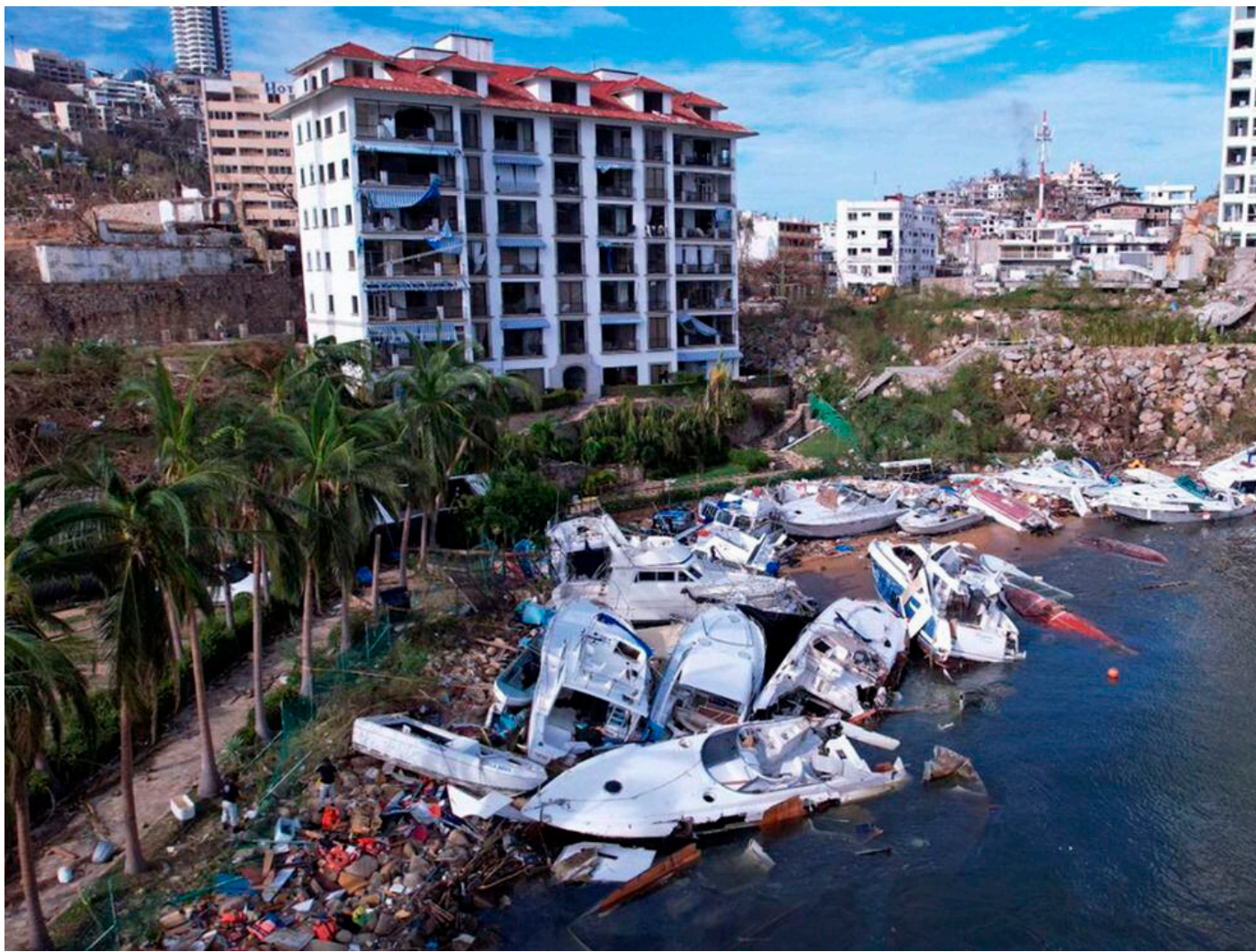
Barcos destrozados y hundidos en la marina de Acapulco, tras el paso del huracán Otis.

215 mil dólares a la semana. Además, entre los desaparecidos estaba el propietario, un conocido magnate, así como el presidente de uno de los bancos de inversión más grandes del mundo.