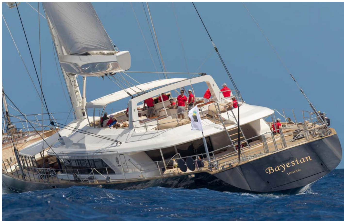
El velero Bayesian era uno de los yates más grandes del mundo.

Efectivamente, China está cambiando los mapas marítimos con el uso de embarcaciones de dragado, que extraen arena y roca del lecho marino para luego depositarlas sobre arrecifes, formando así una base lo suficientemente estable incluso para levantar infraestructura. Este es el método que permite a China expandir físicamente su territorio y, lo más importante, reclamar las aguas circundantes a sus “nuevas” islas como propias. Por si alguien pone en du-