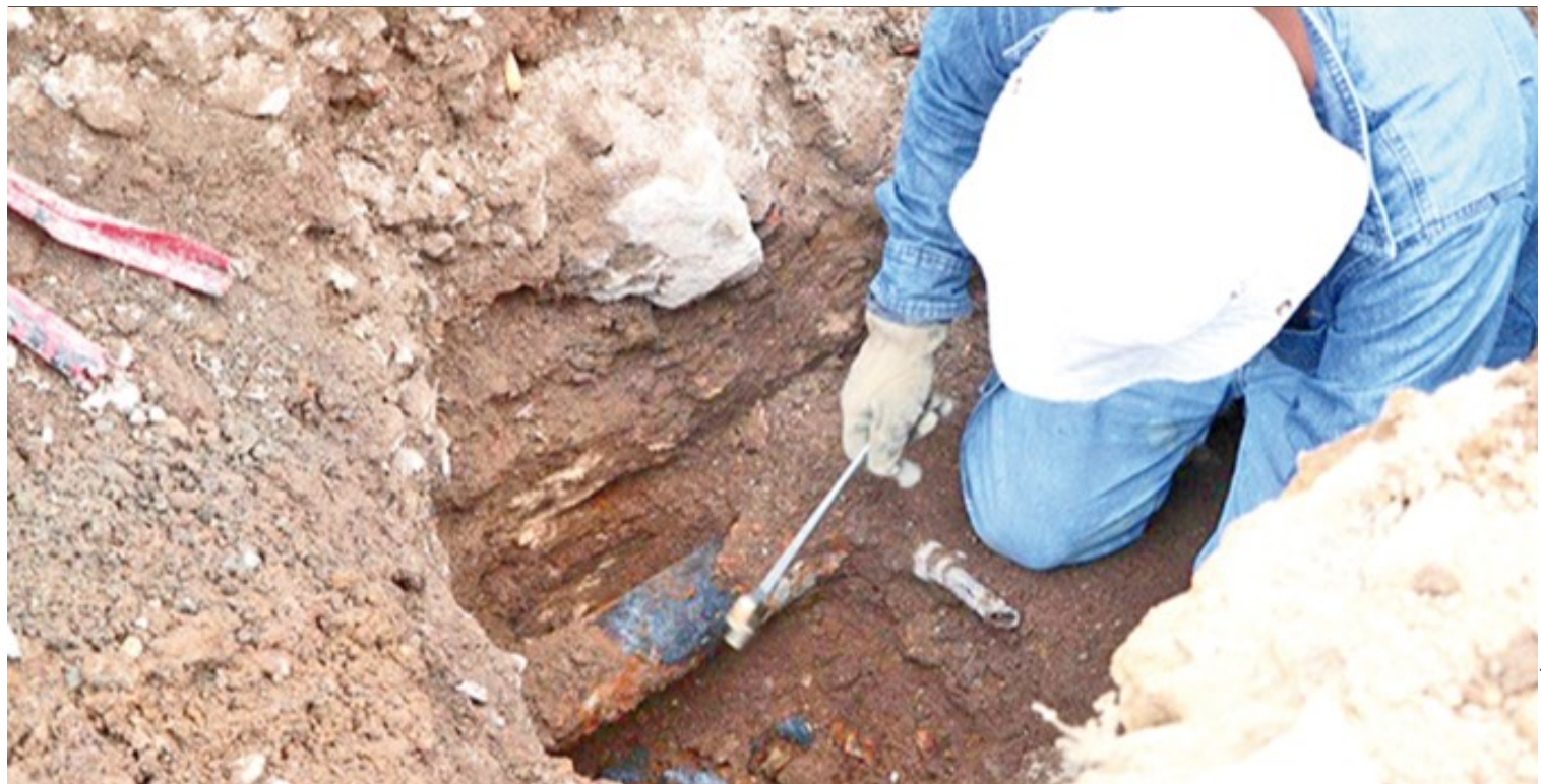
ASPECTO. Fallas en el suministro de agua potable serán en el área oriente y centro de la zona metropolitana de Pachuca.

Las medallas obtenidas se dividen en ocho en combate y cinco en formas. Las competencias de boxeo y fútbol popular 6x6 darán inicio mañana, 22 de agosto, y concluirán el domingo 26 del presente mes. (Staff Crónica Hidalgo)