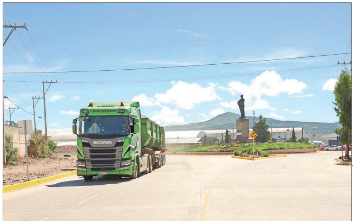
DIRECTRIZ. Como parte de la visión de crecimiento sustentable donde la entidad se mantiene como uno de los lugares más atractivos para la inversión.

De esa forma, con una inversión de casi 58 millones de pesos de recurso municipal, se beneficia de manera directa e indirecta a más de 12 mil personas de los diversos sectores de la sociedad.