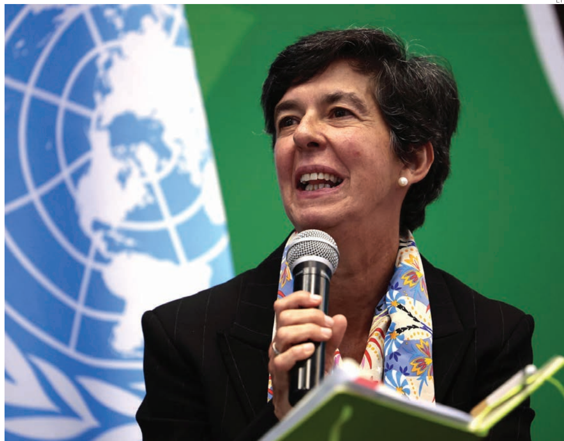
Lola Castro, directora regional del Programa Mundial de Alimentos, este martes en el Foro de Alimentación Escolar celebrado en la Ciudad de México.

El coordinador señaló también la problemática en la región, donde desde el año 2000 hasta la actualidad se ha registrado