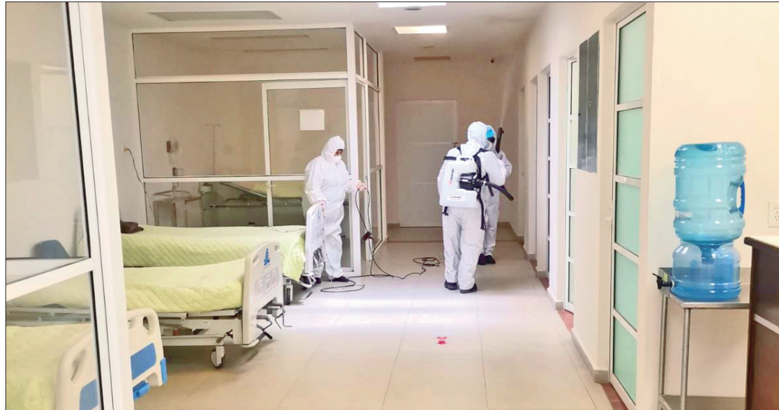
DOF. En el Diario Oficial de la Federación difundieron tal acuerdo que reformó lo relacionado a la transferencia por parte del gobierno hidalguense al IMSS Bienestar de los recursos destinados a la atención integral gratuita médica y hospitalaria con medicamentos y demás insumos asociados a las personas sin afiliación a las instituciones de seguridad social.

Únicamente lo relativo al anexo uno para agregar otras unidades médicas al convenio principal respecto a la declaratoria de reversión de 250 unidades de primer nivel, la mayoría de consulta externa y solo uno de segundo nivel, el hospital integral de Atlapexco.