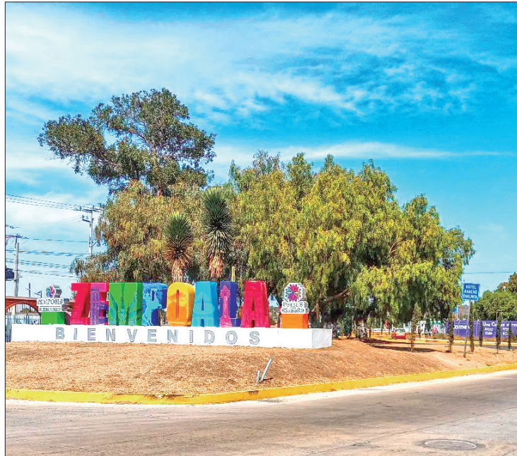
MIRAS. Administraciones atrás han buscado la forma en que el municipio acepte la inversión externa.

que también es importante intervenir en áreas cercanas al Acueducto del Padre Tembleque, ícono del municipio, ya que en torno al mismo no existe una sola alternativa turística que ayude el lugar a hacerlo mucho más atractivo.