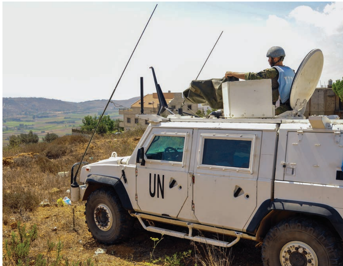
Soldado español observa desde una tanqueta de la ONU la frontera desde la comarca libanesa de Marjayún, al fondo la localidad israelí de Meyula.

El ataque israelí del domingo en el sur de Líbano dejó un balance de siete muertos, entre ellos un niño de 7 años que murió junto a otros dos familiares cuando su casa fue alcanzada por una bomba lanzada por un dron israelí en la aldea de Aytá