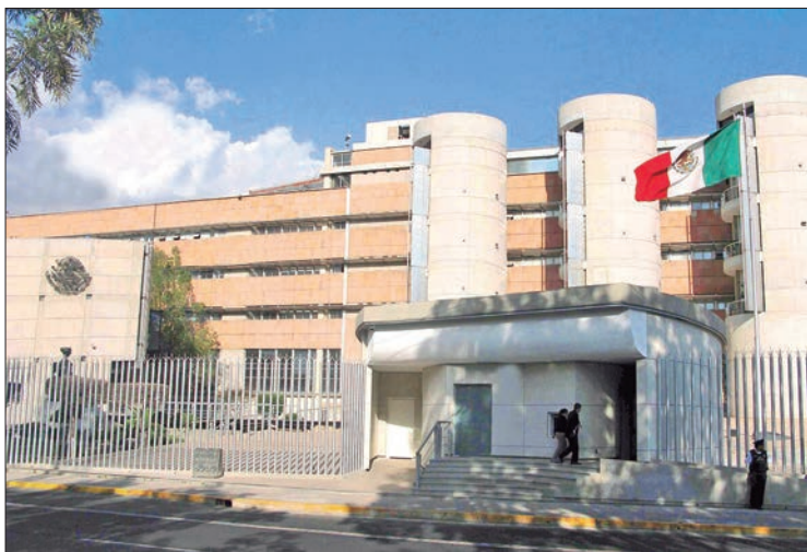
EJEMPLOS. Corroboraron los triunfos para Morena en Zapotlán, Atotonilco de Tula, Jaltocán y Tula de Allende; para Revolucionario Institucional (PRI) en Metepec, el Arenal y Lolotla; Acción Nacional (PAN) en Tezontepec de Aldama.

► Sala Regional Ciudad de México ratificó varias sentencias del Tribunal Electoral del Estado; eje