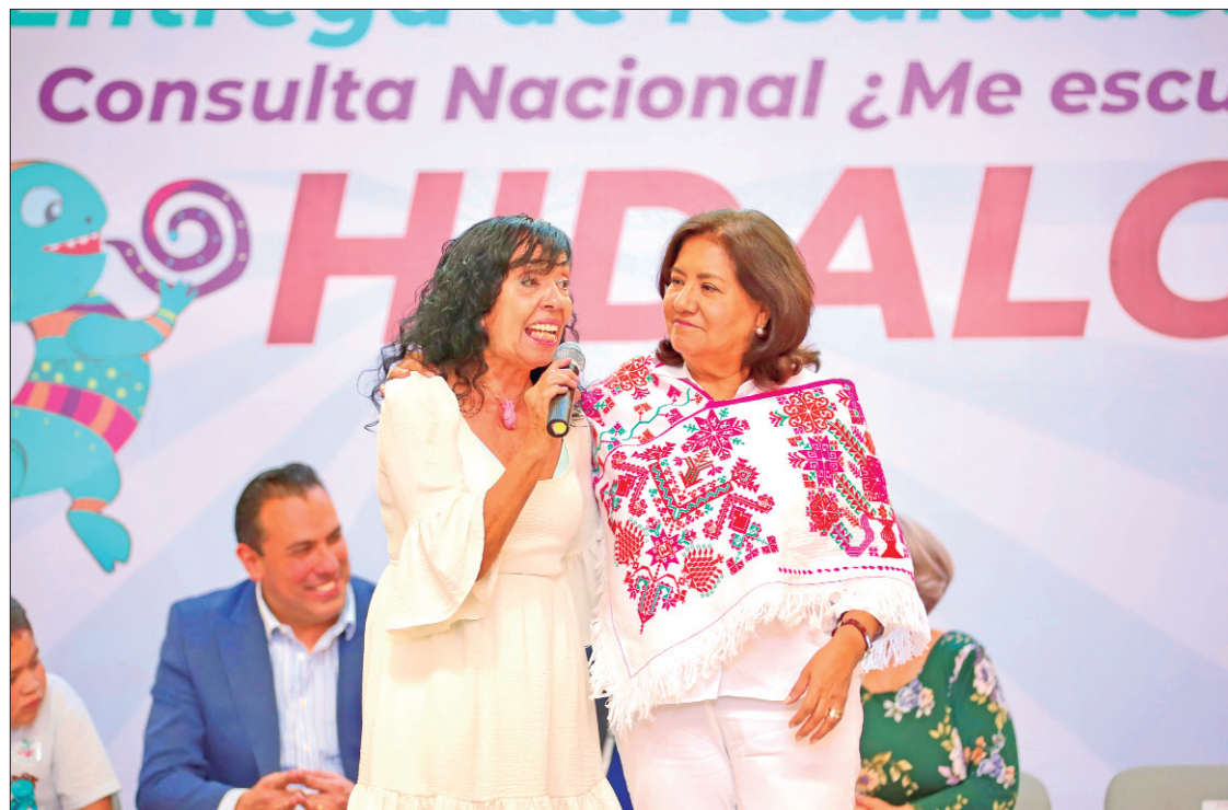
MARCO. Con más de 96 mil encuestas realizadas, la entidad obtuvo el tercer lugar nacional en la Encuesta Nacional ¿Me Escuchas? 2024

También reafirmó su respaldo a la transición de los Centros PAMAR a PILARES como una estrategia de acompañamiento infantil de la cual el Sistema DIF Hidalgo es punta de lanza buscando responder a las necesidades de la