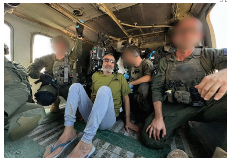
El rehén rescatado fue trasladado en helicóptero a un hospital en el sur de Israel.

El ataque de Hamás del 7 de octubre dejó en total 19 beduinos muertos y seis secuestrados.