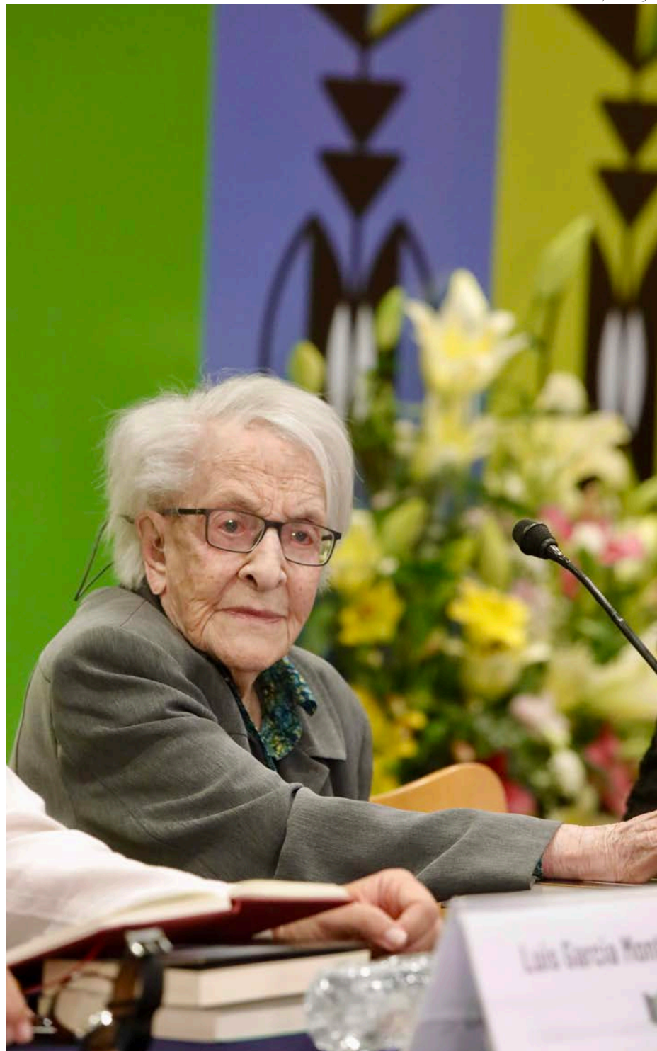
La poeta Ida Vitale durante su participación en la Filuni.

La Premio Reina Sofía 2015 reconoció que Uruguay siempre estuvo abierto a lo mejor del mundo y es al-