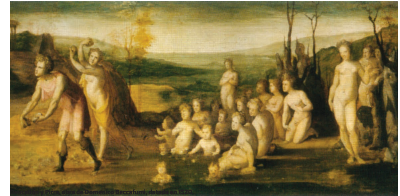
Pirra, obra de Domenico Beccafumi, datada en 1520

No está claro si el diluvio griego ocurrió en la época mitológica de la edad de bronce o en la de hierro, de las que ha-