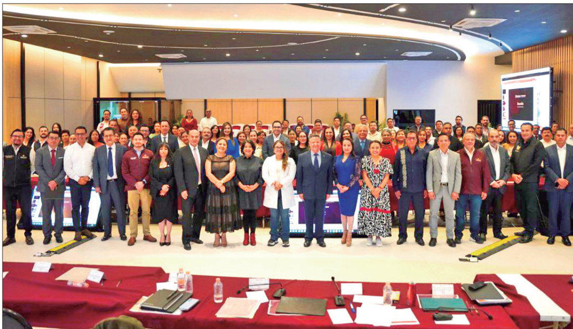
JULIO MENCHACA. El mandatario informó que el lunes por la tarde celebró un encuentro con 80 de 84 alcaldes para hablar de diversos temas, principalmente sobre gobernabilidad, coordinación permanente, rendición de cuentas y trabajo conjunto; asimismo, en vísperas tendrá encuentros con diputados federales y senadores.

■ La premisa para las y los presidentes municipales electos y quienes rendirán protesta en próximos días deberá ser utilizar adecuadamente los recursos en favor de todos los habitantes: lo pasado, pasado