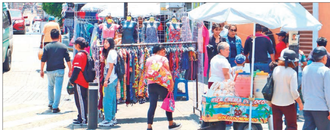
ANHELO. Posible reubicación o una regulación definitiva de la mayoría de los comerciantes.

► Saben comerciantes informales que el tema no es nada fácil, pues van varias administraciones y aún no hay acuerdos