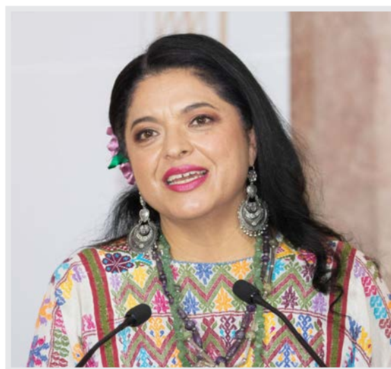
Alejandra Frausto Guerrero, Secretaria de Turismo

Finalmente, Nadine Gasman, quien ocupará la Secretaría de Salud, es una reconocida médica, diplomática y activista con más de tres décadas de experiencia en salud pública y derechos de las mujeres, tanto a nivel nacional como internacional. Ha liderado importantes campañas de igualdad de género y ha sido una defensora de los derechos de las mujeres, particularmente en temas relacionados con la salud sexual y reproductiva. Durante su gestión al frente del Instituto Nacional de las Mujeres (Inmujeres) desde 2019, promovió políticas para el empoderamiento de las mujeres y la igualdad de género en México. ●