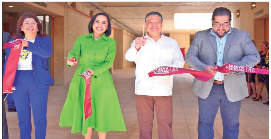
ENLACES. Asistió el jefe del Ejecutivo a la inauguración de la Nueva Ciudad Administrativa de Tizayuca, obra en la que tuvo participación la Secretaría de Desarrollo Agrario, Territorial y Urbano del Gobierno de México.

Finalmente, el titular del Ejecutivo estatal exhortó a las y los servidores públicos a trabajar con honestidad, responsabilidad, empeño y transparencia, ya que estos elementos contribuyen a la construcción de carreras profesionales con una alta responsabilidad social.