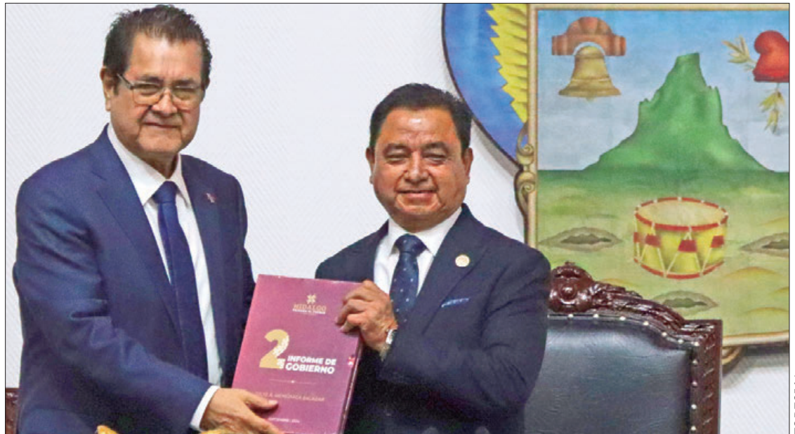
PAUTAS. Adelantó el secretario de Gobierno que con la LXVI Legislatura se mantendrá un trato respetuoso, amable y colaborativo, para que, junto con los Poderes Ejecutivo y Judicial, se haga historia en Hidalgo.

"La LXVI Legislatura inicia con pluralidad de opiniones, y un firme compromiso. Estoy convencido de que mis compañeras y compañeros coinciden conmigo en querer que Hidalgo se siga