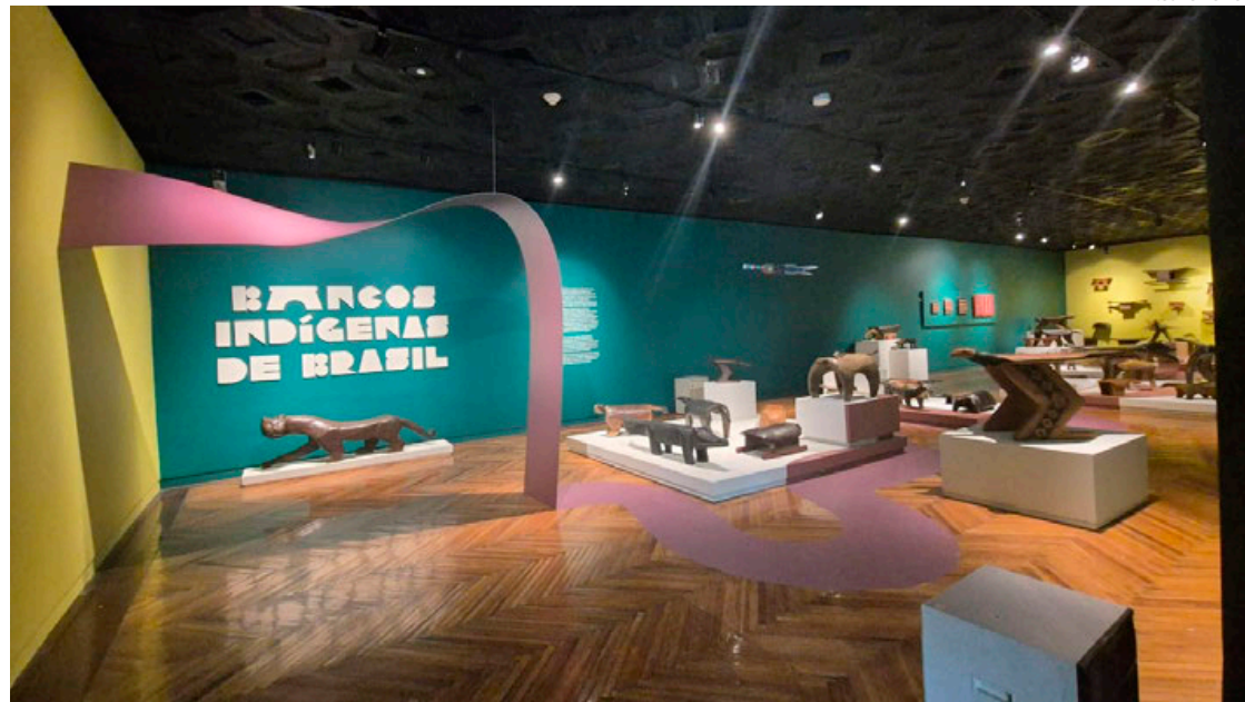
Una vista de la exposición “Bancos indígenas de Brasil”.