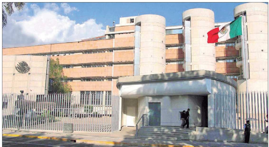
TRANCE. Al revocar la sentencia del Tribunal Electoral del Estado, que les otorgó regidurías por representación proporcional, dejaron sin efectos sus constancias de mayoría.

Otro dato relevante es que priorizaron la conformación paritaria en los cabildos, solo en Acaxochitlán, San Salvador, Santiago Tulantepec, Atitalaquia, San Felipe Orizatlán, Zacuapán de Ángeles, Tepehuacán de Guerrero, Actopan y Tula de Allende hubo una integración igualitaria entre hombres y mujeres, en los 74 restantes superó el 50% de representación femenina; asimismo, cada una de las alcaldías tiene al menos un joven y una persona con discapacidad. (Rosa Gabriela Porter Velázquez)