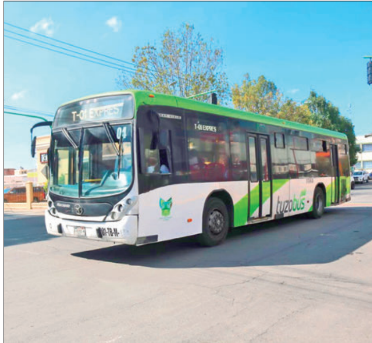
SEMOT. Acotación, de tener contemplada una visita a las oficinas del STCH, ubicadas en avenida de Los Prismas No. 205, es importante considerar que por única ocasión sólo se atenderán trámites previamente agendados,

Previamente, la Semot indicó que derivado del cierre de la vialidad en la calle Pachuca y calle Los Prismas en la zona sur de la capital hidalguense, este 6 de septiembre implementarán desvíos operacionales en las si-