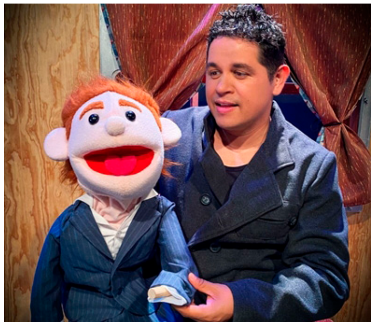
La obra se presenta este sábado en el Hay Festival.

En palabras del titiritero, esta historia basada en el libro ho-