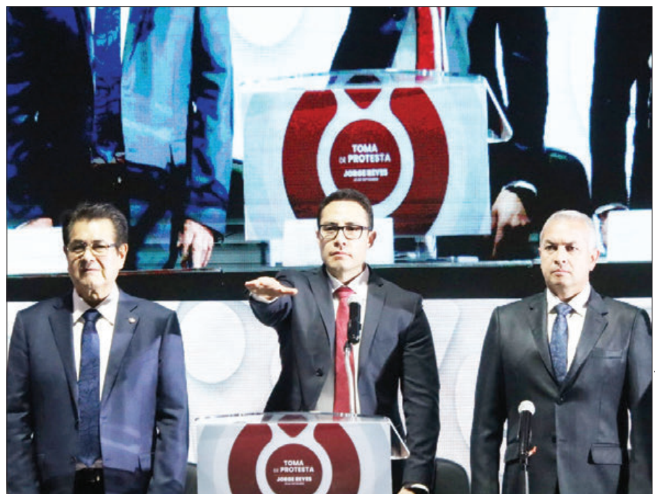
YA. Adelantó que su primera tarea será gestionar recursos para dar los resultados comprometidos con los pachuqueños.

"Desde hoy se propondrá un gobierno empático, pero sobre todo innovador, por