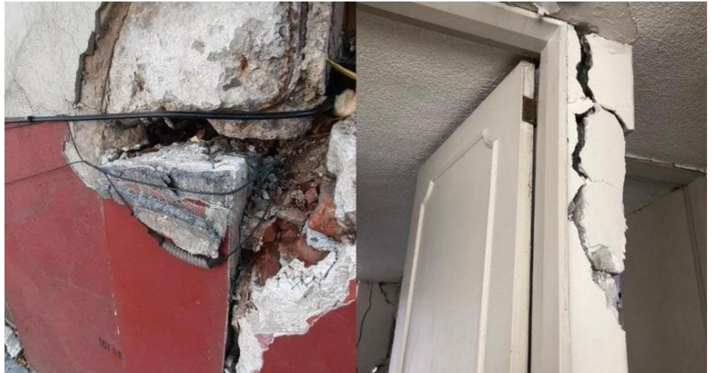
Estado actual del edificio.

“El edificio no cumple con los estados límite de prevención de colapso y la limitación de daños de la NTC de diseño, ni