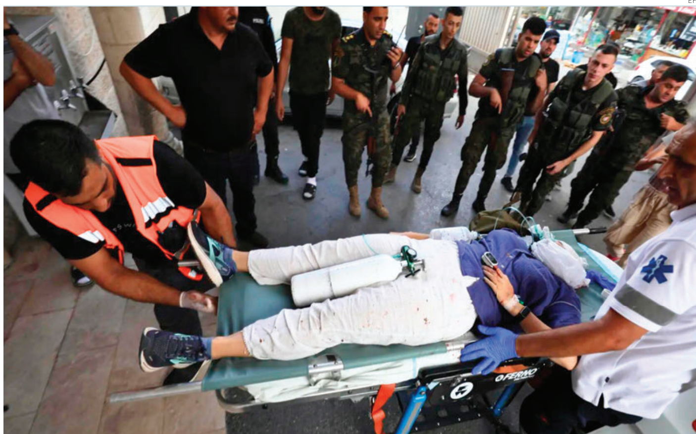
Elementos de un equipo de emergencia, al evacuar el cuerpo de la ciudadana estadounidense Aysenur Ezgi Eygi en Nablus.

Aysenur Ezgi Eygi marchaba contra los asentamientos en Cisjordania. “Las balas que la mataron las envía Biden”: Hamás