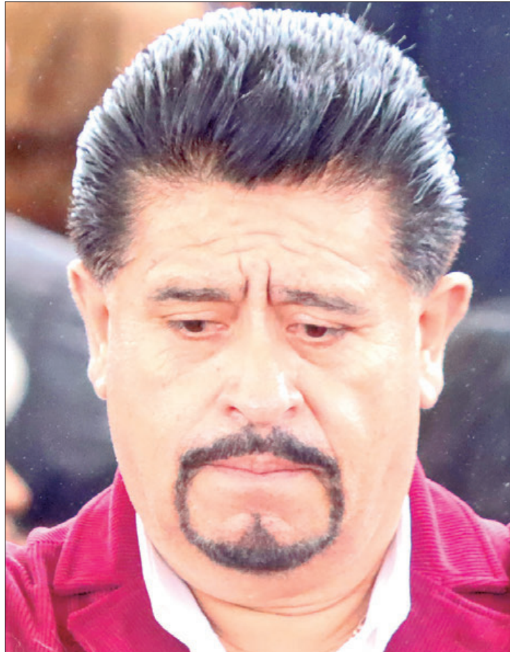
DENUNCIAS. Respecto a los procedimientos legales, hasta la fecha la dirigencia sindical no tiene ninguna notificación de las autoridades federales o estatales.

Recordó que durante enero del 2024 se jubilaron un promedio de 150 trabajadores del gobierno del estado de Hidalgo, para este año se tienen más propuestas que se analizan por parte del sindicato y autoridades de la administración estatal.