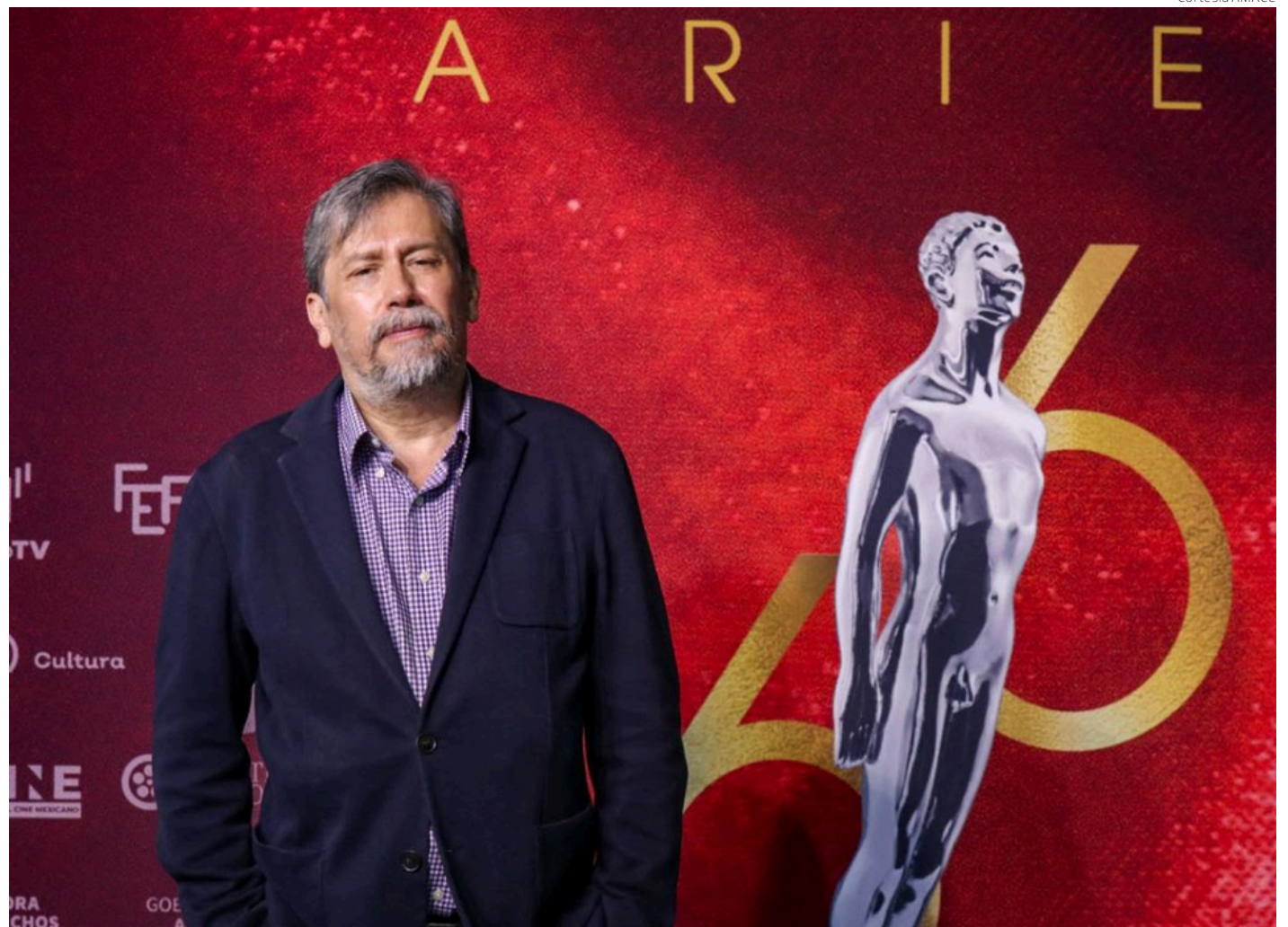
El cineasta Armando Casas.

creo que más que nunca está creciendo la presencia de las mujeres en el cine.