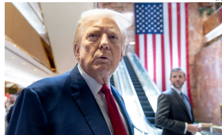
Trump tras una rueda de prensa en el vestíbulo de la Torre Trump.

El fallo de la Corte Suprema, con una votación de 6-3 en relación a otro caso criminal que enfrenta Donald Trump, estableció que los presidentes no pueden ser procesados penalmente por actos oficiales, y que las pruebas de sus acciones oficiales no pueden utilizarse para fundamentar casos penales que involucren acciones no oficiales ( EFE en Nueva York ).