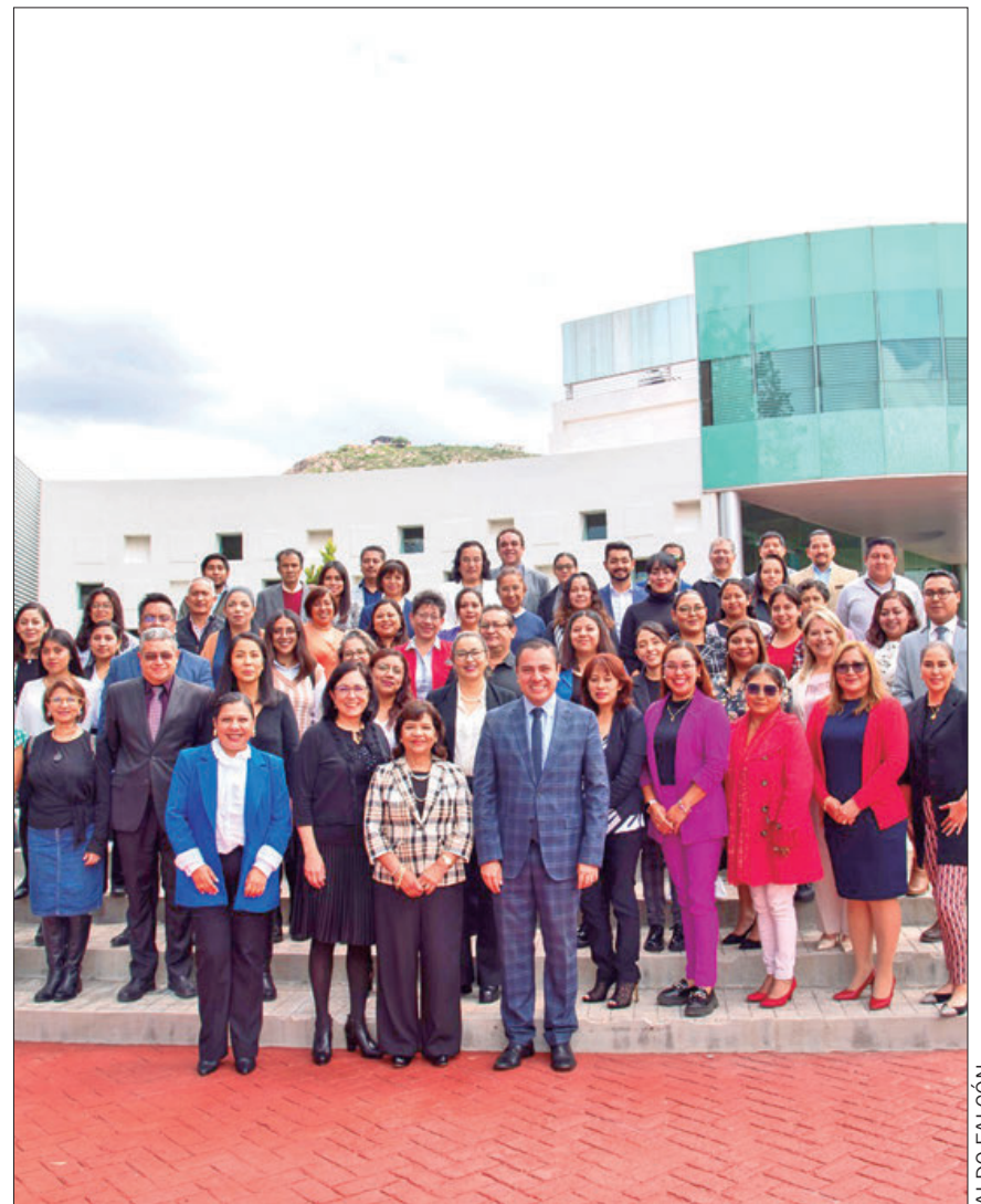
CAPACITACIÓN. La Dirección de Becas realizó una reunión con las y los responsables institucionales en donde se les dio a conocer el nuevo plan de seguimiento.

Explicó que como parte del proceso se capta la información del alumnado que solicita las Becas a través del Sistema Único de Beneficiarios de Educación Superior (SUBES), en donde se hace la gestión, se incluye la documentación requerida y se revisa cada uno de los casos, con la finalidad de que quienes cuenten con los requerimientos necesarios puedan proceder a obtener el apoyo monetario.