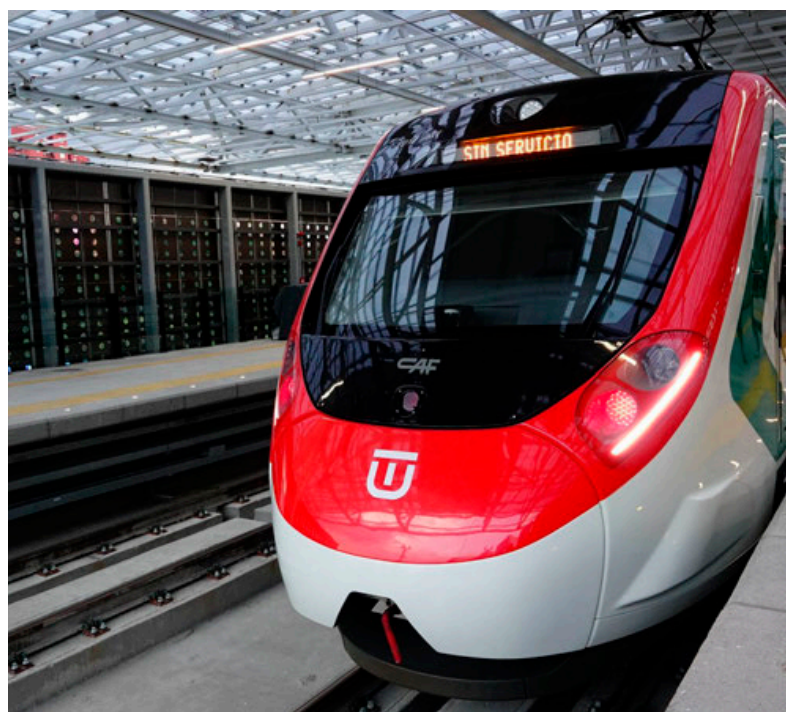
El tren interurbano tiene conexión con el RTP.

El jefe de Gobierno de la Ciudad de México, Martí Batres Guadarrama, informó que durante la primer semana de apertura del tren interurbano fue utilizado por 20 mil 79 pasajeros, de los cuales 8 mil 579 lo usaron en Santa Fe; el 2 de septiembre abordaron El Insurgente 20 mil 388 pasajeros en total y 6 mil 810 en Santa Fe; el 3 de septiembre, 20 mil 119