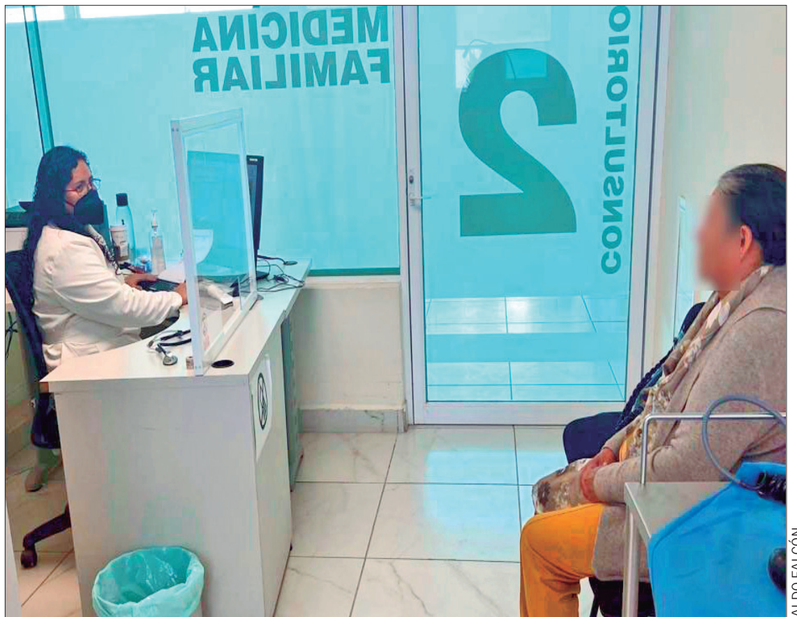
DIRECTRIZ. Atención durante el fin de semana en las Unidades Médicas Familiares (UMF) y Hospitales Generales de Zona (HGZ).