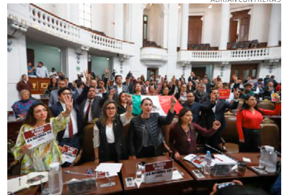
Morena en la celebración.