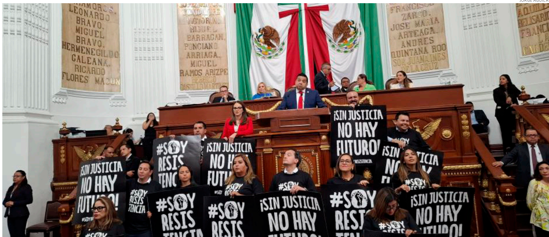
Panistas en la tribuna.