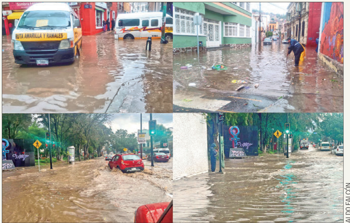
La intensa precipitación generó que el agua fluyera por espacio de una hora introduciéndose en algunos locales comerciales de calles, como: Guerrero, Doria Allende, Morelos, Hidalgo, Belisario Domínguez, la propia Avenida Revolución y Leandro Valle.