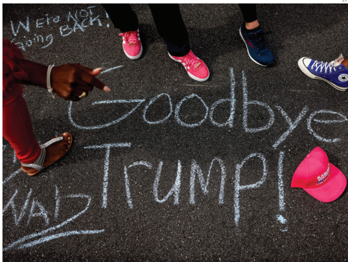
Seguidoras de Harris mandan mensaje a Trump, antes de ingresar al multitudinario mitin de la candidata demócrata este jueves en Charlotte (Virginia).

Contrariamente a lo que asegura Trump (usando el mismo razonamiento perverso que cuando se niega aún a reconocer que perdió las elecciones de 2020, y