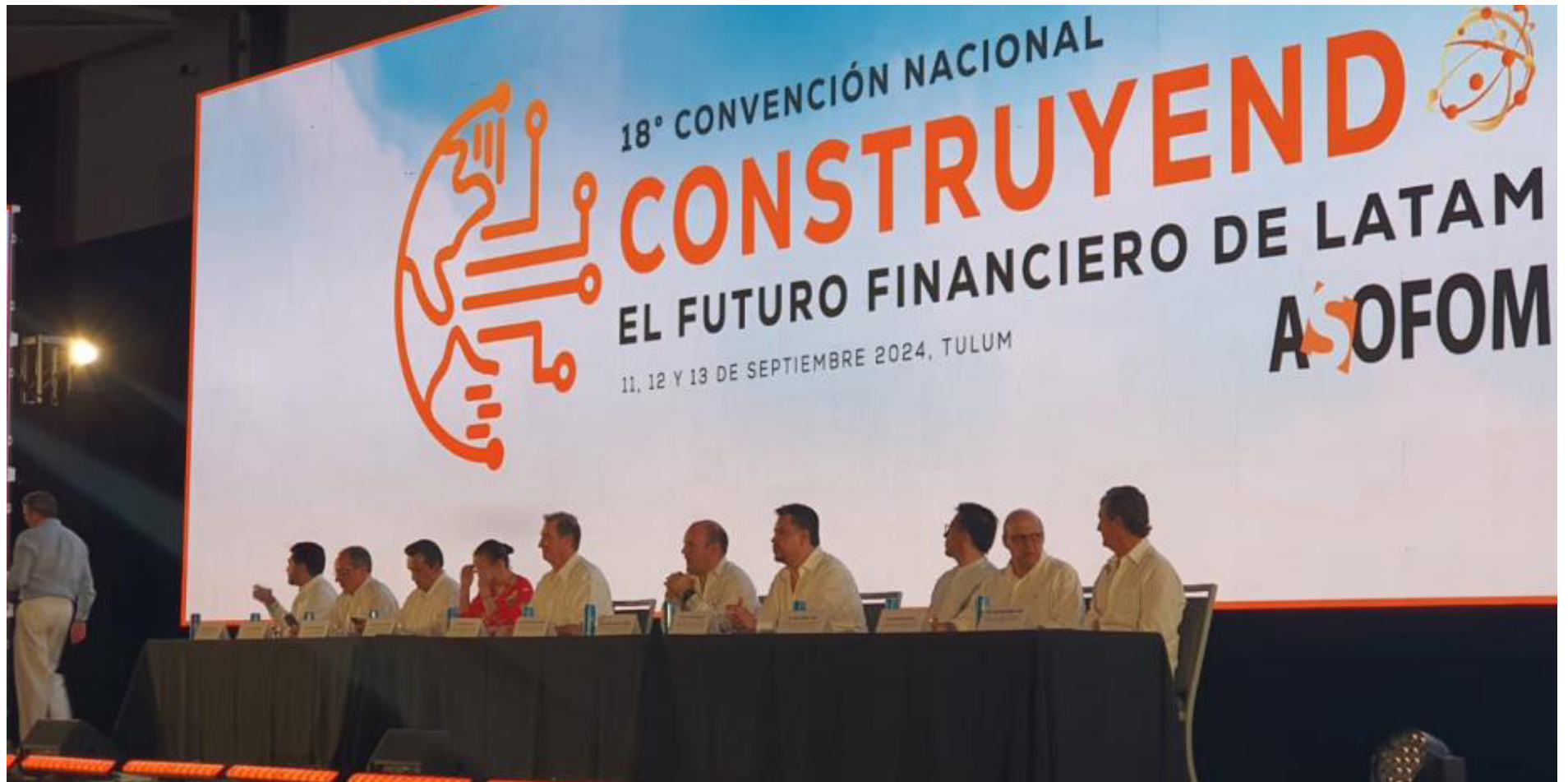
Epígrafe. Lorem ipsum dolor sit amet, consectetur adipiscing e enas bibendum

El nearshoring apuesta por la flexibilidad y es algo que en México se está entendiendo rápidamente a partir de las Sociedades Financieras de Objeto Múltiple