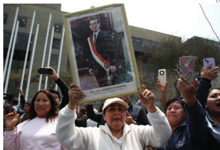
Peruanas aguardan su turno para dar su último adiós a Fujimori.

El vehículo en el que fue transportado su ataúd partió de su domicilio en el distrito limeño de San Borja hasta la próxima sede del ministerio, acompañada por miles de seguidores a pie y una escolta policial y de agen-