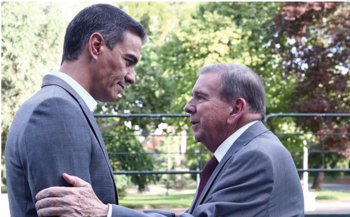
Pedro Sánchez, presidente del Gobierno español, recibió al candidato opositor antichavista, Edmundo González Urrutia.

El régimen repudia el "desprecio de la potencia más sanguinaria por la voluntad democrática de los venezolanos"