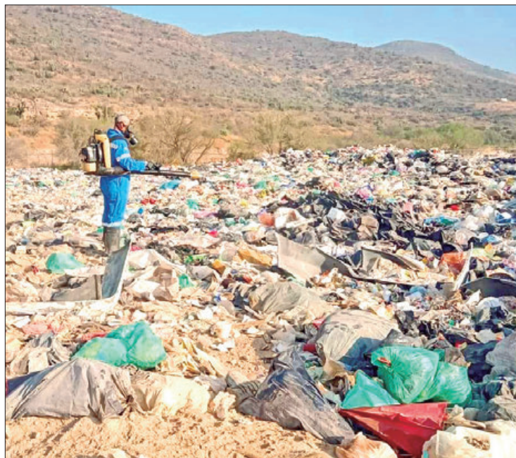
MEZQUITAL. Varias demarcaciones de esta región carecen de basurero o relleno sanitario.