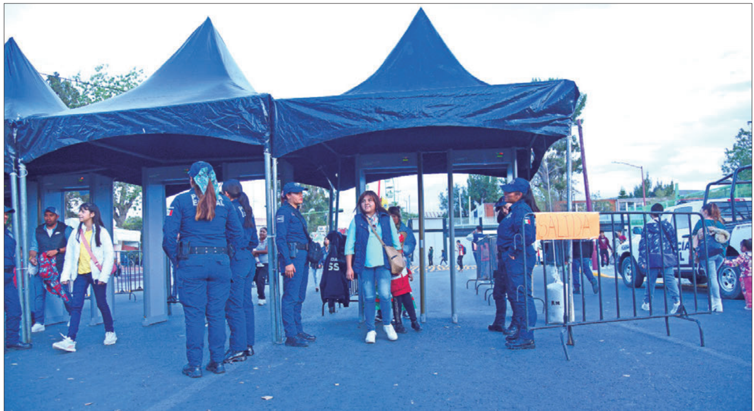
ACCIÓN. Distintas dependencias de la administración estatal trabajan en coordinación para atender cualquier llamado de emergencia.

servicio complementario, sin costo, que facilitará la conexión de las personas usuarias de la estación Manuel Dublán-Centro Histórico-Parque del Maestro, me-