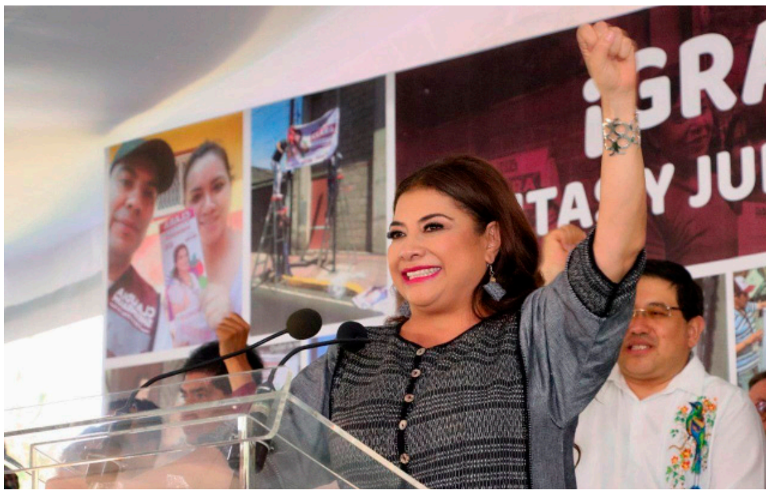
Brugada aseguró que durante su administración se crearán 100 Utopías más.

La próxima mandataria destacó la importancia de este avance como un paso clave para transformar la impartición de justicia en México