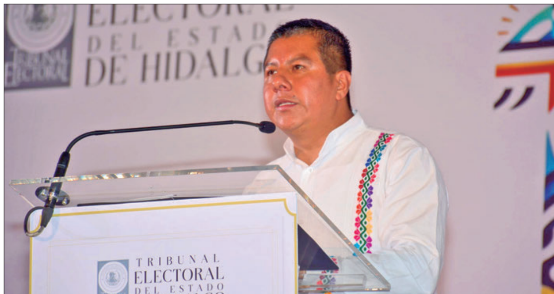
PARÁMETROS. Al comparar con años anteriores, en el 2016, que hubo una contienda concurrente de ayuntamientos, diputados locales y gobernador, de las sentencias locales, confirmaron un 90%; en los años 2017, 2018 y 2019, también registraron ese porcentaje.

"Tenemos el 83.2%, hubo proceso electoral, nosotros atendimos más de 536 asuntos; nosotros acabamos de estrenar Sala en Ciudad de México anteriormente se tenía la Sala Regional