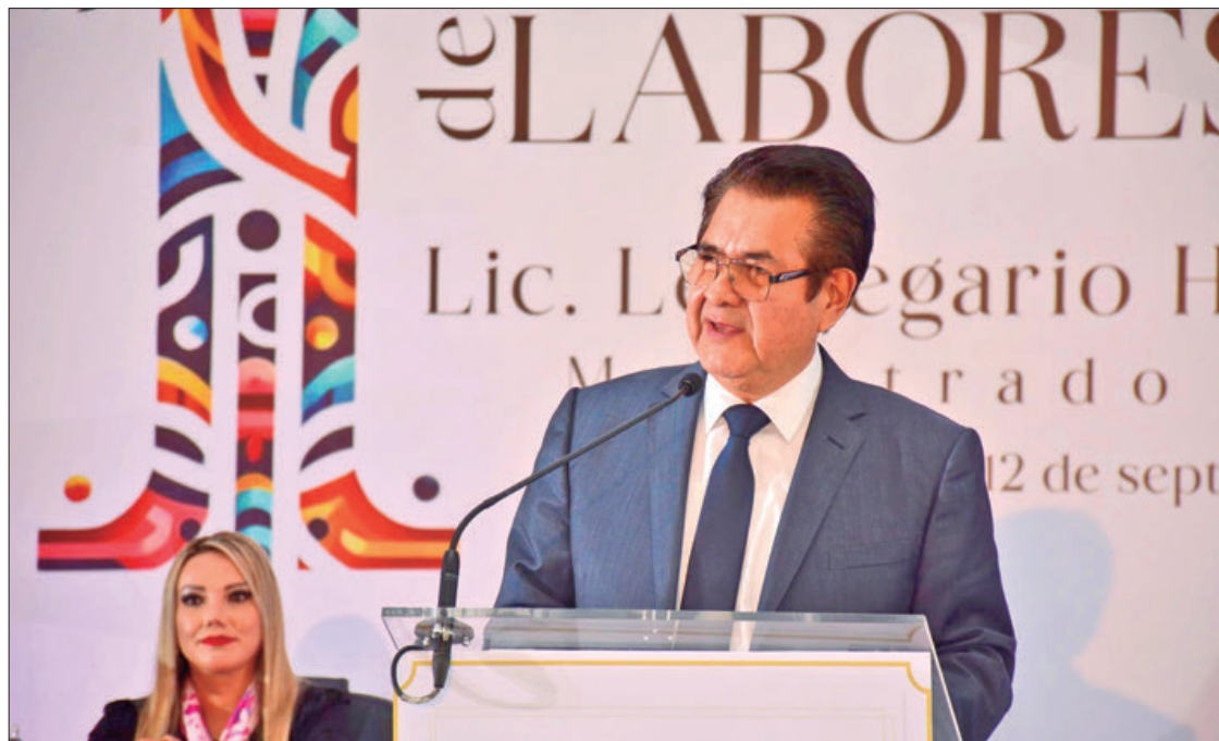
POSTURA. Sin duda que es un cargo de alta responsabilidad, sin embargo, pues estamos de lleno por lo pronto en la Secretaría de Gobierno.

"Les agradezco el comentario que nos dice el cargo de fis-