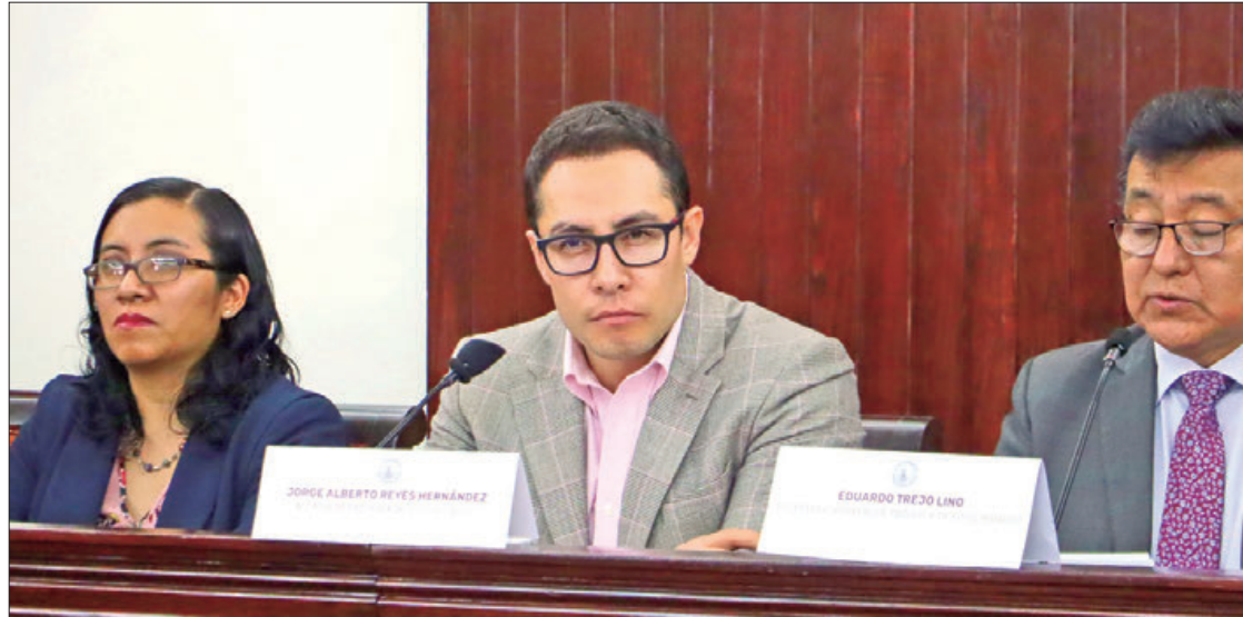
TRANCE. La administración municipal trabajará en una actualización catastral, ya que la última realizada data de entre 10 y 15 años.