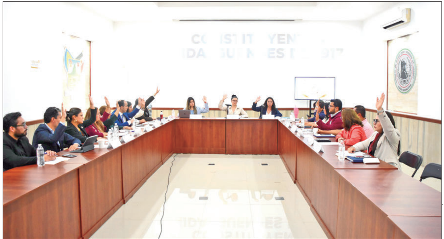
LEGISLATIVO. Política de puertas abiertas, en la que el diálogo y el intercambio de ideas siempre serán escuchados.

Tras declararse legalmente constituidos los trabajos de la sesión de la Comisión Permanente de Legislación y Puntos