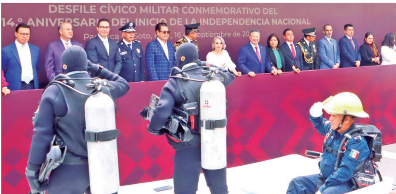
SEPTIEMBRE 16. Atestiguó el gobernador desfile conformado por diversos contingentes del sector educativo, docente, policial y militar.

■ Enfatiza jefe del Ejecutivo que el Gobierno estatal no dotará recursos para solventar laudos en presidencias; secretarías promoverán mecanismos