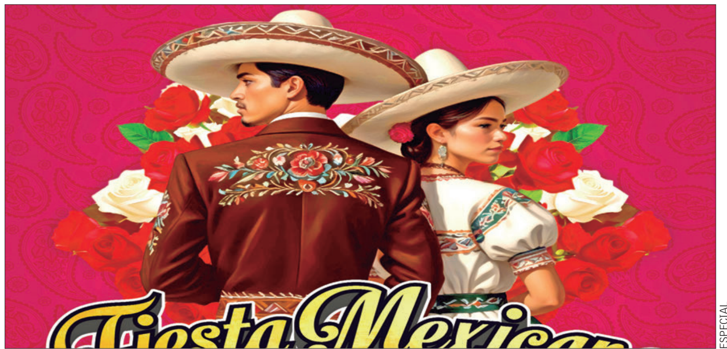
AGENDA. La invitación a disfrutar de esta Fiesta Mexicana, el día jueves 19 de septiembre a las 19:00 horas en el Teatro de la Ciudad San Francisco.