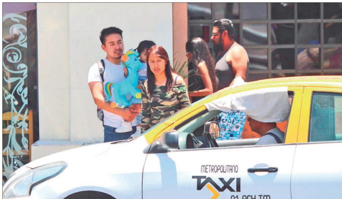
ROBO. Mencionan que viajes como desde los límites de la colonia Periodistas hacia Venta Prieta el costo fue de 220 pesos.

"Nos cobraron a las 7 de la tarde 95 pesos por un viaje de la colonia La Paz a Plaza Juárez, cuando normalmente nos cobran 55 pesos, pero no quedó otra que pagar por la necesidad de traslado que se tiene", señaló