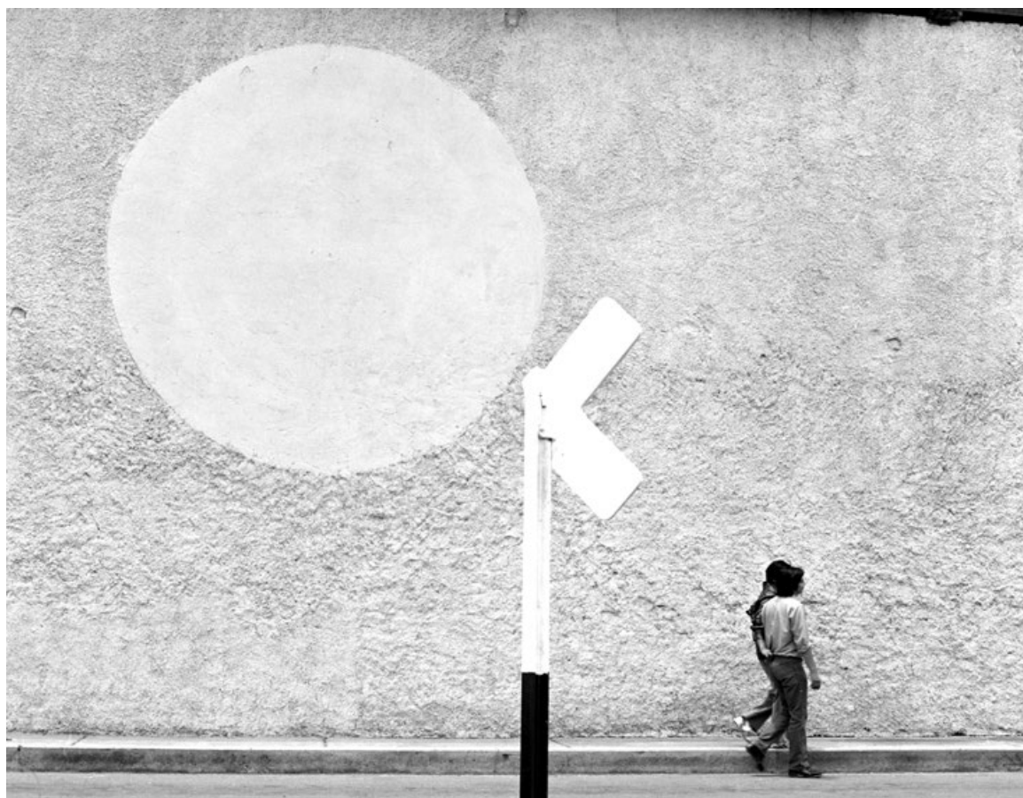
"Los novios de la falsa luna", de Manuel Álvarez Bravo.

Una exhibe parte de su trabajo para el cine y la segunda son imágenes de viajes y urbanas