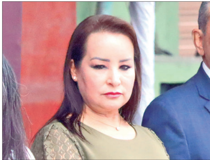
FUNCIÓN. Desde 2019 aplican estrategia orientada en afianzar las prestaciones laborales en las demarcaciones.

Desde el 2019 aplican dicha estrategia, orientada en afianzar las prestaciones laborales en las demarcaciones, principalmente con la retención mensual de un porcentaje monetario que previamente define cada alcaldía con