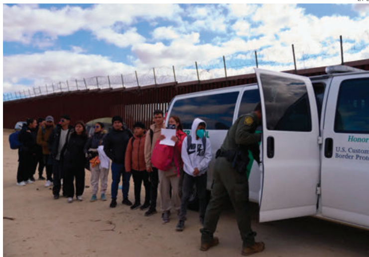
Migrantes detenidos en la frontera por la patrulla fronteriza.

Drástica caída de entrada de inmigrantes en menos de dos meses, tras endurecer Biden el derecho al asilo