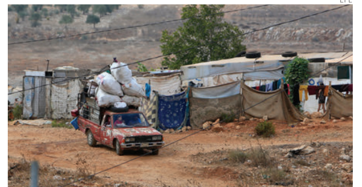
Libaneses huyen del sur de Líbano ante la escalada bélica entre Israel y Hezbolá.

Los “equipos de respuesta rápida”, como los denomina Israel, son unidades civiles que actúan en coordinación con el Ejército en varias comunidades, incluidos algunos asentamientos ilegales en Cisjordania ocupada. (Fran Ruiz)