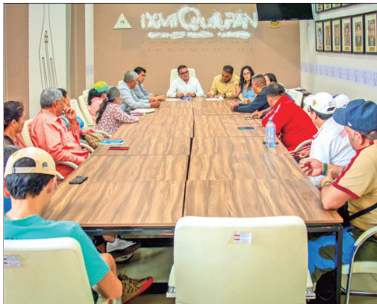
DIÁLOGO. El presidente municipal se reunió con deportistas de la Liga de Basquetbol de Ixmiquilpan, con quienes dialogó sobre el proyecto de rehabilitación de la Unidad Deportiva.

Expuso que este proyecto ya se encuentra validado; sin embargo, dijo que sabe de la pro-