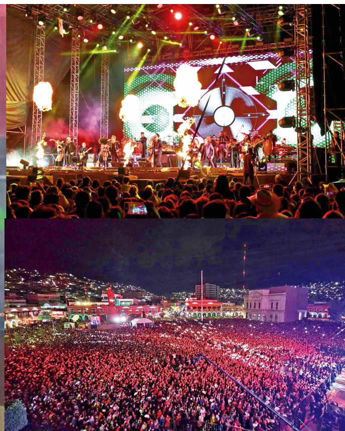
Este 15 de septiembre, el gobernador Julio Ramón Menchaca Salazar, acompañado por quienes encabezan los otros dos poderes estatales, conmemoró el 214 Aniversario del Grito de Independencia en el Palacio de Gobierno de Hidalgo.