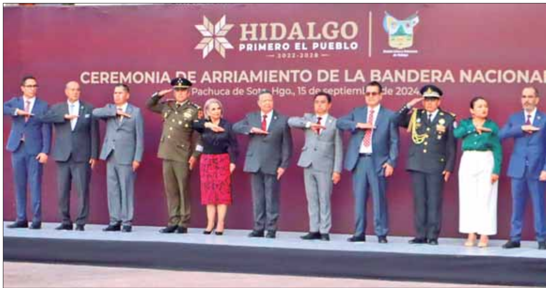
HISTÓRICO. Este fue el primer evento multitudinario tras la remoción de 8 mil metros de concreto y remodelación en Plaza Juárez que costó más de 22 millones de pesos.

"Es un momento muy importante en la vida de nuestro país, de nuestro estado y