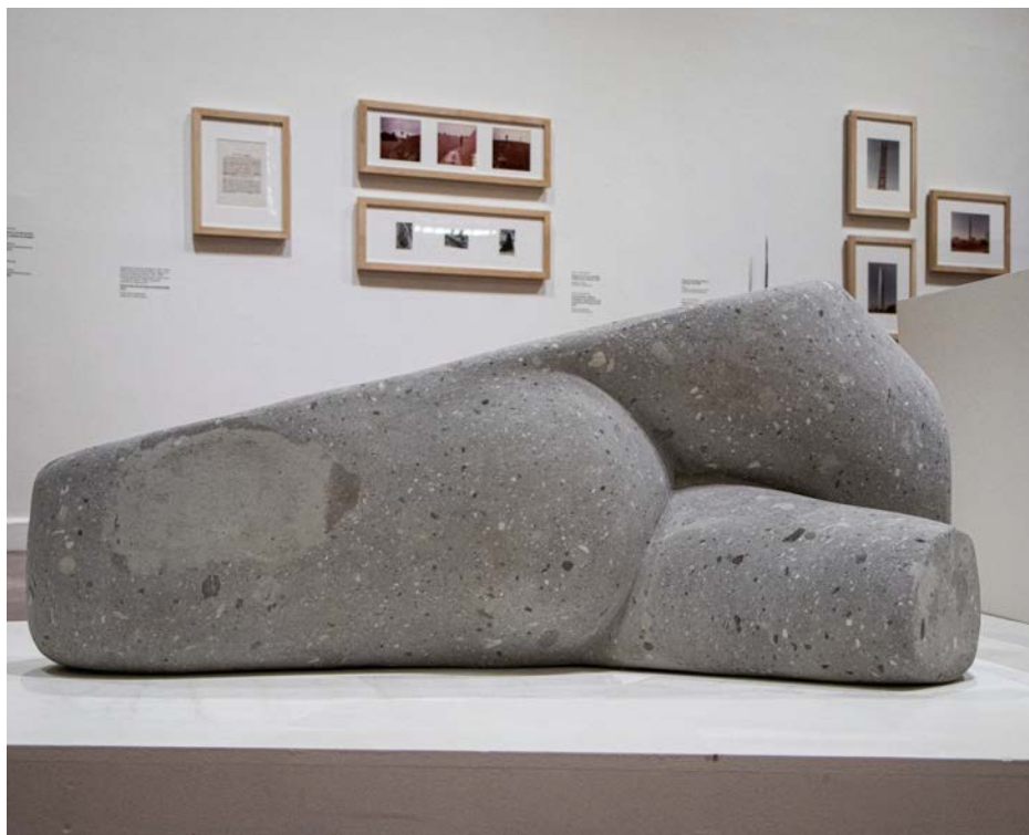
Algunas de las piezas que conforman la muestra "Ángela Gurría. Señales".