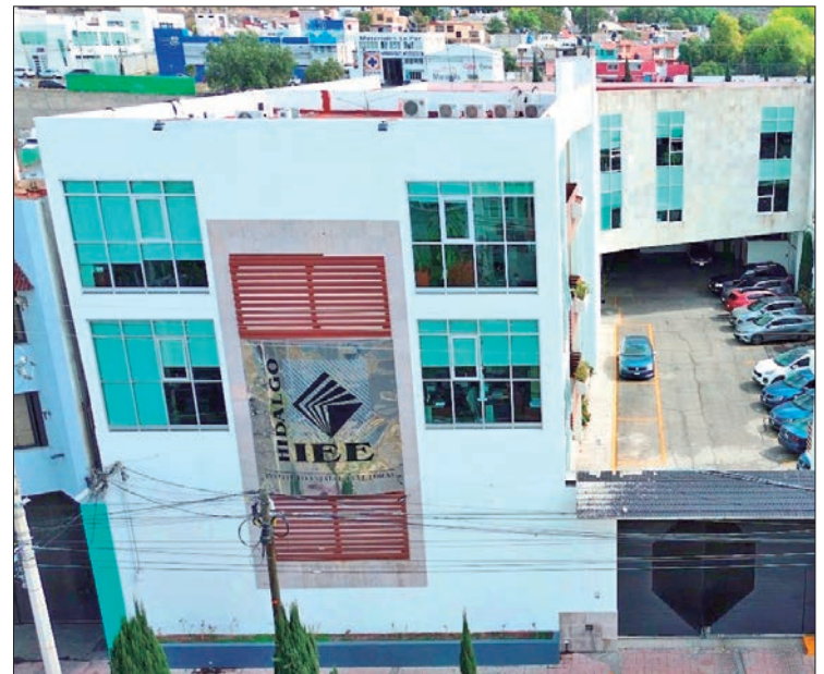
CONCORDANCIA. Además el portal habilitado recibió un cifra superior a los 52 mil visitas.

Respecto a las 860 candidaturas a ediles, destacaron 167 de "Seguiremos haciendo historia en Hidalgo", bloque conformado por Morena y Nueva Alianza Hidalgo (PNAH); 160 registros del Partido del Trabajo (PT), 128 del Verde Ecologista de México (PVEM), 119 de Movimiento Ciudadano (MC), 96 de "Fuerza y Corazón por Hidalgo", integrada por Acción Nacional (PAN), Revolucionario Institucional (PRI) y Partido de la Revolución Democrática (PRD); asimismo, 64 contendientes del PRI, 50 panistas, 34 perredistas y 42 in-