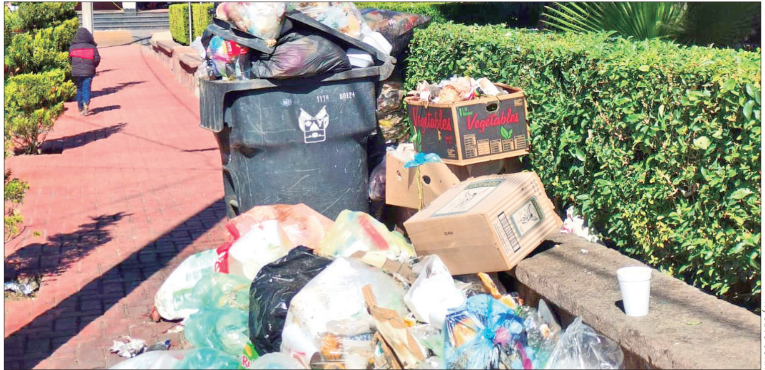
SITUACIÓN. El presidente municipal Dijo que en este momento tienen algunos problemas con la recolección de basura, sin embargo, en breve regularizarán el servicio.