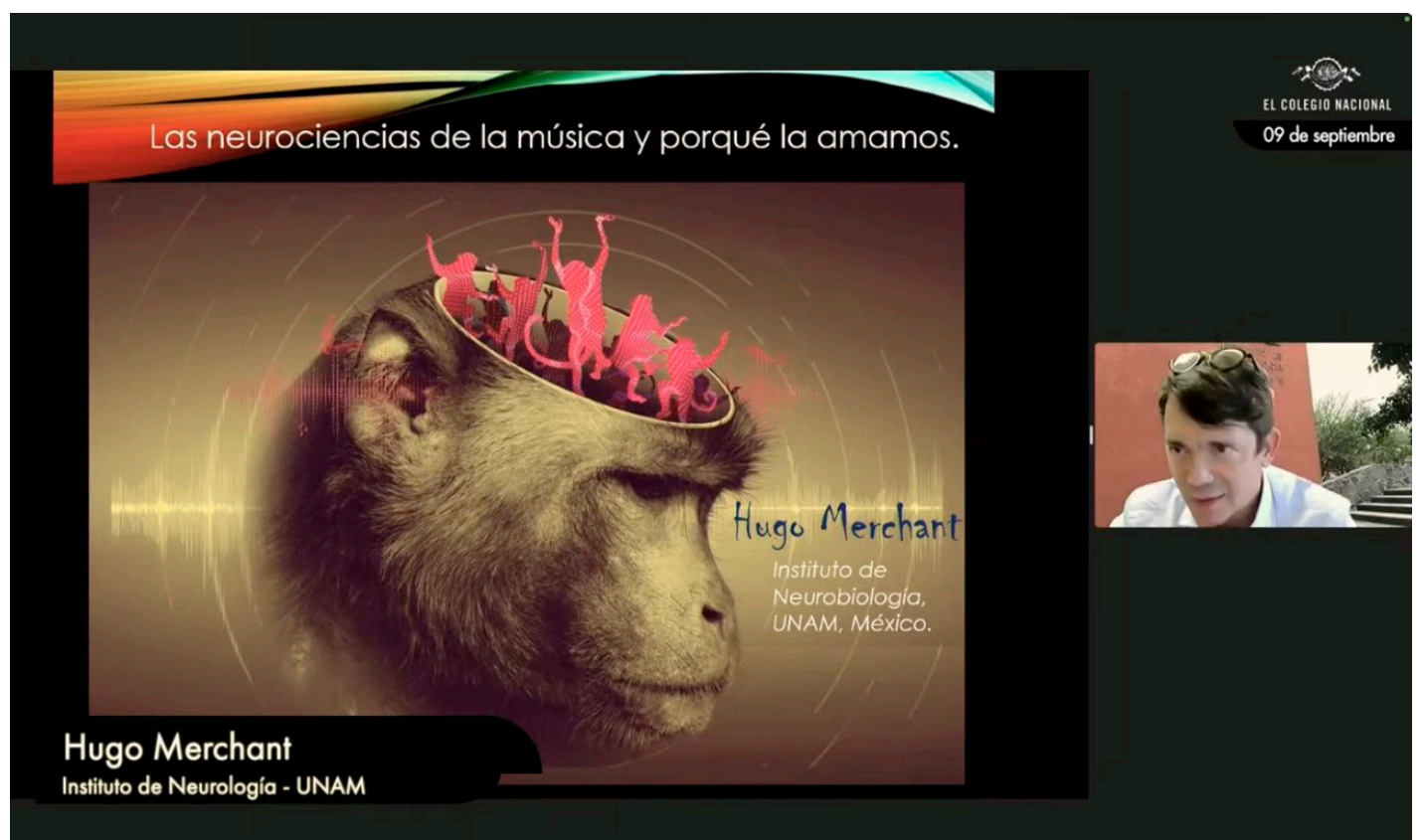
En El Colegio Nacional se llevó a cabo el encuentro “Las neurociencias de la música y por qué las amamos”.

Esta refiere que la sincronización al compás de la música emergió evolutiva-