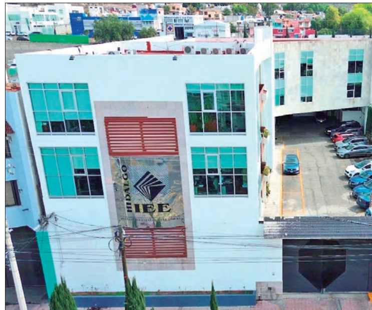
CONCORDANCIA. Además el portal habilitado recibió un cifra superior a los 52 mil visitas.

Respecto a las 860 candidaturas a ediles, destacaron 167 de "Seguiremos haciendo historia en Hidalgo", bloque conformado por Morena y Nueva Alianza Hidalgo (PNAH); 160 registros del Partido del Trabajo (PT), 128 del Verde Ecologista de México (PVEM), 119 de Movimiento Ciudadano (MC), 96 de "Fuerza y Corazón por Hidalgo", integrada por Acción Nacional (PAN), Revolucionario Institucional (PRI) y Partido de la Revolución Democrática (PRD); asimismo, 64 contendientes del PRI, 50 panistas, 34 perredistas y 42 in-