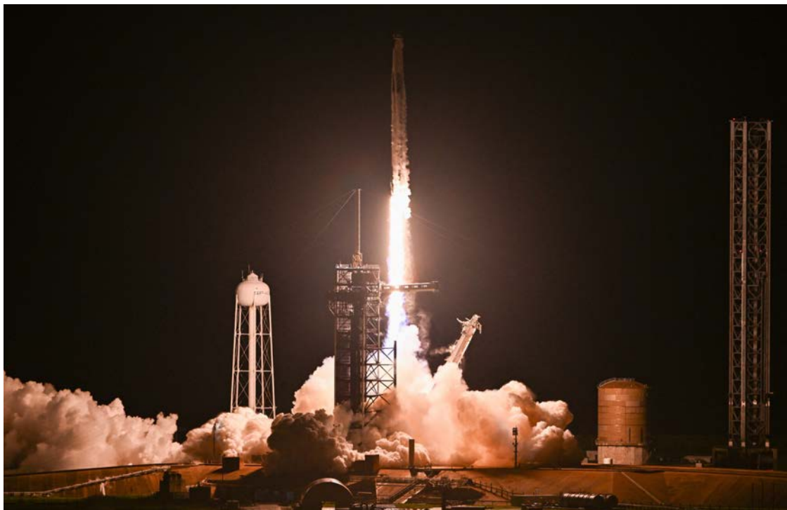
El despegue de la misión Polaris que regresará a la Tierra el próximo domingo.