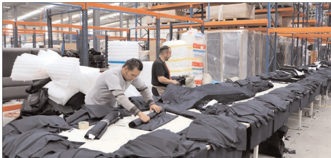
BALANCE. En total, en la entidad se han creado 14 mil 480 nuevos empleos formales durante los primeros ocho meses del año, lo que representa una tasa de crecimiento de 5.4 %, superando con creces la tasa nacional de 1.7 %. Con este resultado, Hidalgo se posicionó en el primer lugar a nivel nacional por mayor crecimiento.

En los primeros dos años del gobierno de Julio Menchaca, en Hidalgo se han creado 26 mil 837 nuevos empleos formales, superando los registros de empleo en el mismo periodo de administraciones anteriores, lo cual demuestra un avance significativo en cuanto a desarrollo económico.