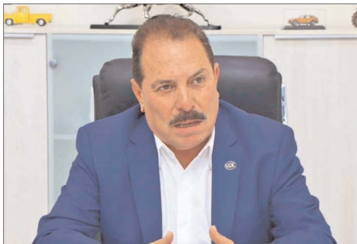
AXIOMAS. La sociedad hidalguense espera los resultados de las promesas que hicieron durante las campañas, ahora es momento de responder y cumplir.

Los resultados y avances son un logro del sector empresarial, se