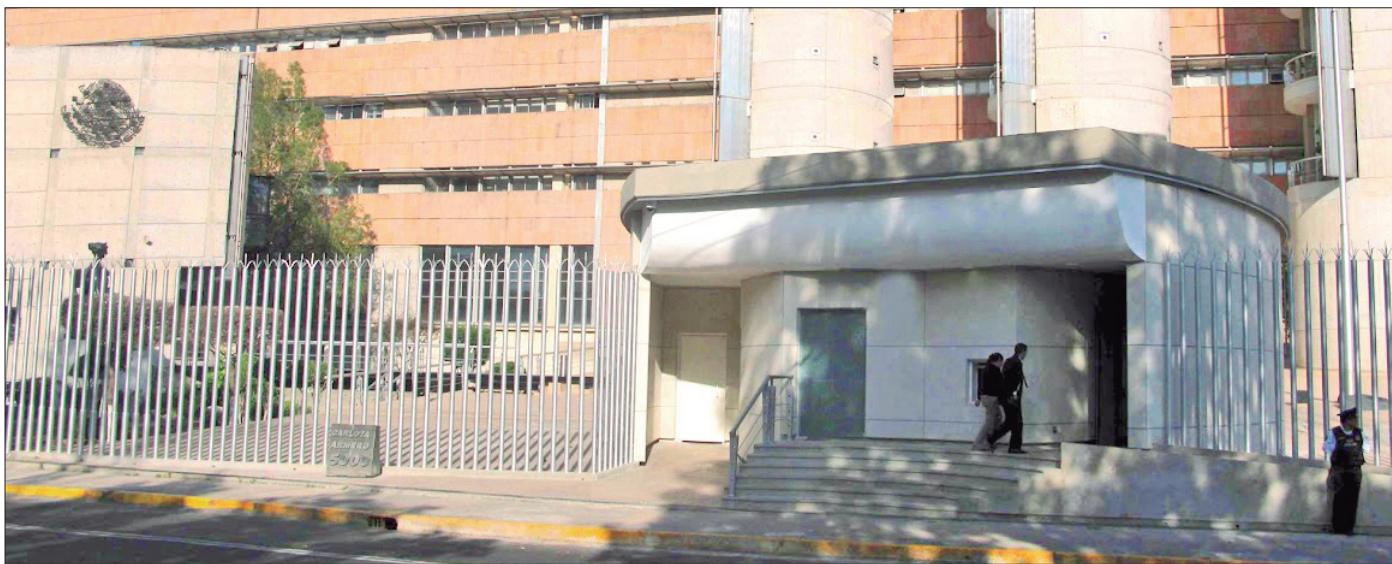
SITIO. Referido evento fue celebrado el 7 de septiembre del 2023.

► TEPJF indicó que el gobernador, y otros mandatarios de Morena, no incurrieron en vulneraciones a los principios de neutralidad, imparcialidad y equidad de la pasada contienda presidencial