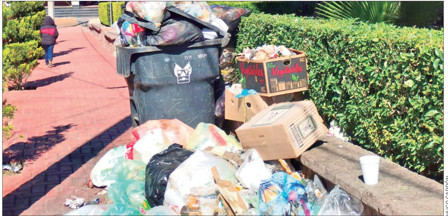
SITUACIÓN. El presidente municipal Dijo que en este momento tienen algunos problemas con la recolección de basura, sin embargo, en breve regularizarán el servicio.