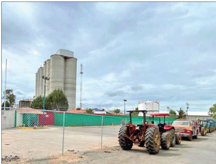
CASO. Productores se manifestaron afuera de los silos de la empresa ubicados en la comunidad de Palma Gorda, perteneciente a Mineral de la Reforma, en donde externaron su desacuerdo y se adhirieron a la exigencia que se ha tenido en contra de la misma compañía.