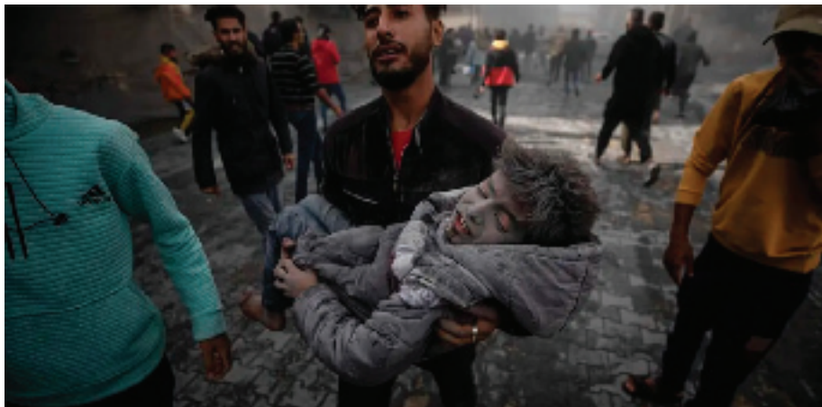
Quince mil niños han sido asesinados por Israel en un año de bombardeos sobre Gaza.

En vez de reflexionar o buscar una vía para esta solución a la crisis crónica, Israel ha sido declarado “persona non grata” y tiene prohibida la entrada en el Estado judío.