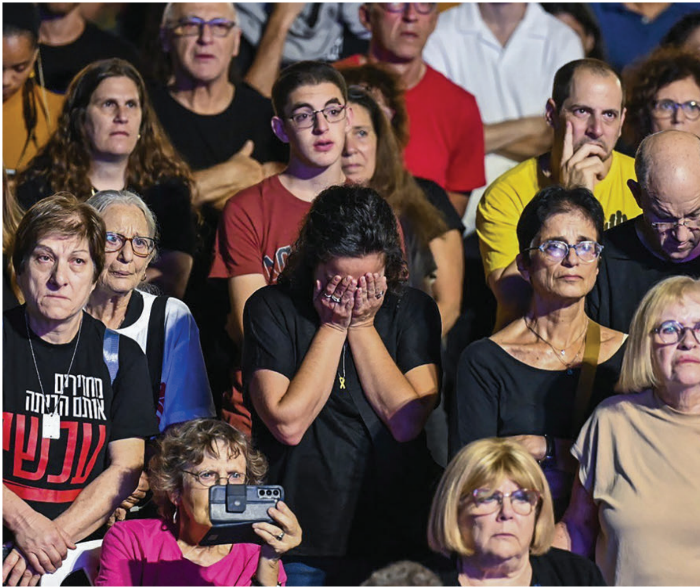
Familiares de rehenes en en manos de Hamás un acto la noche de este 7 de octubre en Tel Aviv.

dente de Estados Unidos, Donald Trump, y que normalizó las relaciones de Israel con Emiratos Árabes Unidos.