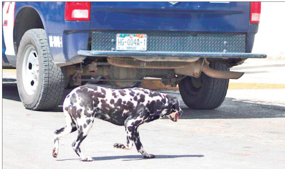
IRRESPONSABILIDAD. Vecinos se quejan de perros y gatos deambulando en las calles; sin embargo, muchos de ellos son a consecuencia del abandono por parte de los mismos colonos.

Indicó que este problema ya no es privativo de la zona sur de la ciudad, ya que en otras colonias cercanas al centro de