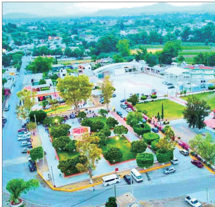
COLABORACIÓN. Solicitaron la intervención de la Secretaría de Contraloría para verificar la obra de infraestructura vial.

Dijo que, si la empresa tiene que reemplazar el trabajo, lo debe de hacer, pues de lo contrario tienen que proceder legalmente.