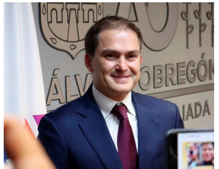
Añadió que esta semana quedará instalado el Gabinete de Seguridad y Construcción de la Paz en la alcaldía

la Policía y mejorar la vigilancia en las calles, colonias y espacios públicos de nuestra demarcación. Vamos a invertir en equipamiento para nuestros uniformados, así como en tecnología de última generación