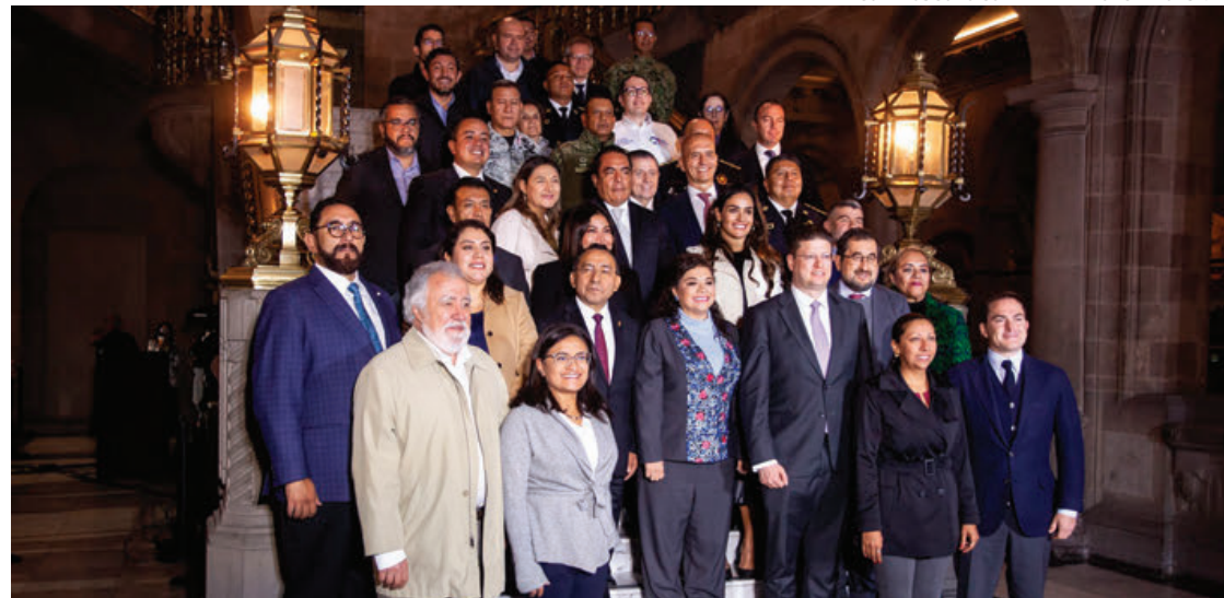
La jefa de Gobierno Clara Brugada y su gabinete de Seguridad Ciudadana.

Además, al reafirmar que la seguridad es un tema que no puede descuidarse ni un solo día, resaltó la necesidad de coordinación entre los distintos niveles de gobierno y las autoridades electas de la ciudad para fortalecer las políticas de seguridad. “La se-