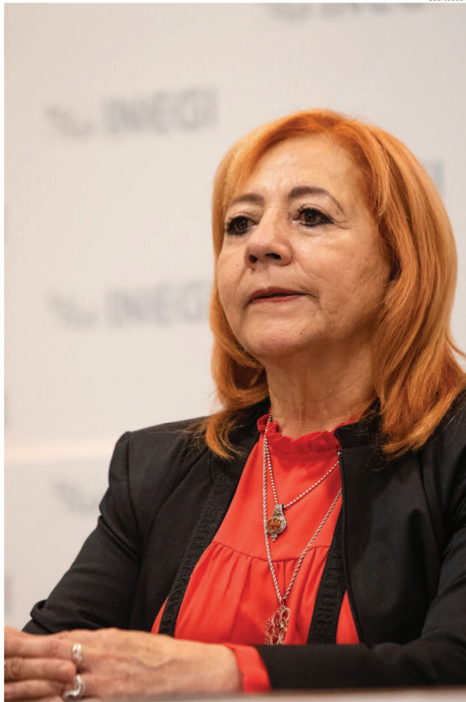
Rosario Piedra Ibarra, titular de la Comisión Nacional de los Derechos Humanos.

La mayoría de las recomendaciones ha sido por casos ocurridos antes de 2018. No es una casualidad. Es una política deliberada. El propósito es generar la idea de que los derechos humanos de los mexicanos eran violados antes de manera importante, no desde que el pueblo llegó al poder a través de su en-