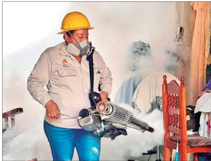
DATOS. Hasta el momento se registran casos en diversos municipios de la Huasteca, Sierra Gorda y Valle del Mezquital.

Hasta la semana epidemiológica 39, se registraron 901 casos de dengue no grave, 119 casos con signos de alarma y 7 casos con dengue grave.