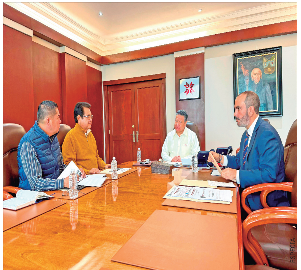
Durante la reunión semanal del Gabinete de Seguridad, el gobernador ahondó en detalles de este caso.

Igualmente dio a conocer que, durante la última semana, se llevaron a cabo 10 cateos en siete municipios de la entidad, operativos en los que fue posible la recuperación de armas... .3