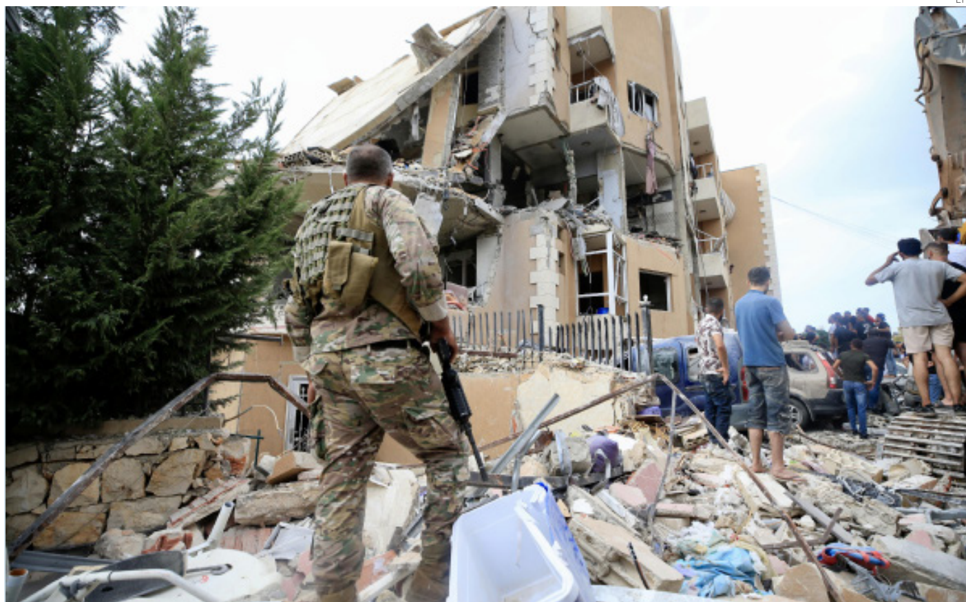
Un soldado del ejército y lugareños se reúnen en el lugar de un ataque militar israelí en Barja, al sur de Beirut.

22 localidades del sur libanés deberán desplazarse al intensificarse los combates con la milicia chií Hezbolá