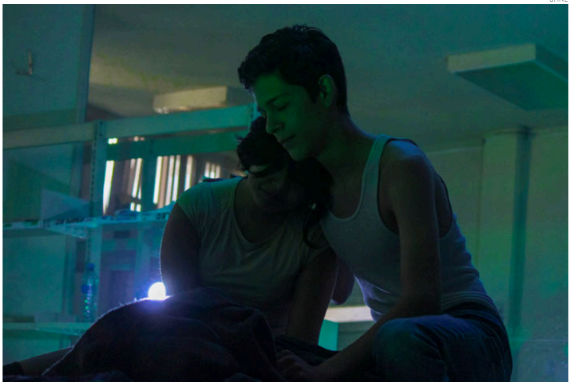
La obra “Ni cerca ni distantes”, montada por el taller de Teatro de la Facultad de Trabajo Social y Desarrollo Humano de la UANL.

“Me preguntaba qué había detrás de esta realidad que nos contaba el autor. Nosotros, en el trabajo de creación vimos que Sergio y Lila no pueden encontrar una idea para seguir viviendo y al final, tal vez, el amor puede ser la única esperanza para que, al menos, ellos puedan vivir”, expresó.