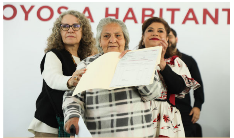
Brugada entregó apoyos económicos a 621 habitantes de los barrios de Caltongo y Xaltocan, alcaldía Xochimilco y anunció medidas tras las afectaciones causadas por la intensa tormenta que golpeó al sur de la ciudad. En ayuda a las unidades productivas afectadas, Clara Brugada detalló que se entregaron kits con productos fitosanitarios para evitar la pérdida de plantas y flores por la formación de hongos y se compraron 218 mil plantas de cempasúchil.

La jefa de gobierno también resaltó la importancia de las lenguas indígenas y la necesidad de impulsar su enseñanza, investigación y difusión. ●