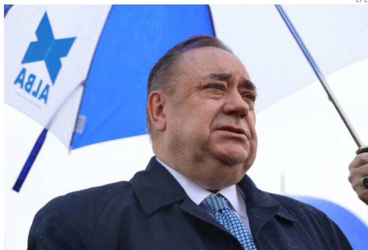
Alex Salmond falleció repentinamente tras caer enfermo.

Impulsó plebiscito sobre la independencia, pero venció la permanencia en el Reino Unido