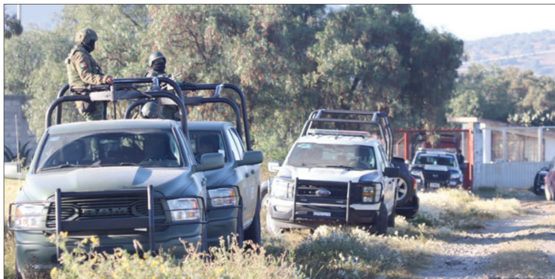
CUSTODIA. Los primeros respondientes acordonaron la zona en donde fueron identificados casquillos percutidos de un arma de fuego aparentemente de calibre nueve milímetros.

De igual forma se mantenía las diligencias correspondientes para conocer datos precisos so-