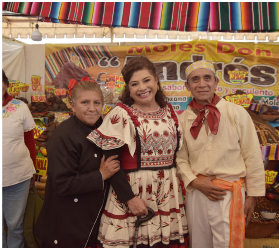
Se han instalado políticas públicas orientadas a garantizar el bienestar de las comunidades.

que hizo en su momento el entonces presidente Andrés Manuel López Obrador y la ex jefa de gobierno, Claudia Sheinbaum, para que las potencias europeas ofrezcan disculpas a los pueblos originarios por los abusos y violaciones cometidos durante la colonización.