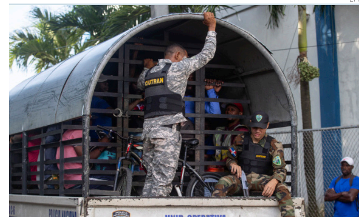
Guardias dominicanos vigilan a inmigrantes haitianos.

Según el comunicado, el CPT está llevando a cabo gestiones similares con gobiernos de varias capitales extranjeras y organizaciones internacionales para solicitar apoyo y solidaridad (EFE).