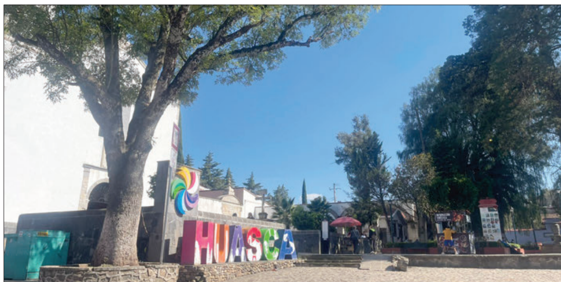
ATRACCIÓN. Son 10 tour operadoras de Oaxaca visitaron el Municipio esta semana.

► Anteriormente atendía al interior de presidencia municipal con horarios limitados, lo cual fue un compromiso del alcalde Felipe Lugo