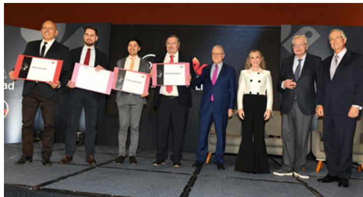
Los premiados con sus reconocimientos.

“Es muy interesante cómo el doctor Hope tiene esta institución que se llama La Sociedad de la Propiedad y la Libertad. Efectivamente, si no eres dueño de tu vida, no eres dueño de tu cuerpo, y pues no puedes tener ninguna libertad. Por eso, el derecho de propiedad es indisoluble fundamento de la libertad”, expresó Ricardo B Salinas Pliego, presi-