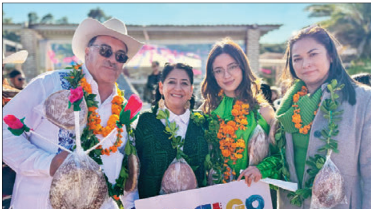
ACTIVIDAD. Representantes de 22 estados dejaron una piedra marcada simbólicamente, representando la diversidad y riqueza culinaria de cada región.

Durante este encuentro, se contó con la participación de co-