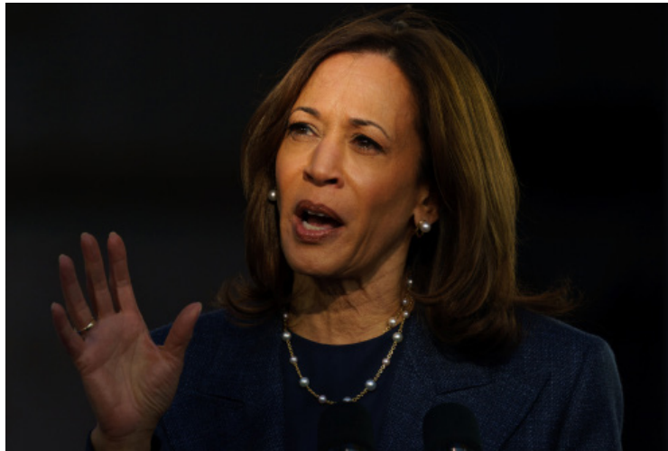
Kamala Harris ha puesto freno a las agresiones del republicano.

Habló sobre las agresiones contra su rival republicano y asegura que es necesario que alguien le responda