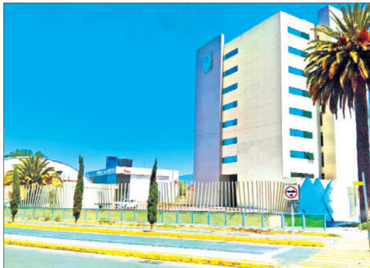
PERCEPCIÓN. Afirman que es preocupante el escenario de inseguridad que se ha percibido en las últimas semanas tanto en Pachuca como en municipios cercanos.

Manifestaron que ante el escenario de inseguridad que se ha percibido en las últimas semanas tanto en Pachuca como en municipios cercanos, es preocupante que