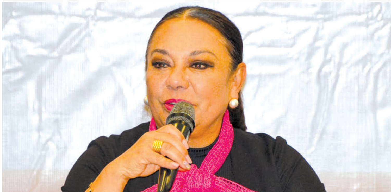
HECHO. El propósito de este órgano es garantizar y promover el acceso a la información, la transparencia y los derechos de protección de datos personales.

El horario pactado para la recolección de residuos en PIFSAL, será de 7:00 a 7:30 horas y de 16:00 a 16:30 horas, de tal manera que, en caso de no respetarlos, habrá sanciones tal y como fue convenido con los líderes de PIFSAL, quienes también se comprometieron a comunicar a sus agremiados ese acuerdo. (Staff Crónica Hidalgo)