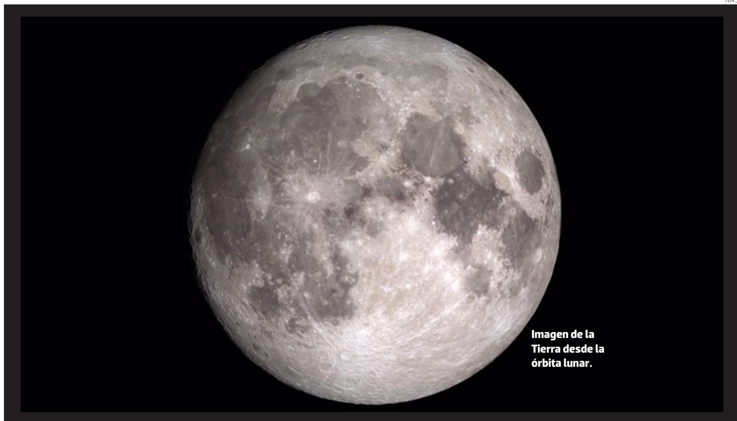
Imagen de la Tierra desde la órbita lunar.

La nueva investigación publicada en The Planetary Science Journal ofrece otra posibilidad: el encuentro con un binario rocoso