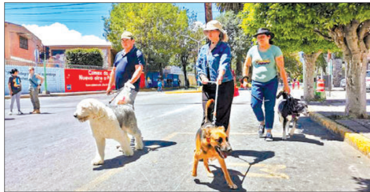
HECHO. El ayuntamiento de Pachuca consideró viable mantener vigente el programa dominical.