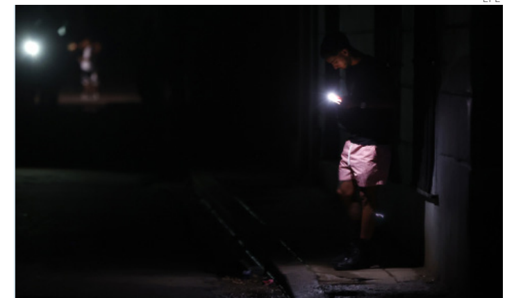
Un cubano observa su celular durante el apagón de este viernes.

Además, los fuertes vientos provocados por el huracán Milton la semana pasada complicaron la entrega de combustible desde barcos en alta mar hacia las plantas de energía (EFE) •