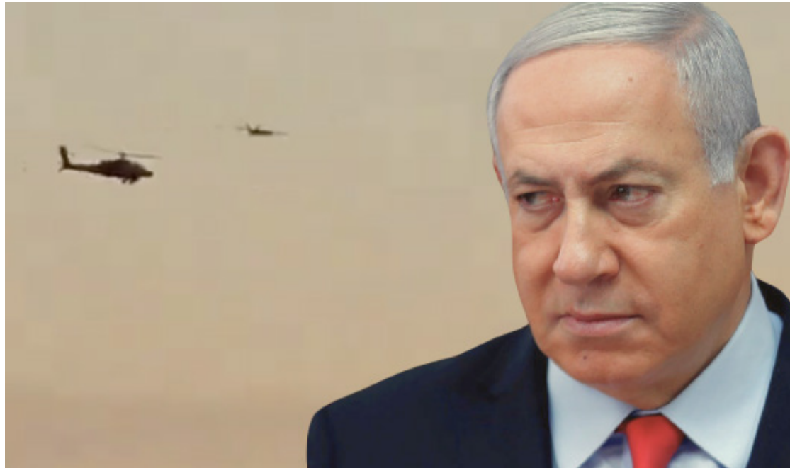
Se identificaron tres vehículos aéreos no tripulados que cruzaron desde el Líbano hacia territorio israelí, presuntamente para atacar el hogar del primer ministro.

El primer ministro de Israel, Benjamín Netanyahu, declaró que los responsables del ataque cometieron “un amargo error”.