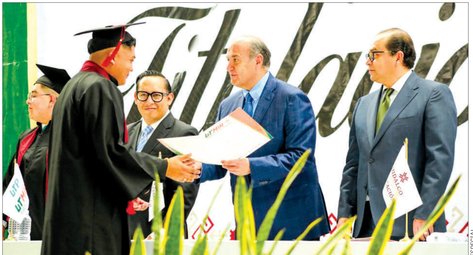
ACTIVIDADES. Esta ceremonia representa el fin último para el cual trabajan todos los que están involucrados en la educación media superior y superior.