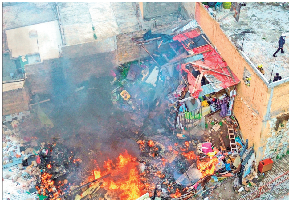
La acumulación de trebejos y artículos viejos, fue la causa de un incendio que se registró la mañana de este domingo, dentro de una vieja casa ubicada sobre el callejón Antonio del Castillo, en la colonia La Palma, en Pachuca.

El próximo 15 de noviembre remitirán la propuesta de la Secretaría de Hacienda y Crédito Público (SHCP), la cual prevé un gasto público de 10 billones de pesos, incluso diputados federales hidalguenses de Morena confiaron en al menos 70 mil millones de pesos para Hidalgo... 3