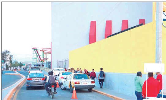
ALTERNATIVAS. En redes sociales y grupos de Whatsapp se ofrecen servicios de transporte privado de personas.

► Usuarios prefieren ocupar vehículos particulares que se ofertan en redes sociales para sus traslados que el transporte concesionado