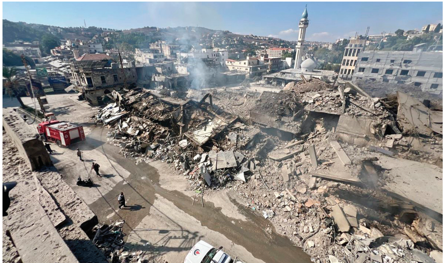
Los estragos de los bombardeos de Israel a una ciudad de Líbano.

Lejos de ser coherente en su discurso, Estados Unidos se contradice, ya ha indicado porque proporcionará un nuevo sistema de protección del espacio aéreo a Israel y al mismo tiempo se menciona el envío de tropas, lo que no significa otra