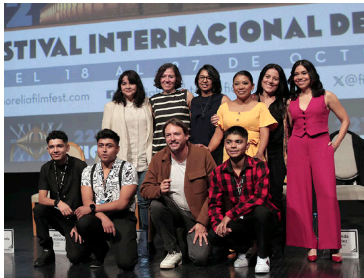
Imagen de la conferencia de prensa.

“La respuesta por supuesto que tiene que darla la sociedad y tendría que ser que si fuera posible para un chico que nace en una comunidad rural no está destinado a la violencia porque