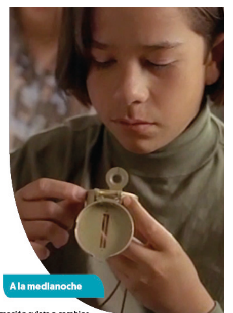
A la medianoche

SKY 1122 · IZZI 22 · DISH 122 · STARTV 122 · TOTAL PLAY 22 · MEGACABLE 122