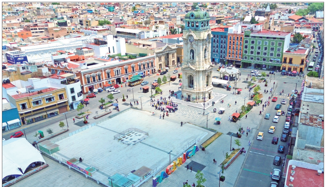
PROMESA. Diputados federales hidalguenses de Morena confiaron en al menos 70 mil millones de pesos para Hidalgo, poco más de dos mil millones de pesos más que el 2024.

Hasta ahora, el Poder Ejecutivo erogó más de 18 millones de pesos para estudios correspondientes a la remodelación que realizarán en