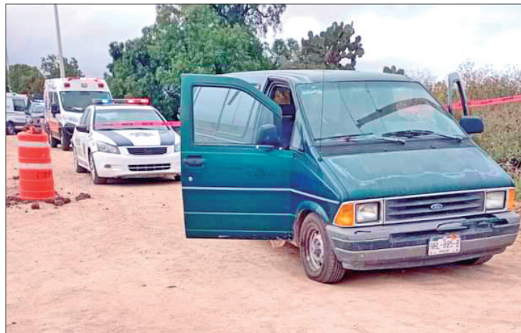
ACCIONES. Para dar con los responsables se desplegó un operativo de seguridad y las investigatorias quedaron a cargo de la PGJEH.

El incidente se registró en la calle Ciprés de la colonia Los Jorges, por lo que se implementó un