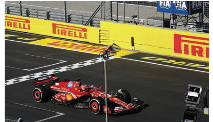
Se imponen los Ferrari en el Gran Premio de Estados Unidos.

El monegasco Charles Leclerc (Ferrari) se alzó este domingo con la victoria en el Gran Premio de Estados Unidos, por delante de su compañero, el español Carlos Sainz, al aprovecharse de la lucha entre Max Verstappen (Red Bull) y Lando Norris (McLaren), que terminó con una penalización de cinco segundos al británico que dio al neerlandés una tercera plaza que prácticamente remata el Mundial. Sainz firmó un gran segundo puesto pese a verse afectado por la pugna de la primera vuelta entre Norris y Verstappen, mientras que el mexicano Sergio Pérez (Red Bull) remontó hasta la séptima posición.