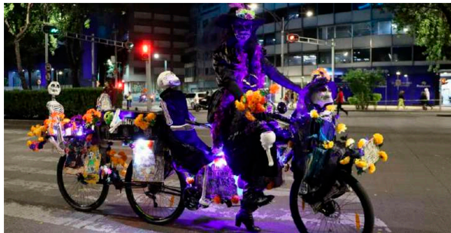
La rodada culminará en el Monumento a la Revolución, donde habrá concurso de disfraces.

Para fomentar la inclusión de personas que no están familiarizadas con el uso de la bicicleta, se instalará una Biciescuela en la Glorieta de “La Diana