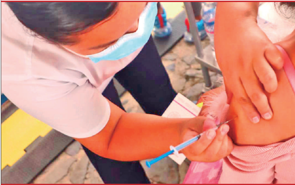
MOTIVOS. Actualmente, circulan virus y las infecciones respiratorias son de mayor contagio entre la población, de ahí la importancia de aplicar acciones sanitarias y vacunarse.

Respecto a covid llegarán 84 mil 170 dosis para refuerzos en población de 60 y más, personal de salud, mujeres embarazadas y población con factor de riesgo a partir de los 18 años de edad