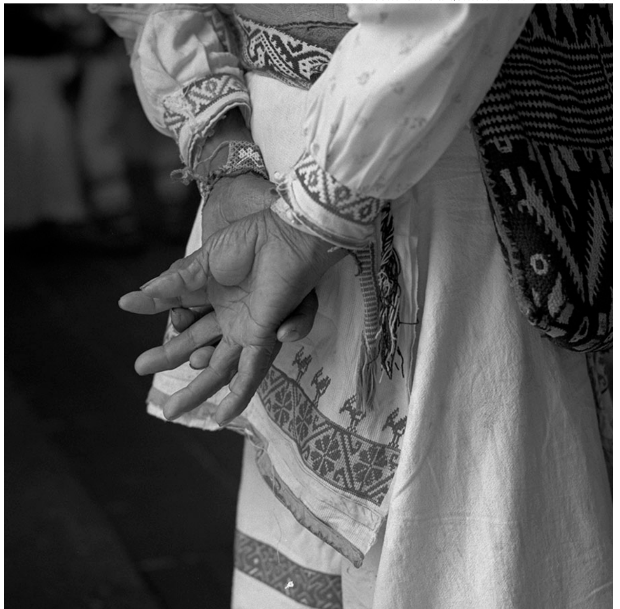
Imagen de la portada del libro.