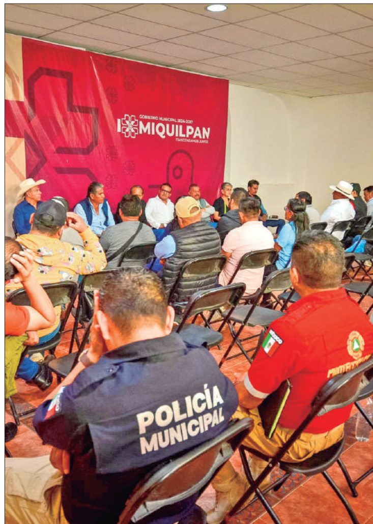
PROBLEMA. La creciente inseguridad espanta a los paseantes.

Por último, dijo que otro de los problemas que enfrenta está relacionada con la falta de capacitaciones, por lo que piden la coordinación y vinculación para lograr certificaciones y distintivos que les ayuden a dar un mejor servicio a la ciudadanía a fin de que se conviertan en empresas más competitivas.