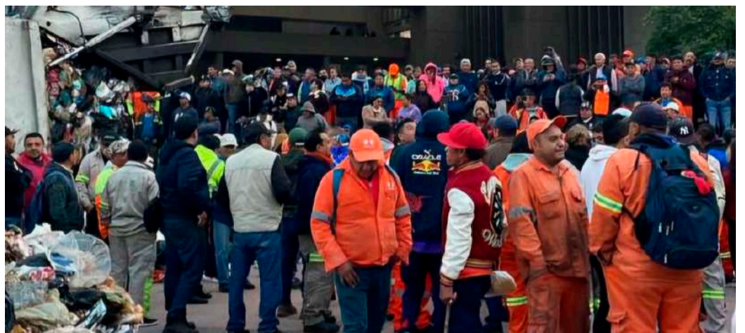
El tiradero de desechos provocó el cierre de la calle Buenavista.

De inmediato, personal del área de Gobierno atendió sus solicitudes y la basura fue retirada.