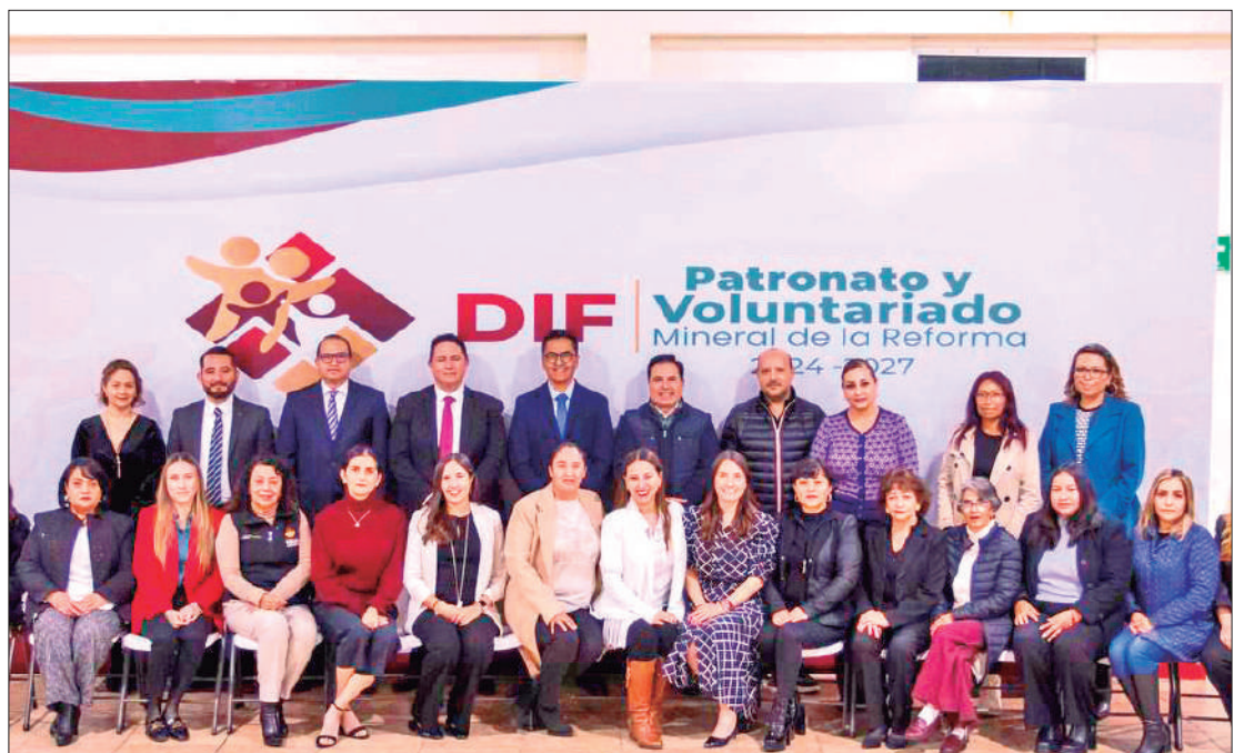
MENSAJE. Existe confianza en cada uno de los perfiles que se sumará a este esfuerzo del organismo asistencial municipal.

Dijo que existe confianza en cada uno de los perfiles que se sumarán a este esfuerzo del organismo asistencial municipal, en el entendido que una buena parte del sector poblacional del municipio atraviesa por carencias, las cuales deben de ser contribuidas a subsanar por parte de personas como las que ya son parte del esfuerzo del voluntariado.