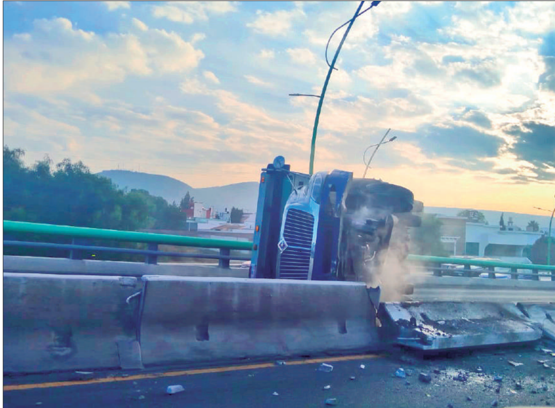
OPERADOR. El vehículo pesado volcó en pleno ascenso al puente, aparentemente tras una mala maniobra que provocó el accidente.

Seguridad Pública, Tránsito y Vialidad de Pachuca, cerraron la circulación en esta importan-