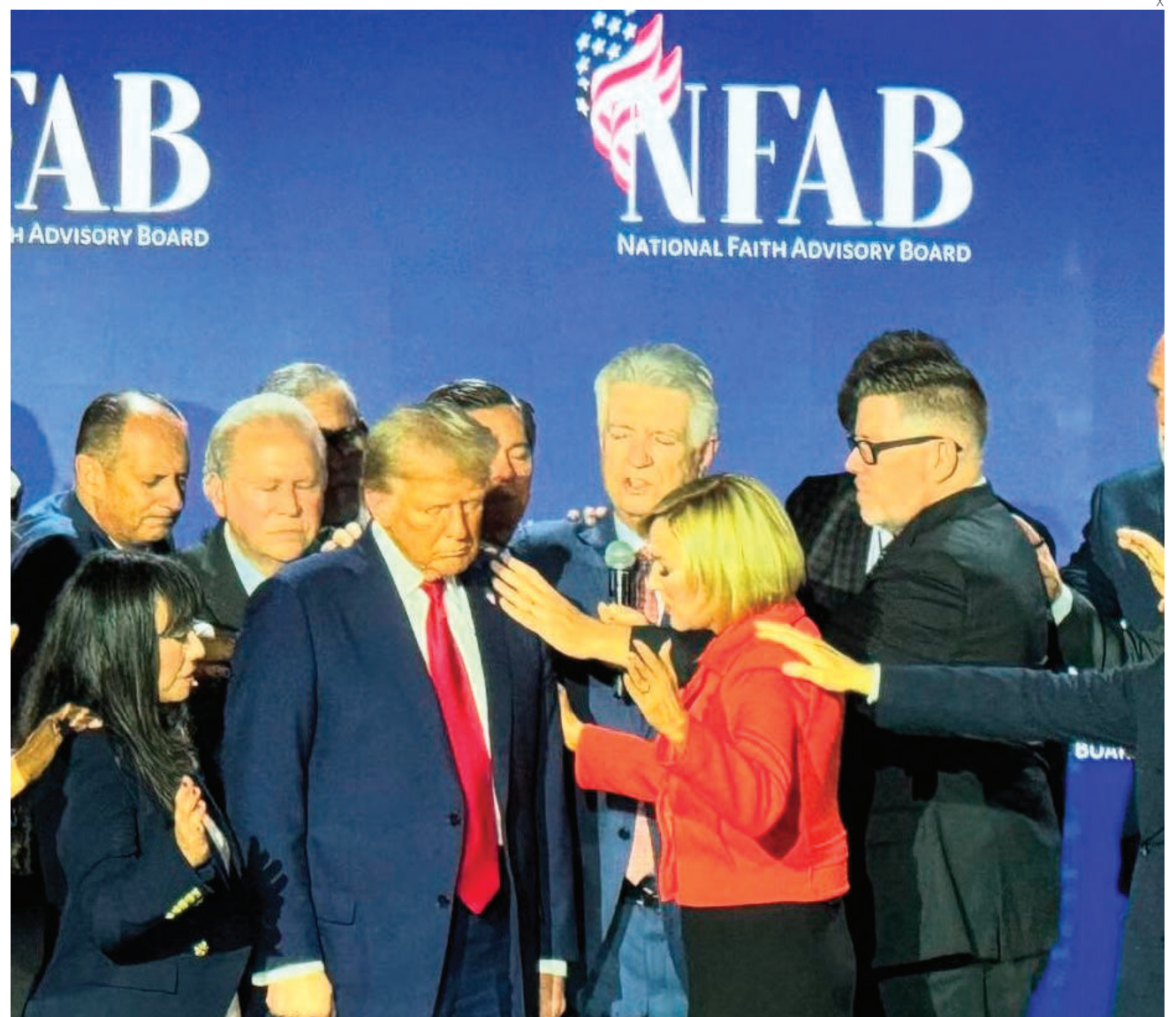
Trump, bendecido por pastores evangélicos en una oración colectiva en Georgia, otro estado clave.