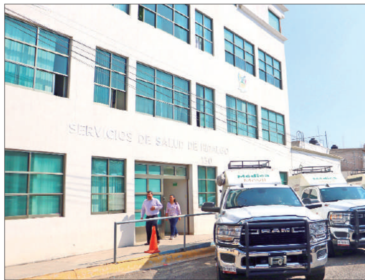
REPARTO. La Secretaría de Hacienda del gobierno estatal recibirá 18 millones 419 mil 553.58 pesos para la ejecución de programas.

En el caso de los gastos administrativos correspondientes a la operación del Servicio Nacional de Salud Pública (SNSP), correlacionados con la suscripción del "Conaser", que ascienden a 2 millones 080 mil 237.73 pesos, lo ejercerá la Dirección General de Promoción de la