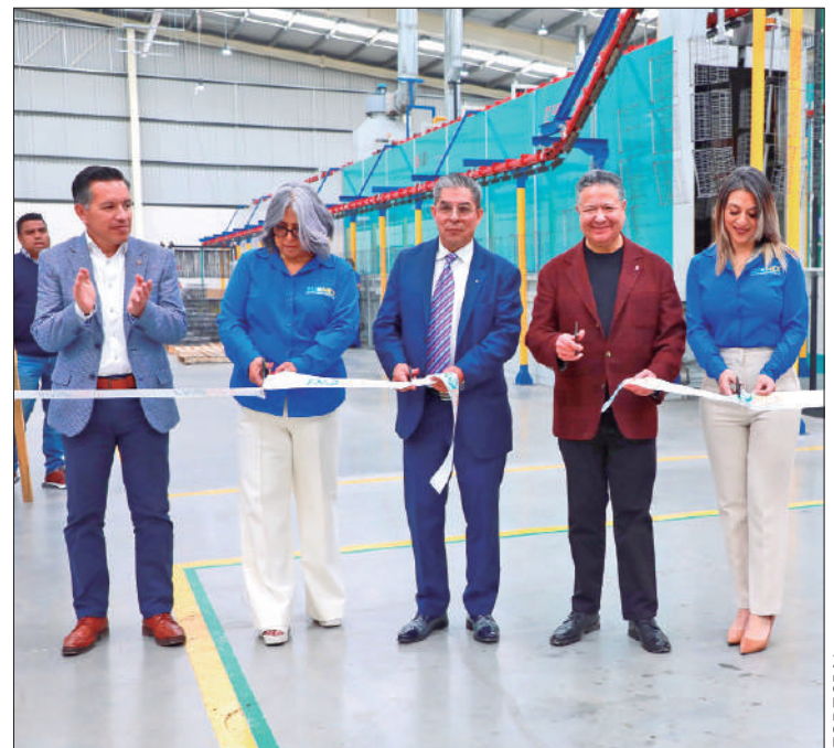
CAMINOS. Estamos muy contentos y contentos de poder visitar estas instalaciones, pues tenemos la seguridad de que la cercanía con el Aeropuerto Internacional Felipe Ángeles y el anuncio del tren México-Pachuca tendrán un impacto muy positivo en el desempeño de todas las empresas que se encuentran instaladas en Platah.