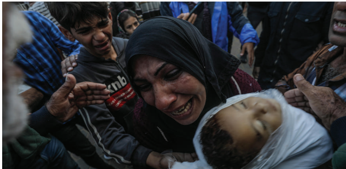
Una mujer palestina llora mientras carga a su bebé muerto tras un ataque israelí este martes en Deir Al Balah, en Gaza.

“UNICEF tampoco podría trabajar” en el asediado territorio palestino si UNRWA deja de tener permiso para hacerlo, aseguró en rueda de prensa el portavoz James Elder, quien recordó que las cifras más conservadoras hablan de unos 14 mil niños y niñas asesinados en el año de conflicto en Gaza.