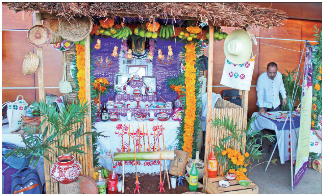
ACCIONES. La Secretaría de Cultura pretende atraer el interés de la sociedad hacia las festividades de Fieles Difuntos desde un punto de vista cultural.

La Secretaría de Cultura pretende atraer el interés de la sociedad hacia las festividades de Fieles Difuntos desde un punto de vista cultural, por lo que espera una amplia participación de los pachuqueños durante el desfile y las presentaciones artísticas, musicales, cinematográficas