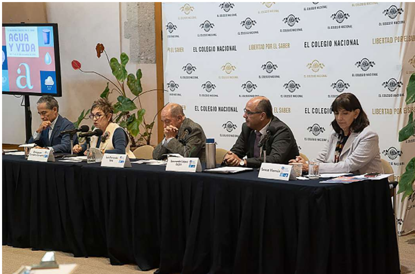
La conferencia de prensa para presentar el programa del Encuentro Libertad por el Saber.

Del 4 al 10 de noviembre, el Colnal ofrecerá conferencias, exposiciones... sobre la relación agua-hombre