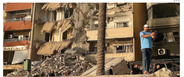
Un hombre se hace un selfi junto a un edificio destruido por un ataque israelí en la ciudad de Tiro, sur de Líbano.

El medio informó además este martes de que el primer ministro israelí, Benjamín Netan-