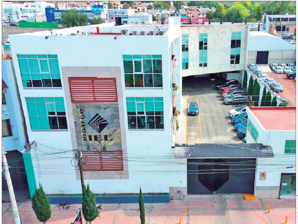
AGENDA. Será el 11 de noviembre cuando el Consejo General del IEEH sesione para aprobar las solicitudes de inscripción, pues las campañas inician el día 12 y concluyen el 27 del mencionado mes.

Agregó que prevalecen otras etapas como establecer al tercero que realizará el Programa de Resultados Electorales Preliminares (PREP), así como los diseños de boletas que incluyen los nombres de candidatos.