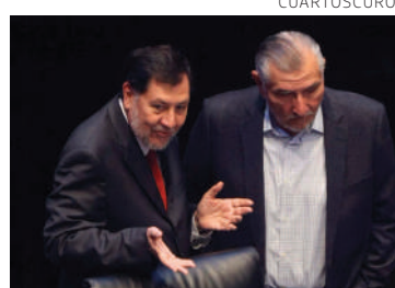
Gerardo Fernández Noroña, presidente de la mesa directiva en el Senado, y Adán Augusto, coordinador de la JUCOPO.

resolución sobre la Reforma Judicial que presentó el ministro Luis González Alcántara Carrancá desconoce la elección de juzgadores, la mayoría en el Senado puede reconsiderar el aceptar las