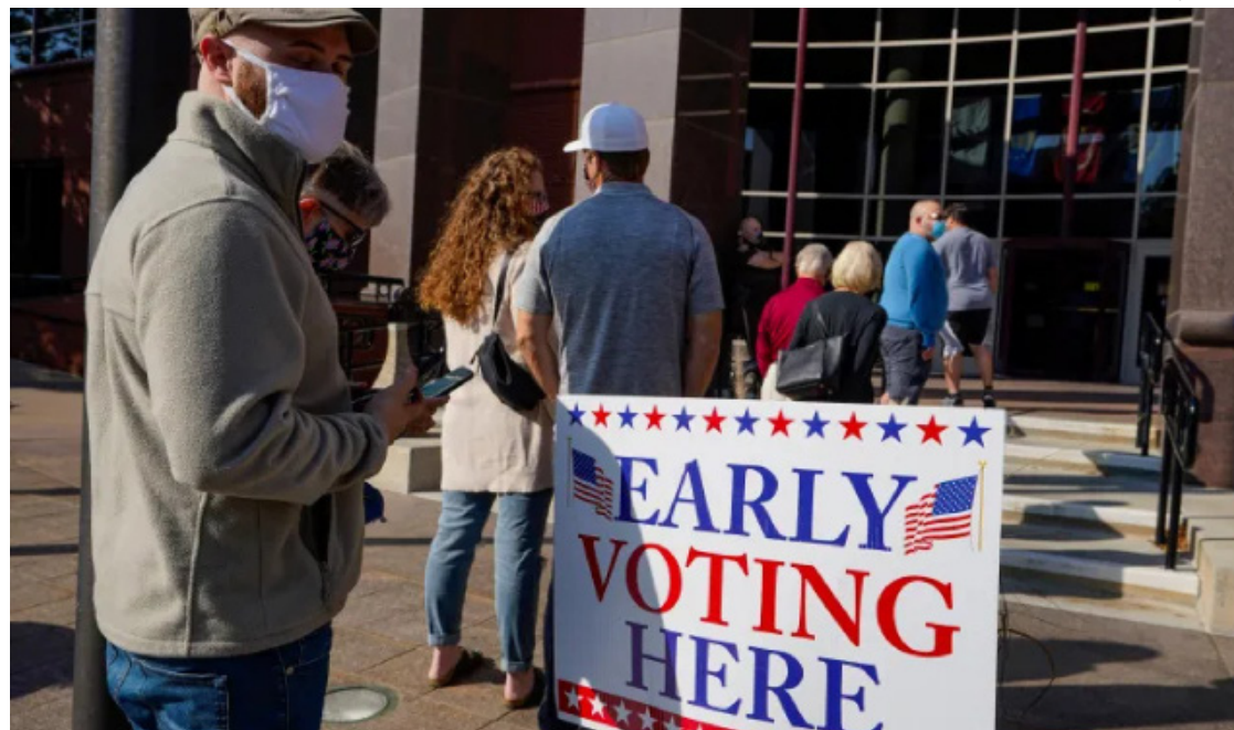
Los votantes en EU este 2024 han ejercido su voto en cifras récord antes de la fecha oficial. El registro actual representa el 43% de la participación total de 2020.

La participación femenina, favorable en principio a Kamala Harris, ha sido alta en comparación con los republicanos, quienes se muestran más movilizados que en las elecciones