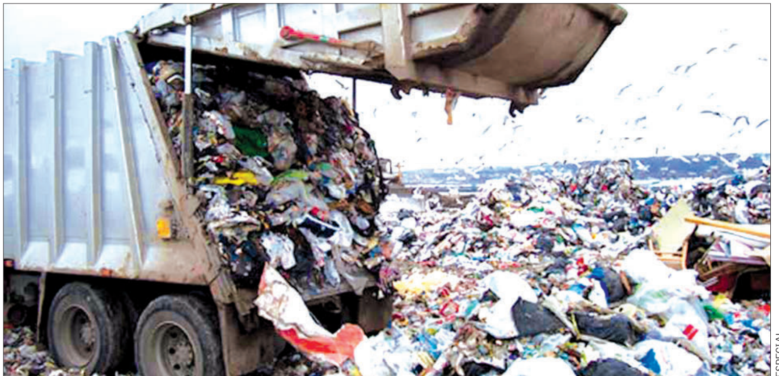
OPINIÓN. Se requiere encontrar una alternativa metropolitana que satisfaga las necesidades de al menos una decena de municipios.

Recordaron que municipios como Pachuca, Mineral de la Reforma y Singuilucan ya han propuesto algunos espacios en los que tentativamente se establecerían sus rellenos sanitarios.