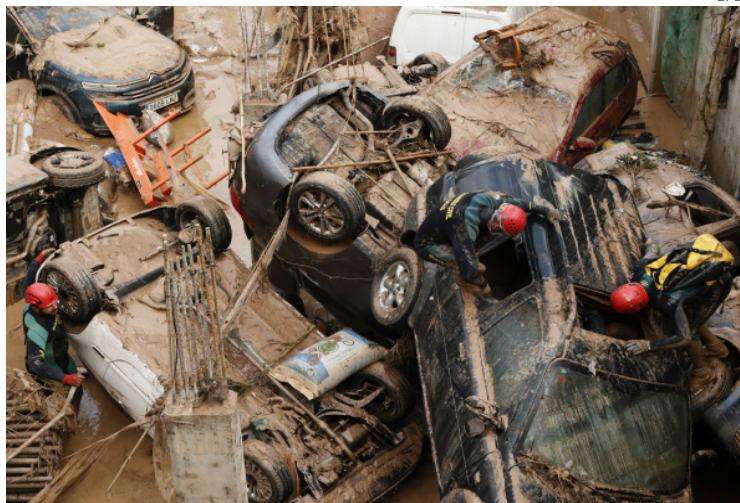
Expertos de la Guardia Civil buscan cuerpos sin vida entre los vehículos.

Moviliza 5,000 militares y 10,000 policías más ante el desastre provocado por las inundaciones