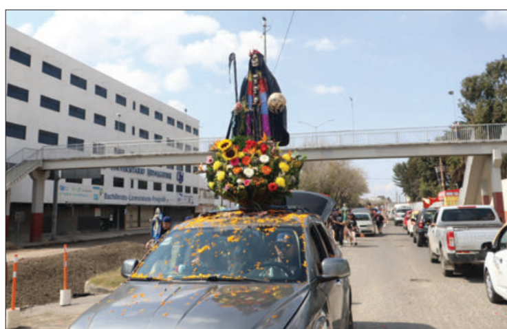
FOTORREPORTAJE ALDO FALCÓN