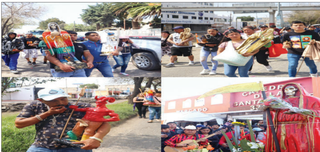
Este sábado, se llevó a cabo el ya tradicional desfile en honor a la Santa Muerte, en Pachuca, el cual partió del Mercado Sonorita, ubicado en la colonia Nuevo Hidalgo para dirigirse al centro de la capital de la entidad.

Los precios de las habitaciones van desde los 400 y hasta mil 200 pesos, dependiendo de los servicios que se proporcionan como son clima, telefonía, internet, alberca, restaurante y otras necesidades. 3