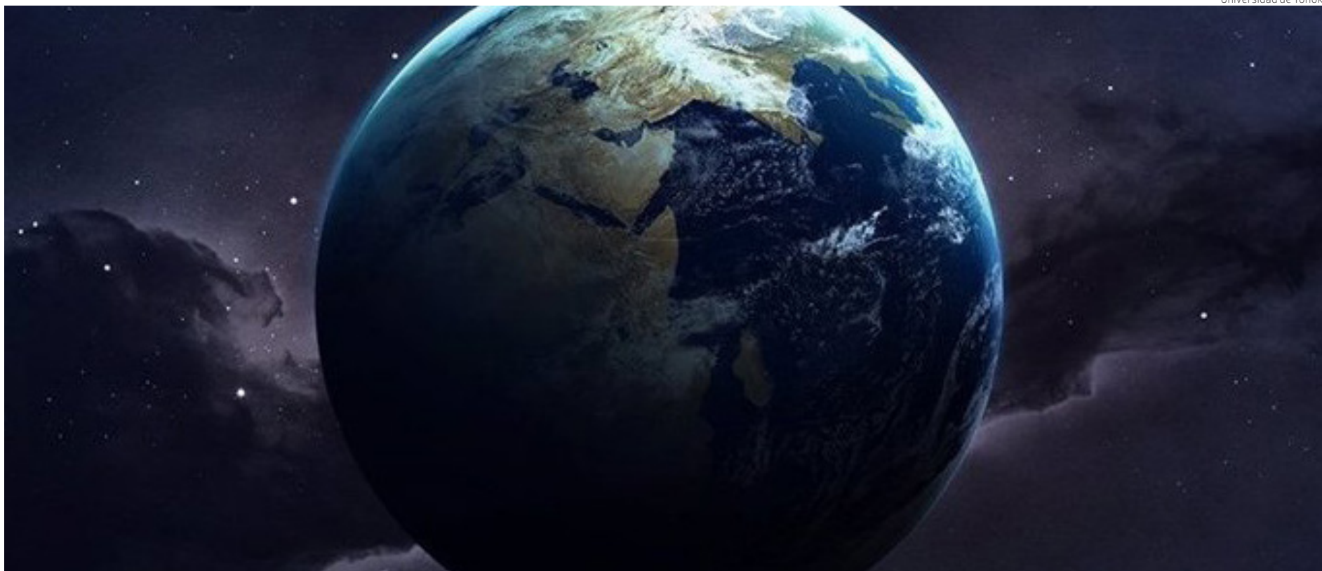
Una representación de la Tierra.