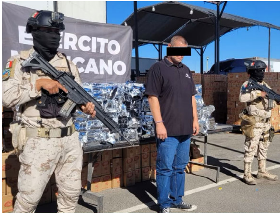
Fueron revisados 453 paquetes llenos, cada uno, con un kilogramo de un polvo blanco.

droga fue interceptada en el Puesto Militar de Seguridad Estratégico de Cucah el pasado 31 de octubre.