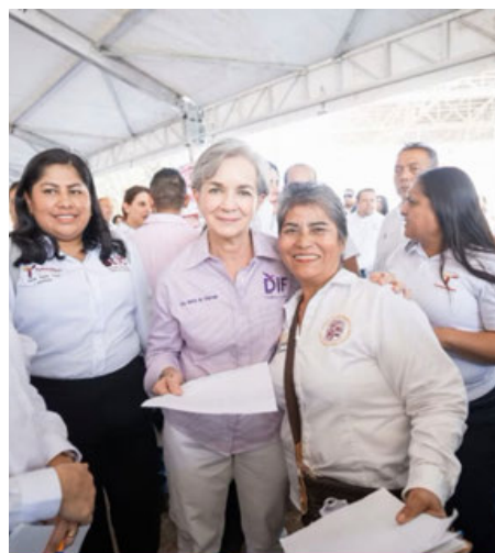
Atendió de manera personal a familias que se acercaron para exponer sus inquietudes.

mujer, consulta dental, huertos, Registro Civil, Oficina Fiscal, lazos de esperanza, ITABEC, el Instituto del Deporte, entre muchos más. ●