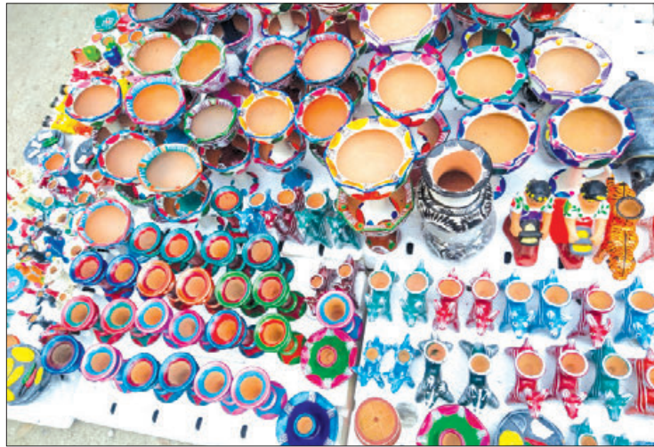
APERTURA. Las fechas significativas que están por llegar resulten igual de provechosas para ellos y se mostraron en total disposición de participar en las actividades que les sean convocadas.

Señaló que la mayoría de los pueblos mágicos de Hidalgo se ha abierto la posibilidad de participación y como consecuencia ha incrementado la oportunidad para decenas de trabajadores que dependen de esta nue-