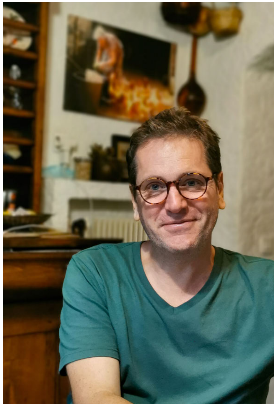
El escritor francés Patrick Autréaux.

“Zak tiene partes invisibles, es un personaje incompleto y eso se debe a que parte de su imaginación sexual no la comparte con el narrador. Siempre deja la impresión que está en una relación con cierta censura, con un puritanismo internalizado que le impide ir más allá en el conocimiento de sí mismo”, detalla el escritor.