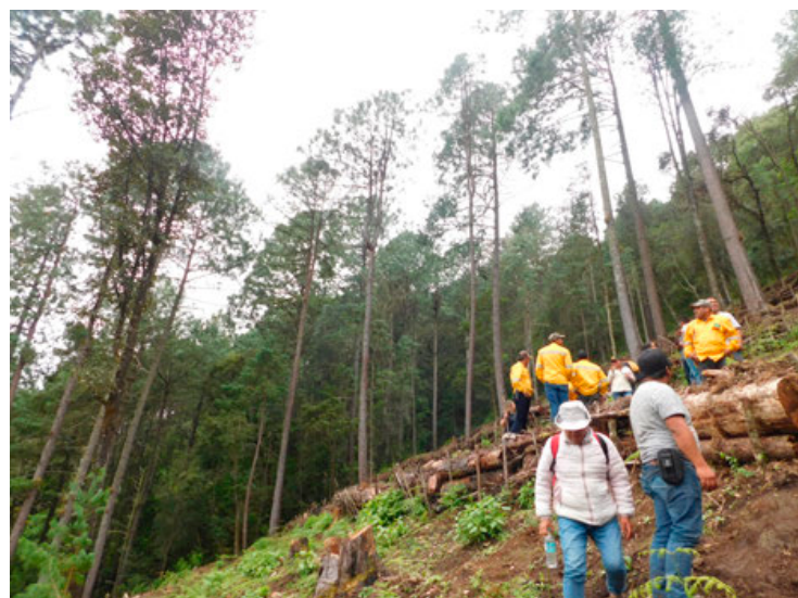
En cada comunidad de la organización ICICO, los pobladores forman brigadas de sus habitantes para conservar y restaurar el bosque.

Cuando realizaba su tesis de Doctorado, poco después del año 2003, la Doctora Shapiro llegó a México para conocer cómo trabajaban las comunidades con los programas de Pago por servicios ambientales, que acababa de poner en marcha el gobierno mexicano,