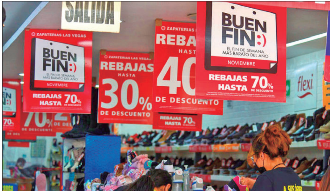
OPORTUNIDADES. Quienes se sumarán a la estrategia con algún tipo de descuento iniciaron esta misma semana con sus ofertas.

Señalaron que de manera general, la etapa de ofertas será del 15 al 20 del presente mes, pero indicaron que en común acuerdo, quienes se sumarán a la estrategia con algún tipo de descuento iniciaron esta misma semana con sus ofertas y la mantendrán una semana después apenas haya concluido la fecha establecida para garantizar una mejor derrama económica.