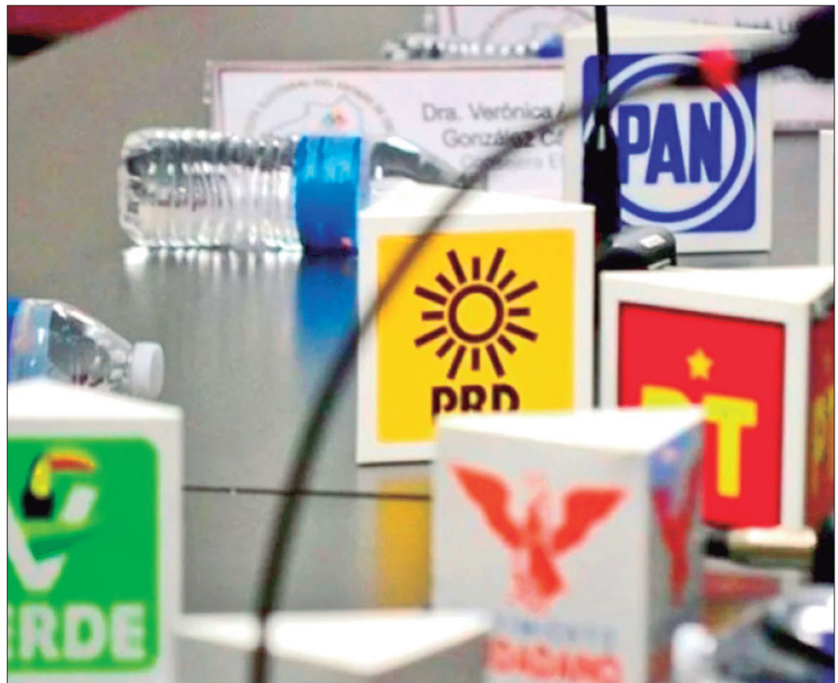
EQUILIBRIOS. La Secretaría de Gobierno sostuvo reuniones con presidentes estatales de partidos políticos para conocer los avances y pormenores del calendario electoral de cara a los comicios en Cuauhtepic de Hinojosa, principalmente con los compromisos de llevar campañas en armonía, tranquilidad y con respeto, lo cual conlleve a una alta participación ciudadana.