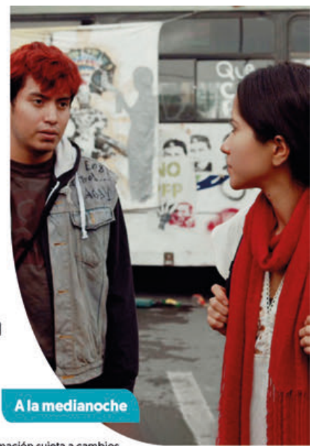
A la medianoche