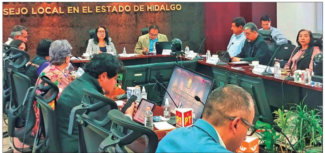
SEGURIDAD. Nos han estado acompañando en recorridos de ubicación de casillas, en visitas a las propias casillas por parte del consejo distrital y del Consejo Local respectivo, y ahorita con el operativo en campo que es justamente para la integración de las mesas directivas de casillas también se está contando con ese apoyo.

De igual manera, recordó que prevalecen las mesas de seguridad con las autoridades estatales para refrendar el compromiso de acompañar en las visitas de verificación de mesas directivas de casillas, en los recorridos que realiza el personal, así como el día de la jornada comicial con vigilancia permanente hasta la entrega de paquetes.