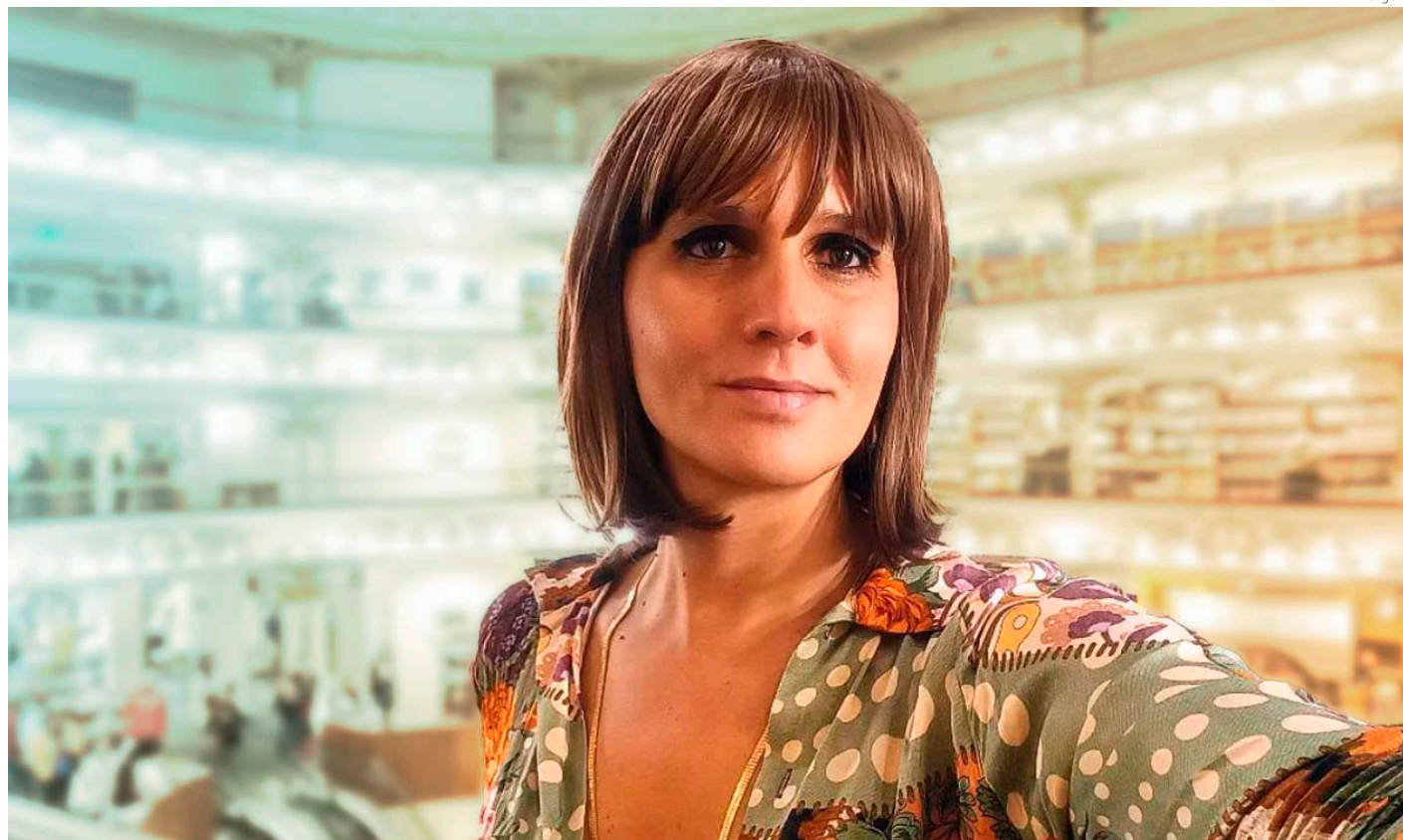
La escritora chilena Ariel Florencia Richards.

Son dos mujeres solas enfrentándose a sí mismas. Hay una red vertical entre