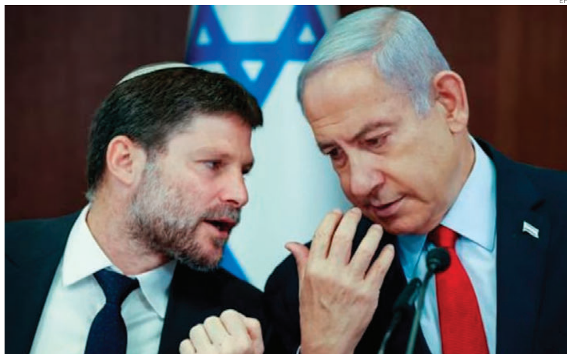
El primer ministro israelí, Benjamin Netanyahu, junto a su ministro de Finanzas, el ultra Bezael Smotrich.

“Hoy existe un amplio consenso en la coalición (de Gobierno) y en la oposición contra el establecimiento de un Estado palestino que pondría en peligro la existencia del Estado de Israel”,