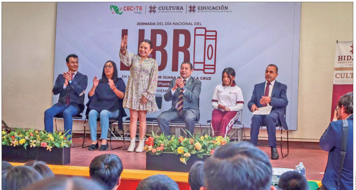
AGENDA. Para hoy martes 12 de noviembre se realizará una jornada especial dirigida al personal de la Red Estatal de Bibliotecas y a mediadores de lectura.

El evento culminará con una mesa de diálogo enfocada en analizar y valorar la voz creativa de esta figura emblemática de la literatura novohispana.