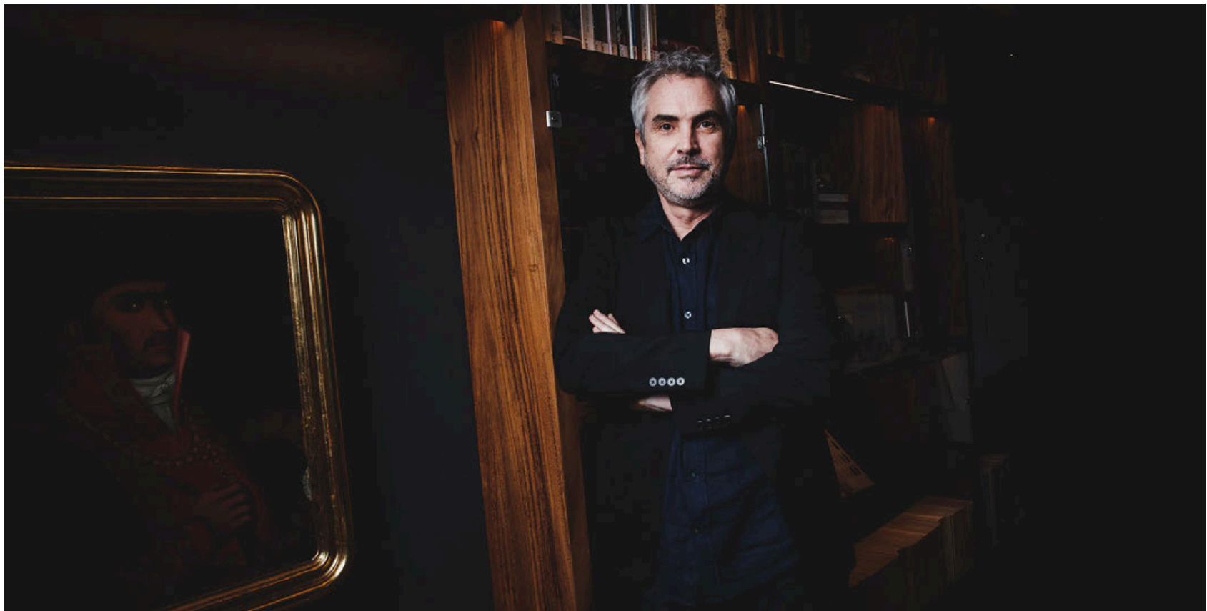
El cineasta Alfonso Cuarón cierra este domingo la temporada de su serie Disclaimer .

El cineasta mexicano habló con Crónica Escenario sobre su más reciente serie, Disclaimer , y la cinematografía nacional: “Espero que este sexenio las cosas mejoren”