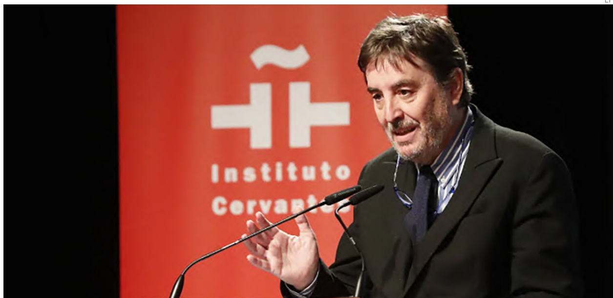
El director del Instituto Cervantes, Luis García Montero.

tal del mismo país y con una vinculación especial con la comunidad de La Rioja, donde se ubicará su sede institucional mientras que la operativa estará en el Cervantes de Alcalá de Henares (Madrid).