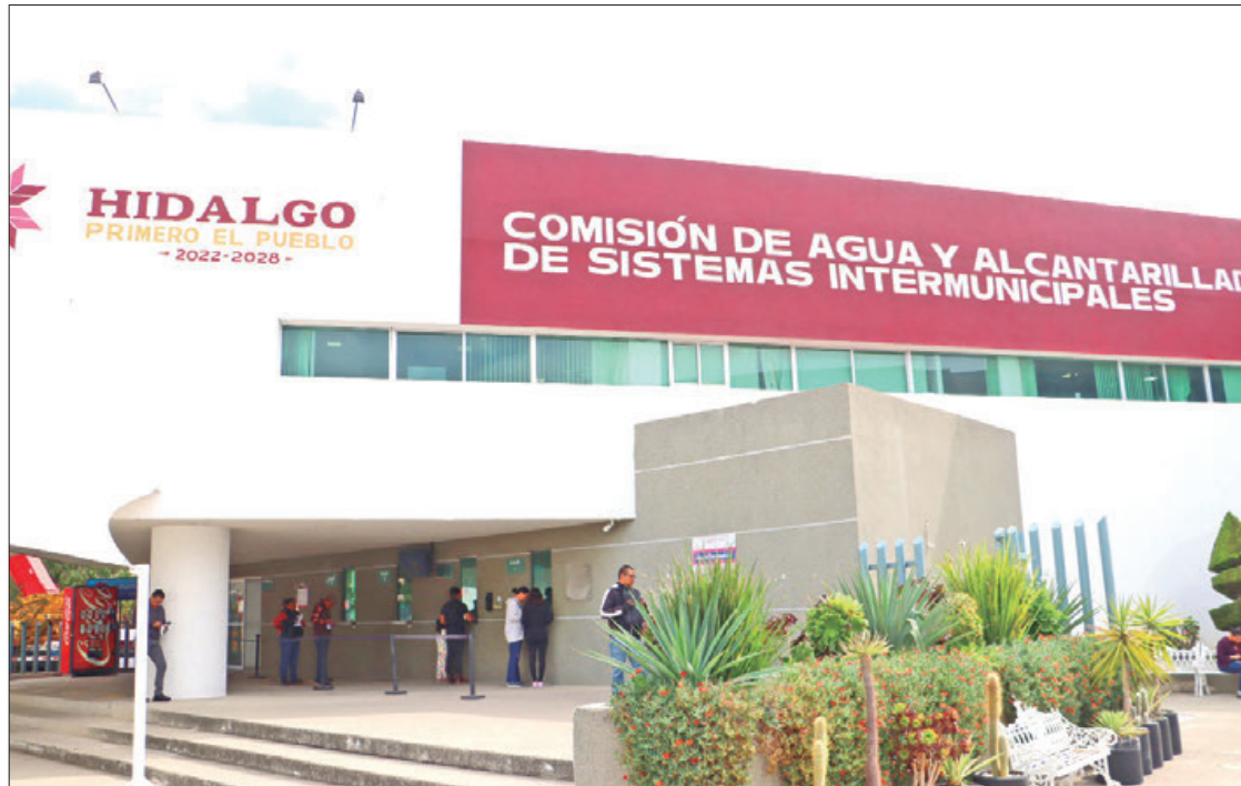
CASO. Se trata de observaciones por recursos del Fondo de Aportaciones para el Fortalecimiento de las Entidades Federativas.

Se entregará una bitácora detallada por cada partida presupuestal para solventar todas las observaciones antes del plazo establecido, en la que se incluirán los tiempos de ejecución de las obras, las cantidades de materiales utilizados, los nombres y ubicación de las calles y colonias beneficiadas.