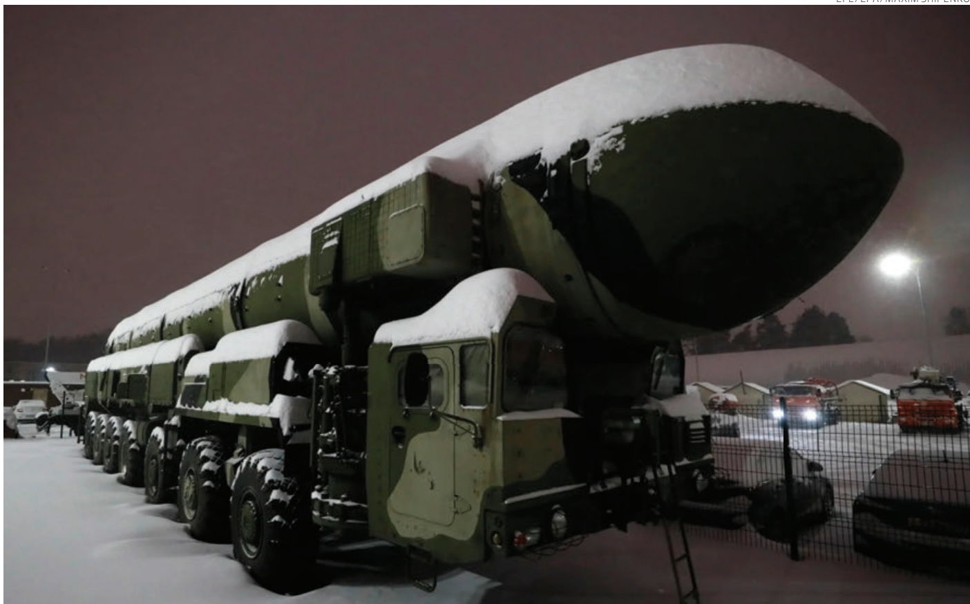
Foto archivo de misil balístico ruso.

El Oréshnik es la nueva arma que irrumpe en la guerra y luce como instrumento geopolítico de presión