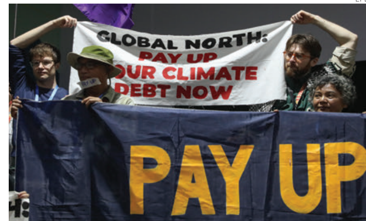
Activistas climáticos en la COP29 en Azerbaiyán.

“Dimos a todos los grupos la oportunidad de reaccionar al paquete de textos que publicamos ayer por la mañana y les agradecemos su compromiso constructivo”, declaró la presidencia de la COP29, animando a las partes a analizar los textos actualizados y trabajar hacia un consenso.