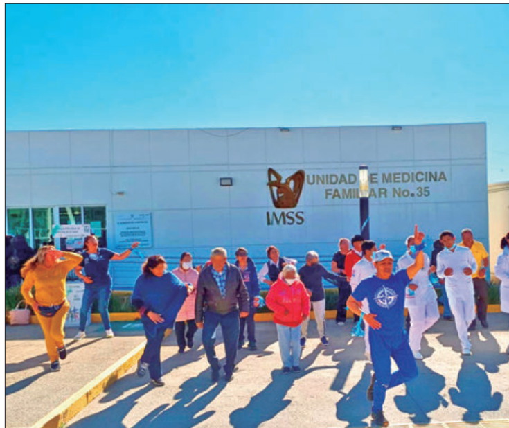
PERTINENCIA. Desarrolla Instituto Mexicano del Seguro Social acciones como parte del Mes de la Salud Integral del Hombre.

Entre las actividades, se incluyó una caminata con el objetivo promover la actividad física entre los participantes, una forma sencilla y efectiva de mantener un estilo de vida activo y mejorar la salud cardiovascular, además, se ofrecieron clases de yoga y zumba, actividades que buscan fomentar la movilidad, flexibilidad y el bienestar general.