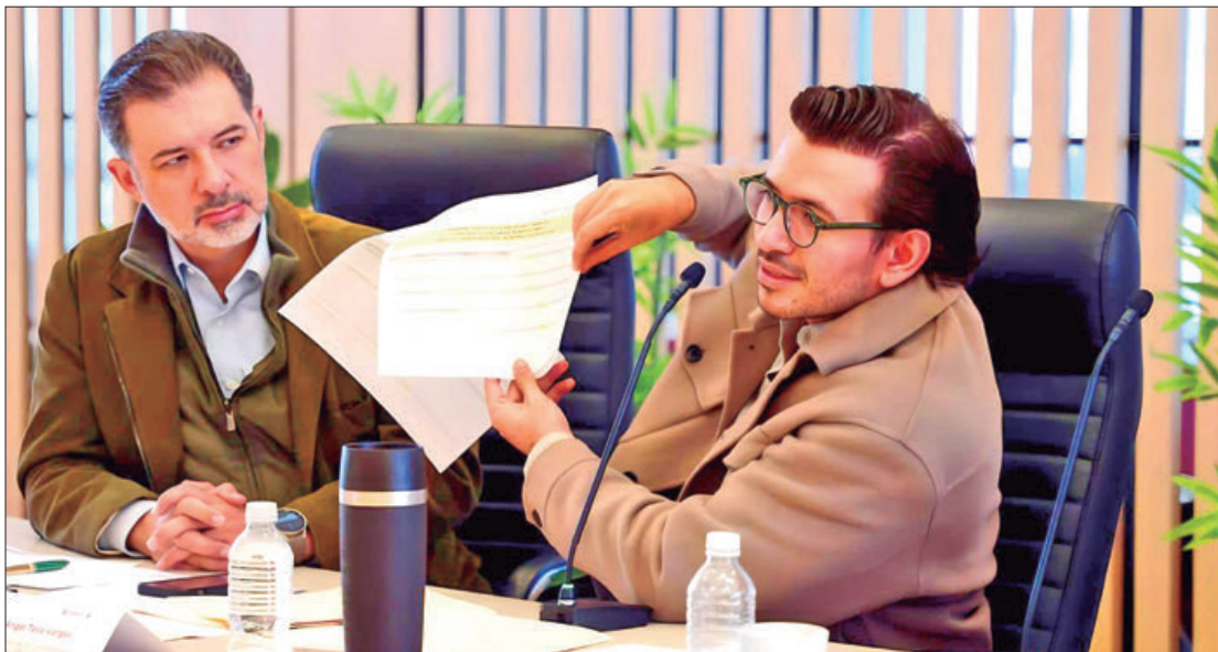
Refirió titular de la Unidad de Planeación que los beneficios son de la región de Tula de Allende hasta el Valle de Mezquital.

gratuitos, además de valorar los resultados de aplicabilidad de fondos federales... .3