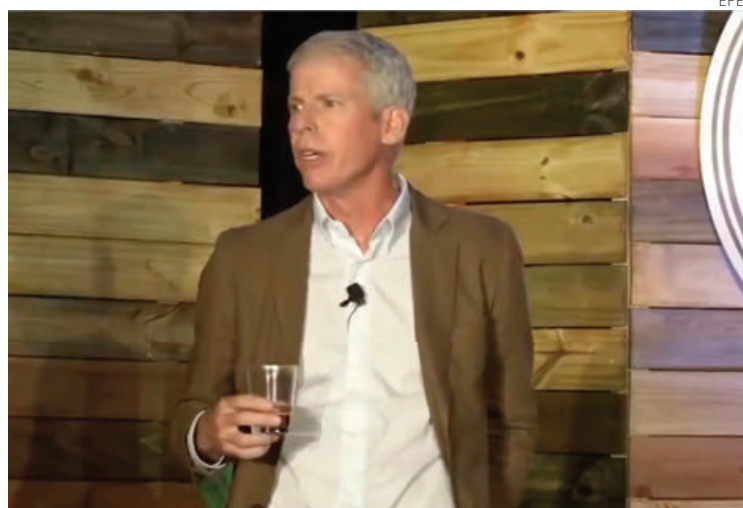
Wright fue director ejecutivo de una empresa de servicios petroleros.

Chris Wright trabajará con Trump, y asegura que el cambio climático es una amenaza “distante”