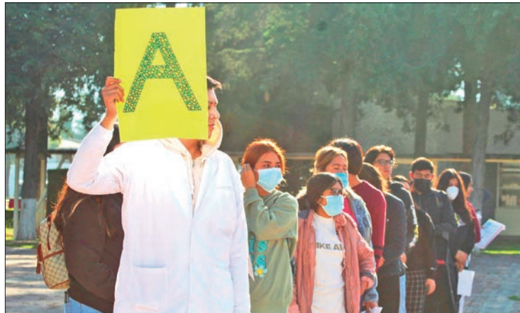
RUTAS. En caso de dudas o aclaraciones sobre los pormenores del proceso de ingreso, contactarse con la institución a través del sitio web, www.uaeh.edu.mx , o en el teléfono 7717172000, extensión 10703.

También sugirió escanear el código QR del pase de ingreso para conocer con anterioridad la sede de aplicación del examen; consumir algún alimento y descansar en la noche previa, lo que