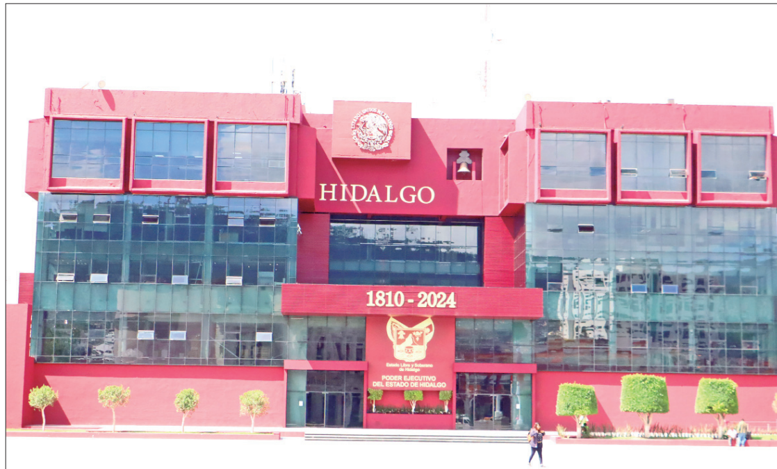
ESPECIFICACIÓN. La empresa contará con un sistema de asistencia a siniestros inmediata, que permita tener el seguimiento real de arribo de los ajustadores asignados para la atención.

Incluye automóviles, camiones de hasta 2.5 toneladas de pesos bruto y motocicletas, todos ellos de uso particular y que realicen el pago de refrendo 2025 y hasta agotar la existencia de los 320 mil seguros vehiculares de responsabilidad civil; el deducible de responsabilidad civil es de 66 unidades de medida actualizada (UMA) y suma asegurada de 150