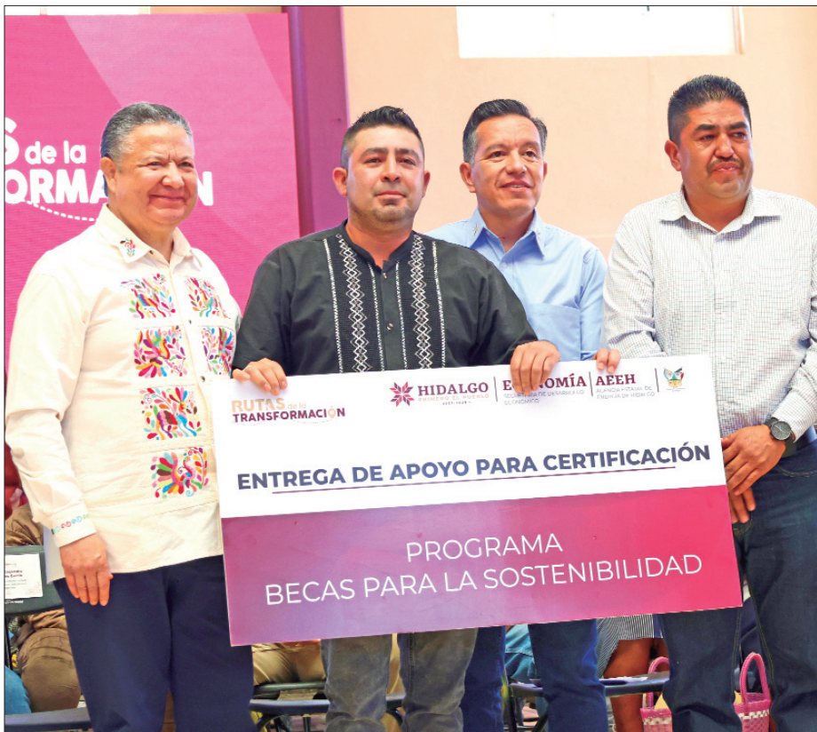
JULIO MENCHACA. Sigamos trabajando en la construcción de un Hidalgo donde todas y todos tengan acceso a las herramientas que les permitan alcanzar su máximo potencial.

■ Como parte de Rutas de la Transformación el gobernador resalta que recursos públicos llegan a donde más necesitan