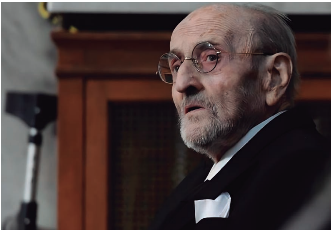
El escritor Álvaro Pombo y García de los Ríos.

Álvaro Pombo y García de los Ríos, nacido en Santander, 1939, es un poeta y novelista y también un ensayista tardío, ya que publicó su primer ensayo, una obra sobre la re-