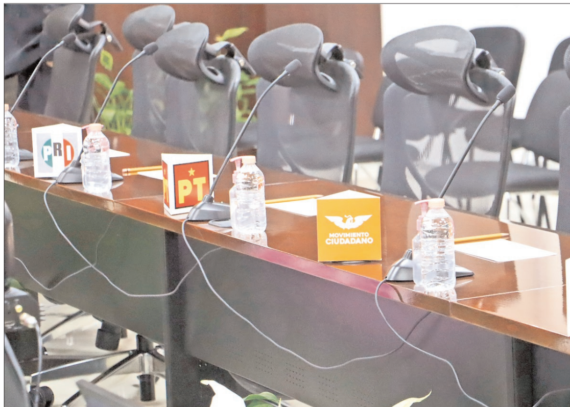
CLAVES. Recursos que tendrán que comprobar y reportar oportunamente ante el Instituto Nacional Electoral.

Para Acción Nacional (PAN) otorgarán 115 mil 935.36 pesos; a los candidatos del Revolucionario Institucional (PRI), 231 mil 573.52 pesos; a las planillas