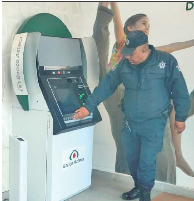
BUEN FIN. Informó que de manera general este programa es permanente en la capital del estado; sin embargo, para el presente fin de semana en que la actividad comercial incrementará por la actividad comercial, se fortalecerá.

La dependencia municipal convocó a quienes saldrán a los espacios comerciales de la ciudad, un incluyendo zonas comerciales tradicionales, centros y plazas comerciales, con motivo de el "Buen Fin" a tener total precaución al momento de acudir a los cajeros automáticos y cerciorar-