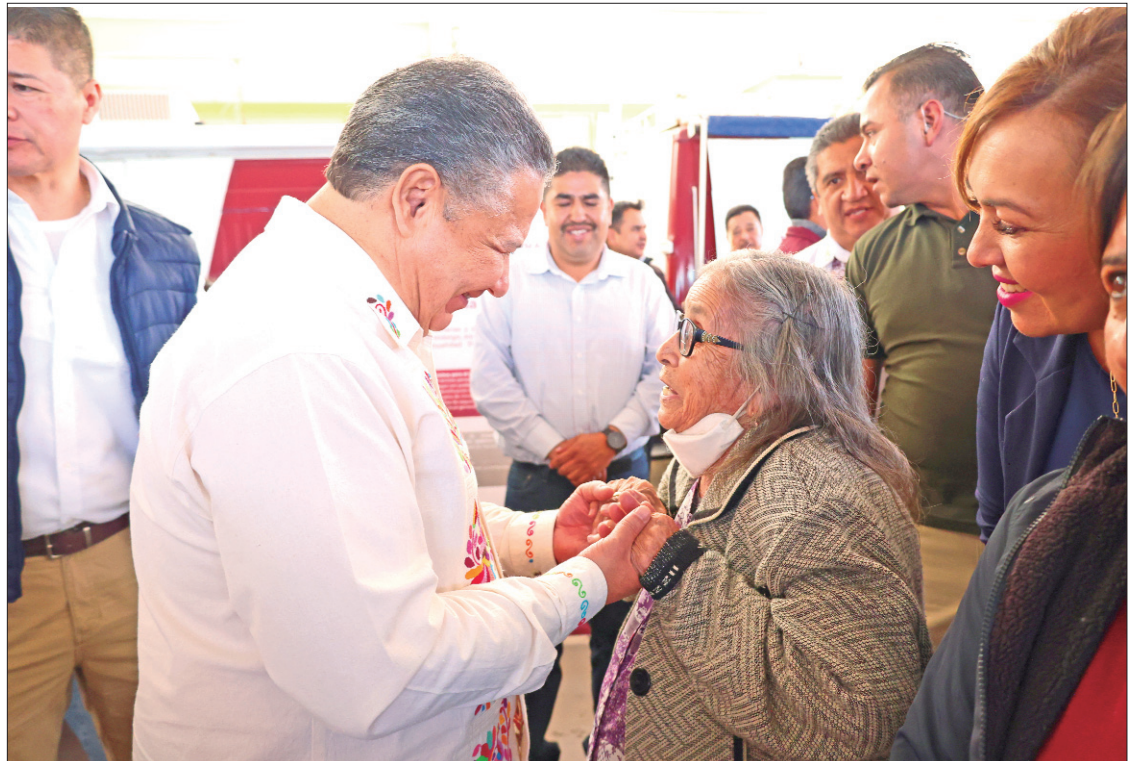
ZONAS. Fue en Agua Blanca y Metepec, donde el gobernador refrendó el compromiso de atención a las demandas más sentidas de la población.

Como parte final, se invitó a la población a mantenerse informada y a aprovechar este tipo de acciones, que cada semana están presentes en los diferentes municipios de la entidad, con el fin de mantener un gobierno abierto y cercano con la gente, compromiso permanente de la administración del gobernador, Julio Menchaca.