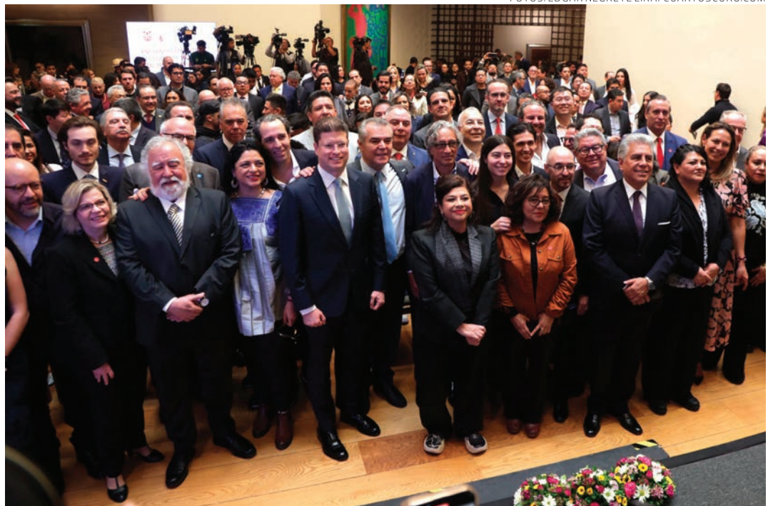
La jefa de Gobierno Clara Brugada asistió al Encuentro Empresarial Ciudad de México, Capital de la Transformación, en el Club de Industriales.