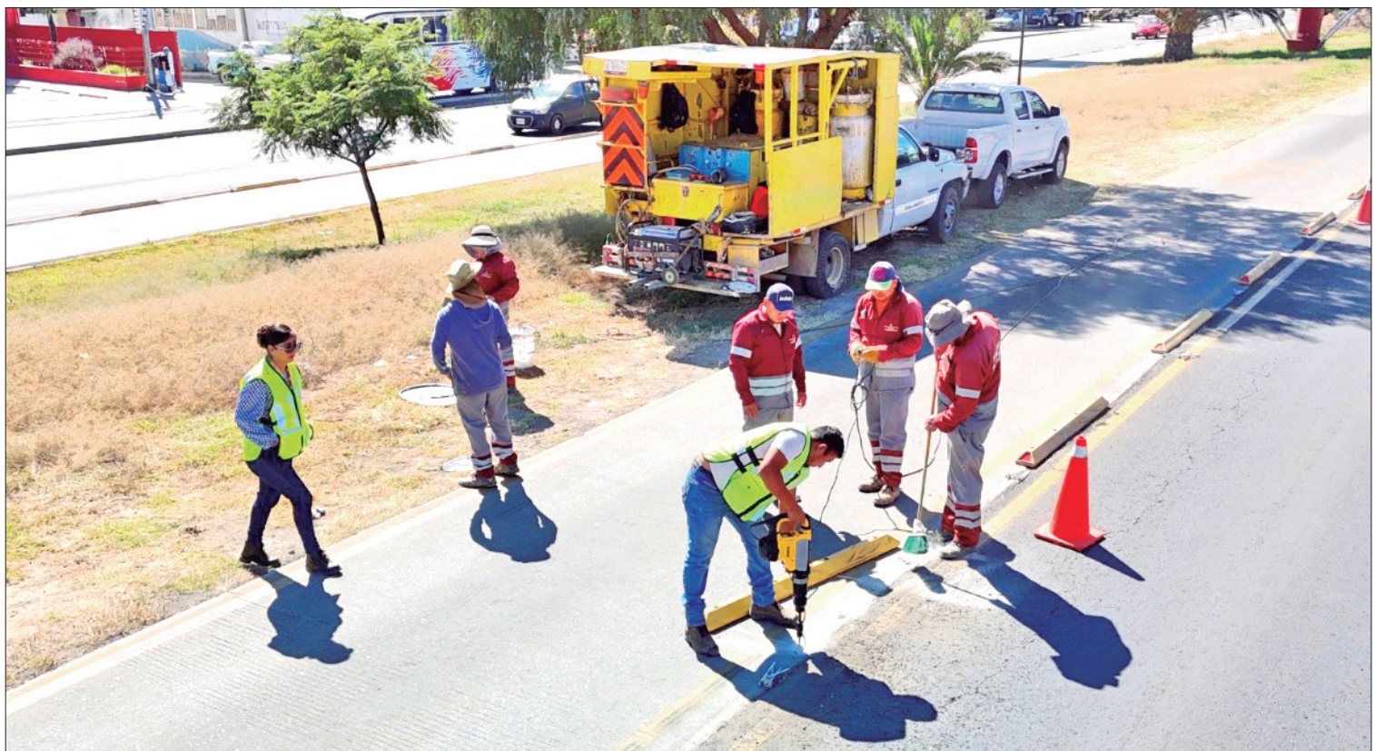
NORMALIDAD. Tras la conclusión de los trabajos de reencarpentamiento asfáltico en un tramo del sur de la ciudad de Pachuca.

Además, el tránsito de vehículos ajenos sobre los carriles reservados y preferenciales también tienen consecuencias, las cuales consisten en multas económicas de veinte hasta treinta veces la Unidad de Medida y Actualización (UMA), la cual equivale cada una a 96.22 pesos, según la sección VI de la Ley de Ingresos del Estado de Hidalgo.