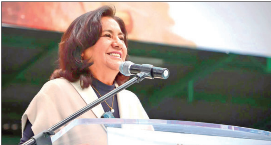
HECHOS. Con una inversión superior a 4 millones de pesos se beneficiaron a 280 personas de 38 municipios.