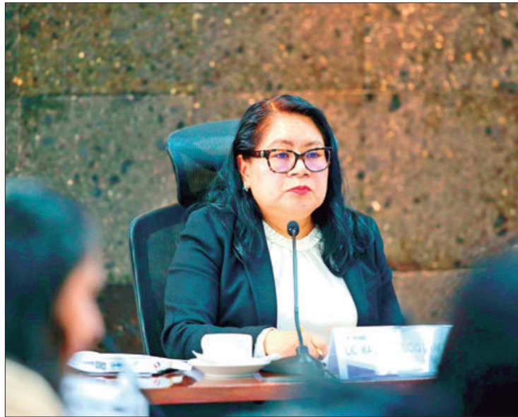
PARTICIPACIÓN. En la mesa de seguridad también concurrieron la Guardia Nacional y la Secretaría de la Defensa Nacional.

"En los recorridos, desde que el INE inició con los trabajos preparatorios de la jornada electoral, hemos contado con el apoyo y el acompañamiento de la Secretaría de Seguridad Pública del Estado, en recorridos de ubicación de ca-