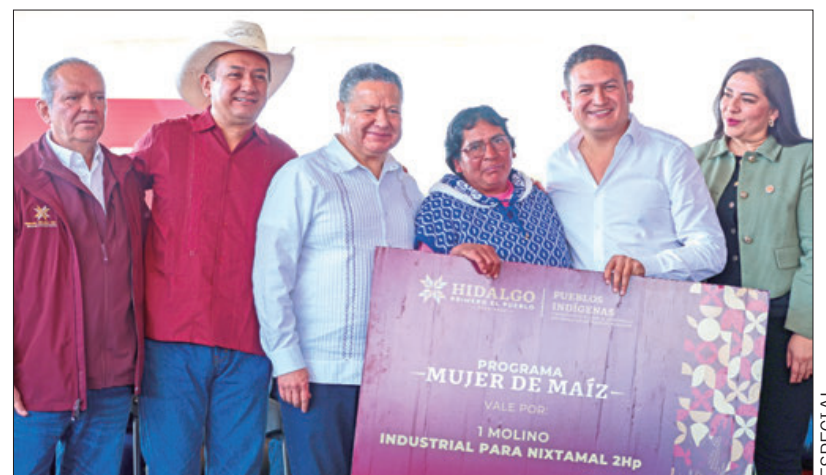
Julio Menchaca Salazar destacó la importancia de enfocar los recursos públicos en las necesidades más urgentes de la población.