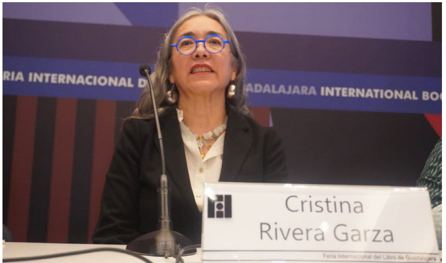
La escritora Cristina Rivera Garza.

“Yo me acuerdo haber leído novelas cuando era muy joven y casi todos los cuerpos de las mujeres eran descritos en los siguientes términos, todas invariable-