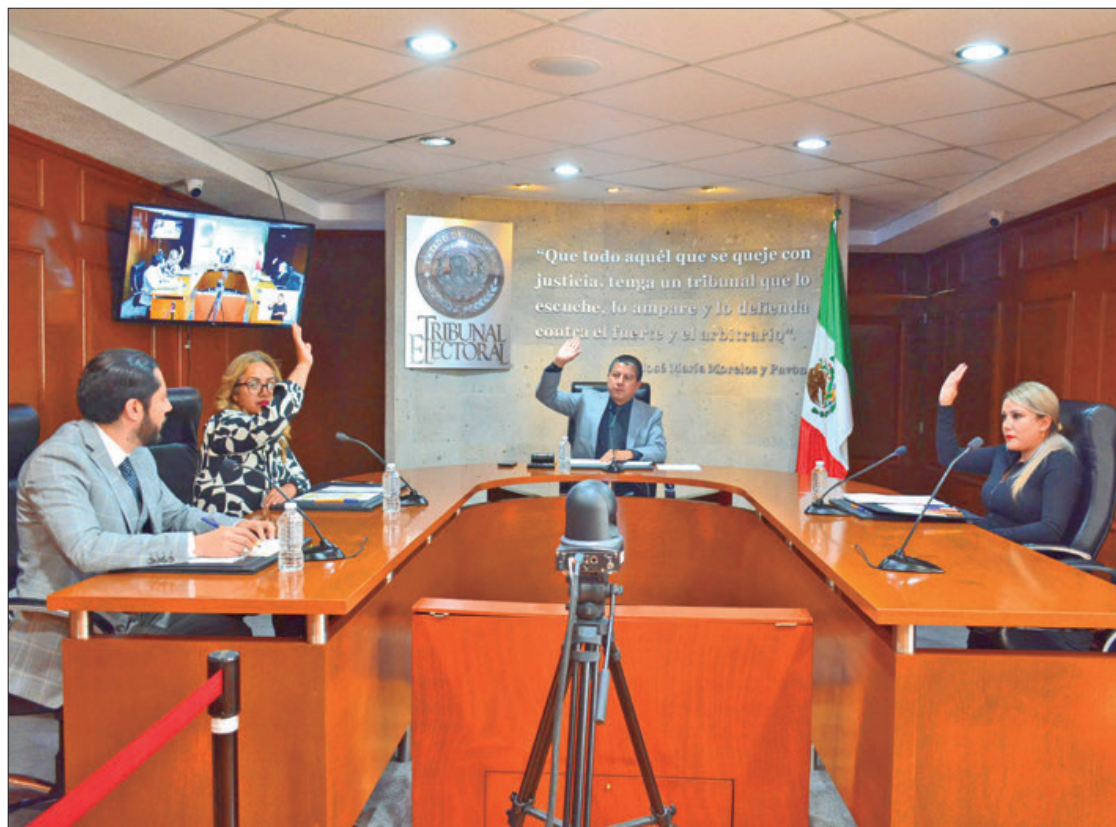
ANTECEDENTE. En la citada reunión pública designaron al titular del Órgano Interno de Control, sin apearse a lo establecido en la Ley Orgánica Municipal para el estado.