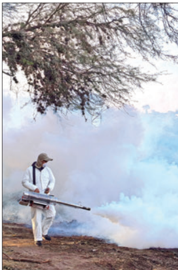
IMPLEMENTOS. Entre las acciones que se realizan se encuentra la aplicación de insecticida Pirimifos Metil al 49 % mediante la técnica de termonebulización.

De manera paralela, la población local ha contribuido activamente con tareas de limpieza, eliminación de criaderos y reportes de áreas afectadas, for-