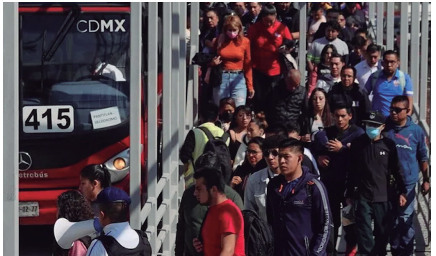
Esta innovación predice y calcula mediante IA, algoritmos matemáticos y modelos probabilísticos, la tasa de fallas en unidades, para anticipar autobuses de reserva.

Gracias al apoyo y a la apertura de Grupo CISA se logró conjugar esta colaboración con el fin de mejorar los tiempos