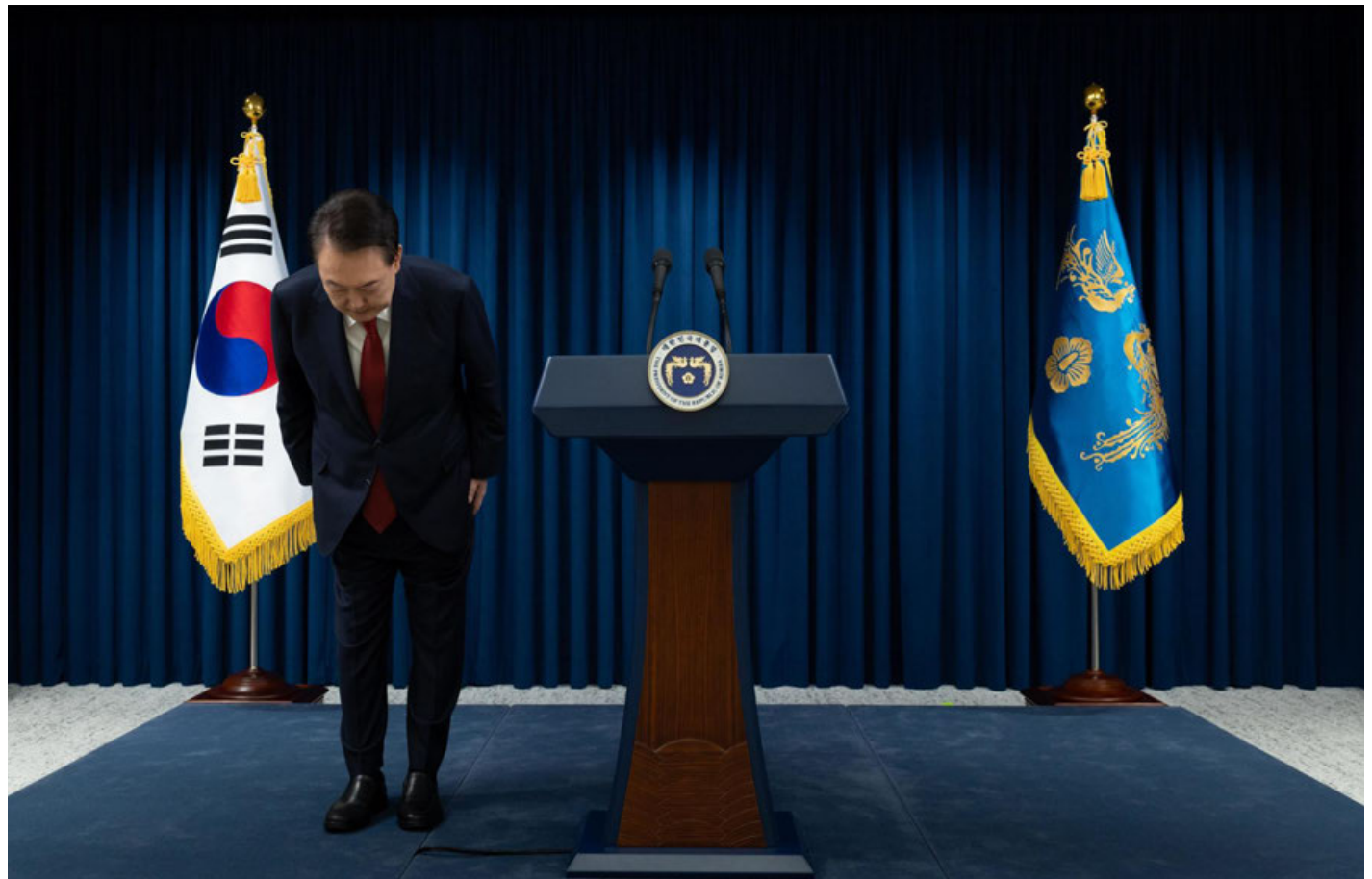
El presidente surcoreano, Yoon Suk-yeol, pidió este sábado disculpas al pueblo surcoreano por la ley marcial que conmocionó al país en la noche del pasado martes.

Yoon Suk-yeol es presidente de la República de Corea desde mayo de 2022, tras el proceso electoral que ganó con un margen muy pequeño sobre su adversario progresista Lee Jae-myung. Su fama como fiscal y actor destacado en juicios de corrupción de grandes políticos surcoreanos, como la misma expresidenta Park Geun-hye, le granjearon cierta legitimidad en una sociedad cansada abuso de poder para obtener ganancias personales por parte de la clase política. La corrupción es un tema muy sensible para la población y, gracias a su histórica y potente capacidad de movilización, ha logrado cambiar el rumbo de políticas y también derrocar gobiernos como el de Park. Yoon ganó las elecciones en la primavera de 2022 porque se esperaba que fuera un gobierno más limpio. Sin embargo, su administración está plagada de acusaciones de abuso y corrupción,