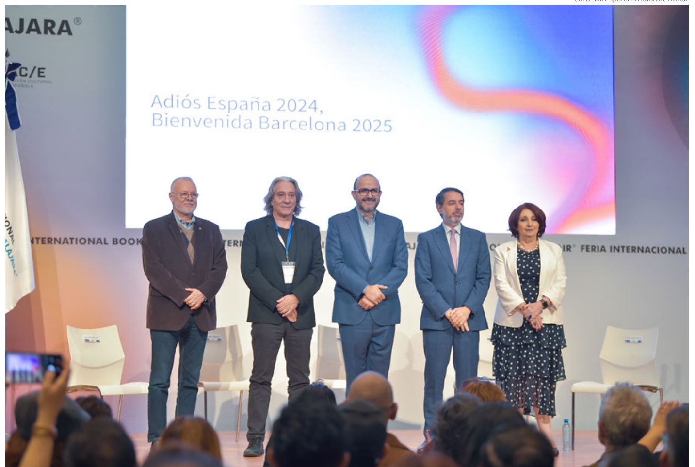
El próximo año en la FIL, Barcelona explorará temas como bilingüismo en la cultura anunciaron en el cambio de estafeta de la FIL.

naut, directora general de la Feria, los fines de semana han sido verdaderamente impresionantes, así que muchas de las cifras seguramente recibirán incrementos. Sin embargo, aún sin conocer las cifras del último día, le pareció perceptible que la feria ha sido todo un éxito.