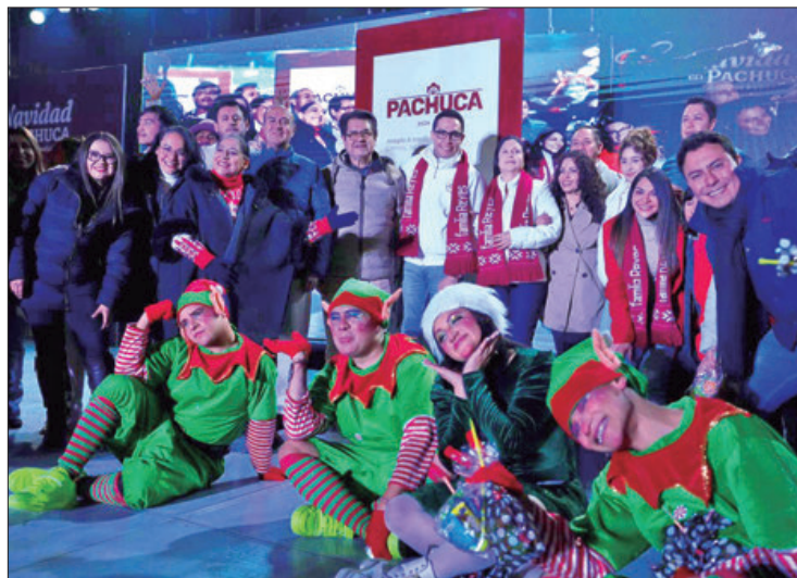
ALTERNATIVA. En la Plaza Independencia de Pachuca se cuenta con el principal atractivo que es la pista de patinaje gratuita, el árbol navideño, bazar de venta de artículos de temporada.

En la Plaza Independencia de Pachuca se cuenta con el principal atractivo que es la pista de patinaje gratuita, el árbol navideño, bazar de venta de artículos de temporada, puestos de comida tradicional, entre otras atracciones que estarán vigentes desde el presente fin de semana y hasta el próximo 7 de enero.