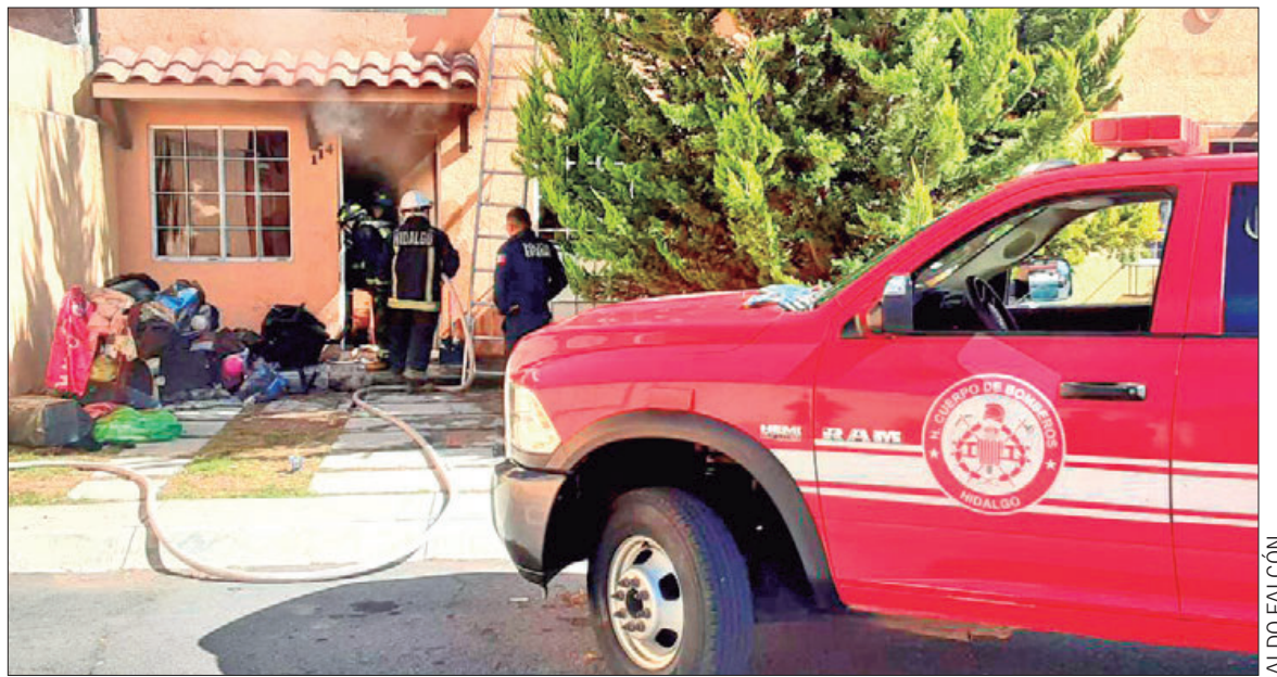
Elementos de bomberos del estado sofocaron un incendio que se originó dentro de un domicilio del fraccionamiento Real Toledo, el cual dejó considerables pérdidas materiales. Hasta el momento se desconoce las causas de la conflagración.

■ Los industriales estatales afirman que cuentan con el recurso presupuestado para la gratificación anual 4