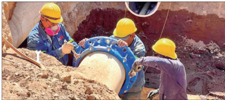
HERRAMIENTAS. En esta sexta intervención se contó con la ayuda de nueva tecnología, tras realizar el diagnóstico por medio del robot ROVVER X.

Esto con el objetivo de garantizar una correcta instalación del