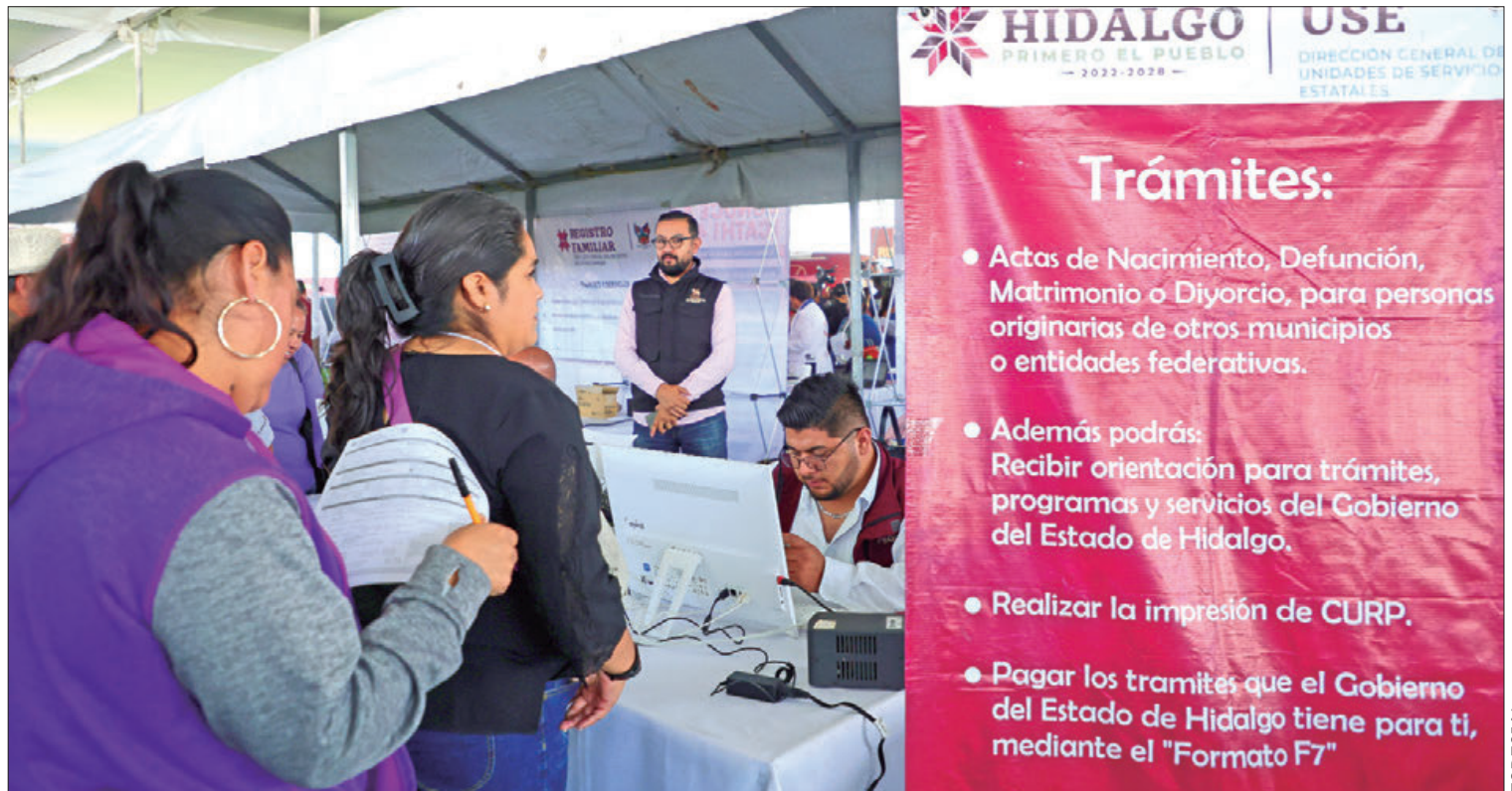
SEDES. Es el turno de Huichapan, Nopala y Tecozautla, para el regreso de las Rutas de la Transformación.

Con la nueva administración estatal se registra una dinámica de trabajo, ya que se trabaja de lunes a domingo en la Secretaría de Turismo, se atienden audiencias a las ocho de la noche. (Alberto Quintana Codallos)