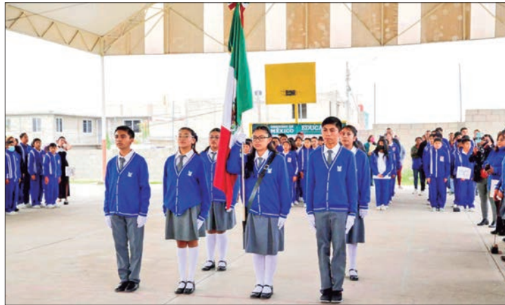
CALENDARIO. El periodo vacacional de invierno será del 19 de diciembre de 2024 y concluye el 8 de enero de 2025.

Respecto al periodo de preinscripción a preescolar, primer gra-