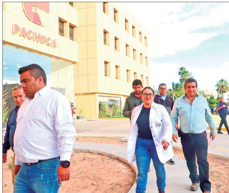
DICIEMBRE 17. Tras encabezar la presentación del Plan Nacional Hídrico en la región del Valle del Mezquital y durante el recorrido en la Feria de Servicios en las Rutas de la Transformación, Menchaca tuvo un mareo que provocó la movilización de cuerpos médicos y el traslado al Hospital Español en la capital hidalguense.

Luego, en escueta conferencia de prensa, la titular de la Secretaría de Salud, Juana Escalante, informó que por la "jornada laboral extenuante", el gobernador tuvo un "desvanecimiento derivado de un descontrol", de