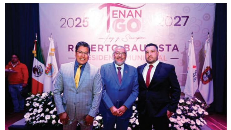
El secretario general de Gobierno Horacio Duarte Olivares, junto a los alcaldes de Tenango del Valle y Atizapán, refuerza el compromiso con las mesas de seguridad en 2025.

Las autoridades estatales consideran que el trabajo conjunto será fundamental para reducir los índices delictivos y fortalecer la paz social en los municipios mexicanos. (Diego Araiza)