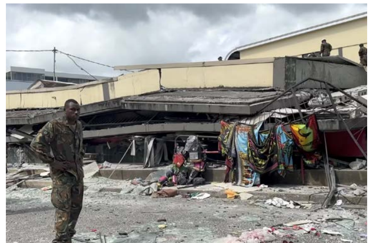
Soldados buscan víctimas bajo los escombros de edificios en Port Vila

Las embajadas de Estados Unidos y Nueva Zelanda publicaron sendos comunicados en los que informan que sus sedes diplomáticas en Port Vila ha sufrido "daños considerables" y que "está cerrada" hasta próximo aviso.