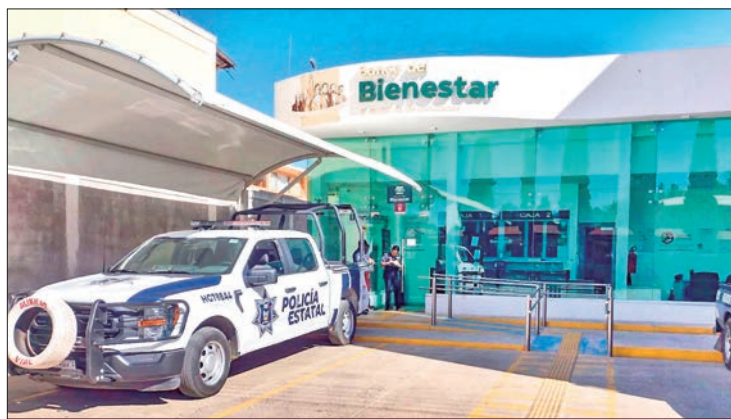
HECHOS. Se registró un intento de robo a un cajero automático del Banco del Bienestar hace un par de semanas.

Anticiparon que desde hace algunas semanas se mantiene la advertencia del incremento de la inseguridad en la región y a pesar de ello los llamados de auxilio