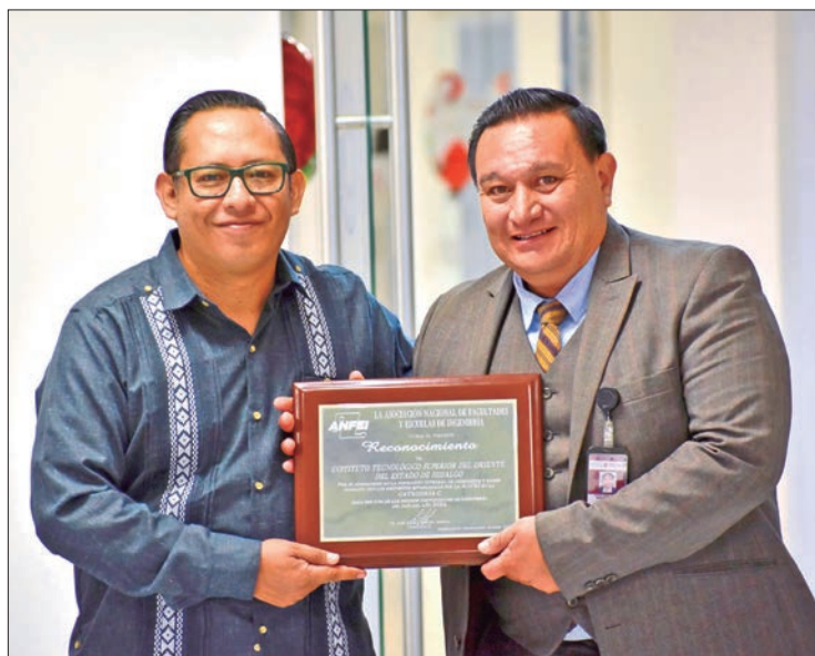
IMPORTANCIA. Por segundo año consecutivo, esta institución hidalguense ha sido reconocida como una de las Mejores Instituciones de Ingeniería del País.

Cabe señalar que, por segundo año consecutivo, esta institución hidalguense ha sido reconocida como una de las Mejores