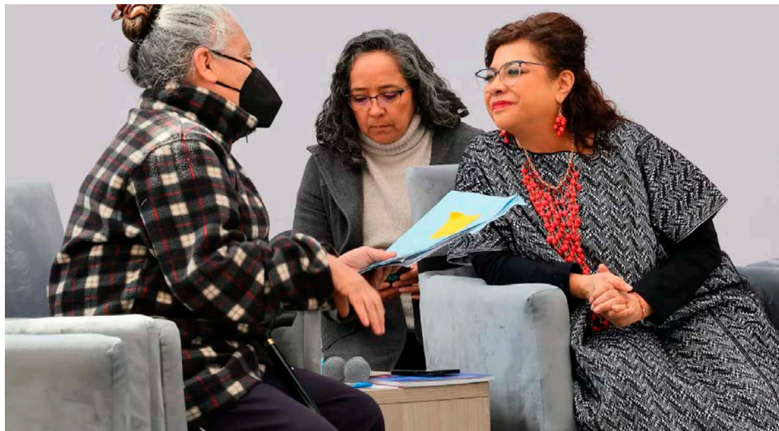
La jefa de Gobierno, Clara Brugada, atendió a la ciudadanía.

Durante la jornada, la mandataria estuvo acompañada por titulares de las dependencias del Gobierno capitalino, quienes ofrecieron orientación y so-