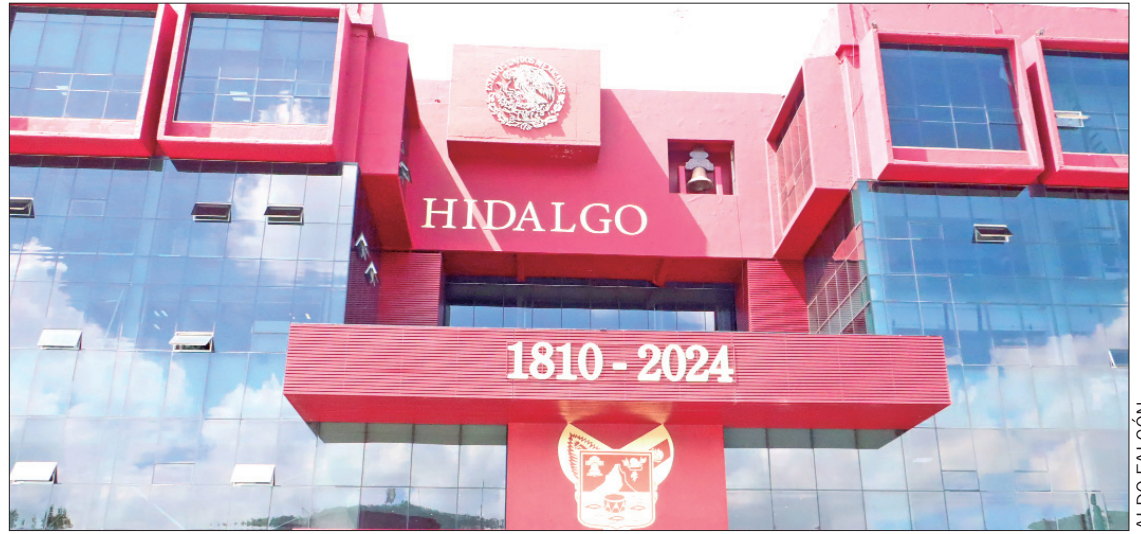
HECHOS. La empresa fue contratada por el gobierno de Hidalgo para dotar del seguro catastrófico que hasta octubre todavía no cumplía.

En caso de que, el día que cumpla el lapso de inhabilitación la empresa Seguros Sura, S.A. de C.V. no haya pagado la multa im-