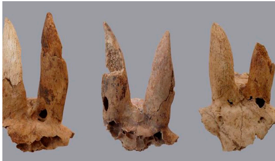
Los cuernos deformados.

Hieráconopolis, también conocida como Nekhen, es un si-