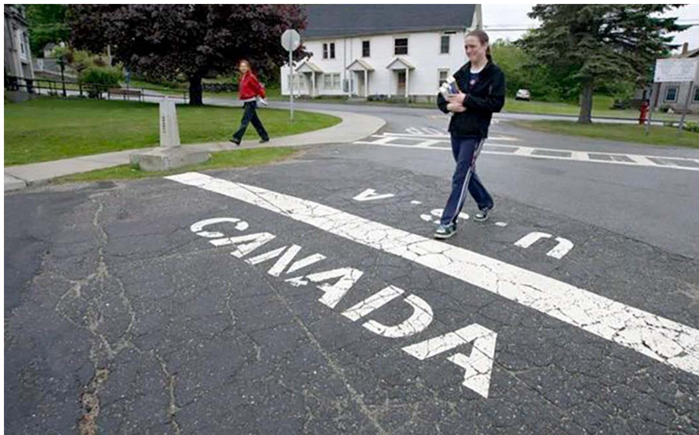
La frontera entre Canadá y Estados Unidos es la más larga del mundo sin militarizar

Detrás de este vuelco en la estrategia para contener el chantaje arancelario de Trump está el nuevo ministro de Seguridad Pública de Canadá, Dominic LeBlanc,